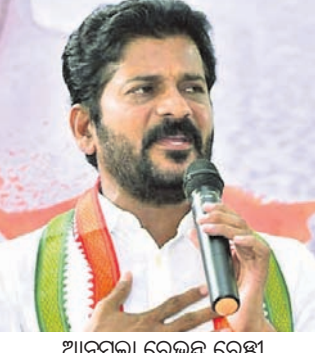
ଆନୁମୂଳା ରେଭନ୍ୟୁ ରେଞ୍ଜୀ

କେ.ସି. ବେଣ୍ଟଗୋପାଳ ଓ ଅନ୍ୟମାନେ ଯୋଗଦେଇଥିଲେ। ଏହା ପରେ ହାଇଦ୍ରାବାଦରେ କଂଗ୍ରେସ ବିଧାୟକ ଦଳ ବୈଠକ ବସିବା ପରେ ମୁଖ୍ୟମନ୍ତ୍ରୀଙ୍କ ନାମ ଘୋଷଣା କରାଯାଇଛି। ରେଭନ୍ୟୁ ଆସନ୍ତା ଗୁରୁବାର ପୂର୍ବାହ୍ନ ୧୧ଟାରେ ନୂଆ ମୁଖ୍ୟମନ୍ତ୍ରୀ ଭାବେ ଶପଥ ନେବେ ବୋଲି ବେଣ୍ଟଗୋପାଳ ଏକ ଖବରଦାତା ସମ୍ବଳନାରେ ଘୋଷଣା ପୃଷ୍ଠା-୨