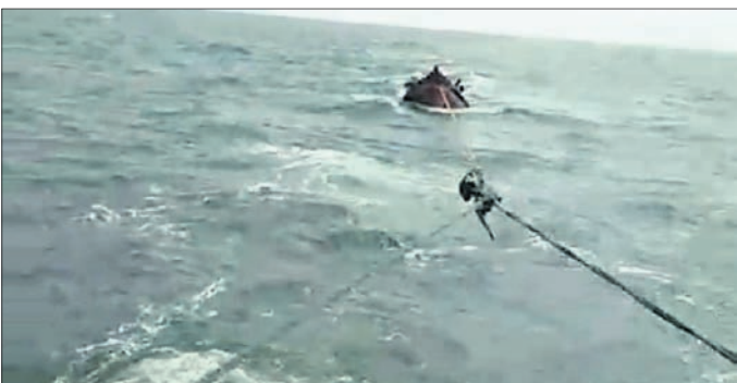
ସମୁଦ୍ରରେ ବୁଡ଼ି ଯାଇଥିବା ମା' ରାମଚଣ୍ଡୀ ମାଛଧରା ବୋଟକୁ ଅନ୍ୟ ଏକ ବୋଟ କୁକୁ ଚାରିକି ଆଣୁଛି ।

ରାଜନଗର, ୫୧୨ (ଭାସ୍କର ରାଉତରାୟ) ପ୍ରବେଶ ଉପରେ ରୋକ ଲଗାଇବା ପାଇଁ ନିଷ୍ପତ୍ତି ହୋଇଥିଲା । ଭିତରକନିକା ଜାତୀୟ ଉଦ୍ୟାନର ପ୍ରବେଶ ପଥ ତାଳମାଳ, ଖୋଲା ଓ ଗୁମ୍ଫା ଏଣ୍ଟ୍ରି ପଏଣ୍ଟରେ ଲୋକଙ୍କୁ ସତରତ କରାଯିବା ସହ ପ୍ଲାଷ୍ଟିକ୍ ପାଣି ବୋତଲ ପିଛା ପର୍ଯ୍ୟଟକଙ୍କଠାରୁ ୫୦ ଟଙ୍କା ଲେଖାଏ ରଖାଯିବ । ବୋତଲ ଫେରାଇଲେ ଏହି ଅର୍ଥ ଫେରସ୍ତ କରାଯିବ । ପାଇଁ ନିଷ୍ପତ୍ତି ହୋଇଥିଲା । ଏଥିପାଇଁ ବନ ବିଭାଗ ପକ୍ଷରୁ ସ୍ୱତନ୍ତ୍ର ଭାବେ ଏକ ଟୋକନ ପ୍ରସ୍ତୁତ କରାଯାଇଛି । ମଙ୍ଗଳବାରଠାରୁ ଗୁମ୍ଫାରେ ଆରମ୍ଭ ହୋଇଥିବା ଏହି ପ୍ରକ୍ରିୟାରେ ପର୍ଯ୍ୟଟକମାନେ ବୋଟରୁ ଯିବା ପାଇଁ ସେମାନଙ୍କ ଏଣ୍ଟ୍ରି ପରମିଟ୍ କାଟିବା ବେଳେ ସେମାନେ କେତୋଟି ପାଣି ବୋତଲ ନେଉଛନ୍ତି, ସେ ନେଇ ଟୋକନ ଦିଆଯାଇ ୫୦ ଟଙ୍କା ଲେଖାଏ ରଖାଯାଇଛି । ପର୍ଯ୍ୟଟକମାନେ ଏହି ପାଣି ବୋତଲକୁ ଫେରାଇବା ବେଳେ ଗୁମ୍ଫାରେ କିଏ ଅନ୍ୟ ଦୁଇଟି ଏଣ୍ଟ୍ରି ପଏଣ୍ଟରେ ପରମିଟ୍ କାଟିବା ବେଳେ ଦେଖାଇ ବୋତଲ ଓ ଟୋକନ ଫେରାଇଲେ ସେମାନେ ବ୍ୟବସ୍ଥା ହୋଇଛି । ଏପରିକି ପ୍ରତ୍ୟେକ ବୋଟରେ ତତ୍ତ୍ୱଦିନ ରଖିବାର ବ୍ୟବସ୍ଥା ହୋଇଛି । ପଲିଥିନ ବଦଳରେ କାଗଜ ଓ କପଡ଼ା ବ୍ୟାଗ ବ୍ୟବହାର କରିବାକୁ ପର୍ଯ୍ୟଟକମାନଙ୍କୁ ବନ କର୍ମଚାରୀମାନେ ସତରତ କରୁଛନ୍ତି । ସମ୍ପୂର୍ଣ୍ଣ ନିୟମାବଳୀ ଡାହାଣରେ ଏହି ବ୍ୟବସ୍ଥା ମଙ୍ଗଳବାରଠାରୁ ଆରମ୍ଭ ହୋଇଛି ।