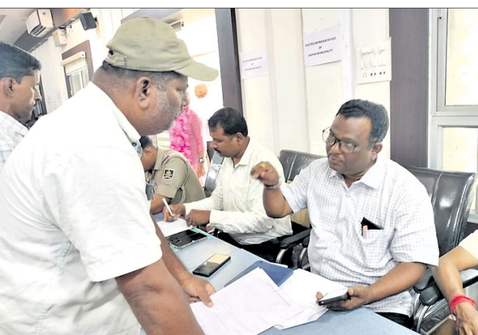
ଜିଲ୍ଲାପାଳଙ୍କ ଜନଶୁଣାଣୀରେ ଅଭିଯୋଗ କରାଯାଇଛି। ଆସିବାକୁ କୁସୁନପୁର, କଣ୍ଡିତର ଓ ଗୁଣ୍ଡୁରିପଡ଼ା ଲୋକଙ୍କର ସବୁଦିନିଆ ରାସ୍ତା ହୋଇପାରିବ। କିନ୍ତୁ ଏହି ରାସ୍ତାକୁ ଗ୍ରାମ୍ୟ

କାର୍ଯ୍ୟ ଅଧାପଡ଼ିଆ ହୋଇ ରହିଗଲା। ରାସ୍ତାଟି ଦୀର୍ଘ ୩୩ ବର୍ଷ ଧରି ଅଧାପଡ଼ିଆ ଅବସ୍ଥାରେ ପଡ଼ି ରହିବା ପରେ ସରକାର ତାହାକୁ ୨୦୧୧ରେ ପୂର୍ବ ବିଭାଗକୁ ହସ୍ତାନ୍ତର କରିଥିଲେ। ହେଲେ ଜମି ଅଧିଗ୍ରହଣ ନ କରାଯିବା ଦ୍ୱାରା ରାସ୍ତା କାର୍ଯ୍ୟ କରାଯାଇ ପାରୁନାହିଁ। ଫଳରେ ପ୍ରାୟ ୧୦ ବର୍ଷ ହେବ କୁସୁନପୁର ଓ ମିଶ୍ର ପୋଖରୀଠାରେ କେବଳ ବୁକ୍ସିଟି ସେବୁ ନିର୍ମାଣ ହୋଇପାରିଛି। ବହୁବାର ଅଞ୍ଚଳବାସୀଙ୍କ ପକ୍ଷରୁ ଏହି ରାସ୍ତା ନିର୍ମାଣ ପାଇଁ ଉକ୍ତ କର୍ତ୍ତୃପକ୍ଷଙ୍କ ନିକଟକୁ ଦାବିପତ୍ର ପଠାଯାଇଥିଲେ ମଧ୍ୟ ସେମାନଙ୍କ ଉଦାସୀନତା ଯୋଗୁଁ ରାସ୍ତାଟି ପୂର୍ଣ୍ଣାଙ୍ଗ ନ ହୋଇ ପରିତ୍ୟକ୍ତ ଅବସ୍ଥାରେ ପଡ଼ିରହିଛି। ଯେଉଁ ୨/୩କି.ମି. ରାସ୍ତା ନିର୍ମାଣ ହୋଇଛି, ତାହା ନିମ୍ନମାନର କାର୍ଯ୍ୟ ଯୋଗୁଁ ବିଭିନ୍ନ ସ୍ଥାନରେ ବଡ଼ବଡ଼ ଗର୍ଭ ସୃଷ୍ଟି ହୋଇଛି। ଅନେକ ସ୍ଥାନରେ ପିଚୁ ଉଠିଯିବାକୁ ଏହା ମଧ୍ୟ ଗମନାଗମନ ପାଇଁ କାଳକ୍ରମେ ଅନୁପଯୁକ୍ତ ଅବସ୍ଥାକୁ ଆସିଲାଣି।