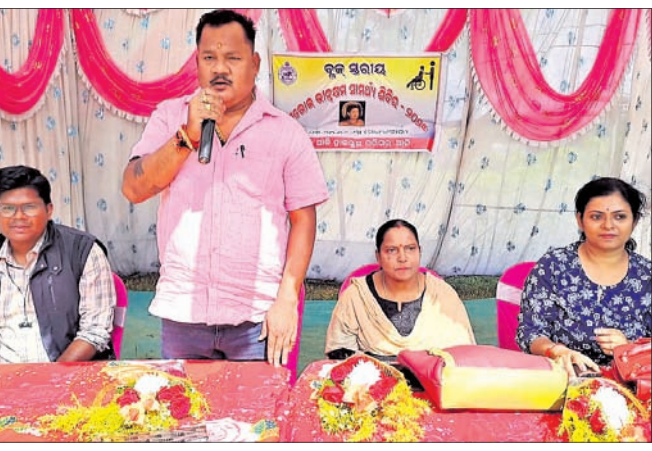
ଶିବିରରେ ଯୋଗଦେଇଥିବା ଅତିଥିମାନେ ।