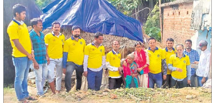
ସଂଗଠନ କର୍ମକର୍ତ୍ତା ଜଣେ ମହିଳାଙ୍କ ଘରେ ଜରିପାଳ ପକାଇଛନ୍ତି।