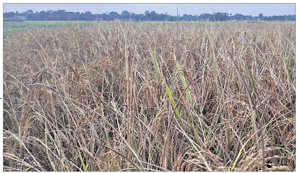
କ୍ଷେତରେ ପାଟିଲା ଧାନ।