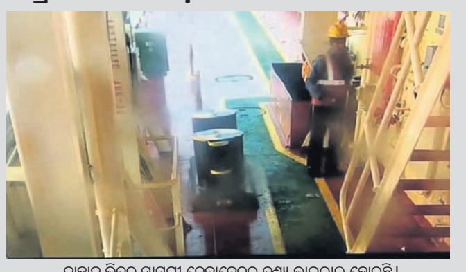
ଜାହାଜ ଭିତରୁ ସାମଗ୍ରୀ ନେବାବେଳର ଦୃଶ୍ୟ ଭାଇରାଲ ହୋଇଛି ।

୨୮ତାରିଖରେ କେବଳ ପ୍ରେସ୍ ରିଲିଫ ଜରିଆରେ ଜବତ ସମ୍ପର୍କରେ ସୂଚନା ଦେଇଥିଲେ । ତା' ପରଠାରୁ ଆଉ କୌଣସି ସୂଚନା ମିଳିନାହିଁ । ମଙ୍ଗଳବାର ଏ ସମ୍ପର୍କରେ ଯୋଗାଯୋଗ କରାଯାଇଥିଲେ ହେଁ କୌଣସି ପ୍ରତିକ୍ରିୟା ମିଳିନାହିଁ ।