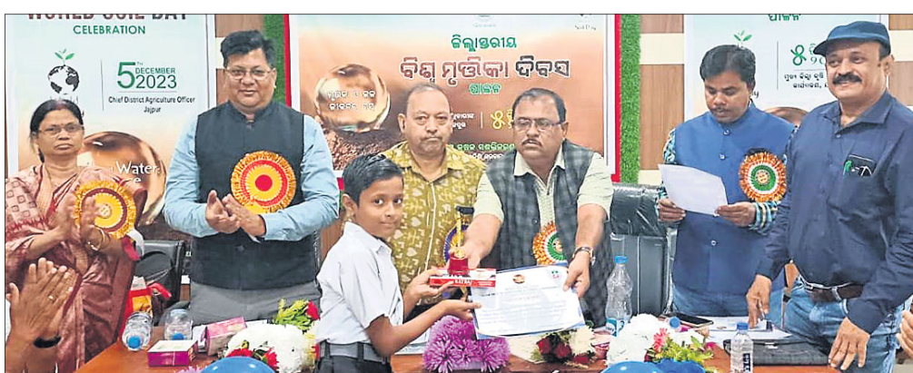
ବିଶ୍ୱ ମୃତ୍ତିକା ଦିବସରେ ଜଣେ ପ୍ରତିଯୋଗୀଙ୍କୁ ଟ୍ରଫି ଓ ପ୍ରମାଣପତ୍ର ପ୍ରଦାନ କରାଯାଇଛି।