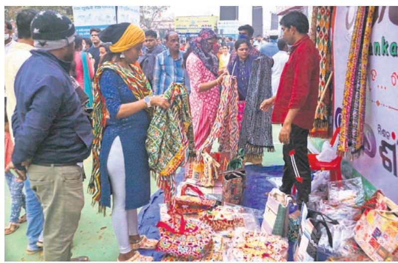
ବାଲିଯାତ୍ରା ପଡ଼ିଆ ପଲିଗ୍ରା ମେଳାରେ ମହିଳାମାନେ ଓଡ଼ିଶା କିଣୁଛନ୍ତି ।