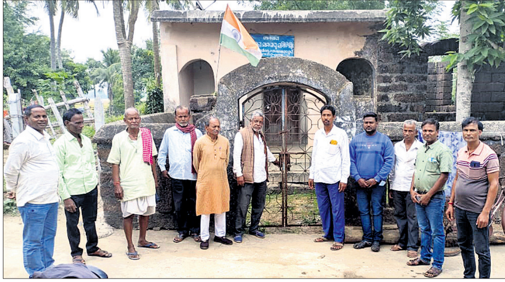
ଶ୍ୟାମାକାଳୀ ସମବାୟ ସମିତିରେ ସମ୍ପାଦକ ନିୟୁତ୍ତି ଦାବିରେ ଜନ ପ୍ରତିନିଧି ତାଲା ପକାଇଛନ୍ତି ।

କଟାସ ଅଧୀନ ଦେଇପୁର ଗ୍ରାମପଞ୍ଚାୟତର ତେଲେଙ୍ଗାପଡ଼ା ଗ୍ରାମରେ ଅବସ୍ଥାପିତ ଶ୍ୟାମାକାଳୀ ସମବାୟ ସମିତି ଲିମିଟେଡ଼ରେ ସମ୍ପାଦକ ନିୟୁତ୍ତି ନେଇ ମଙ୍ଗଳବାର ଜନପ୍ରତିନିଧିମାନେ ତାଲା ପକାଇ ଦେଇଛନ୍ତି।