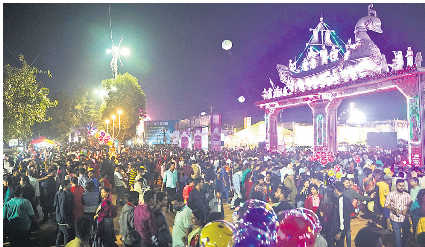
ମଙ୍ଗଳବାର ଶେଷ ରାତିରେ କଟକ ବାଲିଯାତ୍ରା ପଡ଼ିଆ ଲୋକାରଣ୍ୟ ।