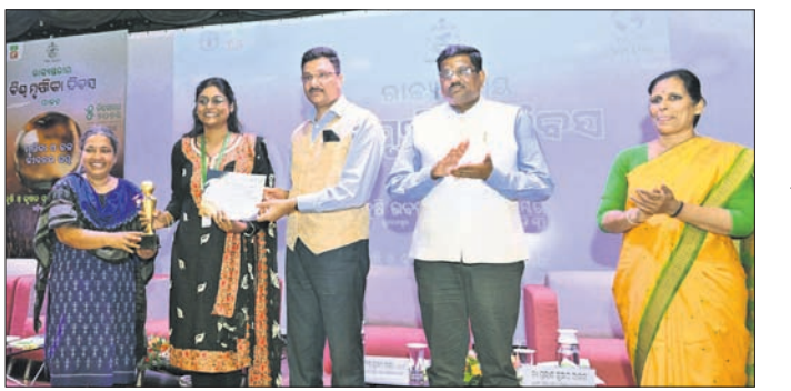
ଜଣେ କୃତୀ ପ୍ରତିଯୋଗୀଙ୍କୁ ଅତିଥି ପୁରସ୍କୃତ କରୁଛନ୍ତି।