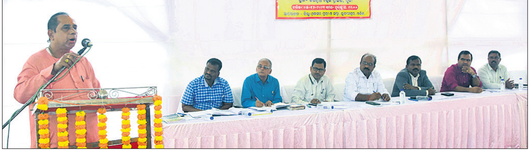
ଜନନାଥ ବଳଙ୍ଗାଠାରେ ଆୟୋଜିତ ଜନଶୁଣାଣିରେ ଉପସ୍ଥିତ ଶ୍ରୀବାଣ ନିର୍ମାଣ ଅଧିକାରୀ ।

ମହାପ୍ରଭୁଙ୍କୁ ଦର୍ଶନ କରିବାକୁ ଆସୁଥିବା ଯାତ୍ରୀଙ୍କ ସୁବିଧା ଓ ଶୁଣ୍ଠିକିତ ରାମନାଗମନ ପାଇଁ ପ୍ରଶାସନ ପକ୍ଷରୁ ବିଭିନ୍ନ ପଦକ୍ଷେପ ନିଆଯାଉଛି। ତେବେ ଭକ୍ତମାନଙ୍କ ସୁବିଧା ପାଇଁ ଶ୍ରୀବାଣ ନିର୍ମାଣ ବଳଙ୍ଗା ପାର୍ଟିଠାରୁ ଦୋଳବେଦି କୋଣ ପର୍ଯ୍ୟନ୍ତ ଏକ ରାସ୍ତା ନିର୍ମାଣ କରାଯାଉଛି। ଉକ୍ତ ରାସ୍ତାରେ ଭକ୍ତମାନେ ଆସିମହାପ୍ରଭୁଙ୍କୁ ଦର୍ଶନ କରିବେ। ଉକ୍ତ ରାସ୍ତାର ନାମ ଶ୍ରୀବାଣ ରଖାଯିବ ବୋଲି ସୂଚନା ମିଳିଛି। ପ୍ରସ୍ତାବିତ ଶ୍ରୀବାଣ ନିର୍ମାଣ ନେଇ ପ୍ରଭାବିତ ହେଉଥିବା ବୃତ୍ତନ୍ତାସାହି ଓ ବାଞ୍ଛିନାଳସାହି ବାସିନ୍ଦାଙ୍କୁ ନେଇ ପ୍ରଶାସନ ପକ୍ଷରୁ ଜନନାଥ ବଳଙ୍ଗାଠାରେ ମଙ୍ଗଳବାର ଉପସ୍ଥାପନ କରାଯାଇଛି। ସ୍ୱତନ୍ତ୍ର ପ୍ୟାକେଜ ମାଧ୍ୟମରେ ପ୍ରତି ପରିବାରକୁ ୫୦ଲକ୍ଷ ହେଉଥିବାବେଳେ ୧.୧୪୪୮ ଏକର ଘରୋଇ ଜମି ଅଧିଗ୍ରହଣ ହେବ। ତେଣୁ ଜନଶୁଣାଣିରେ ସେସମ୍ପର୍କରେ ମତାମତ ଗ୍ରହଣ କରାଯାଇଛି। ପ୍ରଭାବିତ ହେବାକୁ ଥିବା ଲୋକମାନେ ସରକାରଙ୍କଠାରୁ ସ୍ୱତନ୍ତ୍ର ପ୍ୟାକେଜ ମାଧ୍ୟମରେ କ୍ଷତିପୂରଣ ପାଇବା ନେଇ ପ୍ରସ୍ତାବିତ ଶ୍ରୀବାଣ ନିର୍ମାଣ ଲାଗି ୧.୧୪୪୮ ଏକର ଘରୋଇ ଜମି କରିଥିବାବେଳେ ପ୍ରକଳ୍ପର ସଫଳତା ପାଇଁ ଦାବିକରଣ ଉପରେ ସମାପ୍ତ କରାଯାଇ