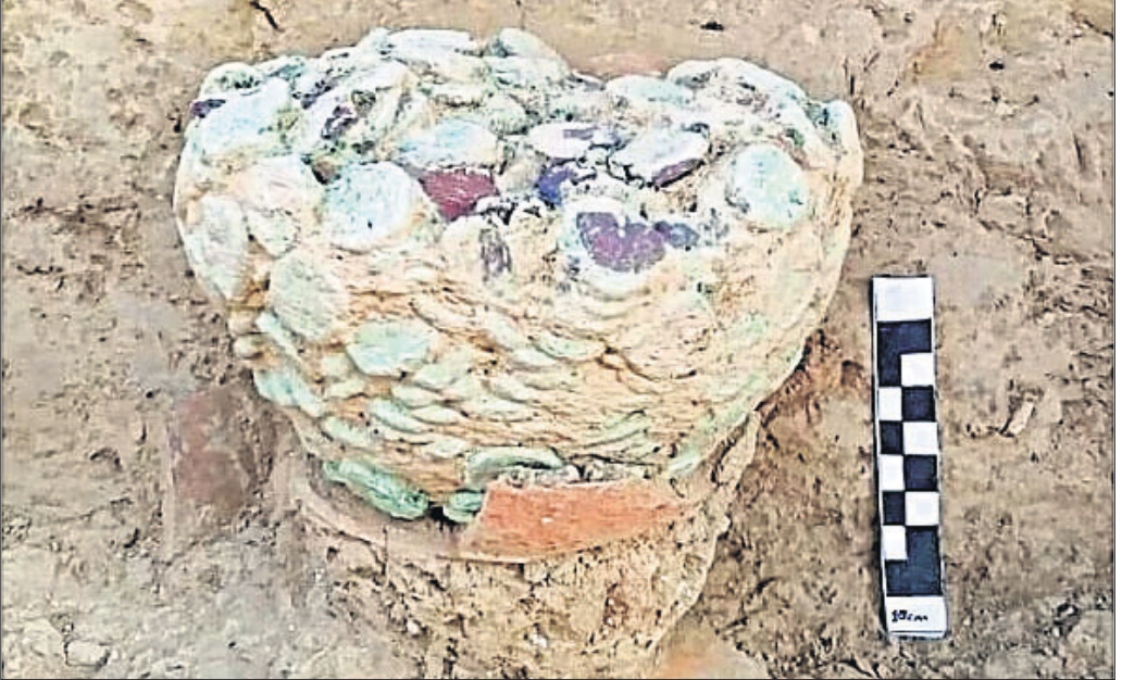
ଉତ୍କଳାମାତାଙ୍କ ପ୍ରତ୍ନତତ୍ତ୍ୱବିଦ୍ୱାନ୍ମାନଙ୍କଦ୍ୱାରା ମହେଞ୍ଜୋଦାରୋରୁ ମିଳିଥିବା ତମ୍ବାମୁଦ୍ରା ପାଇଁ ଫଟୋ ଗ୍ରହଣ କରାଯାଇଛି।

ଏପରି ବୌଦ୍ଧ ଚର୍ଚ୍ଚାସ୍ଥଳରୁ ମିଳିଥିବା ତମ୍ବାମୁଦ୍ରା ଉପରେ ଉପରୋକ୍ତ ମୁଦ୍ରା ମିଳିଛି, ଯାହା ମହେଞ୍ଜୋଦାରୋରୁ ମିଳିଥିବା ତମ୍ବାମୁଦ୍ରା ଉପରେ ଉପରୋକ୍ତ ମୁଦ୍ରା ମିଳିଛି।