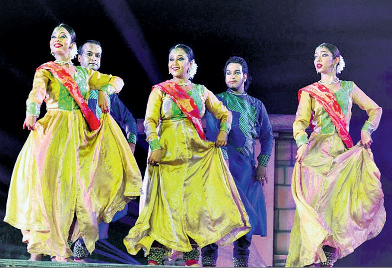
କଳାକାରମାନେ କଥକ ନୃତ୍ୟ ପରିବେଷଣ କରୁଛନ୍ତି ।