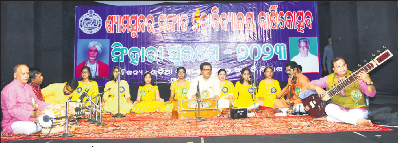
ଶ୍ୟାମସୁନ୍ଦର ସଙ୍ଗୀତ ମହାବିଦ୍ୟାଳୟର ବାର୍ଷିକ ଉତ୍ସବରେ କଳାକାରଙ୍କ ସଙ୍ଗୀତ ପରିବେଷଣ ।