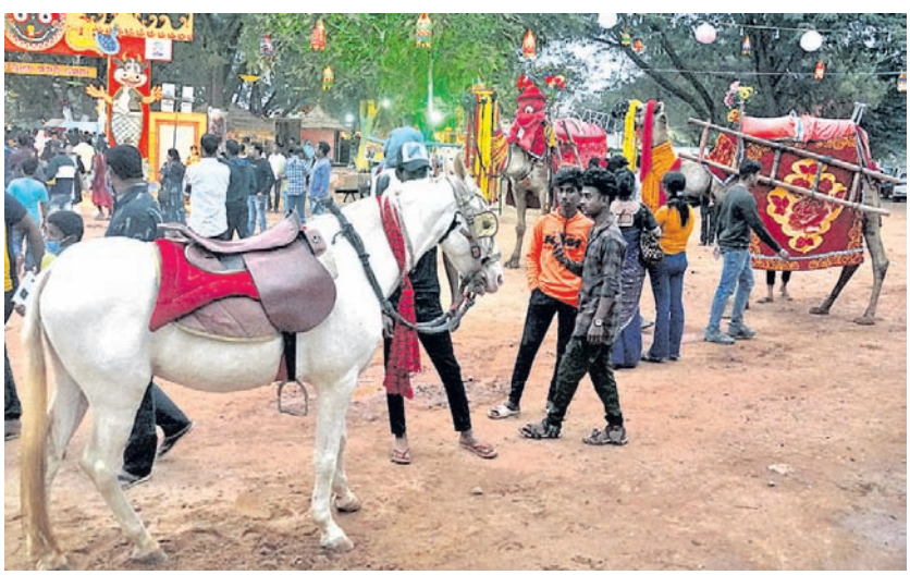
ବାଲିଯାତ୍ରା ପଡ଼ିଆ କଟକ ଇନ୍ କଟକ ପାଭିଲିୟନରେ ଓଟ ଓ ଘୋଡ଼ା ।