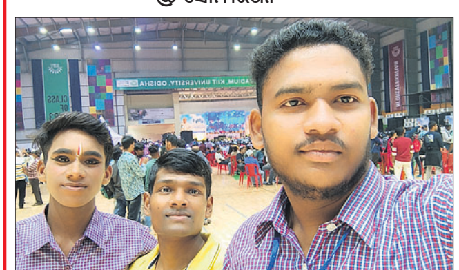
@ ଡି. ମାଝି

ସେଲ୍ଫି ପଠାଇବା ସମୟରେ ନିକର ନାମ ଏବଂ ମୋବାଇଲ ନମ୍ବର ଦେବାକୁ ଭୁଲନ୍ତୁ ନାହିଁ । ଯୋଗ୍ୟ ବିବେଚିତ ପତ୍ର ପ୍ରକାଶ ପାଇବ ।