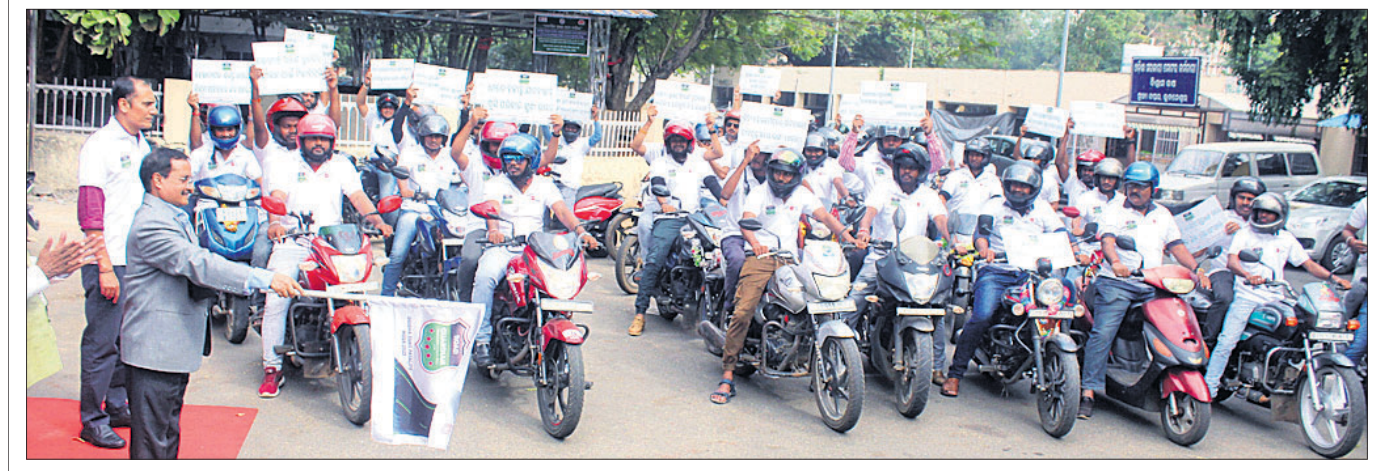
ଶୂନ୍ୟ ମୁଖ୍ୟ ସପ୍ତମ ପାଳନ ଅବସରରେ ସଚେତନତା ସୃଷ୍ଟି ପାଇଁ ମଙ୍ଗଳବାର ଭୁବନେଶ୍ୱର ଡିଏମ୍‌ଇଟି ବିଲ୍ଡିଂ ପରିସରକୁ ବାହାରିଥିବା ବାଇକ୍ ରାଲି ।