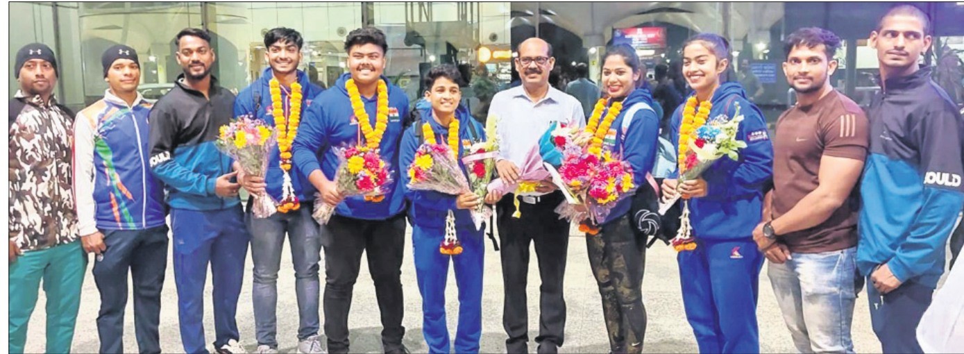
ନେପାଳରେ ଅନୁଷ୍ଠିତ ଦକ୍ଷିଣ ଏସୀୟ କ୍ରୀଡ଼ା ପ୍ରତିଯୋଗିତାରେ ପଦକ ବିଜୟୀ ଓଡ଼ିଶା ପ୍ରତିଯୋଗୀମାନଙ୍କୁ ମଙ୍ଗଳବାର ଭୁବନେଶ୍ୱର ବିମାନ ବନ୍ଦରରେ ରାଜ୍ୟ କ୍ରୀଡ଼ା ବିଭାଗର ଅଧିକାରୀ ଓ ସାଥୀ କରାଚେକାମାନେ ସାଗର କରୁଛନ୍ତି ।