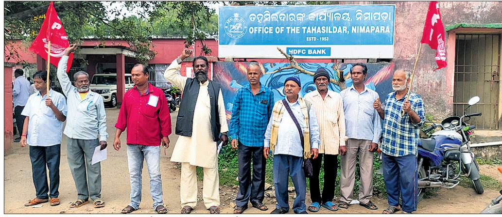
ତହସିଲ ଅଫିସ୍ ସମ୍ମୁଖରେ ସିପିଆଇ କର୍ମୀମାନେ ବିରୋଧ ପ୍ରଦର୍ଶନ କରୁଛନ୍ତି ।

ନିମାପଡ଼ା, ୫୧୧୨ (ବିଚିତ୍ରାନନ୍ଦ ସାହୁ/ରଞ୍ଜନ ପଟ୍ଟନାୟକ):