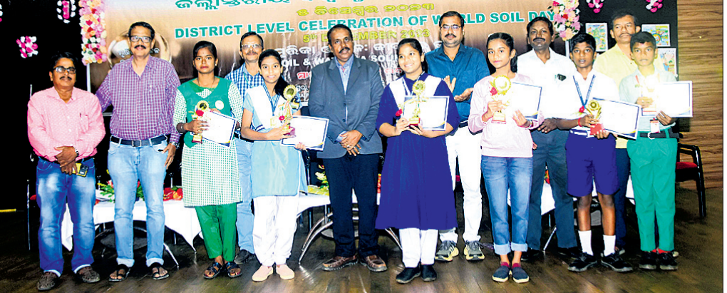
ଜିଲ୍ଲାସ୍ତରୀୟ ମୃତ୍ତିକା ଦିବସ ପାଳନ ଅବସରରେ ଅତିଥିଙ୍କ ଗହଣରେ କୃତୀ ଛାତ୍ରାଛାତ୍ରୀ ।