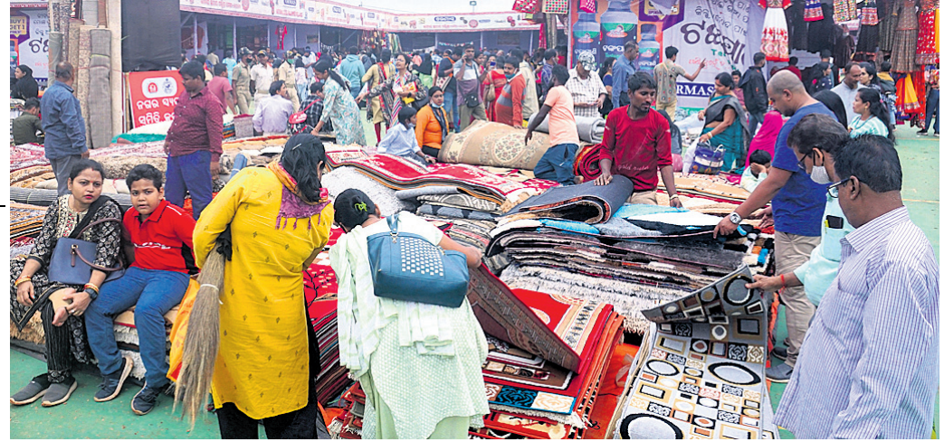
ପଲିଗ୍ରା ମେଳାରେ ଗୃହ ଉପକରଣ କିଣିବା ପାଇଁ ଗହକି ।

କଟକ, ୫।୧୨(ପୁସ୍ତକ ପ୍ରିୟବର୍ତ୍ତନୀ) ଦୀର୍ଘ ୯ ଦିନ ଧରି ପ୍ରବଳ ଜନସମାଗମ ମଧ୍ୟରେ ବାଲିଯାତ୍ରା ଐତିହାସିକ କଟକ ବାଲିଯାତ୍ରା ମଙ୍ଗଳବାର ଶେଷ ହୋଇଛି । ଶେଷ ଦିନରେ ବାଲିଯାତ୍ରାର ଉପର ଓ ଚଳପଡ଼ିଆ ଲୋକାରଣ୍ୟ ହୋଇଥିଲା । ଚଳିତବର୍ଷ ବାଲିଯାତ୍ରାରେ ୧,୪୦୦ରୁ ଅଧିକ ଷ୍ଟଲ ପଡ଼ିଥିବାବେଳେ ଉତ୍ସାହ ପକ୍ଷରୁ ୪୦୦ରୁ ଊର୍ଦ୍ଧ୍ୱ ଷ୍ଟଲ