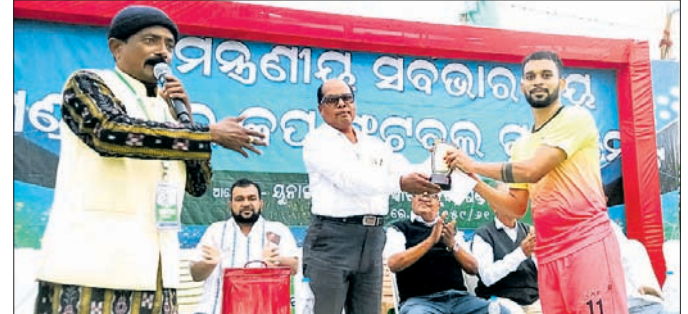
ଅତିଥିଙ୍କ ଠାରୁ ଜଣେ ଖେଳାଳି ପୁରସ୍କାର ଗ୍ରହଣ କରୁଛନ୍ତି।