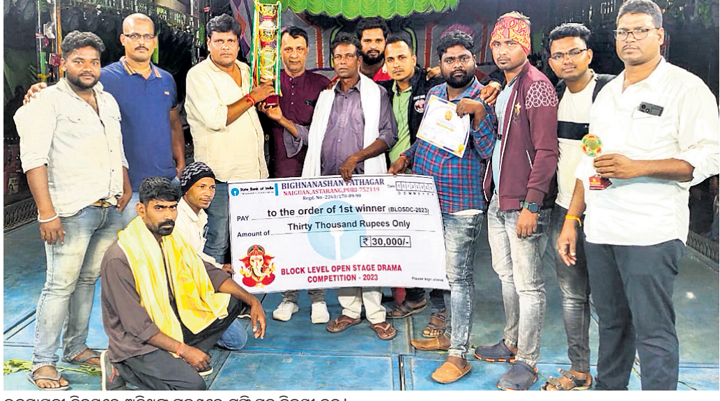
ଉଦ୍‌ଘାଟନା ଦିବସରେ ଅତିଥିଙ୍କ ଗହଣରେ ବ୍ରତୀ ସହ ବିଜୟା ଦଳ ।

ପବିତ୍ର କାର୍ତ୍ତିକ ପୂର୍ଣ୍ଣିମା ଅବସରରେ ପୁରୀ ଜିଲ୍ଲା ଅସ୍ତରଙ୍ଗ ବ୍ଲକ୍ ନିୟୁତ୍ତିପାଠରେ ଚାଲିଥିବା ମୁକ୍ତମଞ୍ଚ ନାଟକ ପ୍ରତିଯୋଗିତା ମଙ୍ଗଳବାର ଉଦ୍‌ଘାଟିତ ହୋଇଯାଇଛି।