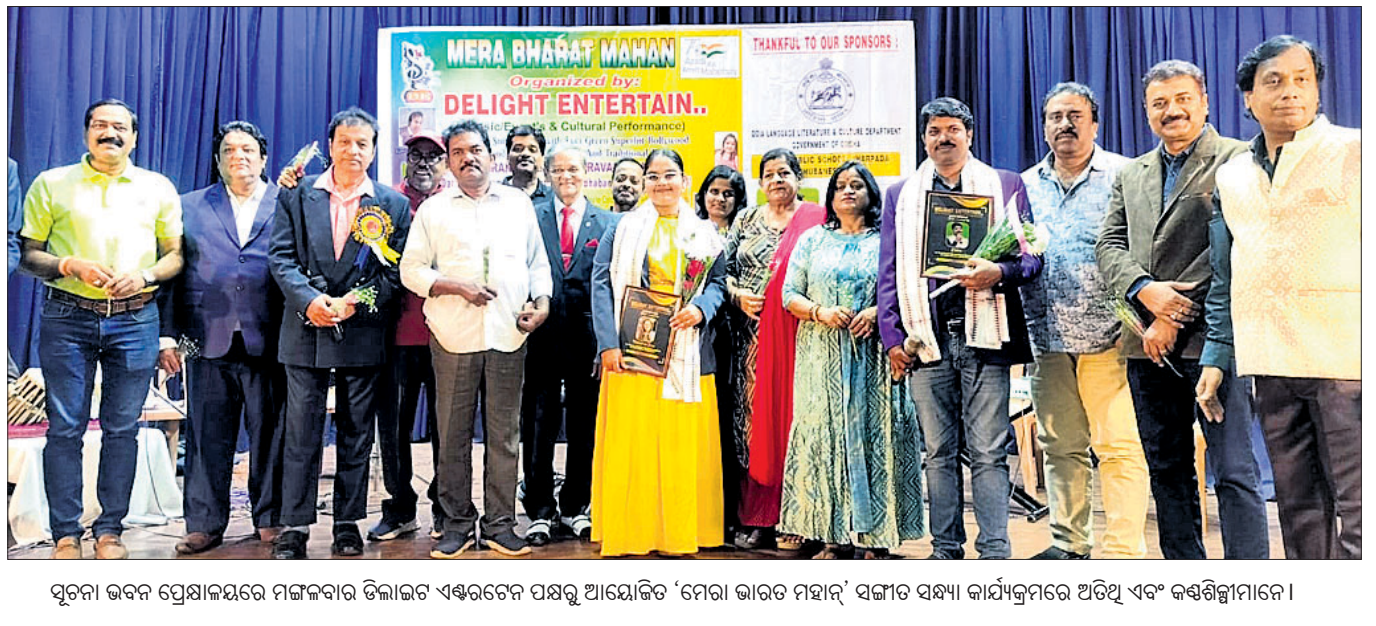
ସୂଚନା ଭବନ ପ୍ରେକ୍ଷାଳୟରେ ମଙ୍ଗଳବାର ଡିଲାଲଟ ଏକ୍ସପ୍ରେସନ ପକ୍ଷରୁ ଆୟୋଜିତ ‘ମେରା ଭାରତ ମହାନ’ ସଙ୍ଗୀତ ସନ୍ଧ୍ୟା କାର୍ଯ୍ୟକ୍ରମରେ ଅତିଥି ଏବଂ କର୍ମଶିଳ୍ପୀମାନେ।