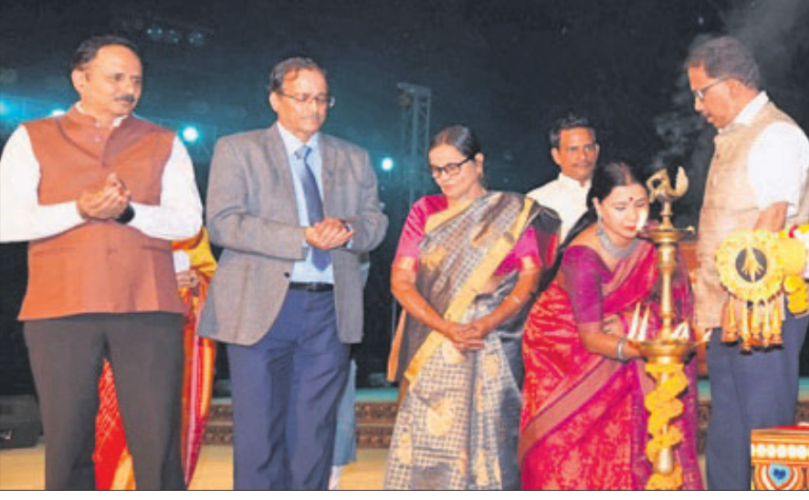
ଉତ୍ସବରେ ଯୋଗ ଦେଇଥିବା ଅତିଥିମାନେ ।