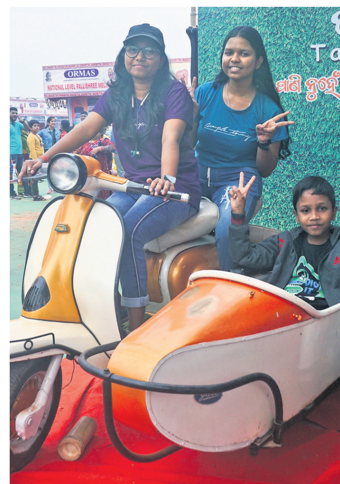
ବାଲିଯାତ୍ରା ପଲିଗ୍ରା ମେଳା ଷ୍ଟଲ ପାର୍ଶ୍ୱରେ ଥିବା ଲାମ୍ପୋଟା ସ୍ତୁରରେ ବସି ଯୁବତୀମାନେ ମଜା ନେଉଛନ୍ତି ।