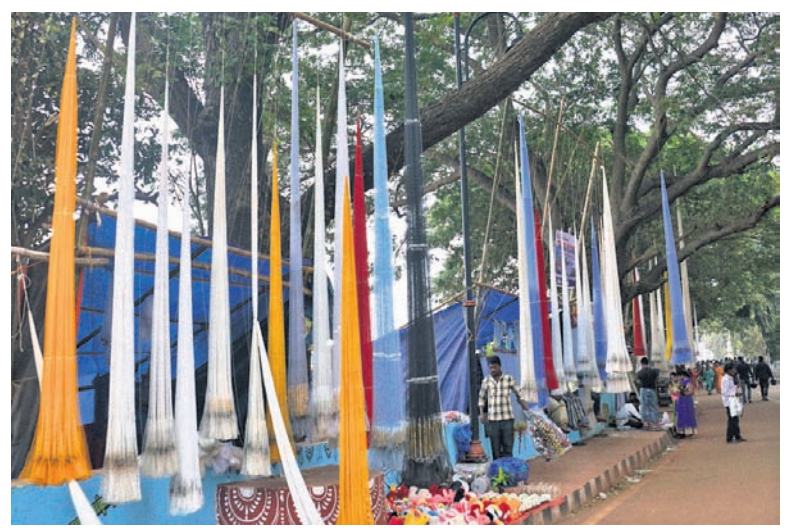
ବାଲିଯାତ୍ରା ଚଳପଡ଼ିଆ ରାସ୍ତାପାର୍ଶ୍ୱରେ ବିକ୍ରି ପାଇଁ କୋଇଳାଚାରୁ ଆସିଥିବା ମାଛ ବାଲ ।