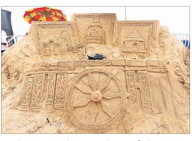
ଜଣେ ଶିଳ୍ପୀଙ୍କ ଦ୍ୱାରା ପ୍ରସ୍ତୁତ ଓଡ଼ିଶାର କଳା ସଂସ୍କୃତି ଉପରେ ପର୍ଯ୍ୟଟନ ବିଭାଗ କଳା ।