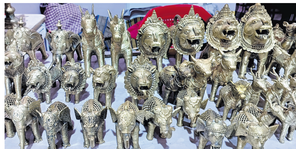
ବାଲିଯାତ୍ରା ଚଳପଡ଼ିଆ ମିଶନ ଶକ୍ତି ଷ୍ଟଲରେ ଥିବା ହସ୍ତକଳା ସାମଗ୍ରୀ ।

ପ୍ୟାଭିଲିୟନରେ ପୃଷ୍ଠି ହୋଇଥିବା ଗ୍ରାମ୍ୟ ପରିବେଶ ଦେଖିବାକୁ ଭୁଲି ନଥିଲେ । ସେଠାରେ କିଛି ସମୟ ଅଟକି ରହିବା ସହ ପରିବାର ସହ ସେଲୁ ଉଠାଇଥିଲେ । ଏହି ଅବସରରେ ବାଲିଯାତ୍ରାର ଗଣକବି ଦୈଷ୍ଟବ ପାଣି ମଞ୍ଚ ଏବଂ ଅକ୍ଷୟ ମହାନ୍ତି ମଞ୍ଚରେ ସାଂସ୍କୃତିକ ସହ ରଙ୍ଗାରଙ୍ଗ କାର୍ଯ୍ୟକ୍ରମ ଅନୁଷ୍ଠିତ ହୋଇଥିଲା । ଓଡ଼ିଶାର କଳା, ସଂସ୍କୃତି ଓ ପରମ୍ପରାର