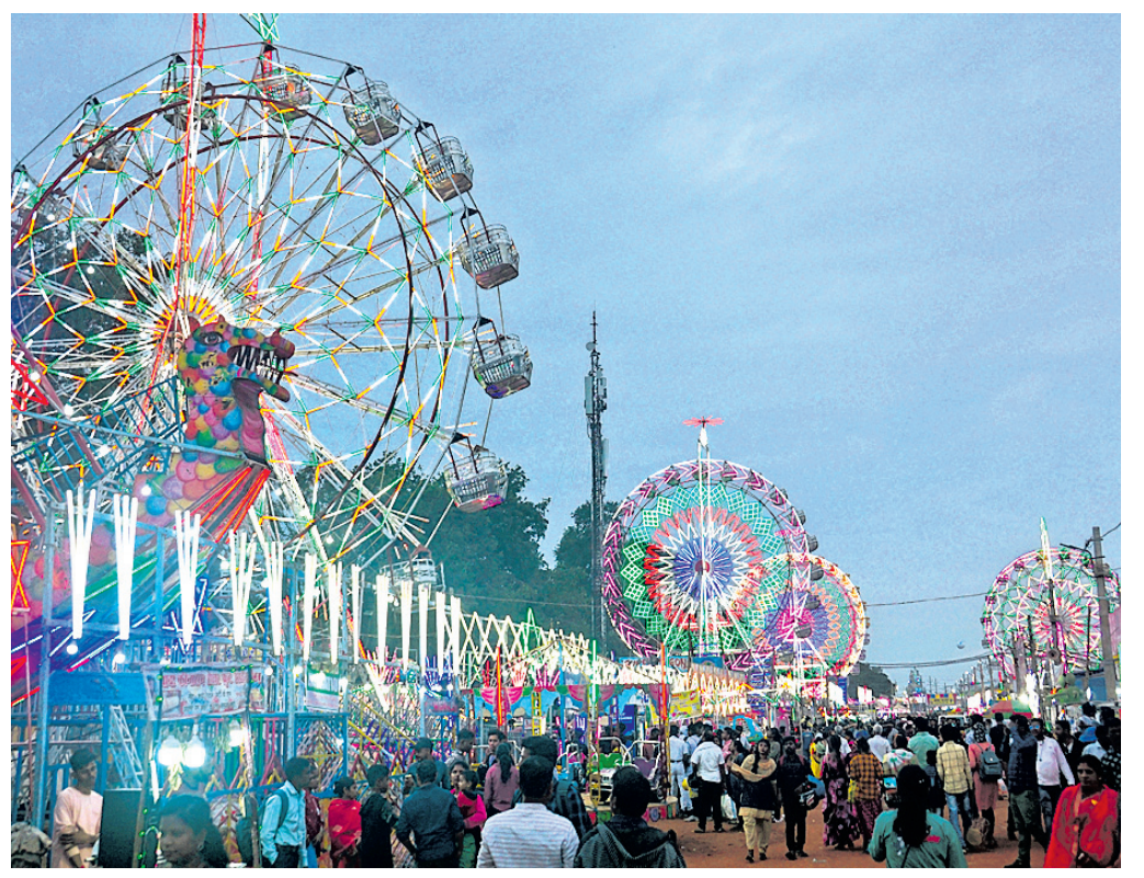
ବାଲିଯାତ୍ରାରେ ଆଲୋକମାଳାରେ ସଜିତ ଦୋଳି ।