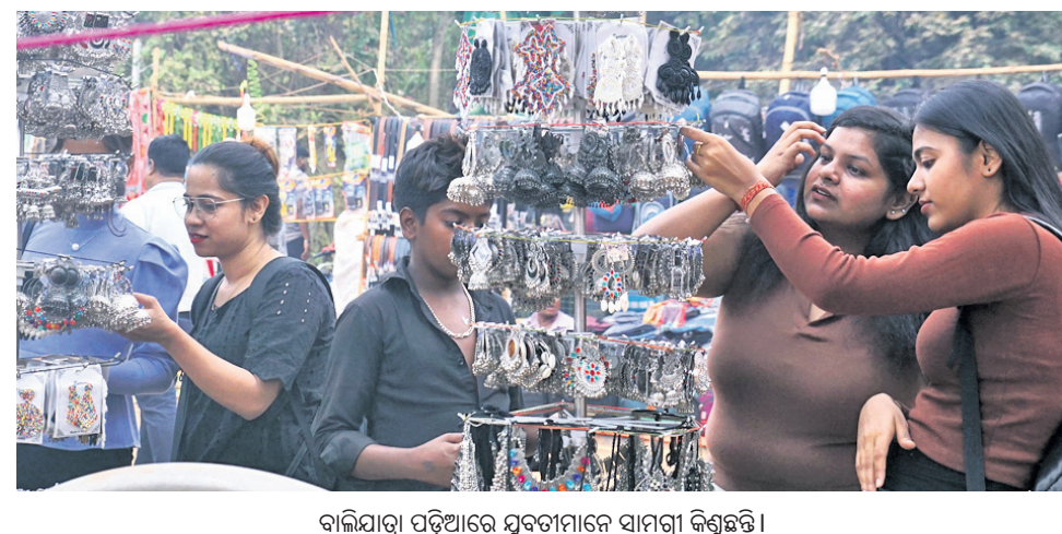
ବାଲିଯାତ୍ରା ପଡ଼ିଆରେ ଯୁବତୀମାନେ ସାମଗ୍ରୀ କିଣୁଛନ୍ତି ।