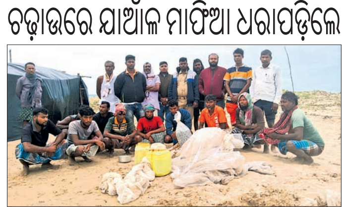
ଧରାପଡ଼ିଥିବା ଯାଆଁଳ ମାଫିଆ ଏବଂ ଜବତ କାଳ ।

ନିମାପଡ଼ା ଥାନା ପୋଲିସ୍ ପକ୍ଷରୁ ଗତ କିଛିଦିନ ହେଲା ଗାଡ଼ି ଚେକି କରାଯାଇଛି। ଏହି ଚେକି ବେଳେ ଅନାଦିଆ ବାଇକ୍ ଚାଳକଙ୍କ ବିରୋଧରେ କଡ଼ା କାର୍ଯ୍ୟାନୁଷ୍ଠାନ ଗ୍ରହଣ କରାଯାଇଛି।