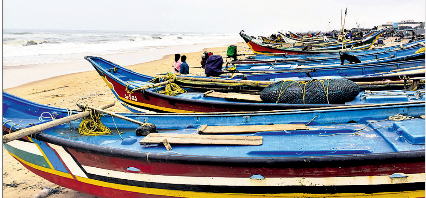
ବାଟ୍ୟା ମିଗକୋଇ ପ୍ରଭାବରେ ସମୁଦ୍ର ଅଶାନ୍ତ ରହିଥିବାରୁ ମାଛଧରା ଡକ୍ଟରାଗୁଡ଼ିକ ପୁରୀ ବେକାଭୁମିରେ ରଖାଯାଇଛି ।