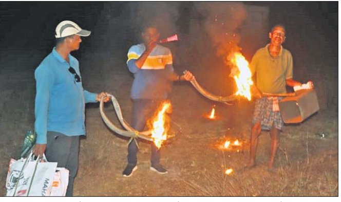
ବନ୍ୟପ୍ରାଣୀଙ୍କ ପୁହୁଁ ଫସଲ ବଞ୍ଚାଇବା ପାଇଁ ଗାଷୀମାନେ ରାତିରେ ନିଆଁ, ତିଶା ଓ ଫେଁକାଳିର ବ୍ୟବହାର କରୁଛନ୍ତି ।

କାମାକ୍ଷାନଗର, ୯।୧୨ (ଅମଳାବତ୍ତ ଖାନ) ରାତି ହେଲେ ଡାଉଁ ଡାଉଁ ବାଜୁଛି ତିଶା । ହୁଁ ହୁଁ ହୋଇ ଜୁଲୁଛି ଗାୟାର ନିଆଁ । ଫେଁକାଳିର ଫେଁ ପାଁ ଶବ୍ଦରେ କମ୍ପୁଛି ଗାଁ ପାଖ ଧାନ ଖେତ । ହାତୀ, ବାରୁଆ ଆଦି ଜଙ୍ଗଲୀ ପ୍ରାଣୀଙ୍କ ପୁହୁଁ ବର୍ଷକର ଫସଲ ବଞ୍ଚାଇବାକୁ ରାତି ଉଦ୍ଦାମରେ ହୋଇ ଏମିତି ଉଦ୍ଦାମ ଚଳାଇଛନ୍ତି ତେଜାନାଳ ଜିଲ୍ଲା କାମାକ୍ଷାନଗର ଓ କଳଡ଼ାହାଡ଼ ବ୍ଲକର ଅନେକ ଗାଷୀ । ବିଶେଷକରି ରାତିରେ ଫେଁକାଳିର ଦିଗଟାଳ ଶବ୍ଦ ଏ କ୍ଷେତ୍ରରେ ସେମାନଙ୍କୁ ଅଧିକ ସଫଳତା ଦେଇଥିବା ଗାଷୀମାନେ ପ୍ରକାଶ କରିଛନ୍ତି । ପ୍ରକାଶ ଯେ, କାମାକ୍ଷାନଗର ଉପଖଣ୍ଡ ଅଧୀନ କାମାକ୍ଷାନଗର ଓ କଳଡ଼ାହାଡ଼ ବ୍ଲକର ଜଙ୍ଗଲ ନିକଟ ଗାଁଗୁଡ଼ିକରେ ଜଙ୍ଗଲୀ ପ୍ରାଣୀଙ୍କ ବୌରାଗ୍ୟ ବର୍ଦ୍ଧିକରେ ଲାଗିଛି । ଏବେ ଫସଲ ଅପକା ରତ୍ନ ହୋଇଥିବାରୁ ବିଲରେ ପାରିଥିବା