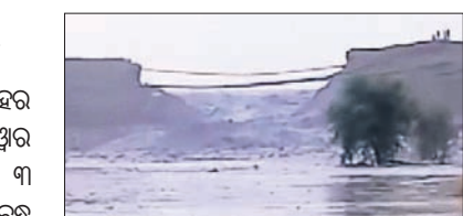
ଆର୍ଗ୍ରାପକ୍ସ ବନ୍ଦରେ ସୁଖି ହୋଇଥିବା ଘାଲ। ଶିବିରର ସମ୍ପର୍କୀତ ସମୟରେ ଓପିଜିସି ପ୍ଲାଣ୍ଟର ୩ ନମ୍ବର ପାର୍ଯ୍ୟଟୋଗାରୀ ବନ୍ଦରେ ହୋଇ ଏକ ଘାଲ ସୁଖି ହୋଇଥିଲା। ପ୍ରଥମେ ୧୦ଟୁଟୁ

ଖାରସୁରୁଡ଼ା ଜିଲ୍ଲା ଲାଖନପୁର ବ୍ଲକ୍ ବନହର ପାଲଟିରେ ଥିବା ଓପିଜିସି (ଓଡ଼ିଶା ପାଞ୍ଚାଳ ଜେନେରେଶନ କର୍ପୋରେଶନ) ପ୍ଲାଣ୍ଟର ୩ ନମ୍ବର ପାର୍ଯ୍ୟଟୋଗାରୀ (ଆର୍ଗ୍ରାପକ୍ସ) ବନ୍ଦ ଶିବିର ଭାଇଁପାଲୁଥିଲା। ଫକ୍ତରେ ପାର୍ଯ୍ୟଟୋଗାରୀ ପଶି ବନ୍ଦ ତଳପତରେ ଥିବା ଗ୍ରାମବାସୀଙ୍କ ଶତାଧିକ ଏକ ଧାନ ଓ ପିପିରିକା ଫସଲ ନଷ୍ଟ ହୋଇଯାଇଛି। ମିଲିଥିବା ସୂଚନା ଅନୁଯାୟୀ