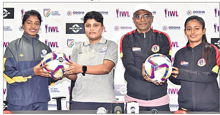
ଖବରବାଚା ସମ୍ମିଳନୀରେ ଉଭୟ ଦଳର ଅଧିନାୟିକା ଓ କୋଚ୍ ।

ଭୁବନେଶ୍ୱର, ୯।୧୨ (ସରୋଜ କୁମାର ଜେନା) ପରିବର୍ତ୍ତିତ ରୂପ ସହିତ ଇଷ୍ଟଆନ ଓମେନ୍ସ ଲିଗ୍‌ର ସପ୍ତମ ସଂସ୍କରଣ ଆରମ୍ଭ ହୋଇଥିବା ବେଳେ ରବିବାର ଇଷ୍ଟ ବେଙ୍ଗଲକୁ ଭେଟିବ