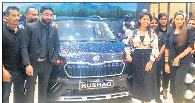
ଷୋଡ଼ାର ଏଲିଗାନ୍ସ ଏଡିଗନ ପଡେଲକୁ ଶିନିଆର ଭିନିଟି ଷୋଡ଼ା କଲେକ୍ସନରେ ଅନ୍ୟାନ୍ୟ କରାଯାଇଛି। ଏହି ପରିପ୍ରେକ୍ଷ୍ୟାରେ ଶୋଡ଼ା କମ୍ପାନୀର ଗ୍ରାହକମାନେ ଉପସ୍ଥିତ ଅଛନ୍ତି।

ଦେଶର ପ୍ରମୁଖ ଅଗୋପୋଇଲ କମ୍ପାନୀ ଷୋଡ଼ା ଅଗୋ ଇଣ୍ଡିଆର ବହୁ ପ୍ରତୀକ୍ଷିତ ତଥା ଅତ୍ୟାଧୁନିକ ଜ୍ଞାନକୌଶଳରେ ନିର୍ମିତ 'ଷୋଡ଼ାର ଏଲିଗାନ୍ସ ଏଡିଗନ'କୁ ନିକଟରେ ସର୍ବଭାରତୀୟସ୍ତରରେ ଉନ୍ମୋଚନ ସହ ଉଭୟ କୁଶାକ ଓ ସୁଭିଆ ମଡେଲର କ୍ଲାନ୍ କଲର ଗାଡ଼ିର ବଜାର ପ୍ରବେଶ ସମ୍ପର୍କରେ ଘୋଷଣା କରାଯାଇଛି। ବିଶେଷକରି କମ୍ପାନୀର ଅଗ୍ରଣୀ ମଡେଲ କୁଶାକ ଓ ସୁଭିଆର ସଫଳତା ପରେ ବ୍ରାଣ୍ଡ ଉନ୍ନତ ଏଡିଗନକୁ ବଜାର ପ୍ରବେଶ କରାଇଛି। ଏପରିକି ଷୋଡ଼ା କୁଶାକ