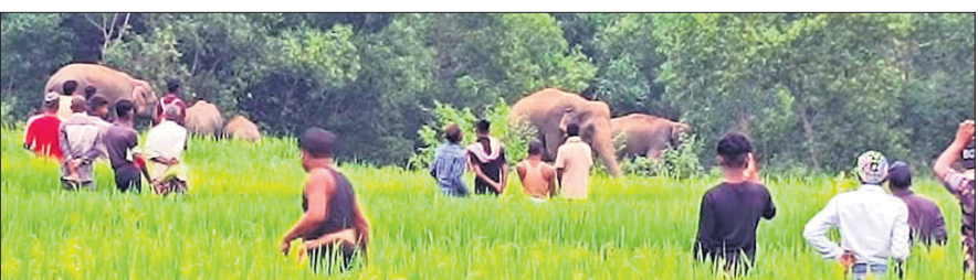
କେନ୍ଦୁଝରରେ ଶୁଣି ଏକ ଦିନରେ ଥିବା ହାତୀପଲ ଦେଖିବାକୁ ଲୋକଙ୍କ ଭିଡ଼ ଜମିଛି।

କେନ୍ଦୁଝର, ୯.୧୨ (ନବେଶ ଚନ୍ଦ୍ର ପଟ୍ଟନାୟକ) ହାତୀପଲ ଜଙ୍ଗଲକୁ ବାହାରି ଗାଁ ଗହଳରେ ସୁଲୁଲୁଟି ଅଧାଧରେ ରାତ୍ରୀ ପାର ହେଉଛନ୍ତି। ଫସଲ ନଷ୍ଟ କରୁଛନ୍ତି, ଘର ଭାଙ୍ଗୁଛନ୍ତି। ସହା କେନ୍ଦୁଝର ଜିଲ୍ଲାରେ ନିବେଦିତା ଘଟଣା ପାଲଟିଲାଣି। ଅପରପକ୍ଷେ ହାତୀ ଘଡ଼ାଢାଳା, ରାତ୍ରୀପାର ହେଲାବେଳେ କେନ୍ଦୁଝର ଦେଖିବାକୁ ଲୋକଙ୍କ ଭିଡ଼ ଜମୁଛି। ଗାଁ, ରାଜପଥରେ ବର୍ଷଟମା ହାତୀ ସୁଖି ସୁଖି କରୁଛି। ପ୍ରକାଶ ଯେ, ଜିଲ୍ଲାରେ ପାଖାପାଖି ଦେଖିବା ହାତୀ ବିଲିନ ଅଞ୍ଚଳରେ ପଲ ହୋଇ ସୁଲୁଲୁଟି। ଧନ କାବର ସୁରକ୍ଷା ପାଇଁ ଗ୍ରାମବାସୀ