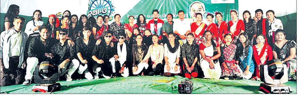
ସାଂସ୍କୃତିକ କାର୍ଯ୍ୟକ୍ରମରେ ସାମିଲ ହୋଇଥିବା ଛାତ୍ରଛାତ୍ରୀମାନେ।

ଦେଶାନ୍ତର, ୯୧୨ (ଉତ୍ତମ ନାୟକ) ମଧ୍ୟରେ ଅନୁଷ୍ଠିତ ଗୁଣକୁ ବିକଶିତ କରିବା ପାଇଁ ରାଜ୍ୟ ସରକାରଙ୍କ ଏହି ଅଭିନବ ପ୍ରୟାସରେ ଛାତ୍ରଛାତ୍ରୀମାନେ ସାମିଲ ହୋଇ ନଭେମ୍ବର ୨୫ ୨୯ ଓଡ଼ିଶା କାର୍ଯ୍ୟକ୍ରମରେ ଛାତ୍ରଛାତ୍ରୀମାନଙ୍କ ପକ୍ଷରୁ ଶୁକ୍ରବାର ସାଂସ୍କୃତିକ କାର୍ଯ୍ୟକ୍ରମ ଆୟୋଜିତ ହୋଇଥିଲା। ଛାତ୍ରଛାତ୍ରୀମାନଙ୍କ