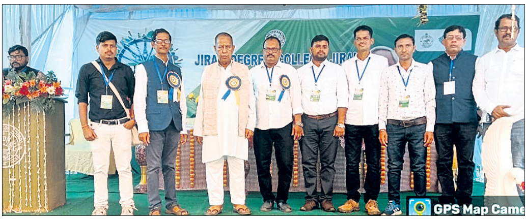
କାର୍ଯ୍ୟକ୍ରମରେ ରାଜ୍ୟ ଖଣି ମନ୍ତ୍ରୀଙ୍କ ସହ ଅନ୍ୟ ଅତିଥିମାନେ।

କାମାକ୍ଷାନଗର, ୯୧୨ (ସୁଧାଂଶୁ ପରିଡ଼ା) ଦେଶାନ୍ତର ଜିଲ୍ଲା ଜିରାକ ମହାବିଦ୍ୟାଳୟରେ ରାଜ୍ୟ ସରକାରଙ୍କ ଦ୍ୱାରା ଓଡ଼ିଶା, ଯୁବ ଓଡ଼ିଶା ନବୀନ ଓଡ଼ିଶା କାର୍ଯ୍ୟକ୍ରମ ଅନୁଷ୍ଠିତ ହୋଇଯାଇଛି। ମହାବିଦ୍ୟାଳୟ ଅଧ୍ୟକ୍ଷ ଶ୍ରୀମତୀ ସୁଧାଂଶୁ ପରିଡ଼ା ଆଦି ଅତିଥିମାନେ ଅଧିକାରୀଙ୍କୁ ଉଦ୍ୟାନ କୃଷି କର୍ମଶାଳା ଅନୁଷ୍ଠିତ ହୋଇଛି।