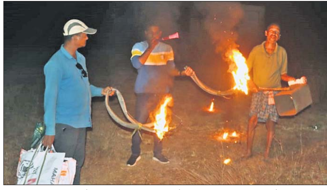
ବନ୍ୟପ୍ରାଣୀଙ୍କ ପୁହୁଁ ଫସଲ ବଞ୍ଚାଇବା ପାଇଁ ଗାଷୀମାନେ ରାତିରେ ନିଆଁ, ଚିଶା ଓ ଫେଁକାଳିର ବ୍ୟବହାର କରୁଛନ୍ତି।

ରାତି ହେଲେ ଭାଉଁ ଭାଉଁ ବାଜୁଛି ଚିଶା। ହୁ ହୁ ହୋଇ ଜଳୁଛି ଗାୟାର ନିଆଁ। ଫେଁକାଳିର ଫେଁ ପାଁ ଶବ୍ଦରେ କମ୍ପୁଛି ଗାଁ ପାଖ ଧାନ ଖେତ। ହାତୀ, ବାରୁଆ ଆଦି ଜଙ୍ଗଲୀ ପ୍ରାଣୀଙ୍କ ପୁହୁଁ ବର୍ଷକର ଫସଲ ବଞ୍ଚାଇବାକୁ ରାତି ଉଜାଗର ହୋଇ ଏମିତି ଉଦ୍ୟମ ଚଳାଇଛନ୍ତି ତେଜାନାଳ ଜିଲ୍ଲା କାମାକ୍ଷାନଗର ଓ କଳଡ଼ାହାଡ଼ ବ୍ଲକର ଅନେକ ଗାଷୀ। ବିଶେଷକରି ରାତିରେ ଫେଁକାଳିର ବିକଟ ଶବ୍ଦ ଏ କ୍ଷେତ୍ରରେ ସେମାନଙ୍କୁ ଅଧିକ ସମ୍ବଳିତା ଦେଉଥିବା ଗାଷୀମାନେ ପ୍ରକାଶ କରିଛନ୍ତି। ପ୍ରକାଶ ଯେ, କାମାକ୍ଷାନଗର ଉପଖଣ୍ଡ ଅଧୀନ କାମାକ୍ଷାନଗର ଓ କଳଡ଼ାହାଡ଼ ବ୍ଲକର ଜଙ୍ଗଲ ନିକଟ ଗାଁଗୁଡ଼ିକରେ ଜଙ୍ଗଲୀ ପ୍ରାଣୀଙ୍କ ବୌରାମ୍ୟ ବଢ଼ିବାରେ ଲାଗିଛି। ଏବେ ଫସଲ ଅମଳ ଚତୁର୍ଥ ହୋଇଥିବାରୁ ବିଲରେ ପାଡ଼ିଥିବା