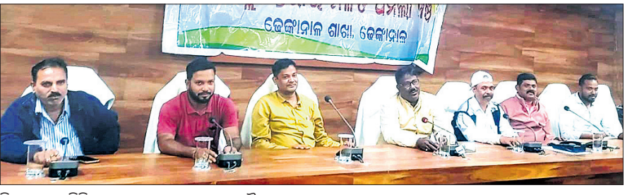
ଜିଲ୍ଲାପ୍ରଶାସନ ମିଳିତ ଅଫିସରମାନଙ୍କର ସାଧାରଣ ବୈଠକ