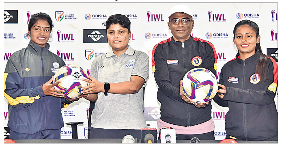
ଖବରବାଚା ସମ୍ମିଳନୀରେ ଉଭୟ ଦଳର ଅଧିନାୟିକା ଓ କୋଚ୍ ।

ଭୁବନେଶ୍ଵର, ୯।୧୨ (ସରୋଜ କୁମାର ଜେନା) ପରିବର୍ତ୍ତିତ ରୂପ ସହିତ ଇଷ୍ଟଆନ ଓମେନ୍ସ ଲିଗ୍‌ର ସପ୍ତମ ସଂସ୍କରଣ ଆରମ୍ଭ ହୋଇଥିବା ବେଳେ ରବିବାର ଇଷ୍ଟ ବେଙ୍ଗଲକୁ ଭେଟିବ