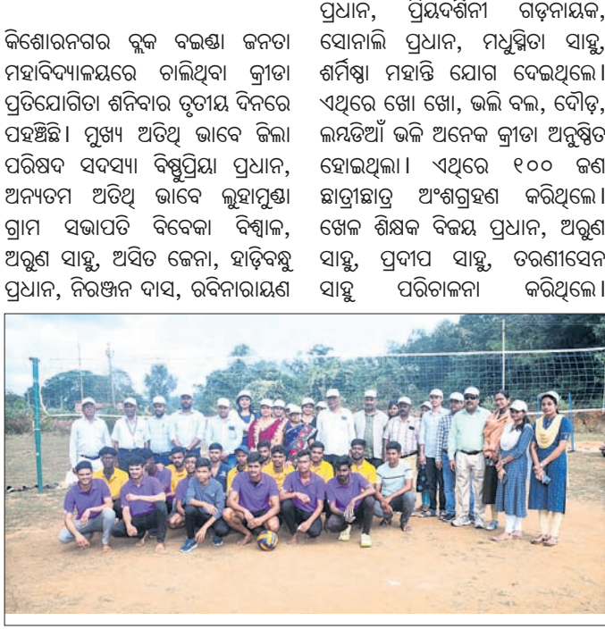
ଅତିଥିଙ୍କ ସହ ଭଲି ବଲ୍ ପ୍ରତିଯୋଗିତାରେ ଭାଗ ନେଇଥିବା ଖେଳାଳିମାନେ।