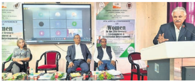
ସମ୍ମିଳନୀରେ ଉପସ୍ଥିତ ଅତିଥିମାନେ ।

ଓଡ଼ିଶା କେନ୍ଦ୍ରୀୟ ବିଶ୍ୱବିଦ୍ୟାଳୟର ପୁଷ୍ଟ୍ୟ କ୍ୟାମ୍ପସରେ 'ଏକଦିନ ଶତାବ୍ଦୀରେ ମହିଳା: ପରିବେଶ ଓ ନିରନ୍ତର ବିକାଶ' ଶୀର୍ଷକ ତିନିଦିନିଆ ଅନ୍ତର୍ଜାତୀୟ ସମ୍ମିଳନୀ ଶନିବାର ଉଦ୍‌ଘାଟିତ ହୋଇଯାଇଛି।