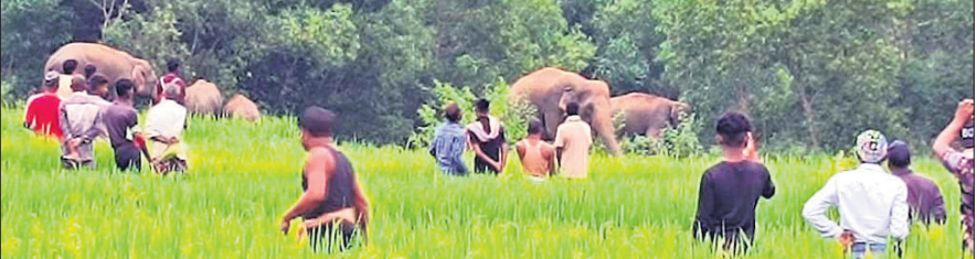
କେନ୍ଦୁଝର ରେଖା ଏକ ବିଲରେ ଥିବା ହାତୀପଲ ଦେଖିବାକୁ ଲୋକଙ୍କ ଭିଡ଼ ଜମିଛି।

କେନ୍ଦୁଝର, ୯.୧୨ (ନରେଶ ଚନ୍ଦ୍ର ପଟ୍ଟନାୟକ) ରେଖା ଏକ ବିଲରେ ଥିବା ହାତୀପଲ ଦେଖିବାକୁ ଲୋକଙ୍କ ଭିଡ଼ ଜମିଛି। ହାତୀପଲ ଜଙ୍ଗଲରୁ ବାହାରି ଗାଁ ଗହଳରେ ବୁଲୁଛନ୍ତି। ଅଧାଧର ରାତ୍ରୀ ପାର ହେଉଛନ୍ତି। ଫସଲ ନଷ୍ଟ କରୁଛନ୍ତି, ଘର ଭାଙ୍ଗୁଛନ୍ତି। ସହା କେନ୍ଦୁଝର ଜିଲ୍ଲାରେ ନିର୍ଦ୍ଦିଷ୍ଟ ଘଟଣା ପାଲଟିଲାଣି। ଅପରପକ୍ଷେ ହାତୀ ଘଡ଼ାଉଛନ୍ତି, ରାତ୍ରୀପାର ହେଲାବେଳେ ହାତୀପଲ ଦେଖିବାକୁ ଲୋକଙ୍କ ଭିଡ଼ ଜମିଛି। ଗାଁ, ରାଜପଥରେ ବର୍ଷତମାମ ହାତୀ ବୁଲୁଥିବାରୁ କେନ୍ଦୁଝର ଜିଲ୍ଲା ଏକ ପୁରାଣିକ ହାତୀ ସଫାରୀର ଭ୍ରମ ସୃଷ୍ଟି କରୁଛି। ପ୍ରକାଶ ଯେ, ଜିଲ୍ଲାରେ ପାଖାପାଖି ଦେଖିବା ହାତୀ ବିଲ ଅଞ୍ଚଳରେ ପଲ ହୋଇ ବୁଲୁଛନ୍ତି। ଧନ କାନ୍ଦର ସୁରକ୍ଷା ପାଇଁ ଗ୍ରାମବାସୀ