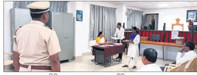
ଲୋକ ଅଦାଲତରେ ବିଭିନ୍ନ ମାମଲାର ଫାଇଁସଲା ଚାଲିଛି ।