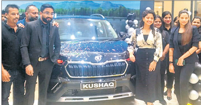
ଷୋଡ଼ାର ଏଲିଗାନ୍ସ ଏଡ଼ିଶନ ମଡେଲରୁ ଶିକାରୀ ଟ୍ରିନିଟି ଷୋଡ଼ା କଲେକ୍ସନ ପରିବରଣେ ଅନାବରଣ କରାଯାଇଛି। ଏହି ପରିବେଷଣରେ ଶୋଡ଼ା କର୍ମଚାରୀ ଓ ଗ୍ରାହକମାନେ ଉପସ୍ଥିତ ଅଛନ୍ତି।

ଦେଶର ପ୍ରମୁଖ ଅଗୋପୋବାଇଲ କମ୍ପାନୀ ଷୋଡ଼ା ଅଗୋ ଇଣ୍ଡିଆର ବହୁ ପ୍ରତୀକ୍ଷିତ ତଥା ଅତ୍ୟାଧୁନିକ ଜ୍ଞାନକୌଶଳରେ ନିର୍ମିତ 'ଷୋଡ଼ାର ଏଲିଗାନ୍ସ ଏଡ଼ିଶନ'କୁ ନିକଟରେ ସର୍ବଭାରତୀୟସ୍ତରରେ ଉନ୍ମୋଚନ ସହ ଉଭୟ କୁଶାକ ଓ ସ୍ୱାଭିଆ ମଡେଲର ଖୁବ୍ କଲର ଗାଡ଼ିର ବଜାର ପ୍ରବେଶ ସମ୍ପର୍କରେ ଘୋଷଣା କରାଯାଇଛି।