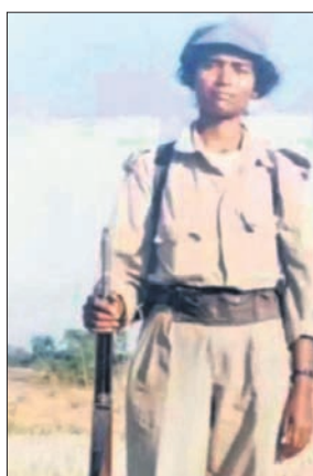
ମାଓବାଦୀ ସଙ୍ଗଠନ ଏରିଆ କମିଟି କମାଣ୍ଡର ଭାବେ କାର୍ଯ୍ୟ କରିଥିଲେ। ପରେ ହୋଇଥିବା ଏହି ମହିଳା ଅନ୍ୟ ନେତାଙ୍କ ପାଇଁ ପାଲଟି ଯାଇଛନ୍ତି ଉପାହରଣ।

ଏକଦା ପୋଲିସର ନିଦ ହୋଇ ଦେଇଥିବା ମହିଳା ମାଓବାଦୀ କମାଣ୍ଡର ବର୍ତ୍ତମାନ ମାଲକାନଗିରି ଜିଲ୍ଲା ସାମାଜିକ ଚେଲକାରୀ ଏସ୍‌ସିଏସ୍‌ଟି ବିଭାଗର କ୍ୟାମ୍ପରେ ମନ୍ତ୍ରୀ। ସେ ହେଉଛନ୍ତି ଦାନପୁର ଅଞ୍ଚଳର ସାମାଜିକ। ୧୬ ବର୍ଷ ବୟସରେ ମାଓବାଦୀ ସଙ୍ଗଠନରେ ସାମିଲ ହୋଇ ବନ୍ଧୁକ ଧରିଥିଲେ। ସେ ମାଓବାଦୀଙ୍କ ସହ ସକ୍ରିୟ ଭାବେ କାର୍ଯ୍ୟ କରୁଥିବା ବେଳେ ଧୀରେ ଧୀରେ ସଙ୍ଗଠନ ନୀତିକୁ ନେଇ ନିରାଶ ହେବାକୁ ଲାଗିଲେ।