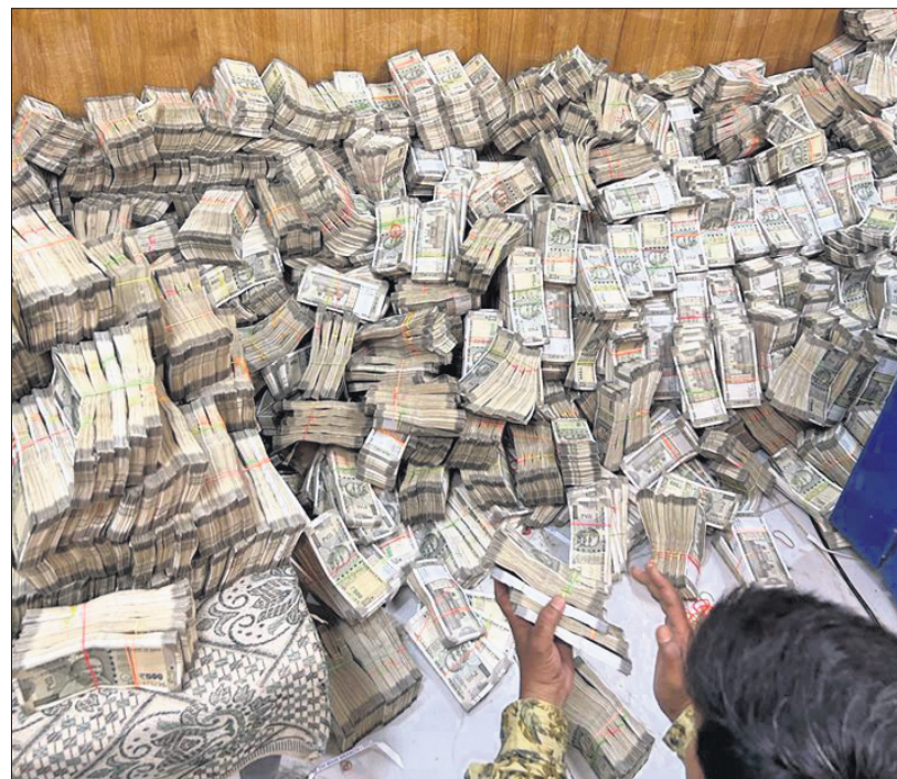
ବଲାଙ୍ଗୀର ଏକ୍ସିଆଇ ମୁଖ୍ୟ ଶାଖାରେ ଆୟକର ବିଭାଗ ପକ୍ଷରୁ ଜବତ ଟଙ୍କା ଗଦା ହୋଇଛି।

ମଦ ସାମ୍ରାଜ୍ୟ ଉପରେ ଆୟକର (ଆଇଟି) ବିଭାଗ ପକ୍ଷରୁ ଶନିବାର ଚତୁର୍ଥ ଦିନ ଧରି ମାରାଥନ୍ ଚଢ଼ାଉ ଜାରି ରହିଛି। ବଲାଙ୍ଗୀର ସୁଦପଡ଼ା ମଦଭାଡ଼ିକୁ ଜବତ ଏକ ପଲିଥିନ୍ ପ୍ୟାକେଟ୍ରେ ୫ ଲକ୍ଷ ଟଙ୍କା ରହିଛି। ଉକ୍ତ ବ୍ୟାଗରେ 'ଇନ୍ଦୁପେକ୍ଟର ତିଆରି' ଲେଖାହୋଇଥିବା ପ୍ରମତ୍ତ ହେବା ପରେ ଏହା ଚଢ଼ାଉ ବିଷୟ ପାଇଁ ଚିନ୍ତା ବାସ୍ତବରେ କେଉଁ ବିଭାଗର ଇନ୍ଦୁପେକ୍ଟର ତାହା ସ୍ପଷ୍ଟ ହୋଇ ନ ଥିବାରୁ ବାବୁ ଜଣକ କିଏ ଏବଂ ସୁଦପଡ଼ା ମଦଭାଡ଼ି ସହ ଟଙ୍କା କ'ଣ ସମ୍ପର୍କ ରହିଛି, ତାକୁ ନେଇ ସାଧାରଣରେ ପ୍ରଶ୍ନ ହେଉଛି।