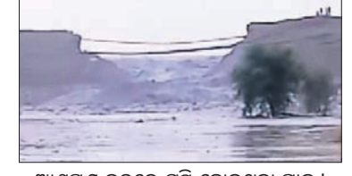
ଆଖିପକ୍ଷ ବନ୍ଧରେ ସୃଷ୍ଟି ହୋଇଥିବା ଘାଲ। ଶିବିର ସମ୍ପାଦକ ଗ୍ରାମସମୟରେ ଓପିଜିସି ପ୍ଲଟର ୩ ନମ୍ବର ପାଞ୍ଜିପୋଖରୀ ବନ୍ଧରେ ହୋଇ ଏକ ଘାଲ ସୃଷ୍ଟି ହୋଇଥିଲା। ପ୍ରଥମେ ୧୦ଟି

ବ୍ରଜରାଜନଗର, ୯.୧୨ (ବିଜୟ ବରାଡ଼) ଖାରବୁଡ଼ା ଜିଲ୍ଲା ଲଖନପୁର ବ୍ଲକ୍ ବନହର ପାଲଟିରେ ଥିବା ଓପିଜିସି (ଓଡ଼ିଶା ପାଞ୍ଜିର କେନେରଶନ କର୍ପୋରେଶନ) ପ୍ଲଟର ୩ ନମ୍ବର ପାଞ୍ଜିପୋଖରୀ (ଆଖିପକ୍ଷ) ବନ୍ଧ ଶିବିର ଭାଙ୍ଗିପାଳୁଥିଲା। ଫଳରେ ପାଞ୍ଜିପୋଖରୀ ପଶି ବନ୍ଧ ତଳପଟରେ ଥିବା ଗ୍ରାମବାସୀଙ୍କ ଶତାଧିକ ଏକର ଧାନ ଓ ପିପିରିବା ଫସଲ ନଷ୍ଟ ହୋଇଯାଇଛି। ମିଳିଥିବା ସୂଚନା ଅନୁଯାୟୀ