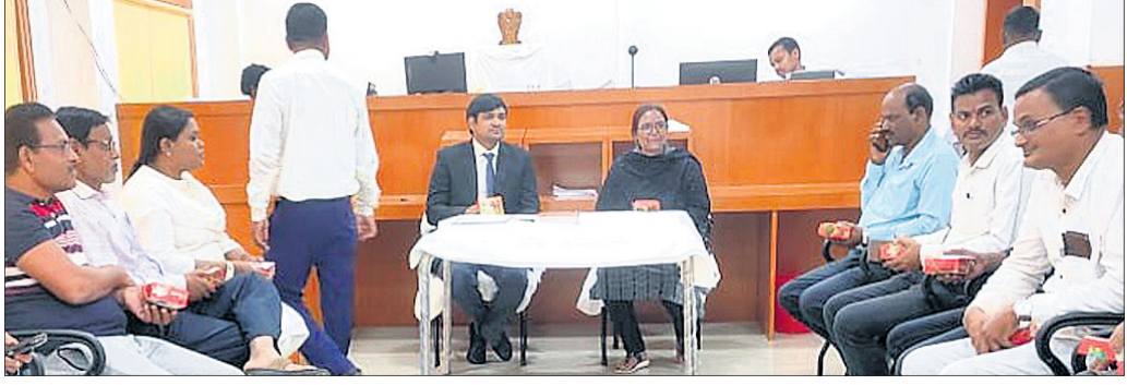
ଆୟୋଜିତ ଲୋକ ଅଦାଲତରେ ବିଚାରପତି ଓ ଅନ୍ୟମାନେ ।

ରଣପୁର, ୯.୧୨ (ସୁନୀଲ କିଶୋର ଚାନ୍ଦୁଆ) ନୟାଗଡ଼ ଜିଲ୍ଲା ରଣପୁର ଦେଶୀୟ ଚୌକିଦାରୀ କୋର୍ଟ ପରିସରରେ ଶନିବାର ଚତୁର୍ଥ ଜାତୀୟ ଲୋକ ଅଦାଲତ ଅନୁଷ୍ଠିତ ହୋଇଯାଇଛି ।