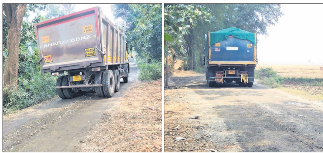
ଗ୍ରାମ୍ୟ ଜଙ୍ଗଲ ରାସ୍ତାରେ ଭାରିଯାନ ବାହାର ପଥର ଚଳାଚଳ ବାଧାପାଇଛି ।

ନୟାଗଡ଼ ଜିଲ୍ଲା ଓଡ଼ିଶା ଚଳାଚଳ ଆଇନିକ୍ଟି ଓ ଗୁଞ୍ଜୁବାରଣ ରାସ୍ତା, ଗ୍ରାମ୍ୟ ଜଙ୍ଗଲ ଓ ଗୋଟର କିସମ ଜମିରେ ଭାରିଯାନ ଯୋଗେ ପୁଅଣିଆ କ୍ରମରୁ ମେଟାଲ, ଡିପ୍ସ ଓ କ୍ରମର ରୁଷ୍ଟ ଚାଲାଣକୁ ନୟାଗଡ଼ ଜିଲ୍ଲାପାଳ ବନ୍ଦ କରିବାକୁ ନିର୍ଦ୍ଦେଶ ଦେଇଛନ୍ତି । ଡିପ୍ସ ଓ କ୍ରମର ରୁଷ୍ଟ ଚାଲାଣ ନିର୍ଦ୍ଦେଶ ଦେଇଛନ୍ତି । ଡିପ୍ସ ଓ କ୍ରମର ରୁଷ୍ଟ ଚାଲାଣ ନିର୍ଦ୍ଦେଶ ଦେଇଛନ୍ତି ।