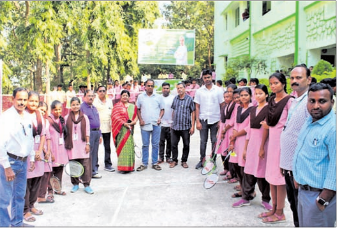
ଉଦ୍‌ଘାଟନୀ ଉତ୍ସବରେ ଅତିଥିମାନଙ୍କ ସମ୍ମାନରେ ଛାତ୍ରମାନେ ।

ଶରଣକୁଳ, ୯.୧୨ (ବାପକ କର) ଶରଣକୁଳ ମହାବିଦ୍ୟାଳୟରେ ଆମ ଓଡ଼ିଶା ନବୀନ ଓଡ଼ିଶା କାର୍ଯ୍ୟକ୍ରମ ଆଧାର କ୍ରୀଡ଼ା ପ୍ରତିଯୋଗିତା ଉଦ୍‌ଘାଟନ ଉତ୍ସବ ଅନୁଷ୍ଠିତ ହୋଇଯାଇଛି ।