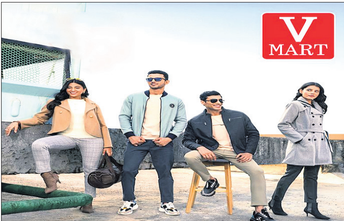
ମାର୍ଟ ପକ୍ଷରୁ କୁହାଯାଇଛି, ପ୍ରତିବର୍ଷ ଷ୍ଟୋରୀରେ ଉପଲବ୍ଧ ହେଉଛି। ଏପରିକି ଭଲ ଚଳିତ ବର୍ଷ ମଧ୍ୟ ଶୀତ ପୋଷାକର ରୁଣ୍ଡାମୁଦାନର ଉତ୍ତମ ମୂଲ୍ୟରେ ବ୍ୟାପକ ସମୟର ଦେଶର ସମସ୍ତ ଭି-ମାର୍ଟ ଗ୍ରାହକଙ୍କୁ ଯୋଗାଇ ଦିଆଯାଇଛି।

ଭି-ମାର୍ଟ ରିଟେଲ ଲିମିଟେଡ୍ (ଭି-ମାର୍ଟ) ବହୁ ପ୍ରତୀକ୍ଷିତ ତଥା ଚଳିତ ବର୍ଷର ଶୀତ ସମୟର (ଫିଣ୍ଡର କଲେକ୍ସନ)ର ଉନ୍ମୋଚନ ସମ୍ପର୍କରେ ଘୋଷଣା କରାଯାଇଛି। ବିଶେଷକରି ଆକର୍ଷଣୀୟ ଓ ଫ୍ୟାଶନବୁଲ୍ ଶୀତ ସମୟର ସାଙ୍ଗକୁ ସ୍ମିତସାରୀ, ବୟର, କ୍ୟାକେଟ, ଲାଜ କୋର୍ଟ, କାର୍ଡିଗାନସ୍ ଭଳି ଅନେକ ପ୍ରକାର ଶୀତ ବସ୍ତ୍ର ସୁଲଭ ମୂଲ୍ୟରେ ଉପଲବ୍ଧ। ଏପରିକି ୧୯୯ ଟଙ୍କାକୁ ଶୀତ ସମୟର ଆରମ୍ଭ ହେଉଥିବାବେଳେ ଉତ୍ତମ ପୁରୁଷ ଓ ମହିଳାଙ୍କ ସମେତ ଶିଶୁଙ୍କ ପାଇଁ ମଧ୍ୟ ନୂତନ କଲେକ୍ସନ ଓ ଆକର୍ଷଣୀୟ ତିଆରି ଉପଲବ୍ଧ। ଏ ନେଇ ଭି-