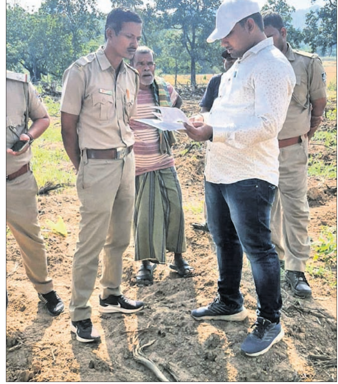
ଘଟଣାସ୍ଥଳରେ ବନ କର୍ମଚାରୀଙ୍କ ତଦନ୍ତ ।

ଘଟଣାସ୍ଥଳରେ ପହଞ୍ଚି ପୂର୍ବରୁ ଜାଗର ଅଧିକାରୀଙ୍କ ଦ୍ୱାରା ମହାପାତ୍ରଙ୍କୁ ଡାକି କ୍ରିମିନାଲ୍ ଦେଖାଯାଇଛି ।