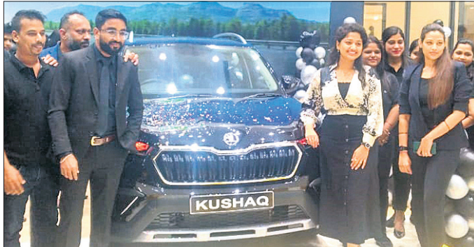
ଷ୍ଟୋରୀର ଏଲିଗାନ୍ସ (ଷ୍ଟୋରୀର ଏଲିଗାନ୍ସ ଏତିଶାନ) ମନେଇ ଶ୍ରୀନିବାସ ଟ୍ରିନିଟି ଷ୍ଟୋରୀ କଲେକ୍ସନର ଅନୁଷ୍ଠାନ କରାଯାଇଛି। ଏହି ପରିପ୍ରେକ୍ଷାରେ ଶ୍ରୀ ରାଜ୍ୟ ଶ୍ରୀମତୀ ଓ ଗ୍ରାହକମାନେ ଉପସ୍ଥିତ ଅଛନ୍ତି।

ଦେଶର ପ୍ରମୁଖ ଅଗ୍ରଗୋବାରାଜା କମ୍ପାନୀ ଷ୍ଟୋରୀ ଅଗ୍ରୋ ଇଣ୍ଡିଆର ବହୁ ପ୍ରତୀକ୍ଷିତ ତଥା ଅତ୍ୟାଧୁନିକ ଜ୍ଞାନକୌଶଳରେ ନିର୍ମିତ 'ଷ୍ଟୋରୀର ଏଲିଗାନ୍ସ' ଏତିଶାନକୁ ନିକଟରେ ସର୍ବଭାରତୀୟସ୍ତରରେ ଉନ୍ମୋଚନ ସହ ଉତ୍ତମ କୁଶାଳ ଓ ସୁଖିଆ ମନେଇ ଲାନ୍ଚ କରାଯାଇଛି।