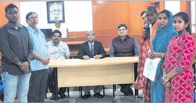
ଓଡ଼ିଶାରେ ରାଷ୍ଟ୍ରୀୟ ଲୋକ ଅଦାଲତରେ ବିଚାର ଚାଲିଛି ।

ଓଡ଼ିଶା, ୯.୧୨ (ଅବର୍ଣ୍ଣ କୁମାର ପଟ୍ଟନାୟକ) ଶନିବାର ଓଡ଼ିଶା ଦେଶୀୟ ଓ ଚୌକିଦାରୀ ଅଦାଲତ ପରିସରରେ ୪ର୍ଥ ରାଷ୍ଟ୍ରୀୟ ଲୋକ ଅଦାଲତ ଅନୁଷ୍ଠିତ ହୋଇଯାଇଛି ।