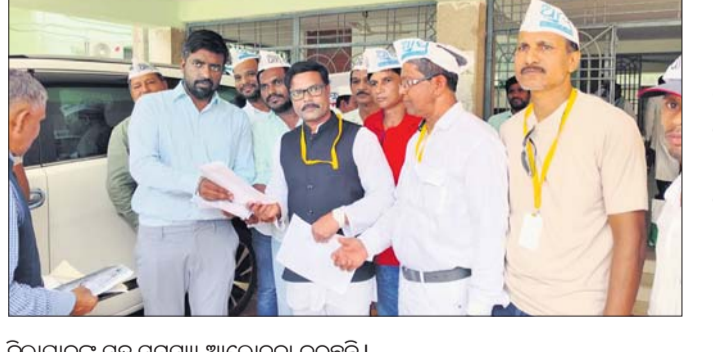
ଜିଲାପାଳଙ୍କ ସହ ସମସ୍ୟା ଆଲୋଚନା କରୁଛନ୍ତି।

୧୦ ଲକ୍ଷ ଟଙ୍କା ଲେଖାଏ ଯନ୍ତ୍ରପୁରଣ ଓ ଗୁରୁତରଙ୍କୁ ୧ ଲକ୍ଷ ଟଙ୍କା ଲେଖାଏ ଦେବା, ଉତ୍ତମ ଗମ୍ୟାସ ବିତରକ ସ୍ଥାପନ, ପୋଲିସ୍ ଆଉଟ୍ ପୋଷ୍ଟର ସ୍ଥାପନ ଏବଂ ନିମୁକ୍ତି, ଶିଶୁ, ଅଧିକାଂଶ ଓ ସର୍ବନୀ ବିଶେଷଜ୍ଞ ନିୟମିତ ନିମୁକ୍ତି, ଟ୍ରାକ୍ଟର ଦୁର୍ଘଟଣାରେ ପ୍ରାଣ ହରାଇଥିବା ବୁଡ଼ାତଳ ପଞ୍ଚାୟତର ଶା ଆଦିବାସୀଙ୍କ ପରିବାରକୁ