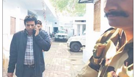
ବଲାଙ୍ଗୀର ସୁଦପଡ଼ା ଦେଶୀ ମଦଭାରିରେ ଆଘାତର ବିଭାଗ ଅଧିକାରୀ।

ରେକର୍ଡ଼ ହୋଇଛି କି ନାହିଁ ସେ ନେଇ ମଧ୍ୟ ସୂଚନା ଦିଆଯାଇ ନାହିଁ। ବାସ୍ତବରେ ଯେତେକ ଟଙ୍କା ମିଳିଛି ବୋଲି କୁହାଯାଉଛି ସେତେକ ମିଳିଛି ନା ତା' ଠାରୁ ତେଜ ଅଧିକ ଟଙ୍କା ମିଳିଛି ତାକୁ ନେଇ ମଧ୍ୟ ଲୋକେ ନାନା ପ୍ରଶ୍ନ କରୁଛନ୍ତି। ଏଭଳି ସ୍ଥିତିରେ ଆଘାତର ବିଭାଗ ଏବଂ ବ୍ୟାଙ୍କ ଅଧିକାରୀମାନେ ଜବତ ଟଙ୍କା ସମ୍ପର୍କରେ ଠିକ୍ ସୂଚନା ନ ଦେବା ପଛରେ ଆଉ କ'ଣ ଉଦ୍‌ଦେଶ୍ୟ ଅଛି କି ସେ ନେଇ ଲୋକେ ଆଶଙ୍କାବ୍ୟକ୍ତ କରୁଛନ୍ତି। ସେମାନଙ୍କର ରାତି ସୁଦ୍ଧା ବଲାଙ୍ଗୀର ଏସ୍‌ସିଆଇ ପୁଖ୍ୟ ଶାଖାରେ ଗଣତି କରାଯାଇଥିବା ୨୮୫ କୋଟି ଟଙ୍କା ଡିପୋଜିଟ୍ କରାଯାଇଥିବା କୁହାଯାଉଛି। ଏହା ସହିତ ଏହି ବ୍ୟାଙ୍କରେ ଏତେ ପରିମାଣର ନଗଦ ଟଙ୍କା ରଖିବାକୁ କୁଆଡ଼େ ଜାଗା ନାହିଁ। ତେବେ ବାସ୍ତବରେ କେତେ ଟଙ୍କା ମିଳିଛି ଓ ଟଙ୍କା ରଖିବା ପାଇଁ ଜାଗା ଅଛି କି ନାହିଁ ସେନେଇ କୌଣସି ବ୍ୟାଙ୍କ କିମ୍ବା ଆଘାତର ଅଧିକାରୀ ସୂଚନା ଦେଇ ନ ଥିବାରୁ ଏହାର ସତ୍ୟତାକୁ ନେଇ ମଧ୍ୟ ଦ୍ୱନ୍ଦ୍ୱ ସୃଷ୍ଟି ହୋଇଛି।