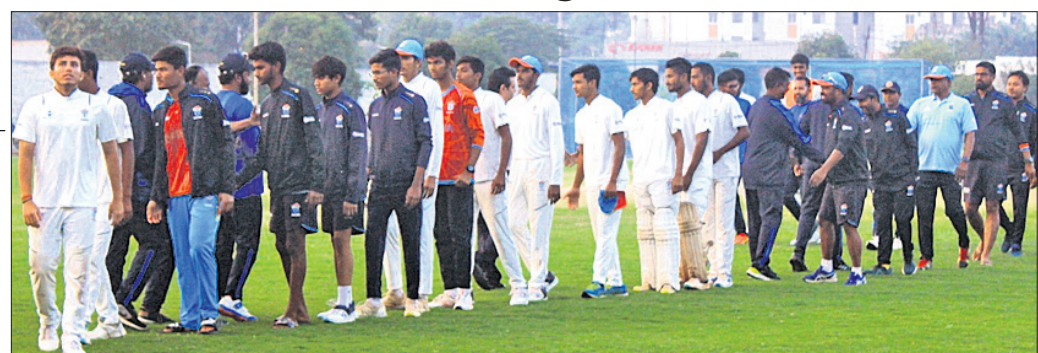
ଉତ୍ତମ ଦଳର ଖେଳାଳି ପରସ୍ପରକୁ ଭେଟୁଛନ୍ତି।