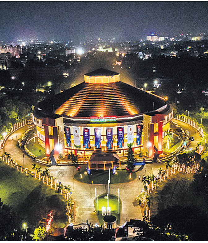
ଟୁର୍ନାମେଣ୍ଟ ପୂର୍ବରୁ ଆଲୋକନାକାର ସଜ୍ଜିତ ଜବାହରଲାଲ ନେହେରୁ ଇନଡୋର ଷ୍ଟାଡ଼ିୟମ।