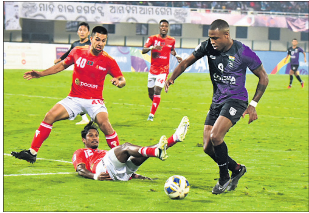
ଓଏଫସି ଓ ବସୁନ୍ଦରା କିକ୍ସ ମଧ୍ୟରେ ଅନୁଷ୍ଠିତ ମ୍ୟାଚର ଏକ ସଂଘର୍ଷପୂର୍ଣ୍ଣ ମୁହୂର୍ତ୍ତ।

ଭୁବନେଶ୍ୱର, ୧୧/୧୨ (ସେବାକ ଜେନା) କଳିଙ୍ଗ ଷ୍ଟାଡ଼ିୟମରେ ଅନୁଷ୍ଠିତ ଏଏଫସି କପର ମ୍ୟାଚରେ ବସୁନ୍ଦରା କିକ୍ସକୁ ୧-୦ରେ ପରାସ୍ତ କରିଛି ଓଡ଼ିଶା ଏଏଫସି (ଓଏଫସି)। ଏହି ବିଜୟ ସହିତ ଏଏଫସି କପର ନକ୍ସାଉତ୍ତର ଏକ ଉତ୍ତମ ହୋଇଛି। ଗୁପ୍ତ ଡିରେ ଗ୍ରାମ ପାଇଥିବା