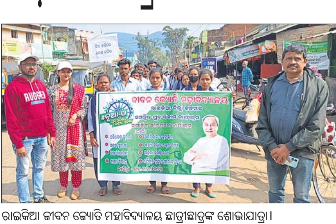
ରାଇକିଆ ଜାବନ ଜ୍ୟୋତି ମହାବିଦ୍ୟାଳୟ ଛାତ୍ରଛାତ୍ରୀଙ୍କ ଶୋଭାଯାତ୍ରା।