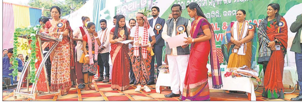
କୃତୀ ପ୍ରତିଯୋଗୀମାନଙ୍କୁ ପୁରସ୍କୃତ କରାଯାଉଛି।