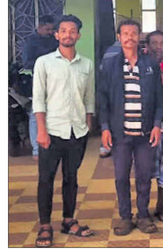
ବିଡ଼ିଓଙ୍କୁ ଭେଟିବାକୁ ଆସିଥିବା ଗ୍ରାମବାସୀ।

କୋରାପୁଟ ଜିଲ୍ଲା ଦଶମନ୍ଦପୁର ବ୍ଲକ୍ ଅନ୍ତର୍ଗତ ପାଳକ ପୁଲବେଡ଼ା ପଞ୍ଚାୟତର ରାସ୍ତା ସମସ୍ୟା ନେଇ ୨ଟି ଗ୍ରାମର ଲୋକ ସମାଜର ବିଡ଼ିଓଙ୍କୁ ଭେଟିଛନ୍ତି।