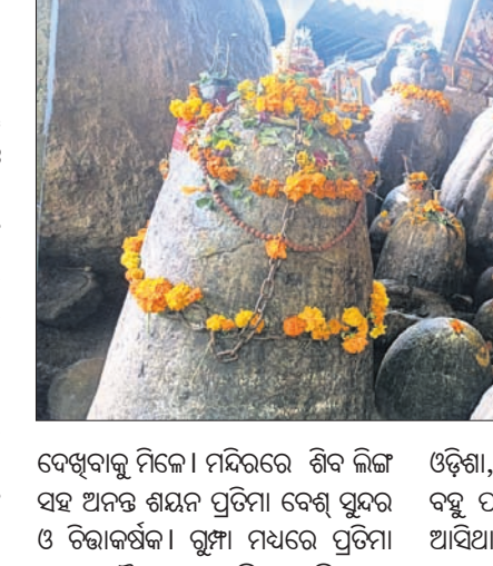
ଦେଖିବାକୁ ମିଳେ। ମନ୍ଦିରରେ ଶିବ ଲିଙ୍ଗ ସହ ଅନନ୍ତ ଶୟନ ପ୍ରତିମା ବେଶ୍ ସୁନ୍ଦର ଓ ଚିତ୍ତାକର୍ଷକ।

କୋରାପୁଟ ଜିଲ୍ଲା ଲକ୍ଷ୍ମୀପୁର ବ୍ଲକ୍ ଅଞ୍ଚଳର କୁରୁଣିପଦରରେ ହେଉଛି ଏକ ଆକର୍ଷଣୀୟ ଦର୍ଶନୀୟ ସ୍ଥଳ। ଏଠାରେ ପୂଜା ପାଉଛନ୍ତି ସହସ୍ର ଶିବଲିଙ୍ଗ। ଏହା ଦେଖିବାକୁ ବିଭିନ୍ନ ସମୟରେ ଏଠାରେ ପର୍ଯ୍ୟଟକମାନଙ୍କ ବେଶ୍ ଭିଡ଼ ଜମୁଛି।