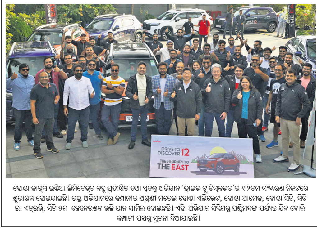
ହୋଣ୍ଡା କାର୍ବସ ଇଣ୍ଡିଆ ଲିମିଟେଡ୍‌ର ବହୁ ପ୍ରତୀକ୍ଷିତ ଓଥା ସ୍ମାର୍ଟ ଅଭିଯାନ 'ଡ୍ରାଇଭ ଟୁ ଡିସ୍କଭର ୧୨୦୮୩'...