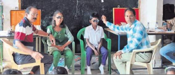
ଛାତ୍ରଛାତ୍ରୀମାନେ ଚନ୍ଦ୍ର ପରୀକ୍ଷା କରୁଛନ୍ତି।

କୋରାପୁଟ, ୧୧.୧୨ (ଅନିଚାଳ ବେହେରା) ଚନ୍ଦ୍ର ପରୀକ୍ଷା କାର୍ଯ୍ୟକ୍ରମ କୋରାପୁଟ ବ୍ଲକ୍ ଓ ପୌରପାଳିକା ଅଞ୍ଚଳରେ ଅନୁଷ୍ଠିତ ହୋଇଛି। ଛାତ୍ରଛାତ୍ରୀଙ୍କୁ ଉତ୍ତମ ଧରଣରେ ପରୀକ୍ଷା କରି ଏହାର ଫଳାଫଳ ନେଇଛନ୍ତି।