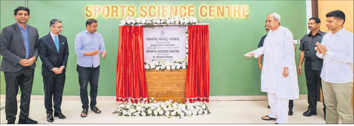
ଭୁବନେଶ୍ୱର କଳିଙ୍ଗ ଷ୍ଟାଡ଼ିୟମରେ ଦେଶର ସର୍ବବୃହତ୍ କ୍ରୀଡ଼ା ବିଜ୍ଞାନ କେନ୍ଦ୍ରର ମୁଖ୍ୟମନ୍ତ୍ରୀ ନବୀନ ପଟ୍ଟନାୟକ ଯୋଗଦାନ ଉଦ୍‌ଘାଟନ କରିଛନ୍ତି ।