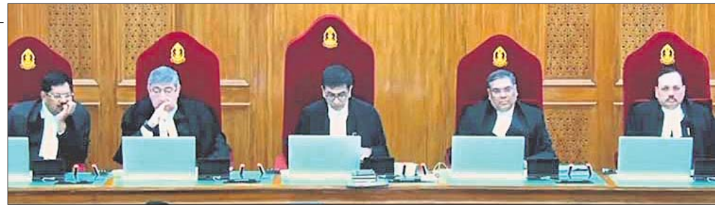
ନୂଆଦିଲ୍ଲୀ, ୧୧/୧୨ (ପି.ଟି.)