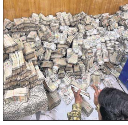
ବଲାଙ୍ଗୀର, ୧୧/୧୨ (ବାରେନ୍ଦ୍ର କୁମାର ଝାଙ୍କର)