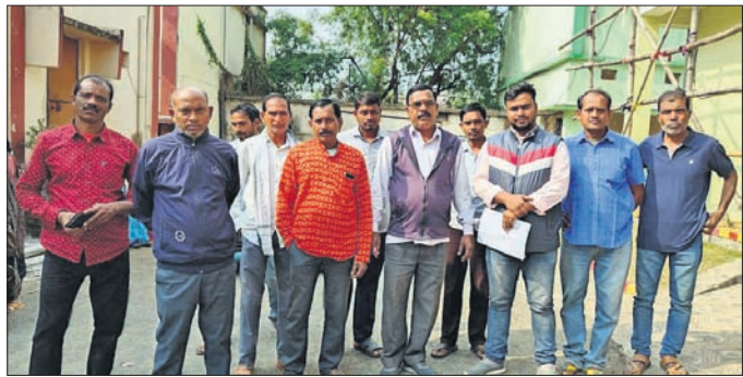
ସେତ ପ୍ରକଳ୍ପରେ ଅନ୍ତର୍ଭୁକ୍ତ ଦାବିରେ ଜିଲ୍ଲାପାଳଙ୍କୁ ଫେରାଦ ହୋଇଥିବା ଚାଷୀଙ୍କୁ ।