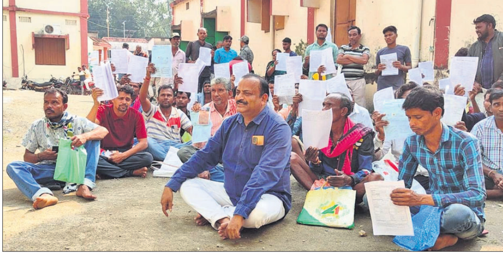
ଆବେଦନ ଅବଧି ବୃଦ୍ଧି ଦାବିରେ ଧାରଣା ।