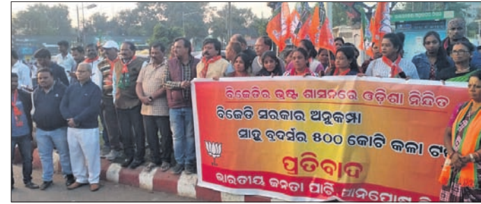
ବିଶ୍ୱା ଛକରେ ଆୟୋଜିତ ବିରୋଧରେ ଭାଜପା କାର୍ଯ୍ୟକର୍ତ୍ତା।