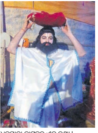
ଧନୁଯାତ୍ରା ନାଟକର ଏକ ଦୃଶ୍ୟ।