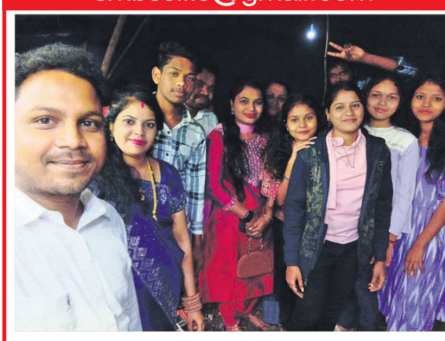
ଠା ବିକସ୍ ସୁଆତି