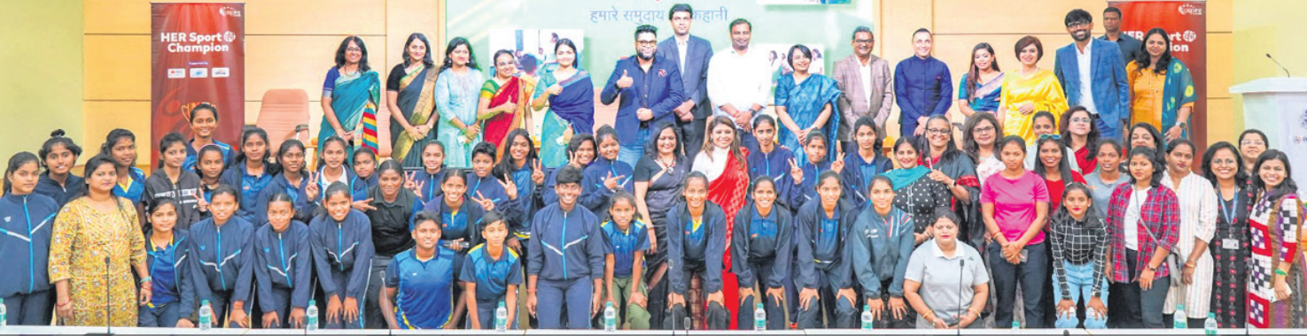
'ହର୍ ସ୍ପୋର୍ଟ କି ଚାମ୍ପିୟନ' କାର୍ଯ୍ୟକ୍ରମ ଲଞ୍ଚ ଅବସରରେ ଖେଳାଳିଙ୍କ ସହ ଜ୍ରାତାମନ୍ତ୍ରୀ ତୁଷାରକାନ୍ତି ବେହେରା ଓ ଅନ୍ୟ ଅତିଥିମାନେ ।

ଭୁବନେଶ୍ୱର, ୧୧.୧୨ (ସରୋଜ କେନା) ଓଡ଼ିଶା ସରକାରଙ୍କ ଜ୍ରାତା ଓ ଯୁବ ବ୍ୟାପାର ମନ୍ତ୍ରାଳୟ ପକ୍ଷରୁ ମହିଳା ଆଥଲେଟିକ୍ସ ସମାଜର ପାଇଁ ଏକ ନୂତନ ବ୍ୟବସ୍ଥା ଆରମ୍ଭ କରାଯାଇଛି । 'ଆହାୟତା ଫର୍ ହର୍' ସହ ମିଳିତ ସହକାରୀତାରେ ଲଞ୍ଚ କରାଯାଇଛି 'ହର୍ ସ୍ପୋର୍ଟ କି ଚାମ୍ପିୟନ' କାର୍ଯ୍ୟକ୍ରମ । ଅବସର ପରେ ମହିଳା ଖେଳାଳିଙ୍କୁ ସଶକ୍ତ କରିବା ଏହି କାର୍ଯ୍ୟକ୍ରମର ଏକମାତ୍ର ଲକ୍ଷ୍ୟ ରହିବ । କାର୍ଯ୍ୟକ୍ରମର ଲଞ୍ଚ ଅବସରରେ ଜ୍ରାତା ଓ ଯୁବ ବ୍ୟାପାର ମନ୍ତ୍ରୀ ତୁଷାରକାନ୍ତି