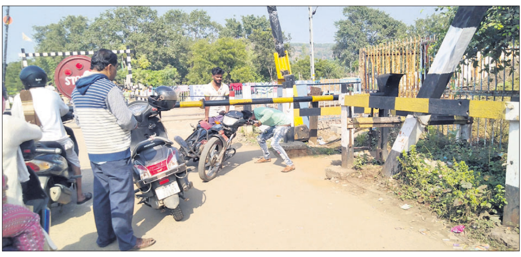
ପାଟକ ବନ୍ଦ ଥିବାବେଳେ ଲୋକେ ଟ୍ରେନ ଲାଲନ ପାରି ହେଉଛନ୍ତି।

ରାଉରକେଲା, ୧୧୧୨ (ବିନେଶ ମିଶ୍ର) ରାଉରକେଲା ରେଳ ଷ୍ଟେଶନର ବିକାଶ ସାଙ୍ଗକୁ ଟ୍ରେନ ଚଳାଚଳରେ ଉନ୍ନତି ପାଇଁ ବିଭାଗ ପକ୍ଷରୁ ଉନ୍ନତିମୂଳକ କାର୍ଯ୍ୟ ଚାଲିଛି। ରାଉରକେଲା ସହରରେ ବିଗତ ୧୨ ବର୍ଷ ଭିତରେ ବାସନ୍ତୀ କଲୋନୀରୁ ଉଦ୍‌ବିଦାନର ଆୟତ୍ତକର ଛକକୁ ସଂଯୋଗ କରୁଥିବା ବାସନ୍ତୀ ରେଳଝେ ଓଭରବ୍ରିଜ, ଏକ୍ସପ୍ରେସ୍ ଓଭରବ୍ରିଜ, ପାନପୋଷ ଓଭର ବ୍ରିଜ, ଆଇଡିଆଇ ରେଳଝେ ବ୍ରିଜ ନିର୍ମାଣ କାର୍ଯ୍ୟ ଶେଷ ହୋଇଯାଇଛି। ବର୍ତ୍ତମାନ ମାଲଗୋଦାମ ପାଟକ ରେଳଝେ ଓଭରବ୍ରିଜ କାମ ପାଇଁ ମାପରୂପ ସରିବା ପରେ ଆସନ୍ତା ମାସର ଭିତରେ ଏହି ବ୍ରିଜ କାମ ସରିବ ବୋଲି ଜଣାପଡ଼ିଛି। ଯେଉଁ ଗ୍ରାମରେ ରେଳଝେ ପକ୍ଷରୁ ଓଭରବ୍ରିଜ କାର୍ଯ୍ୟ ଶେଷ ହୋଇଛି ସେଠାରେ କେଉଁକି କୃସି ବନ୍ଦ କରାଯାଇଛି। ଏହାସତ୍ତ୍ୱେ ଲୋକମାନେ ବନ୍ଦ ପାଟକ ଦେଇ ଯାତାୟତ କରୁଥିବାରୁ ବିଭିନ୍ନ ସମୟରେ ଦୁର୍ଘଟଣା ଘଟି ଜୀବନହାନି ହେଉଛି। ଏଭଳି ଭାବେ ଗତ ୬ ମାସ ଭିତରେ ୪୫ଜଣ ଦୁର୍ଘଟଣାର ଶିକାର ହୋଇ ଜୀବନ ହାରିଥିବା ଜଣାପଡ଼ିଛି।