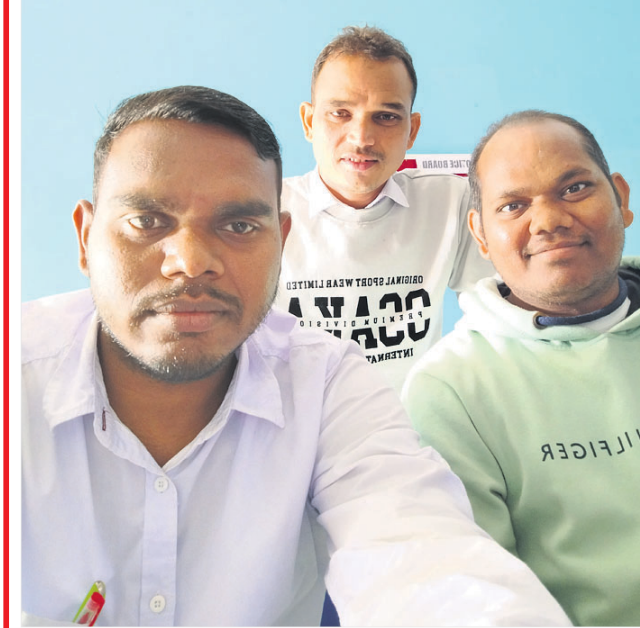
ଠା ସଞ୍ଚାବ ପ୍ରଧାନ

ଆପଣମାନେ ପରିବାର ସଦସ୍ୟ, ସାଙ୍ଗ କିମ୍ବା ସମ୍ପର୍କୀୟଙ୍କ ଗହଣରେ ଉଠାଇଥିବା ସେଲ୍ଫିକୁ ପଠାଇବା ସମୟରେ ନିଜର ନାମ ଏବଂ ମୋବାଇଲ ନମ୍ବର ଦେବାକୁ ଭୁଲନ୍ତୁ ନାହିଁ। ଯୋଗ୍ୟବିବେଚିତ ଫଟୋ ପ୍ରକାଶ ପାଇବ।