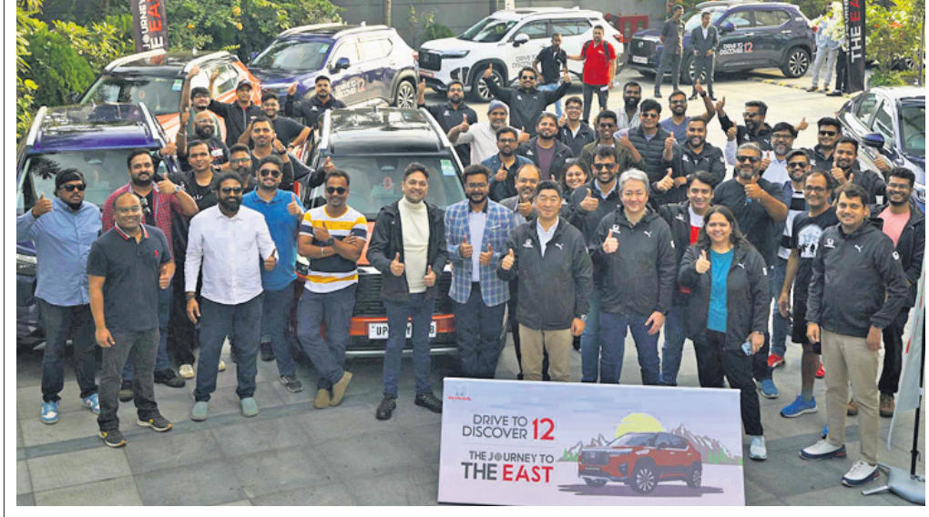
ହୋଣ୍ଡା କାର୍ବ୍ ଲକ୍ଷ୍ମିଆ ଲିମିଟେଡ୍‌ର ବହୁ ପ୍ରତୀକ୍ଷିତ ତଥା ସ୍ୱତନ୍ତ୍ର ଅଭିଯାନ 'ଡ୍ରାଇଭ୍ ଡିସ୍କଭର 12 THE JOURNEY TO THE EAST' ଉଦ୍‌ଘାଟନ ହୋଇଯାଇଛି। ଉଚ୍ଚ ଅଭିଯାନରେ କମ୍ପାନୀର ଅଗ୍ରଣୀ ମଡେଲ ହୋଣ୍ଡା ଏଲିଭେଟ, ହୋଣ୍ଡା ଆମେଜ, ହୋଣ୍ଡା ସିଟି, ସିଟି ଇ: ଏକ୍ସଲୁଜିଭ୍, ସିଟି ୫ମ ଜେନେରେସନ ଇଲିୟାନ୍ ସାନିଟ୍ ହୋଇଛନ୍ତି। ଏହି ଅଭିଯାନ ସିନିଗ୍‌କୁ ପଶ୍ଚିମବଙ୍ଗ ପର୍ଯ୍ୟନ୍ତ ଯିବ ବୋଲି କମ୍ପାନୀ ପକ୍ଷରୁ ସୂଚନା ଦିଆଯାଇଛି।

କ୍ରମାଗତ ୨ ଦିନ ଲାଗି ଘରୋଇ ଶେୟାର ବଜାର କାରବାରରେ ବୃଦ୍ଧି ଘଟିଛି। ଏପରିକି ଚଳିତ ସପ୍ତାହର ପ୍ରଥମ କାର୍ଯ୍ୟଦିବସର ଫଳାଫଳ ଅନୁଯାୟୀ ଶେୟାର ବଜାର ନିବେଶକମାନେ ଲକ୍ଷ୍ୟାଧିକ ଚଳାଇ ନିବେଶ ବଢ଼ାଇଛନ୍ତି। ବିଶେଷକରି ସୋମବାର ବନ୍ଧେ ଷ୍ଟକ୍ ଏକ୍ସଚେଞ୍ଜ (ବିଏସ୍‌ଏକ୍ସ)ର ସେନ୍‌ସେକ୍ସ ୧୦୩ (୧୦୨.୯୩) ପଏଣ୍ଟ ବଦଳି ୨୯.୯୨୯ (୨୯.୯୨୮.୫୩) ଅଧିକ କାରବାର ବନ୍ଦ କରିଥିଲା। ସେହିଭଳି ନ୍ୟାଶନାଲ ଷ୍ଟକ୍ ଏକ୍ସଚେଞ୍ଜ (ଏନ୍‌ଏସ୍‌ଏକ୍ସ) ର ନିର୍ଦ୍ଦି-୫୦୦ରେ ମଧ୍ୟ ୨୮ (୨୭.୭୦) ପଏଣ୍ଟ ବୃଦ୍ଧି ଘଟି ୨୦.୯୯୭ (୨୦.୯୯୬.୧୦) ଅଧିକରେ କାରବାର ବନ୍ଦ କରିଥିଲା। ଅପରପକ୍ଷରେ ବିଏସ୍‌ଏକ୍ସ ସେନ୍‌ସେକ୍ସର ମିଡ଼କ୍ୟାପ୍ ଓ ସ୍ମଲକ୍ୟାପ୍ ଶେୟାରଗୁଡ଼ିକର ଲକ୍ଷେକ୍ସ ସହିତ ଏନ୍‌ଏସ୍‌ଏକ୍ସ ନିର୍ଦ୍ଦି ମିଡ଼କ୍ୟାପ୍, ସ୍ମଲ କ୍ୟାପ୍ ଏବଂ ବ୍ୟାଙ୍କ ଶେୟାରଗୁଡ଼ିକର କାରବାରରେ ମଧ୍ୟ ବୃଦ୍ଧି ଘଟିଛି। ଏପରିକି ଶେୟାର ବଜାରର ସେଲେକ୍ସର ଲକ୍ଷେକ୍ସ କାରବାରରେ ମଧ୍ୟ ପରିବର୍ତ୍ତନ ହୋଇଛି।