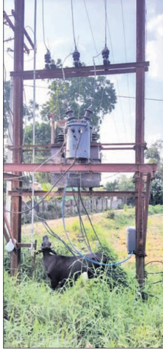
ରେଙ୍ଗାଲପାଲି ଗ୍ରାମରେ ମୁକୁଳା ପଡ଼ିଥିବା ବିଦ୍ୟୁତ ଗ୍ରାହ୍ୟତା ପାଇଁ।

ବରଗଡ଼ ରୁକ୍ଷ ସରକାର ପଞ୍ଚାୟତ ଅନ୍ତର୍ଗତ ରେଙ୍ଗାଲପାଲି ଗ୍ରାମରେ ଦୀର୍ଘବର୍ଷ ଧରି ବିଦ୍ୟୁତ ଗ୍ରାହ୍ୟତା ମୁକୁଳା ପଡ଼ି ରହିଛି। ବୁଲାଇବାକୁ ଏହି ବିଦ୍ୟୁତ ଗ୍ରାହ୍ୟତା ନିକଟକୁ ଯିବା ନିତଦିନିଆଁ ଘଟଣାରେ ପରିଣତ ହୋଇଛି। ଅନ୍ୟପଟେ ପାଖରେ ଗ୍ରାମର ପ୍ରାଥମିକ ସ୍କୁଲ ରହିଛି। ଗ୍ରାହ୍ୟତା ରହିଥିବା ରାସ୍ତା ନିକଟ ଦେଇ ଛାତ୍ରଛାତ୍ରୀ ସ୍କୁଲକୁ ଯିବା ଆସିବା କରୁଛନ୍ତି। ତେବେ ମୁକୁଳା ରହିଥିବା ସେହି ଗ୍ରାହ୍ୟତା ଯୋଗୁ ଛାତ୍ରଛାତ୍ରୀଙ୍କ ଜୀବନ ମଧ୍ୟ ବିପଦରେ ରହିଛି। ଏହି ଦୃଷ୍ଟିରୁ ଭୁବନେଶ୍ୱର ବିଦ୍ୟୁତ ଗ୍ରାହ୍ୟତାରେ ପାଟେରୀ ଦେବା କିମ୍ବା ସେଠାରୁ ଅନ୍ୟତ୍ର ସ୍ଥାନାନ୍ତର କରିବାକୁ ସାଧାରଣରେ ଦାବି ହୋଇଛି। ତେବେ କେବଳ ଏହି ବିଦ୍ୟୁତ ଗ୍ରାହ୍ୟତା ରୁହେଁ, ଜିଲ୍ଲାର ଅନେକ ସ୍ଥାନରେ ଏଭଳି ବିପଦପୂର୍ଣ୍ଣ ଭାବେ ବିଦ୍ୟୁତ ଗ୍ରାହ୍ୟତା ରୁକ୍ଷ ରହିଥିବା ଯୋଗୁ ସେଥିପ୍ରତି ବିଭାଗୀୟ କର୍ତ୍ତୃପକ୍ଷ ଦୃଷ୍ଟି ଦେଇ ପଦକ୍ଷେପ ନେବା ଜରୁରୀ ହୋଇ ପଡ଼ିଛି ବୋଲି ମତପ୍ରକାଶ ପାଇଛି।