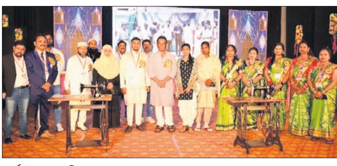
କାର୍ଯ୍ୟକ୍ରମରେ ଅତିଥିଙ୍କ ସହ ସଙ୍ଗଠନର ସଦସ୍ୟ।