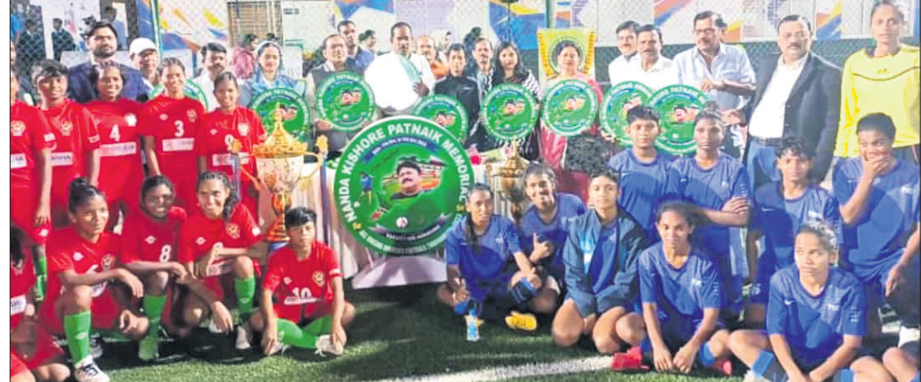
ଉଦ୍‌ଘାଟନୀ ମ୍ୟାଚ୍ ଅବସରରେ ଅତିଥିଙ୍କ ସହ ବୁଲ୍ ଦଳର ଖେଳାଳି।