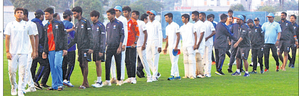
ଉତ୍ତମ ଦଳର ଖେଳାଳି ପରସ୍ପରକୁ ଭେଟୁଛନ୍ତି।