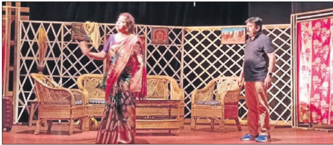
ଏକାଦଶ ରଙ୍ଗମଞ୍ଚରେ ମଞ୍ଚସ୍ଥ ନାଟକର ଏକ ଦୃଶ୍ୟ।