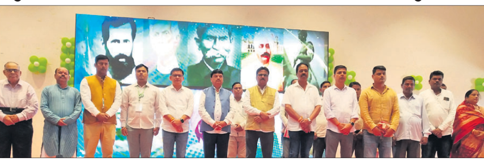
ପ୍ରଶିକ୍ଷଣ ଶିବିରରେ ବିକେଡିର ନେତୃତ୍ୱ।

ସୋନପୁର, ୧୧/୧୨(ମୁଖ୍ୟାଞ୍ଚଳ ଶତପଥୀ) ୨୦୨୪ ସାଧାରଣ ନିର୍ବାଚନ ପାଇଁ ସମସ୍ତ ରାଜନୈତିକ ଦଳ ପ୍ରସ୍ତୁତି ଆରମ୍ଭ କଲେଣି।