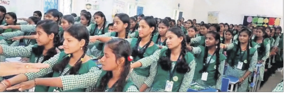
ତମାଖୁ ବର୍ଜନ ପାଇଁ ଶପଥ କରୁଥିବା ଛାତ୍ରୀମାନେ।

ବିଶେଷ ଧ୍ୟାନ ଦେବା କଥା ବୋଲି ସେ କହିଥିଲେ। ଏହି ଅବସରରେ ତମାଖୁ ବ୍ୟବହାର ନ କରିବାକୁ ଛାତ୍ରୀମାନେ ଶପଥ ନେଇଥିଲେ।