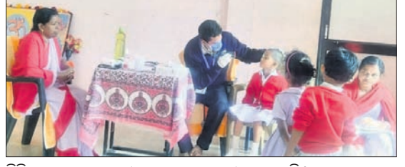
ଶିବିରରେ ଡାକ୍ତର ଛାତ୍ରୀଛାତ୍ରୀଙ୍କ ସ୍ୱାସ୍ଥ୍ୟ ପରୀକ୍ଷା କରୁଛନ୍ତି।