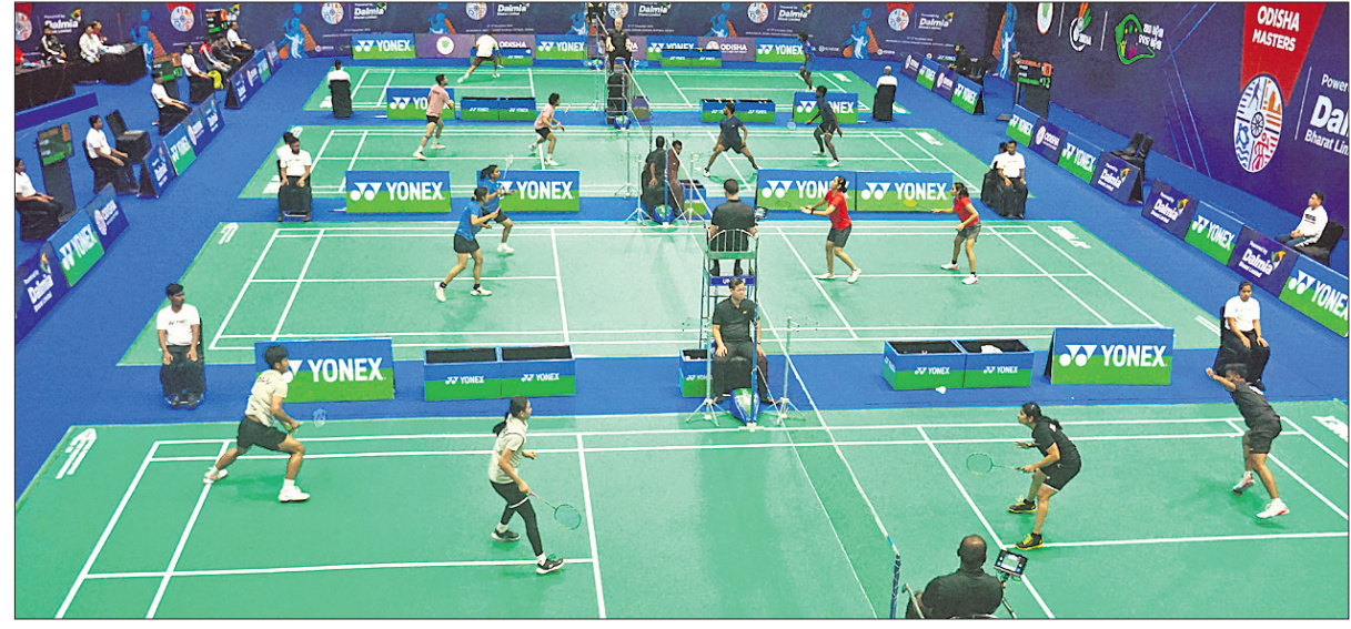
ପ୍ରଥମ ଦିନରେ ଟୁର୍ନାମେଣ୍ଟର ଅନୁଷ୍ଠିତ ମ୍ୟାଚ୍।

କଟକ, ୧୨/୧୨ (ପ୍ରମୁଖ ପ୍ରଦର୍ଶନୀ) ଜବାହରଲାଲ ନେହେରୁ ଜନତୋର ଷ୍ଟାଡ଼ିୟମରେ ମଙ୍ଗଳବାର ଠାରୁ ଆରମ୍ଭ ହୋଇଯାଇଛି ବିତନ୍ତୁଏଫ ଟୁର ପ୍ରଦର୍ଶନ-୧୦୦ ବ୍ୟାଡମିଣ୍ଟନ ଓ ଖାଲ୍ମି ଫେଡେରେଶନ (ବିତନ୍ତୁଏଫ) ଟୁର୍ନାମେଣ୍ଟ। ବିତନ୍ତୁଏଫ ଖାଲ୍ମି ଫେଡେରେଶନ (ବିତନ୍ତୁଏଫ) ଟୁର୍ନାମେଣ୍ଟ ଆୟୋଜନ କରାଯାଇଛି। ଏହି ଟୁର୍ନାମେଣ୍ଟରେ