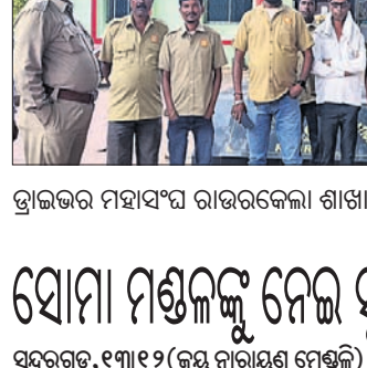
ଭ୍ରାତୃଭାଇ ମହାସଂଘ ରାଉରକେଲା ଶାଖା ସହ ପାଡ଼ିତ ଭ୍ରାତୃଭାଇ ଓ ଅନ୍ୟମାନେ।

ଝରଣାପୁର ଥାନା ଅନ୍ତର୍ଗତ କୋପାଳନଗରରେ ଥିବା ଏକ ପାଉଁରୁଟି କମ୍ପାନୀରେ କାର୍ଯ୍ୟରେ ଗାଡ଼ି ଚାଳକଙ୍କୁ ସେଠାରେ କାମ କରୁଥିବା ସେଲ୍‌ସମାପନ ନିଯୁକ୍ତ ମାଡ଼ ମାରିବା ଓ ଛୁରାରେ ଆକ୍ରମଣ କରିଥିବା ଆନାରେ ଅଭିଯୋଗ ହୋଇଛି।