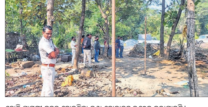
ଚୋରି ସାମଗ୍ରୀ ଜବତ ହୋଇଥିବା କଣ୍ଠା ବୋକାଳକୁ ଉଦ୍ଧୃତ କରାଯାଇଛି।

ସହରରେ ଚୋରି ବୃଦ୍ଧି ସାଙ୍ଗକୁ କଣ୍ଠା ବେପାରୀଙ୍କ ଦୋରାମୁଁ ବଢ଼ିବାରେ ଲାଗିଛି। ପ୍ରତ୍ୟେକ ଦିନ ବାଲୁକ, ଲୁହା ଆଦି ସାମଗ୍ରୀ ଚୋରି ହେଉଛି।