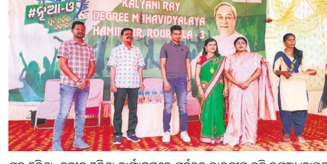
ଯୁବ ଓଡ଼ିଶା, ନବୀନ ଓଡ଼ିଶା କାର୍ଯ୍ୟକ୍ରମରେ ପୂର୍ବତନ ଭାରତୀୟ ହକି ଉପଅଧିନାୟକ ବିରବ୍ରଜ ମାଲିଆ ଓ ଅଧ୍ୟକ୍ଷାଙ୍କର ଉପସ୍ଥିତି।

ସଂସ୍କୃତି ପରିଷଦ ଉପସଭାପତି ସରୀତା ମଲ୍ଲ ପ୍ରମୁଖ ମଞ୍ଚସଭାରେ ଏହି ଅବସରରେ ପୂର୍ବରୁ ଆୟୋଜିତ ବିଭିନ୍ନ ପ୍ରତିଯୋଗିତା ୧୬୯ କଣ୍ଠା କୃତୀ ପ୍ରତିଯୋଗୀଙ୍କୁ ଉଦ୍‌ଘାଟିତ ହୋଇଛି।