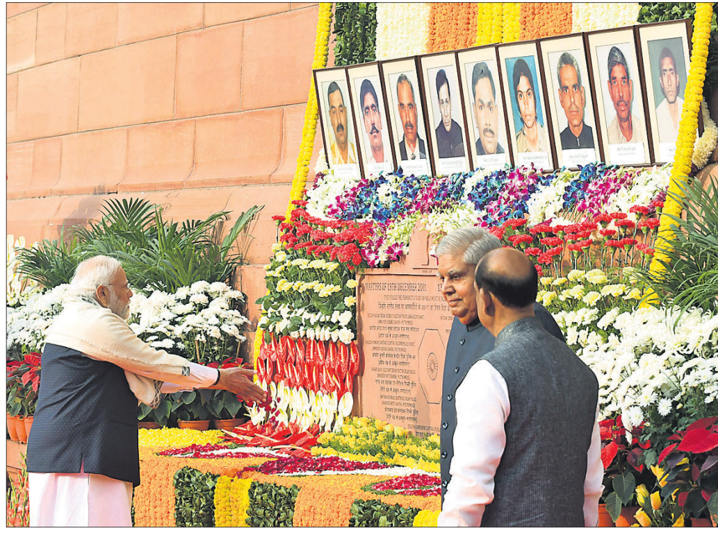
ପାର୍ଲିମେଣ୍ଟ ଆକ୍ରମଣର ୨୨ ବର୍ଷ ପୂର୍ତ୍ତି ଅବସରରେ ଶହାଦାନୀଙ୍କୁ ଶ୍ରଦ୍ଧାଞ୍ଜଳି ଦେଉଛନ୍ତି ପ୍ରଧାନମନ୍ତ୍ରୀ ନରେନ୍ଦ୍ର ମୋଦି। ନିକଟରେ ଅଛନ୍ତି ଉପରାଷ୍ଟ୍ରପତି ଜଗଦୀପ ଧନକର ଓ ଲୋକ ସଭା ବାଚସ୍ପତି ଓମ୍ ବିଲ୍ଲୀ।