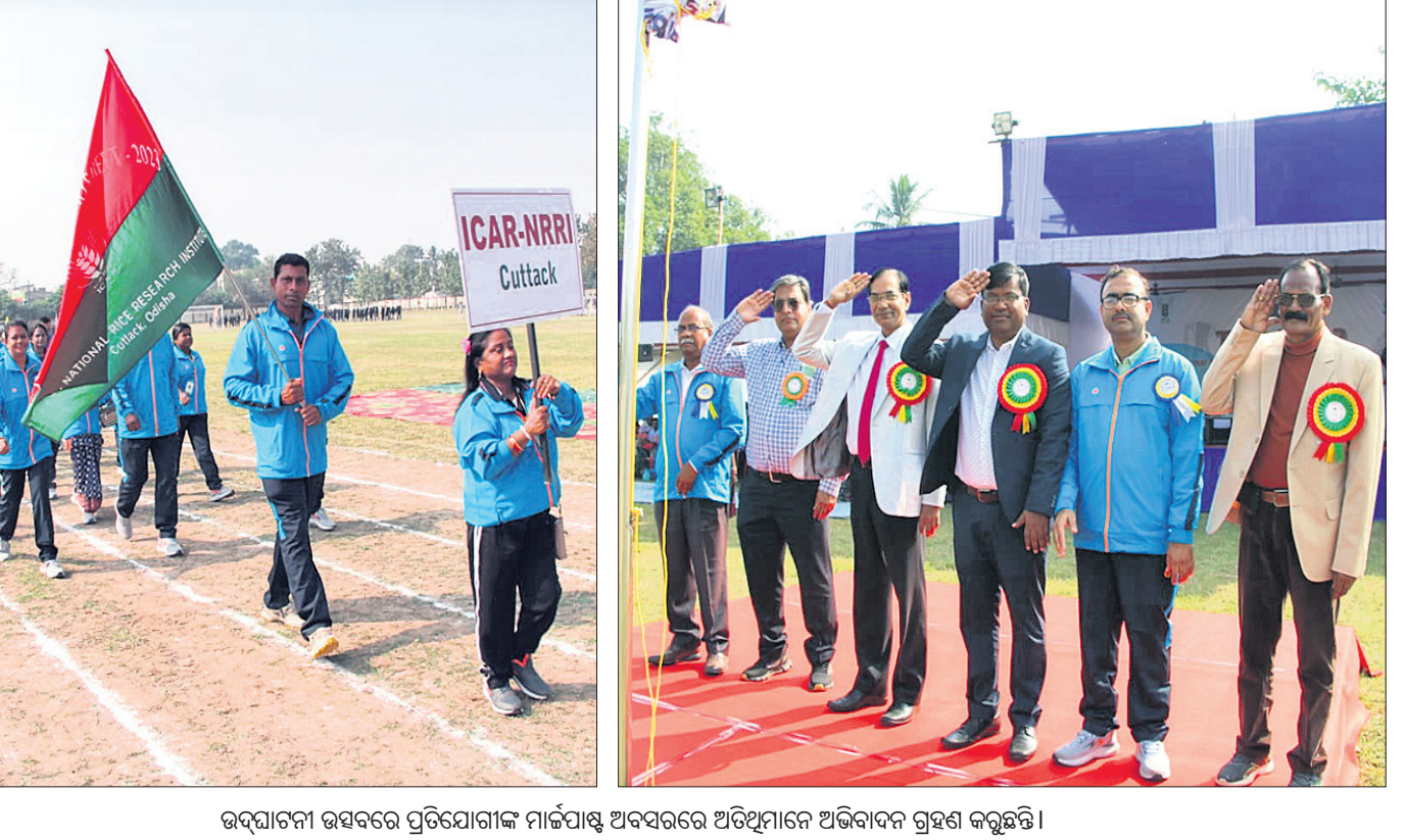
ଉଦ୍‌ଘାଟନା ଉତ୍ସବରେ ପ୍ରତିଯୋଗୀଙ୍କ ମାର୍ଚ୍ଚାପାଠ ଅବସରରେ ଅତିଥିମାନେ ଅଭିବାଦନ ଗ୍ରହଣ କରୁଛନ୍ତି ।

ଭୁବନେଶ୍ୱର, ୧୩୧୨ (ତପନ ସାଲ୍) କଟକ ବିଦ୍ୟାଳୟରୁ ଡାକ୍ତରୀ ଧ୍ୟାନ ଗବେଷଣା ଅନୁଷ୍ଠାନ ଖେଳ ପଡ଼ିଆରେ ପୂର୍ବୀ କ୍ଷେତ୍ର ଆଇସିଏଆର୍ ଜ୍ଞାତା ପ୍ରତିଯୋଗିତା ରୁଧିର ଉଦ୍‌ଘାଟିତ ହୋଇଛି । ଚଳିତ ମାସ ୧୬ ଯଯାତ ହେବାକୁଥିବା ଏହି ପ୍ରତିଯୋଗିତାରେ ପୂର୍ବ ଭାରତର ୧୨ ରାଜ୍ୟ ଓଡ଼ିଶା, ପଶ୍ଚିମବଙ୍ଗ, ଝାଡ଼ଖଣ୍ଡ, ପୂର୍ବ ଉତ୍ତର ପ୍ରଦେଶ ଓ ଉତ୍ତର-ପୂର୍ବ ସମସ୍ତ ରାଜ୍ୟରେ ଭାରତୀୟ କୃଷି ଗବେଷଣା ପରିଷଦ ଅଧୀନରେ ଥିବା ୨୬ ଅନୁଷ୍ଠାନରୁ ପାଖାପାଖି ୫୦୦ରୁ ଊର୍ଦ୍ଧ୍ୱ ପ୍ରତିଯୋଗୀ