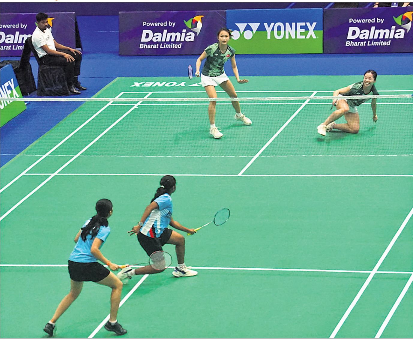
କଟକରେ ଚାଲିଥିବା ବିଡ଼ଲୁଏଟ୍ ଟୁର ପ୍ରଥମ-୧୦୦ ବ୍ୟାଡ଼ମିଣ୍ଟନ ଟୁରନାମେଣ୍ଟରେ ଭୁବନେଶ୍ୱରର ଭୁବନେଶ୍ୱର ଓ ହିନ୍ଦିୟା ନାଥଙ୍କ ମଧ୍ୟରେ ଅନୁଷ୍ଠିତ ମହିଳା ଡବଲ୍ ମ୍ୟାଚ୍ ।