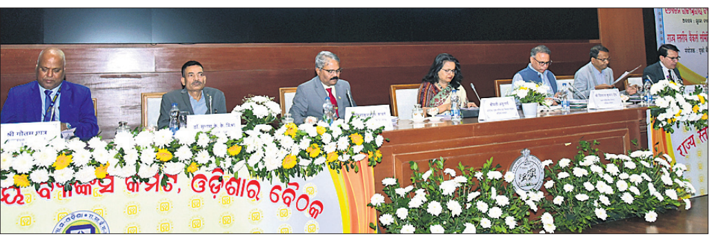
ଭୁବନେଶ୍ୱର, ୧୩୧୨ (ଅନିଲ ଦାସ)

ଆମ ବ୍ୟାଙ୍କ ଯୋଜନା, ମିଶନ ଶକ୍ତି ସ୍ତର ଯୋଜନା, ଲକ୍ଷ୍ମୀ ଯୋଜନା, ବଳରାମ ଯୋଜନା, ମୋ ଘର ଯୋଜନା ଆଦି ରାଜ୍ୟ ସରକାରଙ୍କ ପ୍ରମୁଖ ଜନକଲ୍ୟାଣ କାର୍ଯ୍ୟକ୍ରମ ।