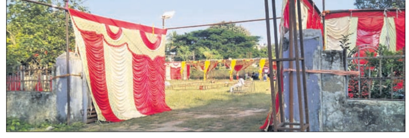
ପାର୍କରେ ଭୋଜି ପାଇଁ ଟେବୁଲ୍ ମରାଯାଇଛି।

ରାଉରକେଲା ସହରର ବିଭିନ୍ନ ସ୍ଥାନରେ ଆରମ୍ଭ ହୋଇ ପକ୍ଷୀମାନଙ୍କୁ ନିର୍ବାଣ କରିବାକୁ ପ୍ରାତଃ ଭ୍ରମଣ ପାଇଁ ଗାଳିଚା ବ୍ୟବହାର କରାଯାଇଛି। ତେବେ କେଉଁଠି ରକ୍ଷଣାବେକ୍ଷଣ ଆବଶ୍ୟକ ଭାବରେ ପ୍ରାତଃ ଭ୍ରମଣ ପାଇଁ ଗାଳିଚା ବ୍ୟବହାର କରାଯାଇଛି। ତେବେ କେଉଁଠି ରକ୍ଷଣାବେକ୍ଷଣ ଆବଶ୍ୟକ ଭାବରେ ପ୍ରାତଃ ଭ୍ରମଣ ପାଇଁ ଗାଳିଚା ବ୍ୟବହାର କରାଯାଇଛି। ତେବେ କେଉଁଠି ରକ୍ଷଣାବେକ୍ଷଣ ଆବଶ୍ୟକ ଭାବରେ ପ୍ରାତଃ ଭ୍ରମଣ ପାଇଁ ଗାଳିଚା ବ୍ୟବହାର କରାଯାଇଛି।