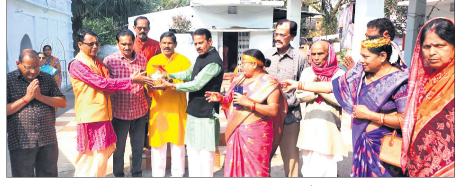
ଧନୁପାଳି ଗୋପାଳଜୀ ମଠରେ ଅକ୍ଷୟ କଳାସ କାର୍ଯ୍ୟକ୍ରମ।

ସମ୍ବଲପୁର, ୧୪।୧୨ (ବି.ଶଙ୍କର) ୧୦ ସଦସ୍ୟାସଦସ୍ୟା ନିଜ ଅଞ୍ଚଳକୁ ସମ୍ବଲପୁର ମହାନଗର ନିଗମ ଧନୁପାଳିରେ ଗୋପାଳଜୀ ମଠରେ ଅକ୍ଷୟ କଳାସ କାର୍ଯ୍ୟକ୍ରମ ଆରମ୍ଭ ହୋଇଯାଇଛି।