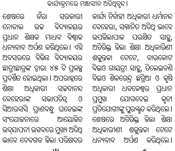
କାର୍ଯ୍ୟକ୍ରମରେ ମଞ୍ଚାସୀନ ଅତିଥିବୃନ୍ଦ।

ଦେବଗଡ଼ ଜିଲ୍ଲା ଶିକ୍ଷା ବିଭାଗ ଆନୁକୁଲ୍ୟରେ ରାଜା ବାସୁଦେବ ଉଚ୍ଚ ବିଦ୍ୟାଳୟ ପରିସରରେ ଗୁରୁବାର ଜିଲ୍ଲାସ୍ତରୀୟ ବାଲ ବୈଜ୍ଞାନିକ ପ୍ରଦର୍ଶନୀ ଆରମ୍ଭ ହୋଇଯାଇଛି।