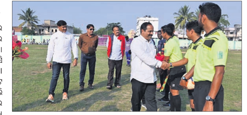
ଅତିଥି ଖେଳାଳିମାନଙ୍କ ସହ କରମର୍ଦ୍ଦନ କରୁଛନ୍ତି।

ବରଗଡ଼ ଜିଲା ସୋହେଲା ମିନି ଷ୍ଟାଡ଼ିୟମରେ ଚାଲିଥିବା ସର୍ବଭାରତୀୟ ସୋହେଲା କପ୍ରେ ଗୁରୁବାର ପ୍ରଥମ ଦିନ ଭୁବନେଶ୍ୱରର ଜଗା ମୁନାଲତେଟ ଏବଂ କୋରାପୁଟର ପଞ୍ଚାୟତ ସମିତି ମଧ୍ୟରେ ମ୍ୟାଚ ଅନୁଷ୍ଠିତ ହୋଇଥିଲା।