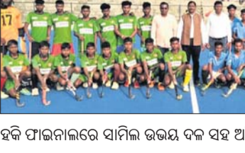
ହକି ପାଇନାଲରେ ସାମିଲ ଉଭୟ ଦଳ ସହ ଅତିଥି ବୃନ୍ଦା ।

ସମ୍ବଲପୁର, ୧୪/୧୨ (ଭବାନୀ ଶଙ୍କର ଭୋଇ) ଯୁମୁନୁରାଠାରେ ନୂଆ-ଓ ମୁଖ ଓଡ଼ିଶା ପକ୍ଷରୁ କୁଳ ସ୍ତରୀୟ କ୍ରୀଡ଼ା ପ୍ରତିଯୋଗିତା ଆୟୋଜିତ ହୋଇଛି। ଏଥିରେ ବିଭିନ୍ନ ପଞ୍ଚାୟତର ଚିମକ୍ତି ନେଇ ହକି, ଫୁଟବଲ ଓ କ୍ରିକେଟ ପ୍ରତିଯୋଗିତା ହୋଇଥିଲା। ହକିରେ ୧୨ଟି ଦଳ ଅଂଶଗ୍ରହଣ କରିଥିବା ବେଳେ ଗୁରୁବାର ପାଇନାଲ ଖେଳ ଛାପୁଣ୍ଡା ଓ ହକି ଟୁର୍ଣ୍ଣା ସେକ୍ଟର ଯୁମୁନୁରା ଦଳ ମଧ୍ୟରେ ଅନୁଷ୍ଠିତ ହୋଇଥିଲା। ପାଇନାଲ ଖେଳରେ ୧-୧ ଗୋଲରେ ଉଭୟ ଦଳ ଡ୍ର ରହିବା ପରେ ପେନାଲ୍ଟିରେ ୩-୨ ଗୋଲ ହେଇ ଛାପୁଣ୍ଡା ଦଳ ବିଜୟୀ ହୋଇଥିଲା।