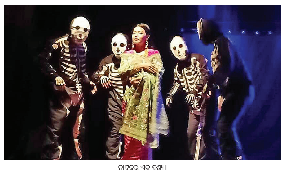
ନାଟକର ଏକ ଦୃଶ୍ୟ।