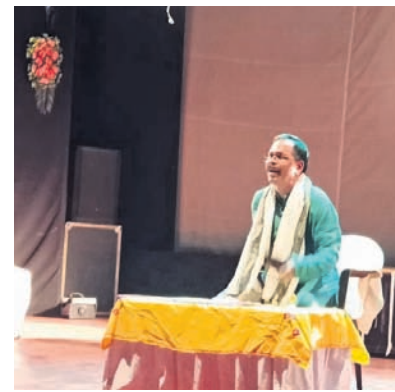
ନାଟକ 'ଅନାମର ଆତ୍ମଲିପି'ର ଏକ ଦୃଶ୍ୟ।

ପାର୍କରେ ଭୋଜିଭାତ ପ୍ରଦାନ କରାଯାଇଛି। ପାର୍କରେ ଭୋଜିଭାତ ପ୍ରଦାନ କରାଯାଇଛି। ପାର୍କରେ ଭୋଜିଭାତ ପ୍ରଦାନ କରାଯାଇଛି।