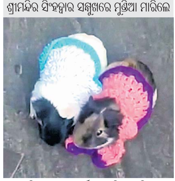
ସିଂହଦ୍ୱାର ସମ୍ମୁଖରେ ୨ ଚକିତ ମୂଷା ମୂର୍ତ୍ତିଆ ମାରିଲେ

ପୁରୀ, ୧୫୧୨ (ଅଜିତ ମହାନ୍ତି) ମହାପ୍ରଭୁଙ୍କ ଦର୍ଶନ ପାଇଁ ଦେବତା, ଦାନବ, ଯକ୍ଷ, ମାନବ ଯେପରି ଆତୁର ହୋଇଥାନ୍ତି, ସେହିପରି ପଶୁପକ୍ଷୀ ମଧ୍ୟ ତାଙ୍କ ଆଶିଷ ଲାଭ କରିବା ପାଇଁ ବ୍ୟାକୁଳ ହୋଇ ଉଠିଥାନ୍ତି। କେବଳ ମଣିଷ ନୁହେଁ କ୍ଷୁଦ୍ର ପ୍ରାଣୀ ଓ କୀଟ ମଧ୍ୟ ମହାପ୍ରଭୁଙ୍କ ଭକ୍ତ। ଏହାର ଏକ ନିଆରା ଉଦାହରଣ ରୁରୁବାର ସକାଳେ ଶ୍ରୀମନ୍ଦିର ପରିସରରେ ଦେଖିବାକୁ ମିଳିଛି। ଭକ୍ତ ମୂଷା ଶ୍ରୀମନ୍ଦିର ସିଂହଦ୍ୱାର ସମ୍ମୁଖରେ ମୂର୍ତ୍ତିଆ ମାରିବା ସହ 'ଜୟ ଜଗନ୍ନାଥ' କହିଲେ ଠୁଁ ଠୁଁ କରିବା ଦୃଶ୍ୟ ସମସ୍ତଙ୍କୁ ଯେତିକି ବିଚ୍ଚିତ କରିଛି, ସେତିକି