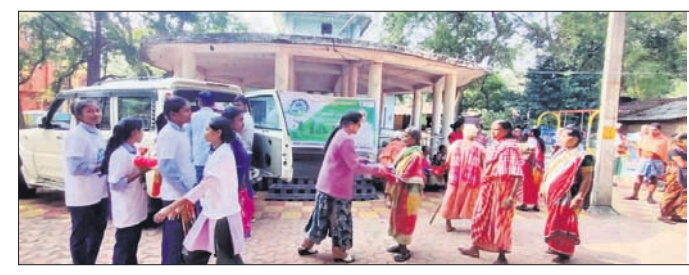
ଅନୁଷ୍ଠାନ ପକ୍ଷରୁ ପୁସ୍ତକ ଓ ଶୀତବସ୍ତ୍ର ବିତରଣ କରାଯାଇଛି।

ରାଉରକେଲା ଯୁକ୍ତାଧିକାରୀଙ୍କ ସମ୍ମାନରେ ଶ୍ରୀମତୀ