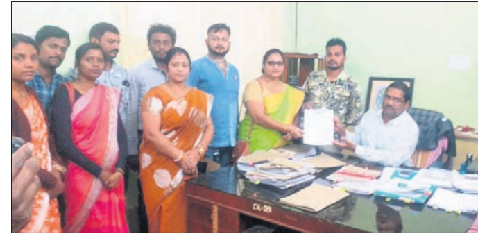
ଅତିରିକ୍ତ ଜିଲ୍ଲାପାଳଙ୍କୁ ଦାବିପତ୍ର ପ୍ରଦାନ କରାଯାଇଛି।

ବଡ଼ଗାଁ, ୧୫୧୨ (ଅଶୋକ ଷଡ଼ଙ୍ଗୀ): ଯୁବକଙ୍କ ଝୁଲନ୍ତା ମୃତଦେହ ଜବତ କରାଯାଇଛି।