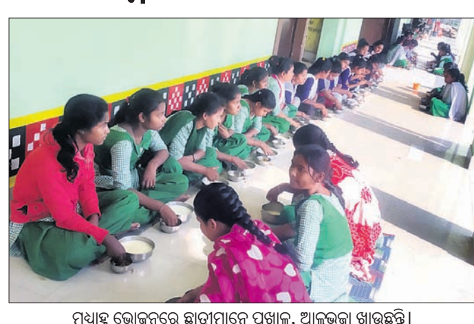
ମଧ୍ୟାହ୍ନ ଭୋଜନରେ ଛାତ୍ରୀମାନେ ପଖାଳ, ଆଳୁଭଜା ଖାଇଛନ୍ତି ।