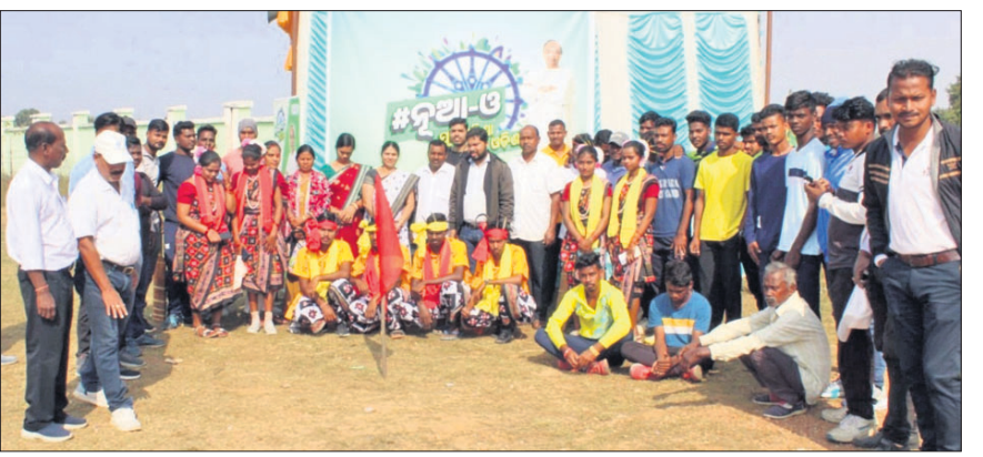
ଉଦ୍ଘାପନୀ ଉପରେ ଅତିଥିଙ୍କ ସହିତ ଖେଳାଳି ଓ ସାଂସ୍କୃତିକ ଦଳ।