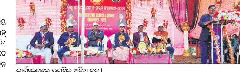
କାର୍ଯ୍ୟକ୍ରମରେ ଉପସ୍ଥିତ ଅତିଥି ବୃନ୍ଦ।