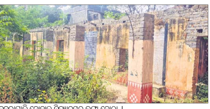
କବରାପାଳି ନୋଡାଲ ବିଦ୍ୟାଳୟର ଛାତ୍ରୀ କୋଠା ।

କୋଠିରେ ଛାତ୍ର ମାନଙ୍କ ସଂଖ୍ୟା ବଢ଼ିଛି। ସେଥିପାଇଁ ସ୍କୁଲରେ ଗୋଟିଏ କୋଠିରେ ଦୁଇଟି ଶ୍ରେଣୀର ଛାତ୍ରାଛାତ୍ରୀ ସାଙ୍ଗରେ ବସି ପାଠ ପଢ଼ିବାକୁ ବାଧ୍ୟ ହେଉଛନ୍ତି। ବିଦ୍ୟାଳୟରେ ଅଧିକ ଶ୍ରେଣୀ ପର୍ଯ୍ୟନ୍ତ ରହିଥିବା ବେଳେ ଏତି କୋଠା ମଧ୍ୟରୁ ମାତ୍ର ୪ଟି ଛାତ୍ରାଛାତ୍ରୀ ପାଠ ପଢ଼ିବା ସ୍ଥିତିରେ ରହିଛି।