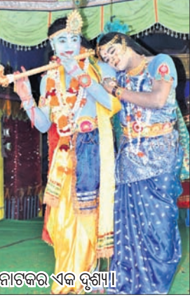
ନାଟକର ଏକ ଦୃଶ୍ୟ। ନିର୍ଦ୍ଦେଶନା ଦେଇଛନ୍ତି ଭଗବାନ ଶ୍ରୀକୃଷ୍ଣଙ୍କ ଲାଳା ବା ପୌରାଣିକ କଥାବସ୍ତୁକୁ ନାଟକ ଶୈଳୀରେ ପ୍ରତିନିଧି ପରିବେଷଣ ହେଉଛି।