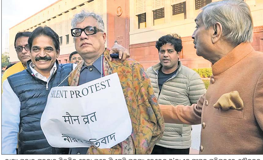
ରାଜ୍ୟ ସଭାରୁ ରୁରୁବାର ନିଲମ୍ବିତ ହେବା ପରେ ଡିଏମ୍ ସଦସ୍ୟ ତେରେକ୍ ଓ'ତ୍ରାଏନ୍' ସଂସଦ ପରିସରରେ ମୌନବ୍ରତ କରି ବିରୋଧ ପ୍ରଦର୍ଶନ କରୁଛନ୍ତି। ତାଙ୍କ ସହ କଂଗ୍ରେସ ଏମ୍ପି କେ.ସି. ବେଣ୍ଟଗୋପାଳ ଉପସ୍ଥିତ ଅଛନ୍ତି।