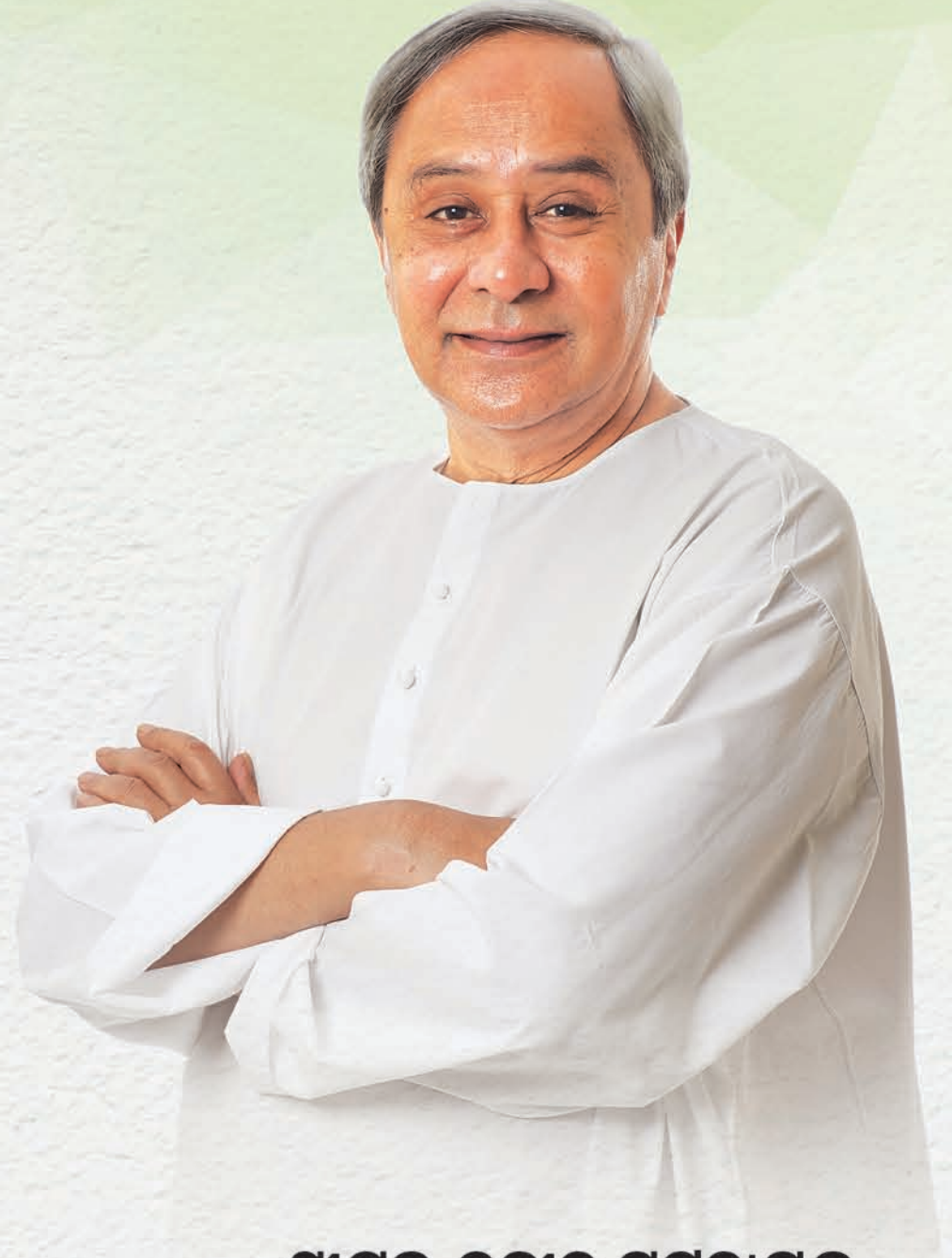
ଶ୍ରୀଯୁକ୍ତ ନବୀନ ପଟ୍ଟନାୟକ ମାନ୍ୟବର ମୁଖ୍ୟମନ୍ତ୍ରୀ