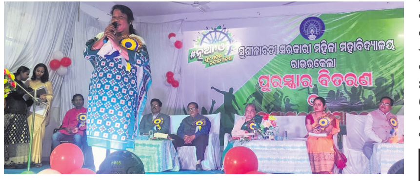
ସମାରୋହରେ ମୁଖ୍ୟଅତିଥି ଉଦ୍‌ଘାଟନ ଦେଉଛନ୍ତି।

ମୁଖ୍ୟମନ୍ତ୍ରୀଙ୍କ ପ୍ରତିଦାନ ଉଦ୍‌ଘାଟନ ହେଉଛି। ମୁଖ୍ୟମନ୍ତ୍ରୀଙ୍କ ପ୍ରତିଦାନ ଉଦ୍‌ଘାଟନ ହେଉଛି।