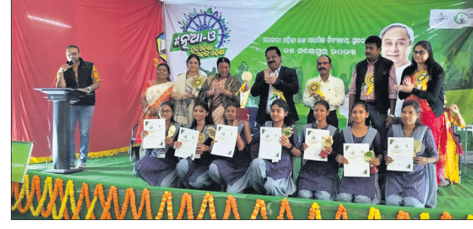
ଆଧିକାରୀଙ୍କ ସମ୍ମାନରେ ଶ୍ରୀମତୀ