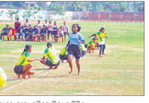
୬ଟି କ୍ରୀଡ଼ାରେ ଭାଗନେବେ ୨୨ଶହରୁ ଊର୍ଦ୍ଧ୍ୱ କ୍ରୀଡ଼ାବିତ୍

କ୍ରୀଡ଼ା ପ୍ରତିଭା ଅନ୍ୱେଷଣ ଆରମ୍ଭ। କ୍ରୀଡ଼ା ପ୍ରତିଭା ଅନ୍ୱେଷଣ ଆରମ୍ଭ।