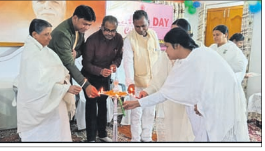
ଅତିଥିମାନେ ପ୍ରଦୀପ ପ୍ରସ୍ତୁତ କରୁଛନ୍ତି।