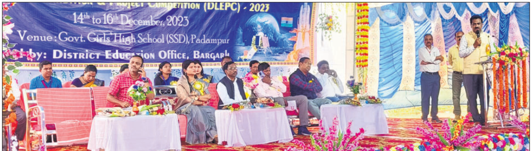
ବାଲି ବୈଜ୍ଞାନିକ ପ୍ରଦର୍ଶନୀ ଉଦଘାଟନା ସମାରୋହରେ ଅତିଥିବୃନ୍ଦ ।

ବରଗଡ଼ ଜିଲା ପଦ୍ମପୁରରେ ସରକାରୀ ଉଚ୍ଚ ବିଦ୍ୟାଳୟ (ଆଦିବାସୀ କଲ୍ୟାଣ ବିଭାଗ)ର ଅନୁଷ୍ଠାନିକ ପଦ୍ମପୁରରେ ଗୁରୁବାର ଜିଲ୍ଲାପ୍ରତ୍ୟାୟ ବାଲି ବୈଜ୍ଞାନିକ ପ୍ରଦର୍ଶନୀ, ବିଜ୍ଞାନ ମେଳା ଓ ପ୍ରକଳ୍ପ ପ୍ରତିଯୋଗିତା ଉଦଘାଟିତ ହୋଇଛି।