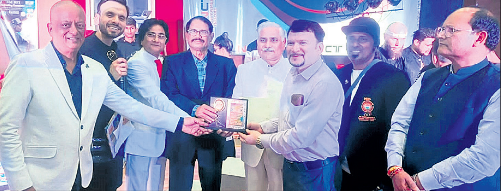
ଆଜି ଓଡ଼ିଶା ଡ୍ୟାଣ୍ଟ ଫ୍ଲୋର୍ସ ଆୟୋଜିତ ଯଶସୀପୁର ପ୍ରଦାନ କରାଯାଇଛି।

ଭୁବନେଶ୍ୱର, ୧୫।୧୨ (ତପନ ସାଲ୍) ଭୋପାଳର ଏକ ସର୍ବସମ୍ମିତ ବିଶ୍ୱବିଦ୍ୟାଳୟ ପରିସରରେ ଗାନ୍ଧୀ ଜାତୀୟ ବ୍ରେକ୍ ଡ୍ୟାଣ୍ଟ ଚାମ୍ପିୟନଶିପ୍ ଅନୁଷ୍ଠିତ ହୋଇଯାଇଛି। ଏଥିରେ ପ୍ରଥମଥର ପାଇଁ ଓଡ଼ିଶା ରାଜ୍ୟ ଡ୍ୟାଣ୍ଟ ଫ୍ଲୋର୍ସ ଟିମ୍ ଭାଗନେଇ ଅଭିଜ୍ଞତା ହାସଲ କରିଛି। ଡ୍ୟାଣ୍ଟ ଏକ ଅଭିଜ୍ଞତା ହୋଇଛି। ଡ୍ୟାଣ୍ଟ ଏକ ଅଭିଜ୍ଞତା ହୋଇଛି। ଡ୍ୟାଣ୍ଟ ଏକ ଅଭିଜ୍ଞତା ହୋଇଛି।