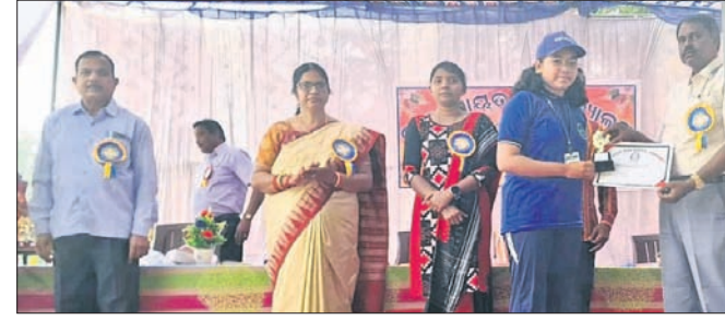
ବାର୍ଷିକୋତ୍ସବରେ ଯୋଗ ଦେଇଥିବା ଅତିଥିବୃନ୍ଦ ।

ବରଗଡ଼ ଜିଲା ଅଥାବିରା ବ୍ଲକ ଅନ୍ତର୍ଗତ ପତ୍ରାପାଳି ପ୍ରାଥମିକ ବିଦ୍ୟାଳୟର ହାଇସ୍କୁଲର ବାର୍ଷିକୋତ୍ସବ ଗୁରୁବାର ଅନୁଷ୍ଠିତ ହୋଇଯାଇଛି।