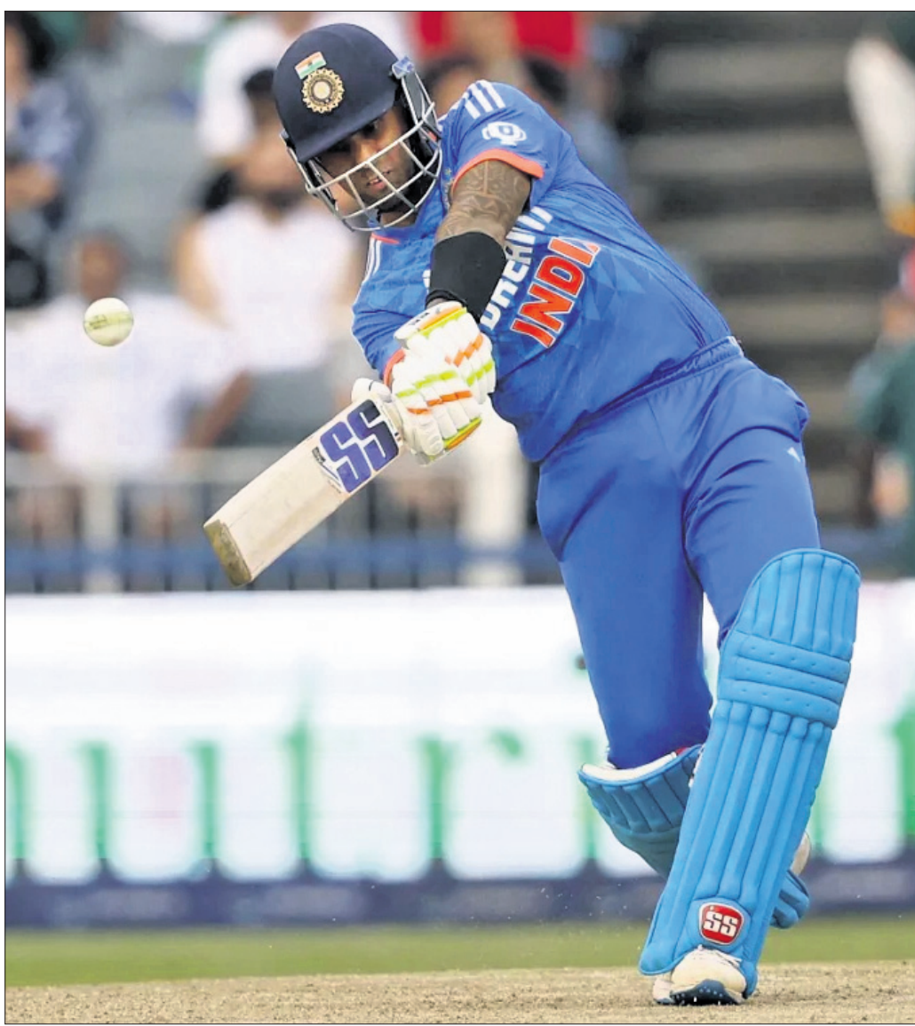
ଶତକାୟ ଲନିଏ ଅବସରରେ ଶର୍ମ ଖେଳୁଛନ୍ତି ସୂର୍ଯ୍ୟକୁମାର ଯାଦବ।

କୋହାଟ୍‌ବର୍ଷ, ୧୫।୧୨ ଭୁବନେଶ୍ୱର ଇନ୍ଦ୍ରପାଦ ଓ ଦକ୍ଷିଣ ଆଫ୍ରିକା ମଧ୍ୟରେ ଖେଳା ଯାଇଥିବା ଅନ୍ତର୍ଜାତୀୟ ଟି୨୦ ମ୍ୟାଚ୍‌ରେ ଶତକ ହାସଲ କରିଛନ୍ତି ଭାରତର ସୂର୍ଯ୍ୟକୁମାର ଯାଦବ। ସେ ଟି୨୦ରେ ନିଜର ଚତୁର୍ଥ ଶତକ ହାସଲ କରିଥିବା ବେଳେ ଯଶସୀ ଜୟସାଲଙ୍କ ସହ ଶତକାୟ ଭାଗୀଦାରି କରିଥିଲେ। ଫଳରେ ଭାରତ ୨୦ ଓଭରରେ ୬ ରଜକେଟ୍ ହରାଇ ୨୦୧ ରନ୍ କରିଥିଲା। ସମାନ ଏକାଦଶ ସହିତ ଭାରତ ଓଷ୍ଟ୍ରେଲିଆ ବେଳେ ଟ୍ୱେଣ୍ଟି ଟ୍ୱାଣ୍ଟି ନେଇଥିଲେ ସୂର୍ଯ୍ୟକୁମାର ଯାଦବ। ଭାରତ ପକ୍ଷରୁ ଶୁଭମନ ଶିଲ୍ (୧୨) ଓ ଯଶସୀ ଜୟସାଲ(୬୦) ଓପନ କରି ୨୯ ରନ୍ ଯୋଡ଼ିଥିଲେ। ପ୍ରଥମ ଦୁଇ ଓଭରରେ ଉଭୟ ଖେଳାଳି ୨୯ ରନ୍ ଯୋଡ଼ିଥିଲେ। ନାଣ୍ଡେ ବର୍ଗର ପ୍ରଥମ ଓଭରକୁ ୧୪ ଓ ଏଡେନ୍ ମାର୍କରାମଙ୍କ ବ୍ଲିଟାୟ ଓଭରକୁ ୧୫ ରନ୍ ସଂଗ୍ରହ କରିଥିଲେ ଉଭୟ ଓପନର। ତେବେ ତୃତୀୟ ଓଭରରେ କେଶବ ମହାରା ଲଗାତାର ବଲ୍‌ରେ ୨ ରଜକେଟ୍ ନେଇ ଭାରତକୁ ସଙ୍କଟରେ ପକାଇଥିଲେ। କ୍ରଶ୍ ଶର୍ମ୍ ଖେଳିବାକୁ ଯାଇ ଶିଲ୍ ଲେଉଟି ବିଟିଙ୍ଗର ହୋଇଥିବା ବେଳେ ପରବର୍ତ୍ତୀ ବଲ୍‌ରେ ତିକକ ବର୍ମା ପ୍ୟାଟିଲିୟର୍ ପେରିଥିଲେ। ୨୯ ରନ୍‌ରେ ଦୁଇ ରଜକେଟ୍‌ର ପତନ ଘଟିଥିବା ବେଳେ କ୍ରିକ୍‌ରେ ଯୋଗ ଦେଇଥିଲେ ଅଧିନାୟକ ସୂର୍ଯ୍ୟକୁମାର ଯାଦବ। ତୃତୀୟ ରଜକେଟ୍‌ରେ ଜୟସାଲଙ୍କ ସହିତ ୧୧୨ ରନ୍ ଯୋଡ଼ିବା ସହ ଭାରତକୁ ଦୁଇ ଓଭରରେ ପଛଆଇଥିଲେ। ଆରମ୍ଭରୁ ସୂର୍ଯ୍ୟ କୁମାର ରୋଟେଟ୍ କରୁଥିବା ବେଳେ ଜୟସାଲ