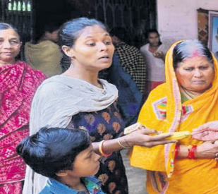
ମାତୃହାୟର ଅନ୍ତେବାସୀଙ୍କୁ ସଂସ୍କାର ସ୍ଥଳ କର୍ତ୍ତୃପକ୍ଷ ଭେଟୁଛନ୍ତି ।

ବରଗଡ଼, ୧୪।୧୨(ପ୍ରେମାନନ୍ଦ ଖମାରୀ) ବରଗଡ଼ ସଂସ୍କାର ଇନ୍ଦ୍ରନିଧୀଶିଳା ସ୍ଥଳ କର୍ତ୍ତୃପକ୍ଷ ସମେତ ଛାତ୍ରାଛାତ୍ରୀ, ଶିକ୍ଷକମାନେ ଗୁରୁବାର ସହର ଉପକଣ୍ଠ ଶାନ୍ତି ଚପୋବନ ଆଶ୍ରମ, ମାତୃହାୟ, ବାନପୁର ସମେତ ବିଭିନ୍ନ ଆନାଥାଶ୍ରମ, ଗୋଷାଳାୟ ପରିବର୍ତ୍ତନରେ ଯାଇଥିଲେ। ସେମାନେ ପ୍ରତିଷ୍ଠା ଦିବସ ତଥା ସ୍ଥଳର ପ୍ରତିଷ୍ଠା ସାହିତ୍ୟୀ ଭେଦୀ ସାହିତ୍ୟିକ ଜଃ ଦିବସ ଅବସରରେ ଏହି କାର୍ଯ୍ୟକ୍ରମ ହୋଇଥିଲା।