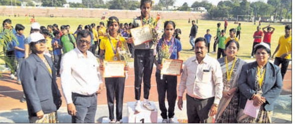
ଜ୍ଞାତା ପ୍ରତିଯୋଗୀଙ୍କୁ ସମ୍ମାନିତ କରାଯାଇଛି।

ବିଶ୍ୱାଦାୟୀ ସ୍ଥିତ ସରସ୍ୱତୀ ବିଦ୍ୟାଳୟର ସ୍କୁଲର ୪୨ତମ ବୁଲ୍ ଦିନିଆ ବାର୍ଷିକ ଜ୍ଞାତା ଉତ୍ସବ ଉଦ୍ଦିଷ୍ଟରେ ପରଦେ ପଡ଼ିଆରେ ପ୍ରଧାନଶିକ୍ଷକ ବିଭୀଷଣ ଦାଶଙ୍କ ଅଧ୍ୟକ୍ଷତାରେ ଗୁରୁବାର ଅନୁଷ୍ଠିତ ହୋଇଯାଇଛି।