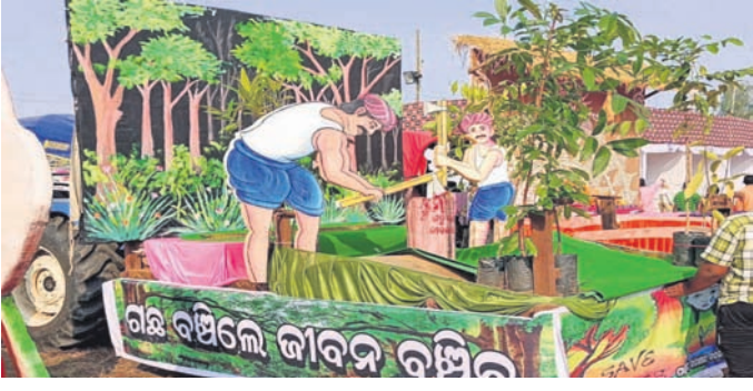
ମହୋତ୍ସବରେ ଜଙ୍ଗଲ ସୁରକ୍ଷାର ବାର୍ତ୍ତା ପ୍ରଚାର କରାଯାଇଛି।

ପଦ୍ମପୁର, ୧୪।୧୨(ପ୍ରସାସ୍ତ ଦାଶ): ନଗର ପରିକ୍ରମା ଓ ଝାଳି ଶୋଭାଯାତ୍ରା ରାଜବୋଧାସର ଲୋକ ମହୋତ୍ସବ-୨୦୨୩ର ଗୁରୁବାର ସଂସ୍କୃତିକ ଦର୍ଶନୀଙ୍କ ପଦ୍ମପୁର ଜଙ୍ଗଲ ବିଭାଗର ଚରଫରୁ