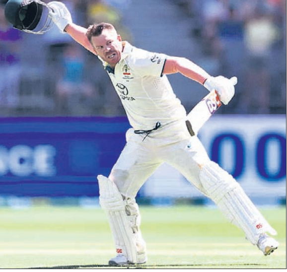
ଶତକ ହାସଲ ପରେ ଡେଭିଡ୍ ଓର୍ଲର।

ଗୁରୁବାର ପାକିସ୍ତାନ ଓ ଅଷ୍ଟ୍ରେଲିଆ ମଧ୍ୟରେ ଅନୁଷ୍ଠିତ ପ୍ରଥମ ଟେଷ୍ଟରେ ଅଷ୍ଟ୍ରେଲିଆ ୫ ରୁକେଟ ବିନିମୟରେ ୩୪୬ ରନ୍ ସଂଗ୍ରହ କରିଛି। ବିଦାୟୀ ଟେଷ୍ଟ ଖେଳୁଥିବା ଓପନିଙ୍ଗ ବ୍ୟାଟର ଡେଭିଡ୍ ଓର୍ଲର ଶତକ ହାସଲ କରିବା ସହିତ ଚମତ୍କାର ୧୬୪ ରନ୍ ସ୍କୋର କରିଥିଲେ। ଅଷ୍ଟ୍ରେଲିଆ ଚମ୍ପି ଜିତି ବ୍ୟାଟିଂ କରିଥିଲା। ଦୁଇ ଓପନର ଡେଭିଡ୍ ଓର୍ଲର (୧୬୪) ଓ ଉପମାନ ଖାଜା (୪୧) ପ୍ରଥମ ରୁକେଟରେ ୧୨୬ ରନ୍ ଯୋଡ଼ି ଅଷ୍ଟ୍ରେଲିଆକୁ ଏକ ଦ୍ରୁତ ଆରମ୍ଭ ପ୍ରଦାନ କରିଥିଲେ। ଓଭର ପଞ୍ଚା ୫ରୁ ଅଧିକ ହାରରେ ଦୁଇ ଓପନର ରନ୍ ସଂଗ୍ରହ