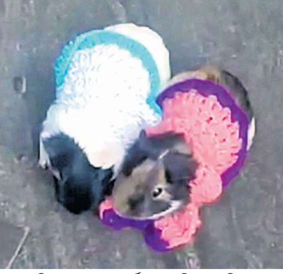
ସିଂହଦ୍ୱାର ସମ୍ମୁଖରେ ୨ ଚକିତ ମୁଣ୍ଡିଆ ମାରିଛନ୍ତି

ମହାପ୍ରଭୁଙ୍କ ମୂର୍ତ୍ତିକ ଭକ୍ତ ଶ୍ରୀମନ୍ଦିର ସିଂହଦ୍ୱାର ସମ୍ମୁଖରେ ମୁଣ୍ଡିଆ ମାରିଲେ