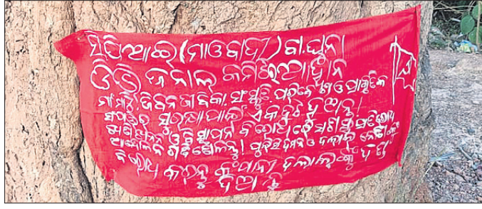
ମାଓବାଦୀଙ୍କଦ୍ୱାରା ଲାଗିଥିବା ମାଓବାଦୀ ପୋଷ୍ଟର ଓ ବ୍ୟାନର।

ରାୟଗଡ଼ା/ଡିକିରି, ୧୪।୧୨(ଆଖିଷ ରଞ୍ଜନ ପଣ୍ଡା/ପ୍ରଫୁଲ୍ଲ କୁମାର ବେହେରା) ରାୟଗଡ଼ା ଜିଲ୍ଲା କାଶୀପୁର ବ୍ଲକ ମାଓବାଦୀ ଓ ଅତ୍ୟାଧିକାରୀ ପଞ୍ଚାୟତର ଅଧିକାରୀଙ୍କ ଗ୍ରାମରେ ମାଓବାଦୀ ବ୍ୟାନର ଓ ପୋଷ୍ଟର ଲାଗିଥିବା ଗୁରୁବାର ସକାଳୁ ଦେଖିବାକୁ ମିଳିଛି। ଜିଲ୍ଲାରେ ଖଣି ଖନନକୁ ବିରୋଧକରି ମାଓବାଦୀ ସଂଗଠନ ବାଧ୍ୟତା-ସ୍ୱାମୀୟତା-ନାଗାବଳୀ ଡିଭିଜନାଲ କମିଟି ପକ୍ଷରୁ ଏହି ପୋଷ୍ଟର ଲଗାଯାଇଥିବା ଉଲ୍ଲେଖ ରହିଛି। ମାଓବାଦୀ ଗ୍ରାମର ରାଜସ୍ୱ ନିରାଶ୍ରୟ କାର୍ଯ୍ୟାଳୟ ନିକଟରେ ଥିବା ଏକ ଆୟ ଗଛରେ ୨ଟି ପୋଷ୍ଟର ଓ ବ୍ୟାନର ଲାଗିଥିବା ସୂଚନା ମିଳିଛି। ସେହିଭଳି ଅତ୍ୟାଧିକାରୀ ପଞ୍ଚାୟତର