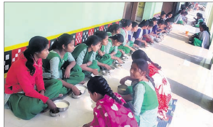
ମଧ୍ୟାହ୍ନ ଭୋଜନରେ ଛାତ୍ରୀମାନେ ପଖାଳ, ଆଲୁଭଜା ଖାଉଛନ୍ତି।