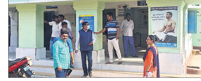
ଧାନନଗର ଗୋଷ୍ଠୀ ସ୍ଵାସ୍ଥ୍ୟକେନ୍ଦ୍ର ପରିଦର୍ଶନେ ଅଧିକାରୀମାନେ।