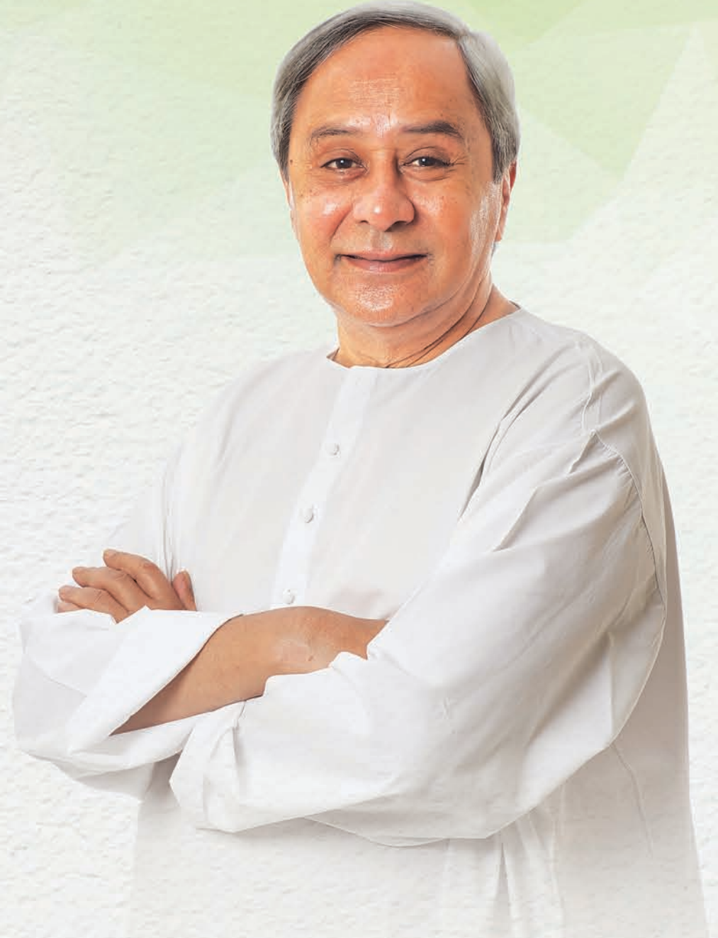
ଶ୍ରୀଯୁକ୍ତ ନବୀନ ପଟ୍ଟନାୟକ ମାନ୍ୟବର ମୁଖ୍ୟମନ୍ତ୍ରୀ