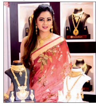
ମୂଲ୍ୟ ପାଇବା ସହିତ ଅତିରିକ୍ତ ରିହାତି ମଧ୍ୟ ପାଇବେ । ବର୍ତ୍ତମାନର ପୁନା ଘର ଉଚ୍ଚ ଥିଲାବେଳେ ଗ୍ରାହକମାନେ ଏହି ମେଲ୍ ମାଧ୍ୟମରେ ନିଜ ମନପସନ୍ଦ ଆକର୍ଷଣୀୟ ୨୦୦ଗ୍ରାମରୁ ୨୦୦୦ଗ୍ରାମ ପର୍ଯ୍ୟନ୍ତ ବିବାହ ଅଳଙ୍କାରର ଗଢ଼ା ମଧୁର ଉପରେ ୫୦% ପର୍ଯ୍ୟନ୍ତ ରିହାତି ପାଇପାରିବେ । ସେହିପରି ହାରା ମୂଲ୍ୟ ଉପରେ ୩୦% ପର୍ଯ୍ୟନ୍ତ ରିହାତି ଓ ସିଲ୍‌ଭର ଉପରେ ୩୫% ରିହାତି ଗ୍ରାହକମାନେ ପାଇପାରିବେ ।

ଓଡ଼ିଶାର ସର୍ବବୃହତ୍ ଲୁଗାଲୁଗା ଥରୁଣତୀ ଲୁଗାଲୁଗା ପକ୍ଷରୁ 'ଗୋଲ୍ଡ ଏକ୍ସପୋଜି ମେଲ୍'ର ଶୁଭାରମ୍ଭ କରାଯାଇଛି । ବିଶେଷକରି ଚଳିତ ବିବାହ ଋତୁକୁ ଲକ୍ଷ୍ୟ ରଖାଯାଇ ଏହି ମେଲ୍‌ର ଆୟୋଜନ ହୋଇଛି । ମେଲ୍ ମାଧ୍ୟମରେ ଗ୍ରାହକମାନେ ସେମାନଙ୍କର ପୁରୁଣା ପୁନାଗ୍ରହଣା ବ୍ୟବହାର ପାଇବା ସହ ରାଜ୍ୟରେ ପ୍ରଥମଥର ପାଇଁ ଅତିରିକ୍ତ ରିହାତି ଫୁଟିଆ ସମସ୍ତ ଏକ୍ସପୋଜିଟି ହଲ୍‌ମାର୍କେଟିଂ ଆକର୍ଷଣୀୟ ବିବାହ ପୁନାଗ୍ରହଣା ପାଇପାରିବେ । ବର୍ତ୍ତମାନ ୨୧,୪୫୭ (୨୧,୪୫୭.୬୫) ଅଙ୍କରେ କାରବାର ବନ୍ଦ କରିଥିଲା । ଅପରପକ୍ଷରେ ବିଏସ୍‌ଏଲ୍ ସେନ୍‌ସେଟିଭ୍ ମିଡ଼କ୍ୟାପ୍ ଓ ସ୍ମଲ୍‌କ୍ୟାପ୍ ଶୈୟାରଗୁଡ଼ିକର ଲକ୍ଷ୍ୟକୁ ସହିତ ଏନଏସ୍‌ଏଲ୍ ନିର୍ମୂଳକମାପ, ସ୍ମଲ୍‌କ୍ୟାପ୍ ଏବଂ ବ୍ୟାଙ୍କ ଶୈୟାରଗୁଡ଼ିକର କାରବାରରେ ମଧ୍ୟ ବୁକି ହୋଇଛି ।