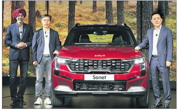
ଦୈନିକୀୟ ସହ ବର୍ତ୍ତମାନ ସୋନେଟରେ ୨୫ଟି ଅଧିକ ସୁରକ୍ଷା ଦୈନିକୀୟତା ସାମିଲ ରହିଛି । ଏ ସମ୍ପର୍କରେ କିଆ ଇଣ୍ଡିଆର ଏନିଟି ଲେନ୍ ଫଲୋଇଂ ଆସିଷ୍ ଆଦି ଅନ୍ତର୍ଭୁକ୍ତ ରହିଛି । ସେହିଭଳି ୧୫ ହାଲ୍-ସେଟ୍

ଭୁବନେଶ୍ୱର, ୧୫.୧୨.୨୩ (ଅଭିଜିତ ଦାଶ) ଅନ୍ୟତମ ଉତ୍ସାହୀ ଅନାବରଣ କମ୍ପାନୀ କିଆ ଇଣ୍ଡିଆର ବହୁ ପ୍ରତୀକ୍ଷିତ ତଥା ଅତ୍ୟାଧୁନିକ ଜ୍ଞାନକୌଶଳରେ ନିର୍ମିତ ଅଲ୍‌ନ୍ୟୁ କିଆ ସୋନେଟର ଅନାବରଣ ସର୍ବଭାରତୀୟ ସ୍ତରରେ ହୋଇଯାଇଛି । ଏପରିକି କମ୍ପାନୀର ବିକ୍ରୟ ସର୍ବଶ୍ରେଷ୍ଠ ଉତ୍ପାଦନ ସୋନେଟର ନୂତନ ଅବତାରକୁ ଭାରତ ବଜାରରେ ବିକ୍ରୟ ଶୁଭାରମ୍ଭ ସମ୍ପର୍କରେ ଘୋଷଣା କରାଯାଇଛି । ବିଶେଷକରି ୧୦ଟି ସ୍ୱୟଂଚାଳିତ ଦୈନିକୀୟ ସହ ଉଚ୍ଚ ମଡେଲ ଆତାସରେ ସୁସଜ୍ଜିତ ହୋଇଛି । ଯେଉଁଥିରେ ପ୍ରଫୁଲ୍ଲ କୋଲିକନ୍ ଆଭୋଷାଦାନୀ ଆସିଷ୍ (ଏଫସିଏ), ଲିଫ୍ଟିଂ ହେଭିଲିଂ ଡିଭାଇସ୍ ଆର୍ଟି ଏବଂ ଲେନ୍‌ ଫଲୋଇଂ ଆସିଷ୍ ଆଦି ଅନ୍ତର୍ଭୁକ୍ତ ରହିଛି । ସେହିଭଳି ୧୫ ହାଲ୍-ସେଟ୍