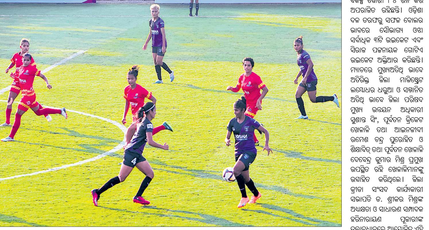
ଭୁବନେଶ୍ୱର କ୍ୟାମ୍ପରେ ଫୁଟବଲ ଆରେନାରେ ଶୁକ୍ରବାର ଓଡ଼ିଶା ଏଫସି ଓ ସ୍ତର୍କ ଓଡ଼ିଶା ମଧ୍ୟରେ ଅନୁଷ୍ଠିତ ମ୍ୟାଚ।

ରୁନ୍। ଏହାର ୧ ମିନିଟ ପରେ ସେ ବ୍ୟକ୍ତିଗତ ଦ୍ୱିତୀୟ ଗୋଲ ଦେଇ ଓଡ଼ିଶା ଏଫସିର ବିଜୟ ଏକପ୍ରକାର ନିଶ୍ଚିତ କରି ଦେଇଥିଲେ। ୮୭ତମ ମିନିଟରେ ବିଜୟୀ ଦଳ ପକ୍ଷରୁ ମାଳତୀ ମୁଖା ୪ର୍ଥ ଗୋଲଟି ଦେଇଥିଲେ। ଓଡ଼ିଶା ଏଫସି ଏହାର ପରବର୍ତ୍ତୀ ମ୍ୟାଚ ୨୦ ତାରିଖରେ ଗୋକୁଳମ୍ ନେକରକୁ ଭେଟିବ। କଳିଙ୍ଗ ଷ୍ଟାଡିୟମରେ ଏହି ମ୍ୟାଚ ଅନୁଷ୍ଠିତ ହେବ। ସ୍ତର୍କ ଓଡ଼ିଶା ୨୧ ତାରିଖରେ ବେଙ୍ଗାଲୁରୁରେ କିକ୍‌ଷ୍ଟାର୍ଟ ଏଫସି ସହ ମୁକାବିଲା କରିବ।