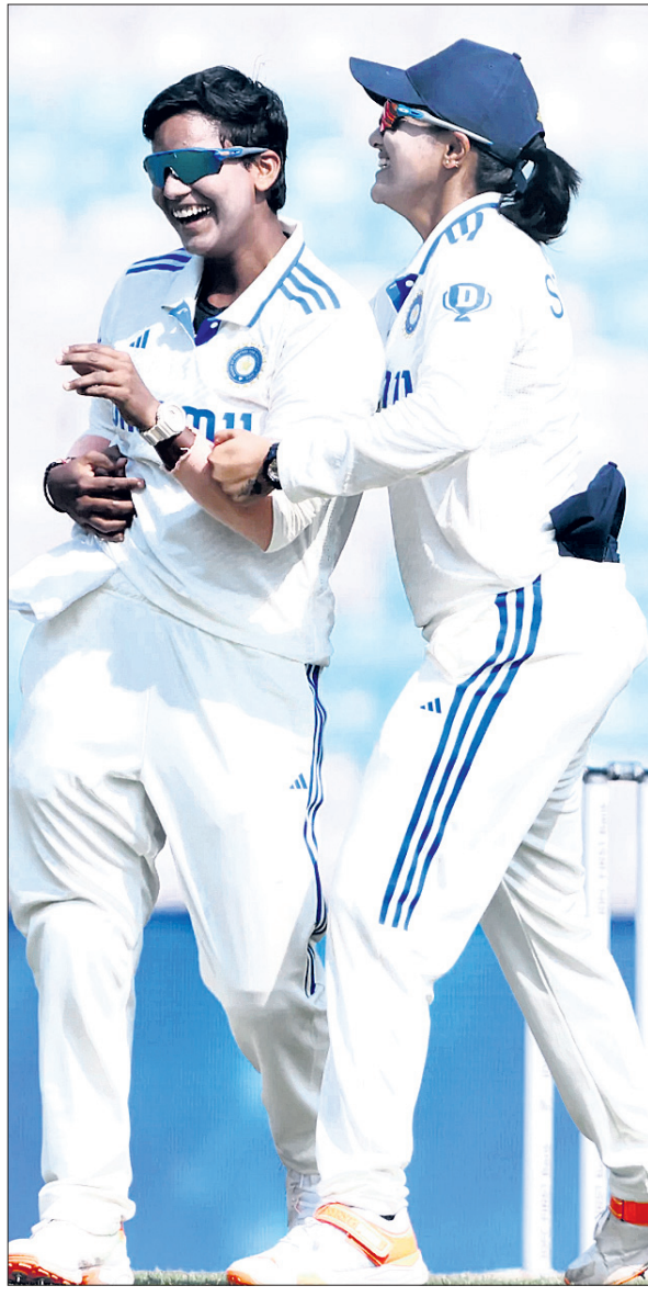
ଦୀପ୍ତି ଶର୍ମା (ବାମ)ଙ୍କୁ ସାଥୁ ଖେଳାଳିଙ୍କ ବଧେଇ।

ନଭି ମୁମ୍ବାଇ, ୧୫.୧୨ ଦୀପ୍ତି ଶର୍ମାଙ୍କ ଅଲ୍ରାଉଣ୍ଡ ପ୍ରଦର୍ଶନ (ଅର୍ଦ୍ଧଶତକ ଏବଂ ୫ ଉଇକେଟ) ବଳରେ ଭାରତ ଘରୋଇ ମାଟିରେ ଇଂଲଣ୍ଡ ବିପକ୍ଷରେ ପ୍ରଥମ ମହିଳା ଟେଷ୍ଟ ଜିତିବା ସମ୍ଭାବନା ସୃଷ୍ଟି କରିଛି। ଏଠାରେ ଚଳିଥିବା ଇଂଲଣ୍ଡ ବିପକ୍ଷ ଏକମାତ୍ର ଟେଷ୍ଟରେ ଭାରତ ଦ୍ୱିତୀୟ ଦିବସ ଖେଳ ଶେଷସୁଦ୍ଧା ୪୭୮ ରନରେ ଅଗ୍ରଣୀଭାବ କରିଛି, ଯାହାକି ମହିଳା କ୍ରିକେଟ ଟେଷ୍ଟ ■ ଦୀପ୍ତି ଶର୍ମାଙ୍କୁ ୫ ଉଇକେଟ ସମ୍ପାଦନା ■ ହିତାୟ ବିପକ୍ଷରେ ୧୯ ଉଇକେଟର ପତନ