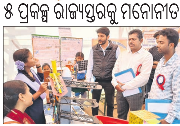
ଅତିଥିମାନେ ପ୍ରକଳ୍ପ ବୁଲି ଦେଖୁଛନ୍ତି।

କୋରାପୁଟ ଜିଲ୍ଲାପ୍ରଧାନ ବାଲି ବୈଜ୍ଞାନିକ ପ୍ରଦର୍ଶନୀ ସ୍ଥାନୀୟ ସରକାରୀ ଉଚ୍ଚ ବିଦ୍ୟାଳୟରେ ଅନୁଷ୍ଠିତ ହୋଇଛି। ଏଠାରେ ପ୍ରଦର୍ଶିତ ହୋଇଥିବା ୭୦ ପ୍ରକଳ୍ପରୁ ୫ଟି ରାଜ୍ୟସ୍ତରକୁ ମନୋନୀତ ହୋଇଛି।