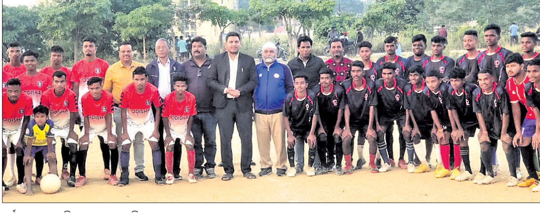
ଚୁର୍ଣ୍ଣାମେଣ୍ଟରେ ଅତିଥିକ ସହ ଖେଳାଳିମାନେ ।

ସମ୍ବଲପୁର, ୧୬୧୨ (ବି.ଶଙ୍କର) ନୂଆ-ଓ କାର୍ଯ୍ୟକ୍ରମ ଅଧୀନ ଫୁଟବଲ ଚୁର୍ଣ୍ଣାମେଣ୍ଟ ଶନିବାର ସମ୍ବଲପୁର ମହାନଗର ନିଗମ କାର୍ଯ୍ୟକ୍ରମ ଖେଳପଡ଼ିଆରେ ଅନୁଷ୍ଠିତ ହୋଇଯାଇଛି ।