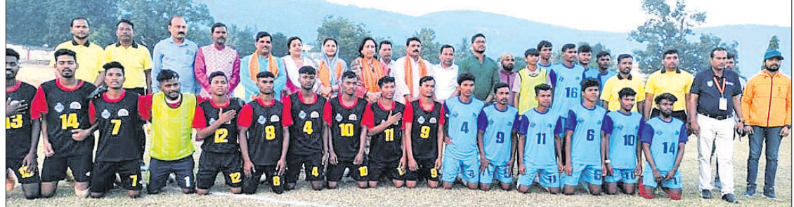
ଅତିଥିକ ଗହଣରେ ଖେଳାଳିମାନେ ।

ଦେବଗଡ଼, ୧୬୧୨ (ଶଶୀକା ଶେଖର ଝାଙ୍କର) ଭାରତ ସରକାରଙ୍କ ସାଂସଦ କ୍ରୀଡ଼ା ମହୋତ୍ସବ ଅବସରରେ 'ବିକାଶ ଫାଇଣେସନ ଟ୍ରଷ୍ଟ' ଓ 'ଆମେ ଓଡ଼ିଆ' ଅନୁଷ୍ଠାନର ମିଳିତ ଆହୁକୃତ୍ୟରେ ଦେବଗଡ଼ ଜିଲ୍ଲାବାସୀ ଶ୍ୱତିତ୍ୱମଣିରେ ଚାଲିଥିବା ବାଜିରାଉତ କପ୍ ଫୁଟବଲ ପ୍ରତିଯୋଗିତା ଶନିବାର ଉଦ୍‌ଯାପିତ ହୋଇଯାଇଛି।