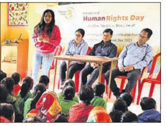
ମାନବ ଅଧିକାର ସମକ୍ଷୟ ସଚେତନତା କାର୍ଯ୍ୟକ୍ରମ ।