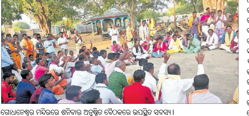
ଗୋଧନେଶ୍ୱର ମନ୍ଦିରରେ ଶନିବାର ଅନୁଷ୍ଠିତ ବୈଠକରେ ଉପସ୍ଥିତ ସଦସ୍ୟ।

ଅମରପାଲି, ୧୬/୧୨ (ପାଠାୟନ ସାହୁ) ଭୁବନେଶ୍ୱର ଜିଲ୍ଲା ବୀରମହାରାଜପୁର ବ୍ଲକ ଜଟେସିଂହା ପଞ୍ଚାୟତର ଗୋଧନେଶ୍ୱର ଶୈବପୀଠରେ ଶନିବାର ଗୋଧନେଶ୍ୱର ସଂକ୍ରାନ୍ତି ସଂଘର ଏକ ବୈଠକ ଅନୁଷ୍ଠିତ ହୋଇଯାଇଛି।