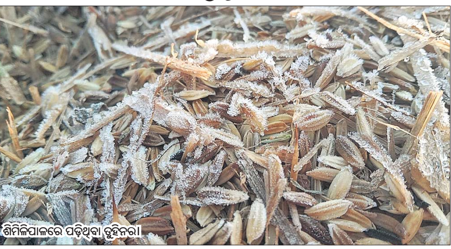
ଶିଳିପାଳରେ ପଡ଼ିଥିବା ବୁଝିବରା