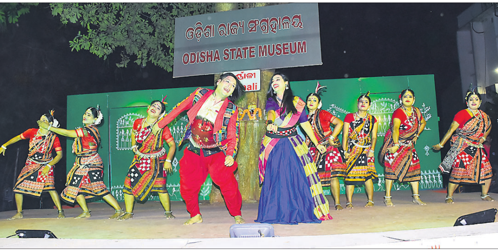
ରାଜ୍ୟ ସଂଗ୍ରହାଳୟଠାରେ ଶନିବାର ଅନୁଷ୍ଠିତ ସାଂସ୍କୃତିକ ସନ୍ଧ୍ୟା 'ମଲ୍ଲୁ ମୁ୍ୟଜିୟମ'ରେ ଶିଳ୍ପୀମାନେ ସମ୍ବଲପୁରୀ ନୃତ୍ୟ ପରିବେଷଣ କରୁଛନ୍ତି।

ମଞ୍ଚେଶ୍ୱର ଥାନା ଅନ୍ତର୍ଗତ ପଳାଶୁଣୀ ସ୍ତେଚକୋଳ ପାଖରେ ଥିବା ଏକ ସ୍କୁଲ ଯୋକାଳକୁ ଶନିବାର ତୋରି କରି ଫେରାର ହେଉଥିବା ବେଳେ ଜଣେ ଯୁବକଙ୍କୁ ୩ ସ୍କୁଲ ଛାତ୍ର କାବୁ କରିଥିଲେ। ଏହାପରେ ସ୍ଥାନୀୟ ଲୋକମାନେ ଉକ୍ତ ଚୋରଙ୍କୁ ମାଡ଼ମାରି ପୋଲିସ୍ ଜିମାରେ ଦେଇଥିଲେ। ତେବେ ଉନ୍ୟତ୍ତ ଲୋକଙ୍କ ଆକ୍ରମଣରେ ଅଭିଯୁକ୍ତ ଯୁବକ ସାମାନ୍ୟ ଆହତ ହୋଇଛନ୍ତି। ପୋଲିସ୍ ତାଙ୍କୁ ଥାନାରେ ଅଟକ ରଖି ପଚରାଉଚରା କରୁଛି। ଅପରପକ୍ଷେ ଛାତ୍ରମାନଙ୍କ ଏଭଳି ସାହସକର ପାଇଁ ସ୍ଥାନୀୟ ଲୋକେ ସେମାନଙ୍କୁ ଧନ୍ୟବାଦ ସହ ସାବାସି ଜଣାଇଛନ୍ତି।