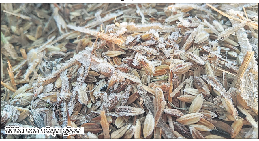
ଶିମିଳିପାଳରେ ପଡ଼ିଥିବା ତୁଷାର