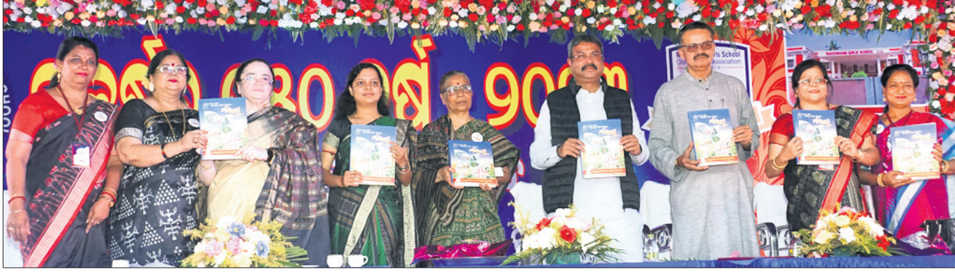
ରେଭେନ୍ସା ବାଳିକା ଉଚ୍ଚ ବିଦ୍ୟାଳୟ ୧୫୦ତମ ପୂର୍ଣ୍ଣ ସମାରୋହରେ ଅତିଥିମାନେ ସ୍ମରଣିକା 'ମଞ୍ଜରୀ' ଉନ୍ମୋଚନ କରୁଛନ୍ତି।

ରେଭେନ୍ସା ବାଳିକା ଉଚ୍ଚ ବିଦ୍ୟାଳୟର ରିମୋନାସ୍ତ ଐତିହାସିକ ଓଡ଼ିଶାର ନବଜାଗରଣ କେନ୍ଦ୍ରରୁ ଏହି ସ୍ଥାନ ଥିଲା। ତେଣୁ ଏହାକୁ ଏକ ସଂଗ୍ରହାଳୟ ରୂପେ ଦେଇ ଦର୍ଶନୀୟ ସ୍ଥାନ କରାଯାଉ। ପୁରୀ ମନ୍ଦିର, ମାଁ କଟକଚଣ୍ଡୀ ଯେତିକି ପବିତ୍ର ଏହି ସ୍ଥଳ ଯେତିକି ପବିତ୍ର। ତେଣୁ ତାକୁ ସେହିଭଳି ଭାବରେ ଆମେ ତିଆରି କରିବା ବୋଲି ବିଦ୍ୟାଳୟର ୧୫୦ତମ ପୂର୍ଣ୍ଣ ସମାରୋହରେ ପୂଜ୍ୟ ଅତିଥିଭାବେ ଯୋଗଦେଇ କେନ୍ଦ୍ରମନ୍ତ୍ରୀ ଧର୍ମେନ୍ଦ୍ର ପ୍ରଧାନ ଏହା କହିଛନ୍ତି। ବିଦ୍ୟାଳୟ ପରିସରରେ ଶନିବାର ଅନୁଷ୍ଠିତ କାର୍ଯ୍ୟକ୍ରମରେ ଧର୍ମେନ୍ଦ୍ର ଆହୁରି କହିଛନ୍ତି, ଏହି ବିଦ୍ୟାଳୟରେ ମୋ ମାଁ ପଢ଼ୁଥିଲେ। ସେଥିପାଇଁ ଏହି ବିଦ୍ୟାଳୟ ପ୍ରତି ମୋର ଅଧିକ ଆତ୍ମୀୟତା ରହିଛି। ବର୍ତ୍ତମାନ ମହିଳାମାନେ ଆଗଧାଡ଼ିକୁ ଯିବାର ସମୟ ଆସିଛି। କାରଣ ପ୍ରଧାନମନ୍ତ୍ରୀ ମୋଦି ଜି-୨୦ ମଞ୍ଚରେ ମହିଳା ନେତୃତ୍ୱ ଆଧାରିତ ଭାରତର ସମାଜ ବ୍ୟବସ୍ଥା ହେବ ବୋଲି ଘୋଷଣା କରିଥିଲେ। ଆଗାମୀ ଦିନରେ ଦେଶ ଗଠନରେ ମହିଳାମାନେ ଗୁରୁତ୍ୱପୂର୍ଣ୍ଣ ଭୂମିକା ନିର୍ବାହ କରିବେ। ଏଥିରେ ମୋର ବିଶ୍ୱାସ ରହିଛି ବୋଲି ସେ କହିଥିଲେ। ୨୦୩୬ ସବୁ ଓଡ଼ିଆଙ୍କ ପାଇଁ ଅତ୍ୟନ୍ତ ଗୌରବର ଦିନ ହେବ। ସେହି ସମୟରେ ମହିଳା ନେତୃତ୍ୱ ଆଧାରିତ ଯେତେବେଳେ