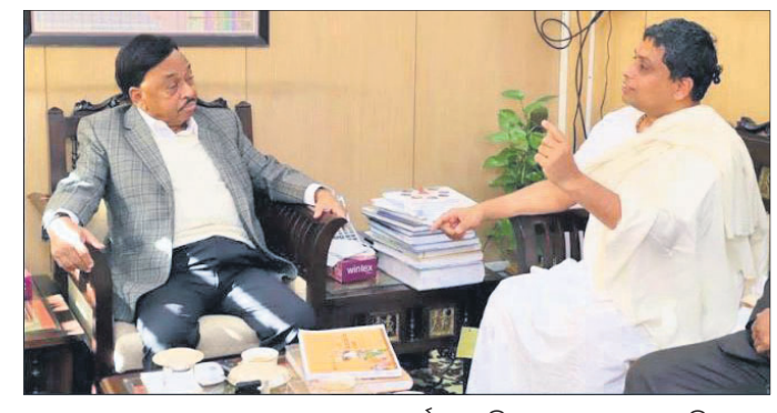
କେନ୍ଦ୍ରମନ୍ତ୍ରୀ ନାରାୟଣ ଚାନ୍ଦୁ ରାଣେଙ୍କ ସହ ଆଚାର୍ଯ୍ୟ ବାଲକ୍ରିଷ୍ଣା ଆଲୋଚନା କରୁଛନ୍ତି।