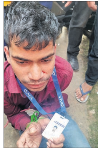
ଭୁବନେଶ୍ୱର, ୧୬।୧୨ (ସୂର୍ଯ୍ୟକାନ୍ତ ବେହେରା)

ମଞ୍ଚେଶ୍ୱର ଥାନା ଅନ୍ତର୍ଗତ ପଳାଶୁଣୀ ସ୍ତେଚକୋଳ ପାଖରେ ଥିବା ଏକ ସ୍କୁଲ ଯୋକାଳକୁ ଶନିବାର ତୋରି କରି ଫେରାର ହେଉଥିବା ବେଳେ ଜଣେ ଯୁବକଙ୍କୁ ୩ ସ୍କୁଲ ଛାତ୍ର କାବୁ କରିଥିଲେ। ଏହାପରେ ସ୍ଥାନୀୟ ଲୋକମାନେ ଉକ୍ତ ଚୋରଙ୍କୁ ମାଡ଼ମାରି ପୋଲିସ୍ ଜିମାରେ ଦେଇଥିଲେ। ତେବେ ଉନ୍ୟତ୍ତ ଲୋକଙ୍କ ଆକ୍ରମଣରେ ଅଭିଯୁକ୍ତ ଯୁବକ ସାମାନ୍ୟ ଆହତ ହୋଇଛନ୍ତି। ପୋଲିସ୍ ତାଙ୍କୁ ଥାନାରେ ଅଟକ ରଖି ପଚରାଉଚରା କରୁଛି। ଅପରପକ୍ଷେ ଛାତ୍ରମାନଙ୍କ ଏଭଳି ସାହସକର ପାଇଁ ସ୍ଥାନୀୟ ଲୋକେ ସେମାନଙ୍କୁ ଧନ୍ୟବାଦ ସହ ସାବାସି ଜଣାଇଛନ୍ତି।