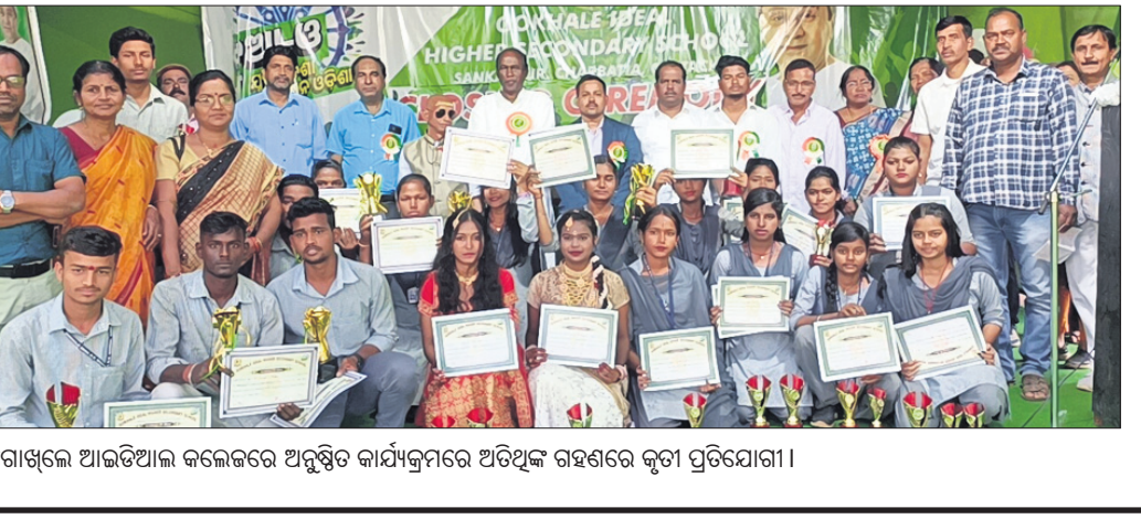
ଗୋଷ୍ଠୀରେ ଆଇଡିଆଲ କଲେଜରେ ଅନୁଷ୍ଠିତ କାର୍ଯ୍ୟକ୍ରମରେ ଅତିଥିଙ୍କ ସମ୍ମାନ ଦେବା ପାଇଁ ପ୍ରତିଯୋଗୀ।