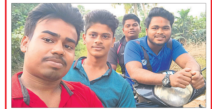
@ ଓମ୍ ଅଭିଜ୍ଞାନ