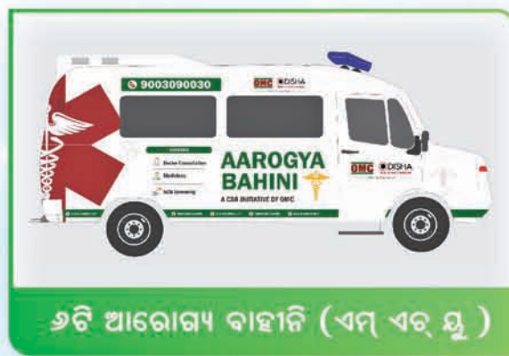
୬ଟି ଆରୋଗ୍ୟ ବାହାନି (ଏମ୍ ଏଚ୍ ୟୁ )