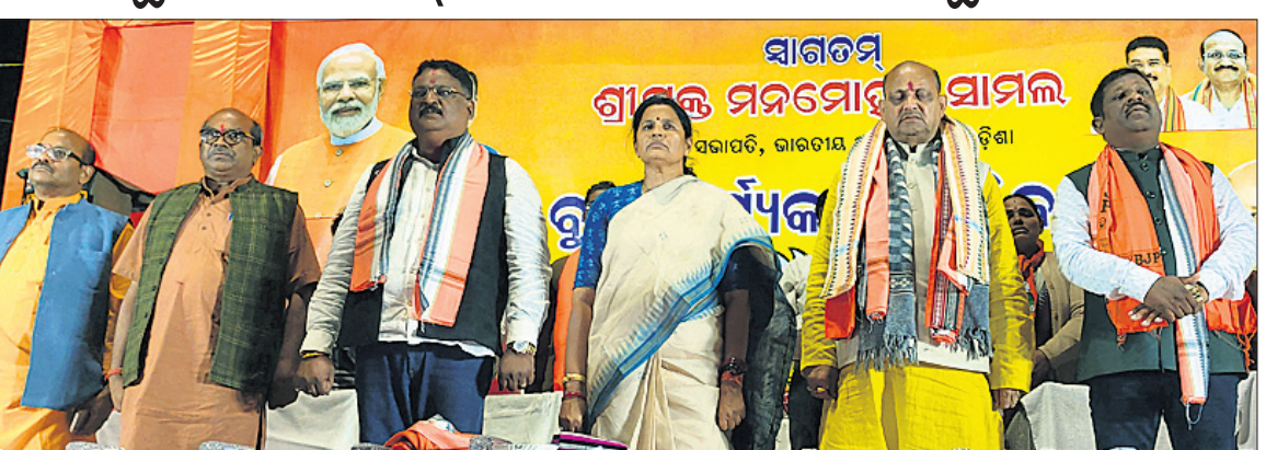
ସମ୍ମିଳନୀରେ ଭାଜପା ରାଜ୍ୟ ସଭାପତି ମନମୋହନ ସାମଲଙ୍କ ସହିତ ଅନ୍ୟ ଅତିଥିବୃନ୍ଦ ।