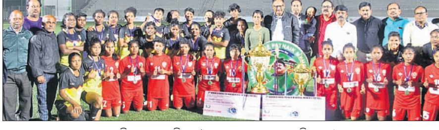
ଅତିଥିଙ୍କ ସହ ଚାମ୍ପିୟନ ଓ ରନରଅପ୍ ଦଳର ଖେଳାଳିମାନେ ।