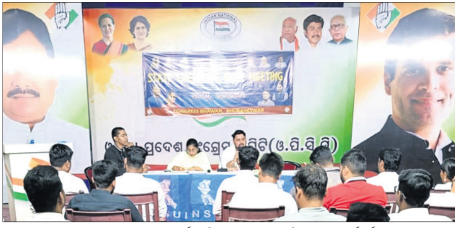
ପ୍ରଦେଶ ଛାତ୍ର କଂଗ୍ରେସର କାର୍ଯ୍ୟକାରୀଣା ବୈଠକରେ ଉପସ୍ଥିତ ନେତା ଓ କର୍ମକର୍ତ୍ତା ।

ଜିଲ୍ଲାପାଳଙ୍କ କାର୍ଯ୍ୟାଳୟ ଆଗରେ 'ନିୟୁଜି କ୍ରାନ୍ତି' ଆନ୍ଦୋଳନ