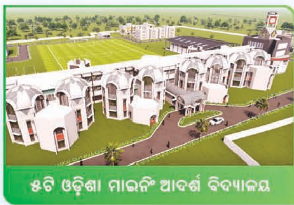
୫ଟି ଓଡ଼ିଶା ମାଉନି ଆଦର୍ଶ ବିଦ୍ୟାଳୟ

୧୮ ଡିସେମ୍ବର ୨୦୨୩ | ସନ୍ଧ୍ୟା ୫ଟା କନ୍ଦେନ୍ଦ୍ରପୁର ସେକ୍ଟର, ଲୋକସେବା ଭବନ, ଭୁବନେଶ୍ୱର