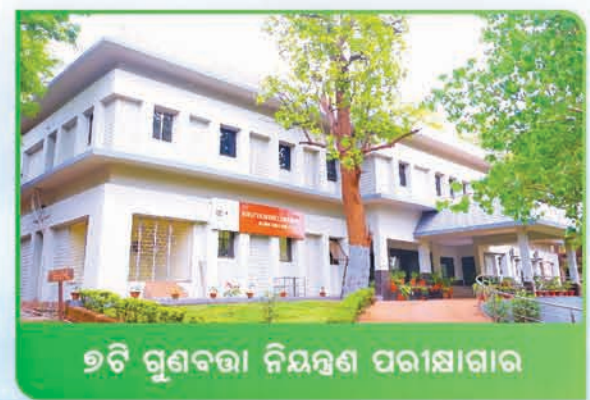
୭ଟି ଗୁଣବତ୍ତା ନିୟନ୍ତ୍ରଣ ପରୀକ୍ଷାଗାର