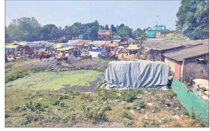
ବ୍ରହ୍ମବରଦା ହାଟ ଅଞ୍ଚଳ।

ରଘୁକୁମ୍ଭରୁ ରୁକ ଅର୍ଚ୍ଚନା ବ୍ରହ୍ମବରଦା ପଞ୍ଚାୟତ ସାମ୍ପ୍ରଦିକ ହାଟର ଉନ୍ନତୀକରଣ ନିମନ୍ତେ ମୁଖ୍ୟମନ୍ତ୍ରୀ, ରାଜ୍ୟ ବିଭାଗ, ଜିଲାପାଳ, ତତ୍ସମ୍ପର୍କିତ ଓ ସ୍ଥାନୀୟ ସରକାରଙ୍କୁ ଚିଠି ଲିଖିତ ଭାବରେ ପରାମର୍ଶ ଦିଆଯାଇଛି। ବ୍ରହ୍ମବରଦା ନଦୀକୂଳ ପାର୍ଶ୍ୱରେ ୩ ଏକରରୁ ଊର୍ଦ୍ଧ୍ୱ ସରକାରୀ ଜମିରେ ଏହି ହାଟ ଅବସ୍ଥିତ। ବ୍ରହ୍ମବରଦା ଏକ ବ୍ୟବସାୟାତ୍ମକ ପେଶ୍ୱରୀ ହୋଇଥିବାରୁ ଏହାର ଚତୁପାଶ୍ୱରେ ଥିବା ୧୦ରୁ ଊର୍ଦ୍ଧ୍ୱ ପଞ୍ଚାୟତବାସୀ ଗୁଣବାର ଓ ଶନିବାର ବହୁଥିବା ଏହି ହାଟରେ ପରିପରିଣା କ୍ରମ ଓ ବିକାଶ ନିମନ୍ତେ ନିର୍ଦ୍ଧାରଣ କରାଯାଉଛି। ହାଟରେ ୫ ହଜାରରୁ ଊର୍ଦ୍ଧ୍ୱ ଲୋକଙ୍କ କର୍ମସମାପନ ହୋଇଥିବା। ଗ୍ରାମାଞ୍ଚଳର ପରିବା ଚାଷୀ, କୁସାର ସମ୍ପ୍ରଦାୟ, ହସ୍ତତନ୍ତ ବସ୍ତ୍ର ବ୍ୟବସାୟୀ, ମାଛ, ମାଂସ ବେପାରୀ, ବିଭିନ୍ନ ପ୍ରକାରର କଂସାବାସନ, ତେଜରାତି ଦୋକାନୀ ଓ କମାର ସମ୍ପ୍ରଦାୟ ବ୍ୟବସାୟୀ କରିବା ପାଇଁ ଏଠାକୁ ଆସିଥାନ୍ତି। ହେଲେ ହାଟରେ ଖରା, ବର୍ଷା, ଝଡ଼ ଓ ଚୋପାନ ସମୟରେ