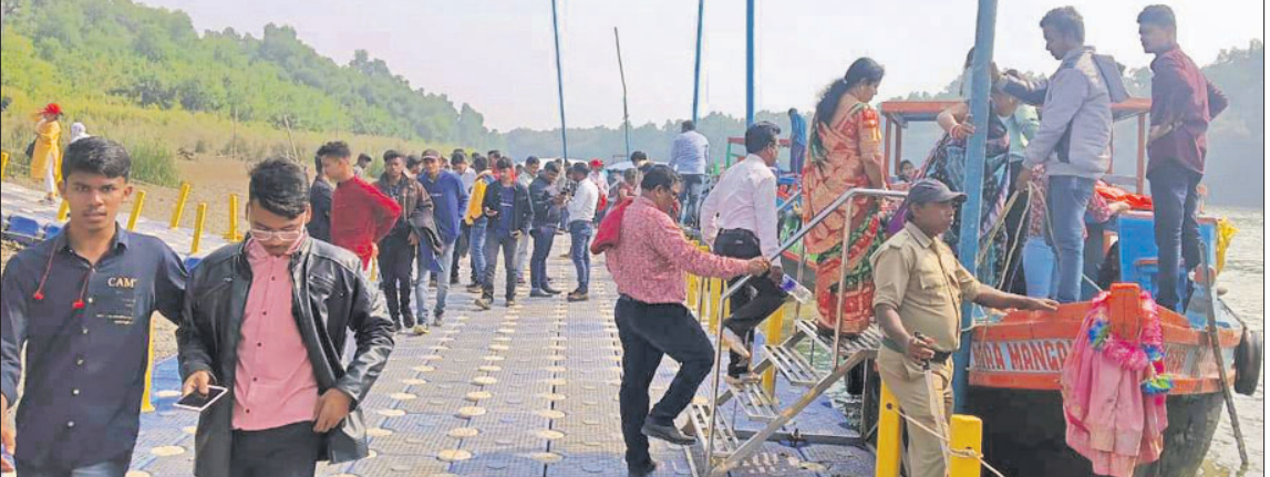
ଭିତରକନିକା ବୁଲିବାକୁ ଆସିଥିବା ପର୍ଯ୍ୟଟକମାନେ ବୋଟରେ ବସିବାକୁ ଯାଉଛନ୍ତି।

ରାଜନଗର, ୧୭୧୨ (ଭାଙ୍ଗର ରାଉତରାୟ): ପ୍ରକୃତିର ଗନ୍ତାଘର ବିଶ୍ୱପ୍ରସିଦ୍ଧ ଭିତରକନିକା ଜାତୀୟ ଉଦ୍ୟାନର ସୌନ୍ଦର୍ଯ୍ୟକୁ ଉପଭୋଗ କରିବା ପାଇଁ ରାଜ୍ୟ ତଥା ରାଜ୍ୟ ବାହାରୁ ୧୧୩୫ଜଣ ପର୍ଯ୍ୟଟକ ପରିଭ୍ରମଣ କରିଛନ୍ତି।