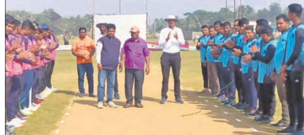
ଅତିଥିଙ୍କ ରହଣରେ ଉଭୟ ଦଳର ଖେଳାଳି।

ରାଜନଗର, ୧୭୧୨ (ରଘୁବ୍ରଜ କୁମାର ଦାସ): ବିତୀୟ ଲିଗ୍ ପ୍ୟାଚରେ ଲୁକ୍‌ଭାଇରସକୁ ହରାଇ ନକ୍ସ ଇଲେଭେନ ବିଜୟୀ ହୋଇଥିଲା। ତୃତୀୟ ମ୍ୟାଚରେ ଓଲୋଡ୍ରେଅରକୁ ହରାଇ ଏନ୍‌ଏସ୍‌ଇ ଇଲେଭେନ ବିଜୟୀ ହୋଇଥିଲା।