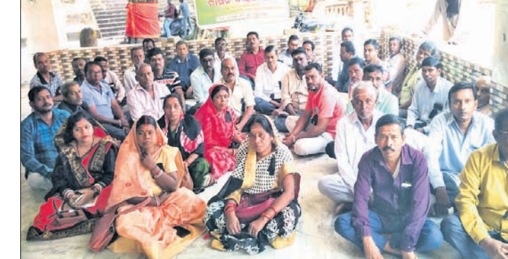
ଖୁରୁରା ବିକ୍ରେତା ସଂଘର କର୍ମଚାରୀମାନେ।

ଓ ୨୮ ମାସର ପ୍ରଧାନମନ୍ତ୍ରୀ ରିଭିଏ କଲ୍ୟାଣ ଅନ୍ନ ଯୋଜନା ବକେୟା ପାରିଶ୍ରମିକ ଅର୍ଥ ପ୍ରଦାନ ସହ ୧୬ ଦିନା ଦାବି ନେଇ କେନ୍ଦ୍ର ସରକାରଙ୍କ ବିରୋଧରେ ଡିସେମ୍ବର ୧୧ ସାନ୍ଧ୍ୟେ ଖୁରୁରା ବିକ୍ରେତାମାନେ କଲ୍ୟାଣ