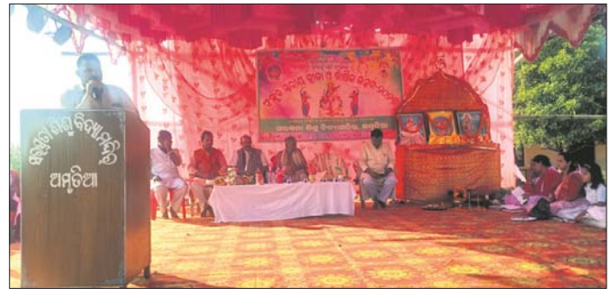
ସଙ୍କଳ୍ପପୁରୀୟ ବାର୍ଷିକ କ୍ରୀଡ଼ା ପ୍ରତିଯୋଗିତାରେ ଯୋଗଦେଇଥିବା ଅଭିଭାବକ ଓ ଅନ୍ୟମାନେ।