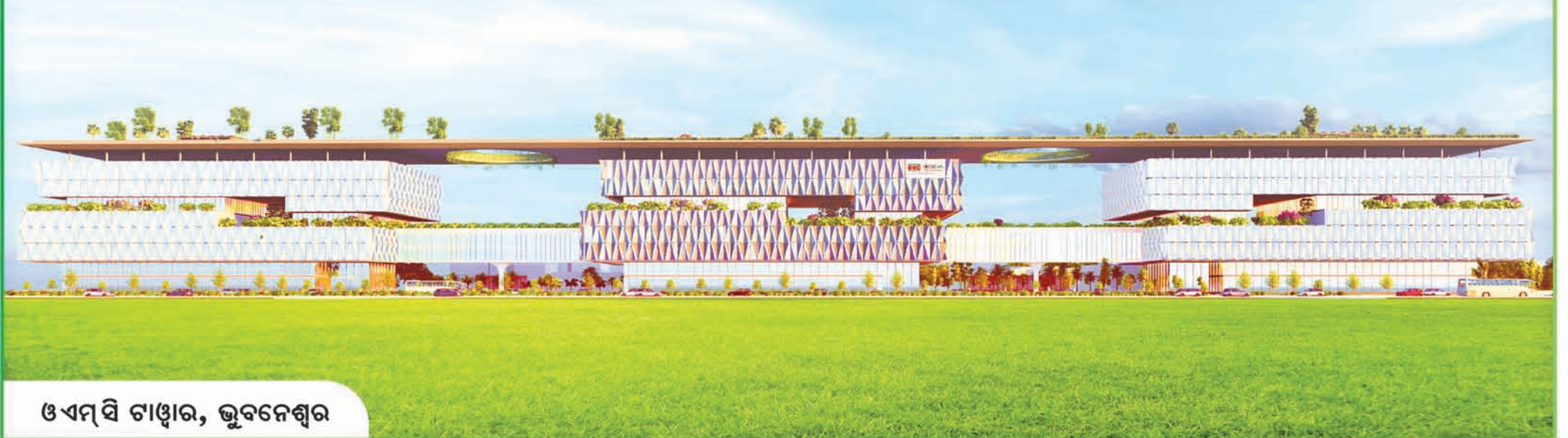
ଓଏମ୍‌ସି ଟାଉର, ଭୁବନେଶ୍ୱର