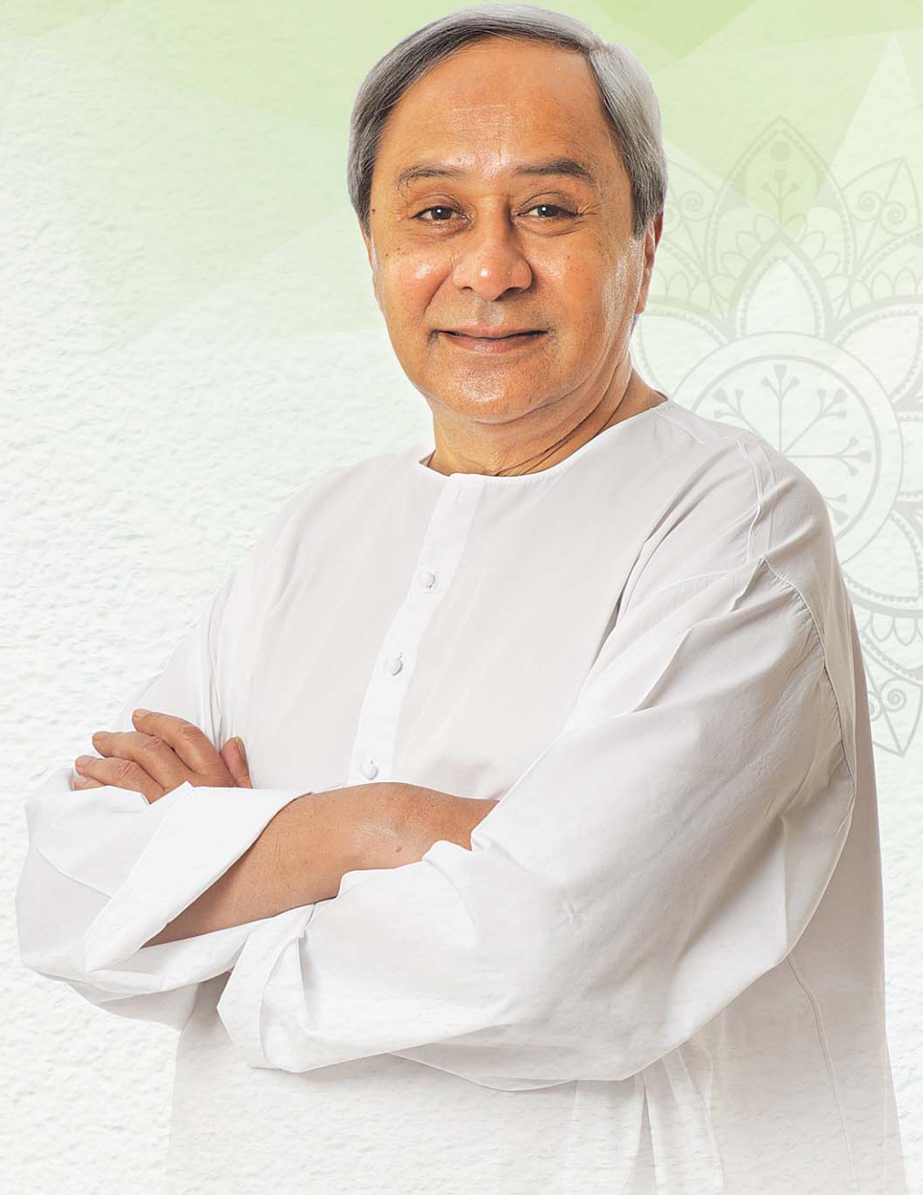
ଶ୍ରୀଯୁକ୍ତ ନବୀନ ପଟ୍ଟନାୟକ ମାନ୍ୟବର ମୁଖ୍ୟମନ୍ତ୍ରୀ