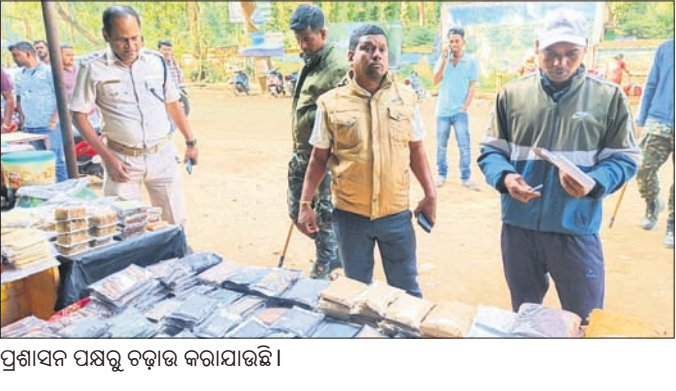
ପ୍ରଶାସନ ପକ୍ଷରୁ ଚକ୍ରାନ୍ତ କରାଯାଇଛି।

ପାରଳାଖେମୁଣ୍ଡି, ୧୭.୧୨.୨୩ (ବିଧିଧାରଣା ପରିଚ୍ଛା) ରାୟଗଡ଼ ବ୍ଲକ ଗୁଚ୍ଛ ଅନୁସୂଚିତ ଜାତି ଓ ଜନଜାତି ସରକାରୀ ଉଚ୍ଚ ବିଦ୍ୟାଳୟରେ