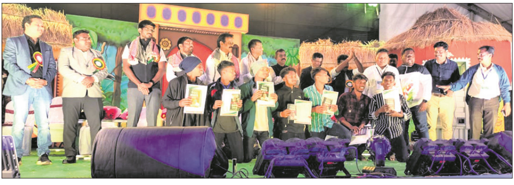
ଶିଶୁ ମହୋତ୍ସବ 'ସର୍ବିୟୁଲ' ଉଦ୍‌ଯାପନ ସମାବେଶରେ ଅତିଥିମାନଙ୍କ ସହିତ ପୁରସ୍କୃତ ପ୍ରତିଭା।

ପାରଳାଖେମୁଣ୍ଡି, ୧୭.୧୨.୨୩ (ବିଧିଧାରଣା ପରିଚ୍ଛା) ରାୟଗଡ଼ ବ୍ଲକ ଗୁଚ୍ଛ ଅନୁସୂଚିତ ଜାତି ଓ ଜନଜାତି ସରକାରୀ ଉଚ୍ଚ ବିଦ୍ୟାଳୟରେ