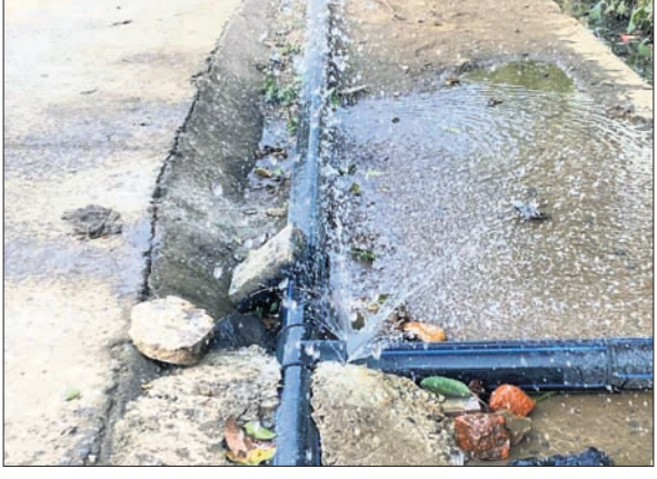
ରେଲୱେ କଲୋନି କାଳୀ ମନ୍ଦିର ନିକଟରେ ପାଇପ୍ ଫାଟି ପାଣି ବାହାଉଛି ।