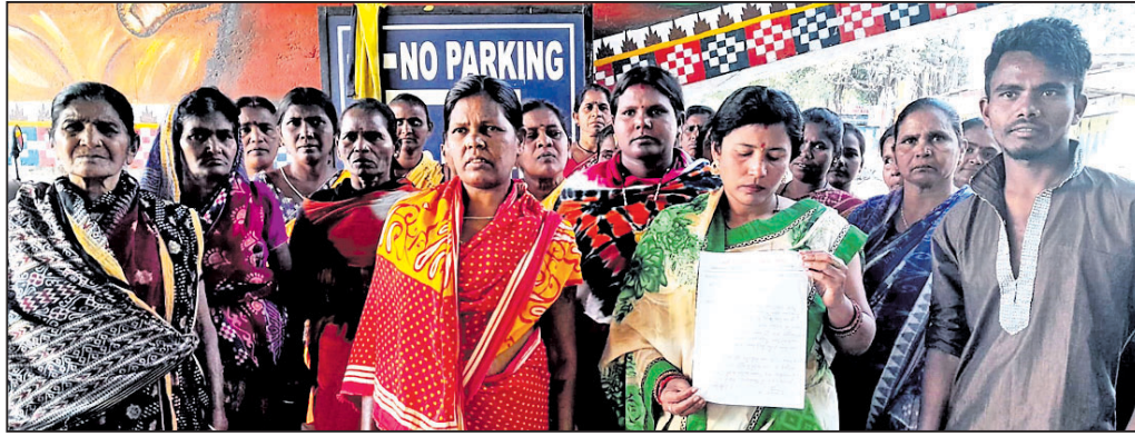
କ୍ଷତିଗ୍ରସ୍ତଙ୍କୁ ଆଶ୍ୱସ୍ତ୍ୟ ଦେବା ପାଇଁ ଜିଲ୍ଲାପାଳଙ୍କୁ ଫେରିବା ବ୍ୟବସ୍ଥା କଲୋନୀ, ଠାକୁରପତାପା ସମ୍ବଳପୁର, ୧୮.୧୨ (ବି.ଶଙ୍କର)

ଜିଲ୍ଲାପାଳଙ୍କୁ ଫେରିବା ବ୍ୟବସ୍ଥା କଲୋନୀ, ଠାକୁରପତାପା ସମ୍ବଳପୁର, ୧୮.୧୨ (ବି.ଶଙ୍କର)