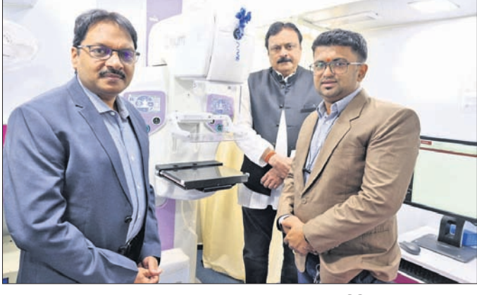
ହାରକୁଦୁଡ଼ି ହିନ୍ଦୁ କୋଲେଜ, ବାଲିକୋଳେଜାରେ ଯୋଗାଣ କରାଯାଇଛି। ସମ୍ବଳପୁର, ୧୮.୧୨ (ବି.ଶଙ୍କର)