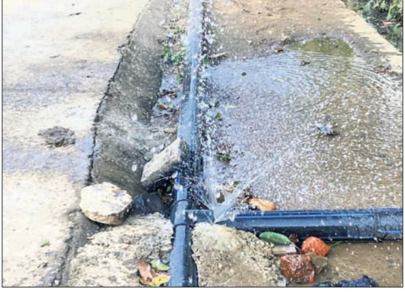
ରେଲୱେ କଲୋନି କାମା ମନ୍ଦିର ନିକଟରେ ପାଇପ୍ ଫାଟି ପାଣି ବାହାଉଛି ।