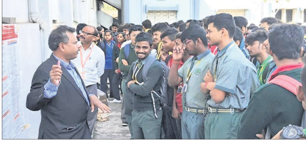
ଅର୍ଜୁନପାଲି ନିକଟରେ ପଦାର୍ଥ ବିଜ୍ଞାନ ବିଭାଗର ସମ୍ପ୍ରସାରିତ କାର୍ଯ୍ୟକ୍ରମ।

ଅର୍ଜୁନପାଲି ନିକଟରେ ପଦାର୍ଥ ବିଜ୍ଞାନ ବିଭାଗର ସମ୍ପ୍ରସାରିତ କାର୍ଯ୍ୟକ୍ରମ। ଅର୍ଜୁନପାଲି ନିକଟରେ ପଦାର୍ଥ ବିଜ୍ଞାନ ବିଭାଗର ସମ୍ପ୍ରସାରିତ କାର୍ଯ୍ୟକ୍ରମ।