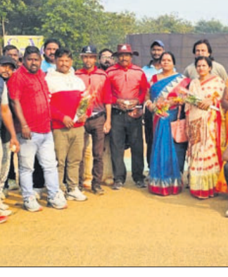
ଅତିଥିମାନଙ୍କ ସହ ଖେଳାଳିବୃନ୍ଦ।

ପାଇଁ ବୈଠକରେ ନିଷ୍ପତ୍ତି ନିଆଯାଇଛି। ଧନୁଯାତ୍ରା ସମୟରେ ଲୁହପାଠ ରୋକିବା ସହ ଦର୍ଶକ, ପର୍ଯ୍ୟଟକଙ୍କ ପାଇଁ ପର୍ଯ୍ୟାପ୍ତ ସୁରକ୍ଷା ବ୍ୟବସ୍ଥା କରାଯିବ ବୋଲି ନିଷ୍ପତ୍ତି ନିଆଯାଇଛି।