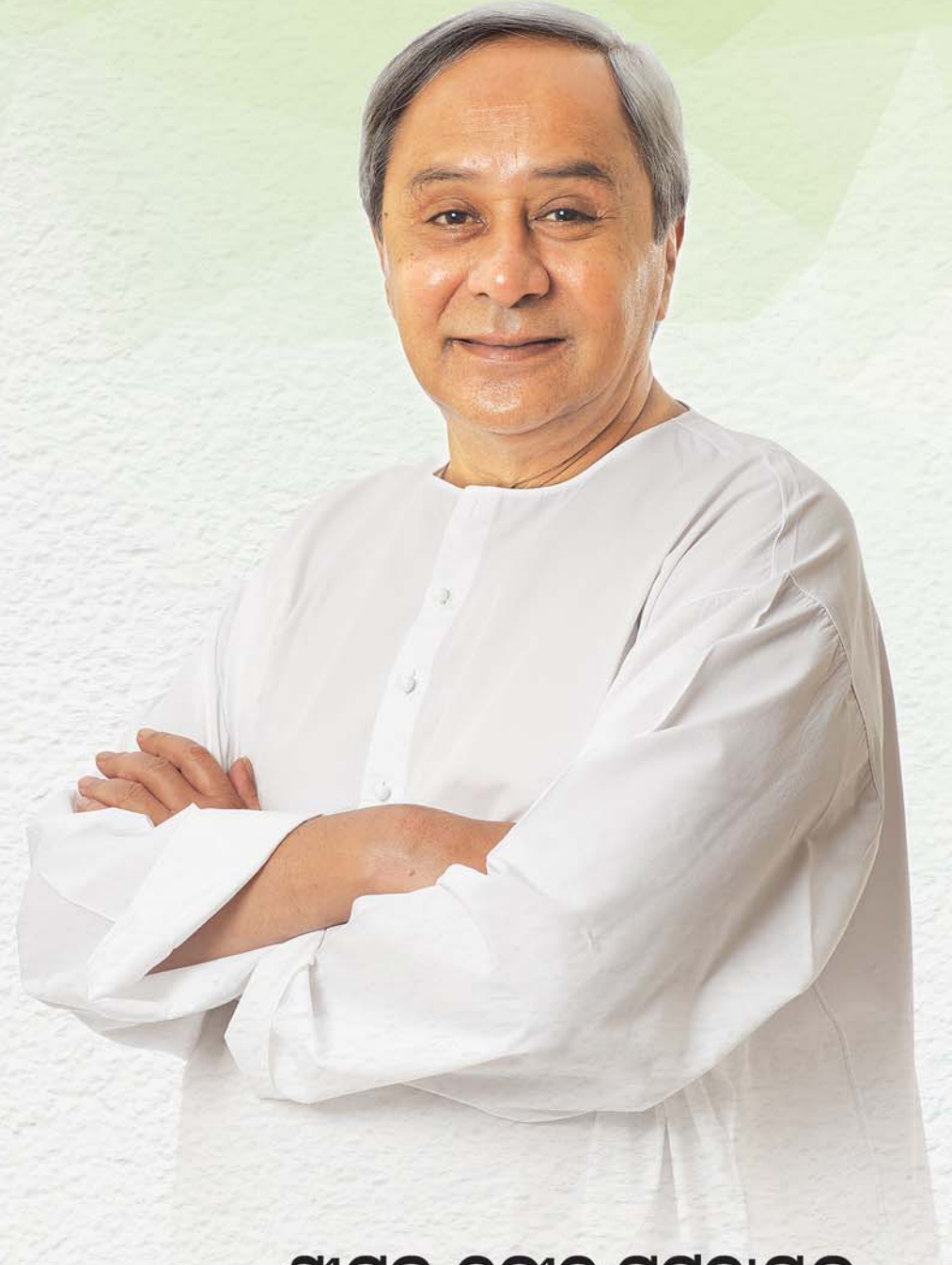
ଶ୍ରୀଯୁକ୍ତ ନବୀନ ପଟ୍ଟନାୟକ ମାନ୍ୟବର ମୁଖ୍ୟମନ୍ତ୍ରୀ