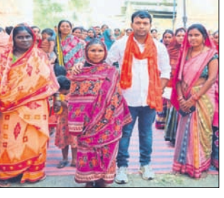
ସମାବେଶରେ ଯୋଗ ଦେଇଥିବା ମହିଳା।

ସମାବେଶରେ ଯୋଗ ଦେଇଥିବା ମହିଳା ସମାବେଶରେ ଯୋଗ ଦେଇଥିବା ମହିଳା ସମାବେଶରେ ଯୋଗ ଦେଇଥିବା ମହିଳା ସମାବେଶରେ ଯୋଗ ଦେଇଥିବା ମହିଳା