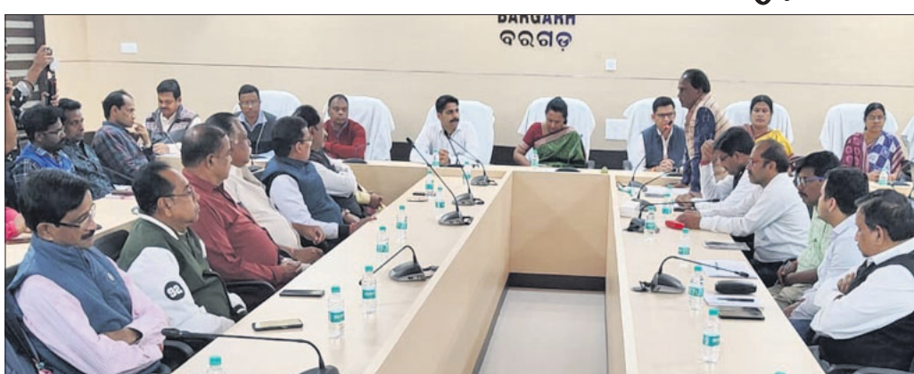
ବୈଠକରେ ଧନୁଯାତ୍ରା ମହୋତ୍ସବ ସମିତିର କର୍ମକର୍ତ୍ତା, ସଭ୍ୟବୃନ୍ଦ।

ଏହି ଋତୁ ଲକ୍ଷ୍ୟ ନେଇ ବ୍ରଜରାଜନଗର ଦଳ ମାତ୍ର ୪ ଉଚ୍ଚକେତ ହରାଇ ମ୍ୟାଚରେ ବିଜୟ ହୋଇ ସେମିଫାଇନାଲରେ ପ୍ରବେଶ କରିଛି।