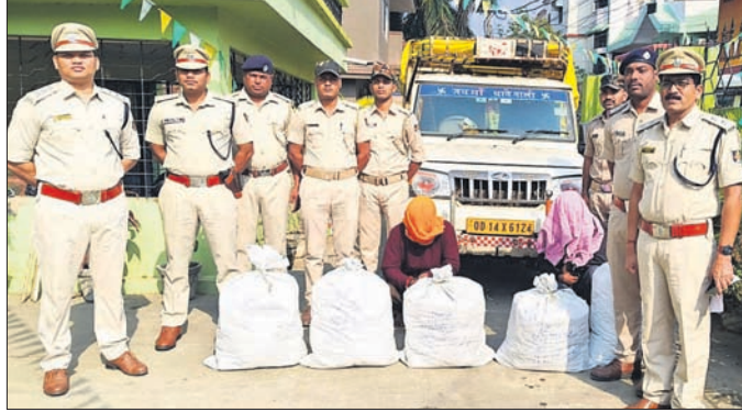
ଗଞ୍ଜେଇ ଓ ଗିରଫ ଅଭିଯୁକ୍ତ ସହ ଅବକାରୀ ଗୋଲନ୍ଦା ବିଭାଗ କର୍ମଚାରୀ।

ସମ୍ବଳପୁର ଅବକାରୀ ଗୋଲନ୍ଦା ବିଭାଗ କର୍ମଚାରୀ ଗଞ୍ଜେଇ ଓ ଗିରଫ ଅଭିଯୁକ୍ତ ସହ ଅବକାରୀ ଗୋଲନ୍ଦା ବିଭାଗ କର୍ମଚାରୀ