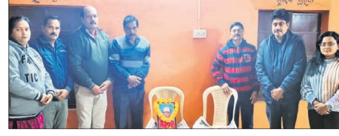
ସମ୍ବଳପୁର ମଞ୍ଚ ନାୟକ ଅନୁଷ୍ଠାନ ଆୟୋଜିତ ଶ୍ରଦ୍ଧାଞ୍ଜଳି ସଭା।

ସମ୍ବଳପୁର ମଞ୍ଚ ନାୟକ ଅନୁଷ୍ଠାନ ଆୟୋଜିତ ଶ୍ରଦ୍ଧାଞ୍ଜଳି ସଭା। ସମ୍ବଳପୁର ମଞ୍ଚ ନାୟକ ଅନୁଷ୍ଠାନ ଆୟୋଜିତ ଶ୍ରଦ୍ଧାଞ୍ଜଳି ସଭା।