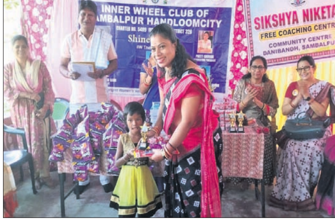
ଜନରହିଲ କୂଳର ସମ୍ବଳପୁର ହ୍ୟାଣ୍ଡଲୁମ ସିଟି ପକ୍ଷରୁ ସମର୍ଥନ କାର୍ଯ୍ୟକ୍ରମ।

ଜନରହିଲ କୂଳ ସମ୍ବଳପୁର ହ୍ୟାଣ୍ଡଲୁମ ସିଟି ପକ୍ଷରୁ ସମର୍ଥନ ଜନରହିଲ କୂଳ ସମ୍ବଳପୁର ହ୍ୟାଣ୍ଡଲୁମ ସିଟି ପକ୍ଷରୁ ସମର୍ଥନ