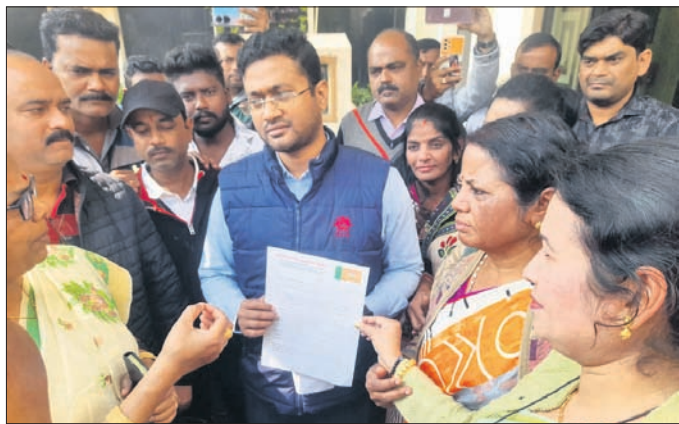
ଭାଜପା ପକ୍ଷରୁ ସଂକ୍ରମଣ ଦାବିପତ୍ର ପ୍ରଦାନ କରାଯାଇଛି।

ରାଉରକେଲା ସହରରେ ଝାଡ଼ାବାଡ଼ି ନିୟନ୍ତ୍ରଣ ପାଇଁ ଭାଜପା ପାନପୋଷ ସାଙ୍ଗଠନିକ କ୍ରିମା ସଭାପତିଙ୍କ ନେତୃତ୍ୱରେ ଏକ ପ୍ରତିନିଧିମଣ୍ଡଳୀ ଯୋଗଦାନ କରିଥିଲେ।