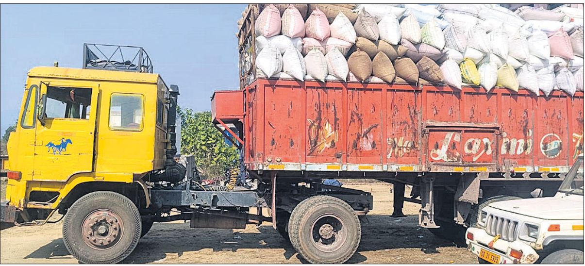
ସୁବର୍ଣ୍ଣପୁର ଜିଲ୍ଲା ବିନିକା ଅଞ୍ଚଳରୁ ଧାନ ଛତିଶଗଡ଼କୁ ଟ୍ରକରେ ଯାଉଛି।