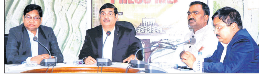
ଆୟୋଜକଙ୍କ ପକ୍ଷରୁ ପ୍ରତିଯୋଗିତା ସମ୍ପର୍କରେ ସୂଚନା ଦିଆଯାଇଛି।

ଭୁବନେଶ୍ୱର, ୨୦୧୨ (ତପନ ସାଲ୍) ଶିକ୍ଷା ଓ ଅନୁସନ୍ଧାନ (ସୋଆ) ବିଶ୍ୱବିଦ୍ୟାଳୟ ପରିସରରେ ଆସନ୍ତା କାମ୍ପୁରା ୨୮ରୁ ଫେବୃୟାରୀ ୪ ପର୍ଯ୍ୟନ୍ତ ପ୍ରଥମ ସୋଆ ଅନ୍ତର୍ଜାତୀୟ ଗ୍ରାଣ୍ଡମାଷ୍ଟର୍ସ ଚେସ୍ ଉତ୍ସବ ଅନୁଷ୍ଠିତ ହେବ। ସୋଆ, ଅନ୍ତର୍ଜାତୀୟ ଚେସ୍ ଫେଡେରେଶନ୍ (ଆଇସିଏଫ), ଅଲ୍ ଇଣ୍ଡିଆ ଚେସ୍ ଫେଡେରେଶନ (ଏଆଇସିଏଫ), ସୋଆ ଅଧିକାରୀ (ଇଣ୍ଡିଆ) ଓ ଓଡ଼ିଶା ସରକାରଙ୍କ ମିଳିତ ସହଯୋଗରେ ଅଲ୍ ଓଡ଼ିଶା ଚେସ୍ ଆସୋସିଏସନ୍ (ଏଓସିଏ) ପକ୍ଷରୁ ଏହି ଚୁନିମେଣ୍ଟ ଆୟୋଜନ କରାଯିବ। ଏହି ମେଗା ପ୍ରତିଯୋଗିତା ପାଇଁ ୩୫ ଲକ୍ଷ ଚଙ୍କାର ପୁରସ୍କାର ରାଶି ରଖାଯାଇଛି। ଏହି ୮ ଦିନିଆ ଚୁନିମେଣ୍ଟରେ ପାଠ୍ୟପାଠ୍ୟ ୨୦ଟି