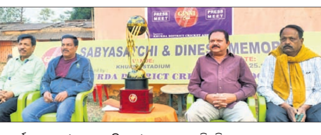
ଖୋର୍ଦ୍ଧା, ୨୦୧୨ (ପ୍ରଭାତ ପାଣିଗ୍ରାହୀ)

ଖୋର୍ଦ୍ଧା ଜିଲ୍ଲା କ୍ରିକେଟ ଆସୋସିଏସନ୍ (କେଟିସିଏ) ଆନୁକୂଲ୍ୟରେ ସଦ୍ୟଯାତା ଓ ବିନେଶ ମେମୋରିଆଲ ରାଜ୍ୟସ୍ତ୍ରୀୟ ଗିନିଜପ୍ ବୁକ୍ସ ଚୁର୍ଣ୍ଣାମେଣ୍ଟ ଗୁଣାୟ, ଷ୍ଟାଡ଼ିୟମରେ ଚଳିତ ୨୨ ରୁ ୨୪ ତାରିଖ ପର୍ଯ୍ୟନ୍ତ ଅନୁଷ୍ଠିତ ହେବ। ଏଥିରେ ଭୁବନେଶ୍ୱରର ମୁଖ୍ୟେଶ୍ୱର କ୍ରିକେଟ କ୍ଳବ, ରାମେଶ୍ୱର କ୍ରିକେଟ କ୍ଳବ, କଟକର ସୋଲାର ଓ ରାଜକି ଷ୍ଟାର ଟିମ୍ ଭାଗ ନେବ। ଚଳିତ ବର୍ଷ ଏକ ନୂତନ ଫର୍ମାଟରେ ମ୍ୟାଚ ଖେଳାଯିବ। ବୁକ୍ସ ଚିମ୍ ଫିଲ୍ଡରେ ୧୫ ଓଭର ଲେଖାଏ ବୁଲ୍ଡାଉ ମ୍ୟାଚ୍ ଖେଳାଯିବ। ୨୪ ତାରିଖରେ ଏକ ପ୍ରଦର୍ଶନୀ ମ୍ୟାଚ କରାଯିବ। ସ୍ଥିର ହୋଇଥିବା ରୁଧିରୀ ପୁରୁଷରେ ଆୟୋଜିତ ଖବରଦାତା ସମ୍ମିଳନୀରେ କେଟିସିଏ ସମ୍ପାଦକ ଭବାନୀ ଶଙ୍କର