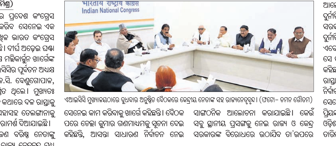
ଏଆଇସିସି ପୁଷ୍ଟୀକର୍ମରେ କୁସାବାର ଅନୁଷ୍ଠିତ ବୈଠକରେ କେନ୍ଦ୍ରୀୟ ନେତାଙ୍କ ସହ ରାଜ୍ୟନେତୃତ୍ୱ ।