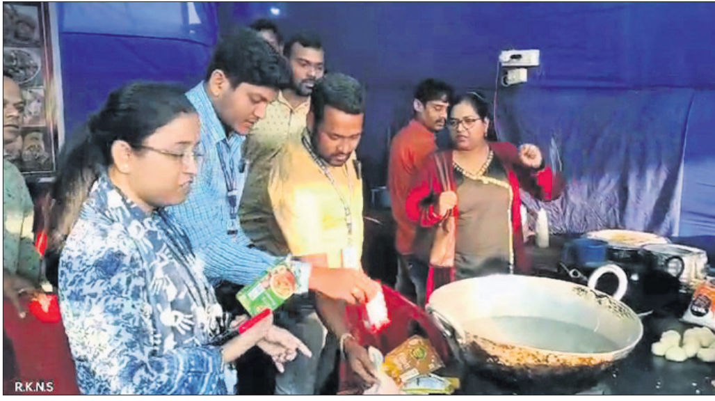
ଅଧିକାରୀମାନେ ଖାଦ୍ୟର ମାନ ଯାଞ୍ଚ କରୁଛନ୍ତି ।

ସମ୍ପ୍ରତି ହାବେଳି ପଡ଼ିଆରେ ଖୋର୍ଦ୍ଧା ମହୋତ୍ସବ ଚାଲିଛି । ଏହି ମହୋତ୍ସବରେ ଏକାଧିକ ଫୁଡ଼ ଷ୍ଟାଲ ପଡ଼ିଛି । କେତେକ ଫୁଡ଼ ଷ୍ଟାଲରେ ବାସିଷାଦ୍ୟ ବିକ୍ରି ଚାଲିଥିବା ବେଳେ ପ୍ରଶାସନ ନିରୀକ୍ଷାକୁ ନେଇ ପ୍ରଶ୍ନ ଉଠିଥିଲା । ଏ ନେଇ ଧରିଣୀରେ ଖବର ପ୍ରକାଶ ପାଇବା ପରେ ପ୍ରଶାସନ ଚେତା ପଶିଛି । ରୁଧିରୀର ପୌରନିବାହୀ ଅଧିକାରୀ ରିଜର୍ଭନ କର୍ମଚାରୀଙ୍କୁ ନେତୃତ୍ୱରେ ସ୍ଥାନୀୟ ଖାଦ୍ୟ ନିରୀକ୍ଷା ଯାଞ୍ଚ ଅଧିକାରୀ ନିବେଦିତା ଭକ୍ତକ ସମେତ ଏକ ଟିମ୍ ଖାଦ୍ୟସୁରକ୍ଷାକ୍ରମରେ ଚଢ଼ାଉ କରିଥିଲେ । ଚଢ଼ାଉ କେବଳ ୨୨କେଜି ବାସିଷାଦ୍ୟ ନଷ୍ଟ କରାଯାଇଛି । ଏଥିସହିତ ୫୨ଶହ ଟଙ୍କା ଜରିମାନା ଆଦାୟ ହୋଇଛି । ବିଭିନ୍ନ ଫୁଡ଼ କଲର, ଖରାପ ମସଲା, ପତାଶତା ଖାଦ୍ୟ ଜବତ ପରେ ନଷ୍ଟ କରାଯାଇଛି ବୋଲି ପୌର ନିବାହୀ ଅଧିକାରୀ ସୂଚନା ଦେଇଛନ୍ତି । ଆଗକୁ ଏହି ଅଭିଯାନ ଜାରି ରହିବ । ମହୋତ୍ସବ ନଡ଼ିଆରେ ଧୂଳି ଉଡ଼ୁଥିବାରୁ ଖାଦ୍ୟକୁ