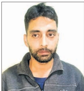
ସନ୍ଦେହ ଆଡ଼କବାଦୀ ସମ୍ବନ୍ଧରେ ଲୋକପଲିକା ଟ୍ରାକ୍ଟର ଚାଷୀମାନେ

ସଂସ୍ଥା 'ଇଣ୍ଟେଲିଜେନ୍ସ ଗୁରୋ (ଆଇବି)'ର ଅଧିକାରୀମାନେ ଟାଙ୍କୁ ଘନଘନ ଭେଟା କରିଛନ୍ତି। କେତେବେଳେ ଅଲଗା ଓ ଆଉ କେତେବେଳେ ମିଳିତ ଭାବେ ପଚରାଉଚରା କରାଯାଇ ଦେଶଦ୍ରୋହ ସହ ଅନ୍ୟ ଆପରାଧକ କାର୍ଯ୍ୟକଳାପର ତଥ୍ୟ ସଂଗ୍ରହ କରୁଛନ୍ତି। ତେବେ ଚାଷୀମାନେ ହନିଟ୍ରାପର ଜାଲ ବିଛାଇ ଟଙ୍କା