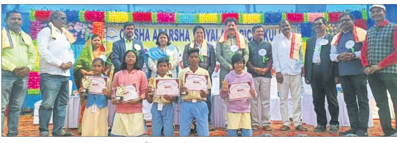
ବାର୍ଷିକ ଉତ୍ସବରେ ଅତିଥିଙ୍କ ଗହଣରେ କୃତୀ ଛାତ୍ରାଛାତ୍ରୀ।