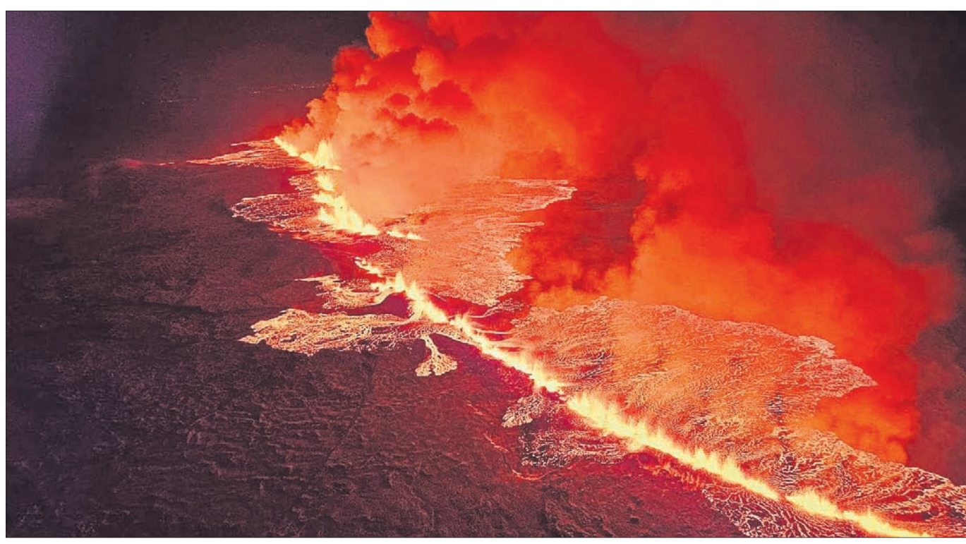
ଆଇସ୍ଲାଣ୍ଡରେ ରେକର୍ଡନୂତନ ଉପସ୍ଥାପନରେ ଆଗ୍ନେୟଗିରି ଉଦ୍ଗିରଣର ଆକାଶମାର୍ଗରୁ ଚିତ୍ର।