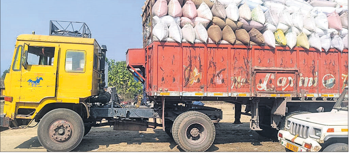
ସୁବର୍ଣ୍ଣପୁର ଜିଲ୍ଲା ବିନିକା ଅଞ୍ଚଳରୁ ଧାନ ଛତିଶଗଡ଼କୁ ଟ୍ରକରେ ଯାଉଛି।