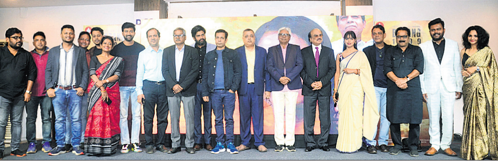
ଝେବ ସିରିଜ୍ 'ବାରଙ୍ଗ ୧୯୯୯' ଟ୍ରେଲର ରିଲିଜ୍ ଅବସରରେ ଉପସ୍ଥିତ କଳାକାର, ନିର୍ଦ୍ଦେଶକ ଓ ଅନ୍ୟମାନେ ।