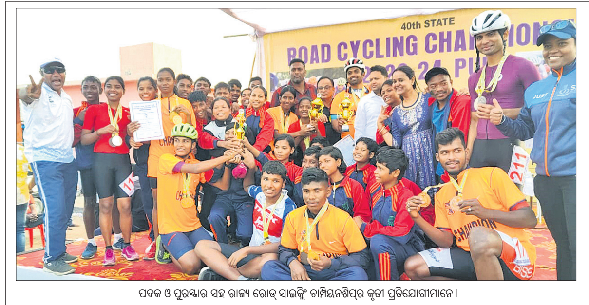
ପଦକ ଓ ପୁରସ୍କାର ସହ ରାଜ୍ୟ ରୋଡ୍ ସାଇକ୍ଲିଂ ଚାମ୍ପିୟନଶିପ୍ରେ କୃତୀ ପ୍ରତିଯୋଗୀମାନେ।