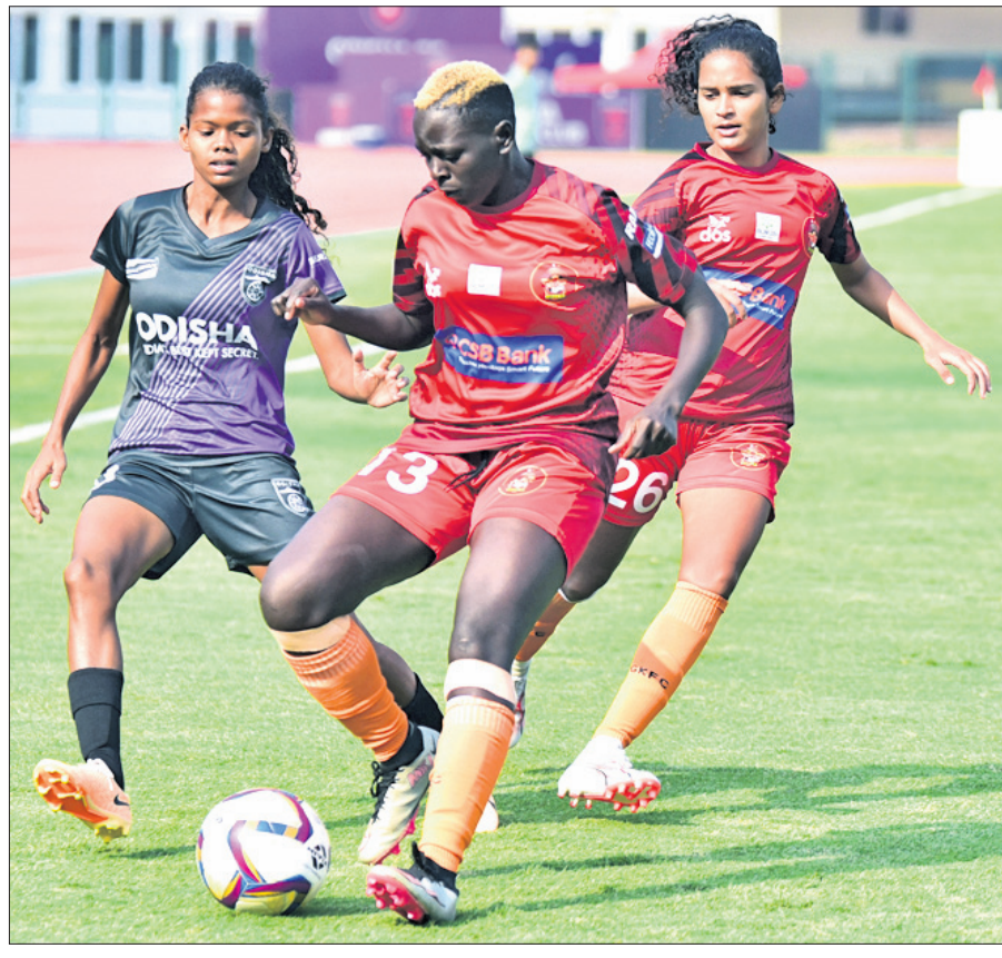
ଓଡ଼ିଶା ଏଫସି ଓ ଗୋକୁଳମ୍ କେରକ ମଧ୍ୟରେ ଅନୁଷ୍ଠିତ ମ୍ୟାଚ।

ଉଭୟ ଦଳ ପ୍ରାରମ୍ଭରୁ ଆକ୍ରମଣାତ୍ମକ ଫୁଟବଲ ଖେଳିଥିଲେ। ପ୍ରଥମ ମିନିଟରେ ଓଏଫସି ପକ୍ଷରୁ ଅସ୍ତମ ଓରାଓଏକ ଷ୍ଟ୍ରିକ୍ ସୁଯୋଗ ସୃଷ୍ଟି କରିଥିଲେ। ତେବେ ଏହାକୁ ଗୋକୁଳମ୍ ଡିଫେଣ୍ଡର ଅଟକାଇବାରେ ସଫଳ ହୋଇଥିଲେ। ୧୦ମ ମିନିଟରେ ଗୋକୁଳମ ପ୍ରୟାସକୁ ନିଷ୍ପଳ କରିଥିଲେ ବ୍ରିଟି। ପ୍ରଥମାର୍ଦ୍ଧର ୩୨ ତମ ମିନିଟରେ ଓଏଫସିକୁ ଅଗ୍ରଣୀ ପ୍ରଦାନ କରିଥିଲେ ପ୍ୟାରୀ ଖାତା। ଲେଫ୍ଟ୍ ଫୁଲକୁ ସଞ୍ଜୁ ଓ ଯଶୋଦା ମୁଖା ଚମକାର ତାଳମେଳ ଦେଖାଇବା ସହିତ