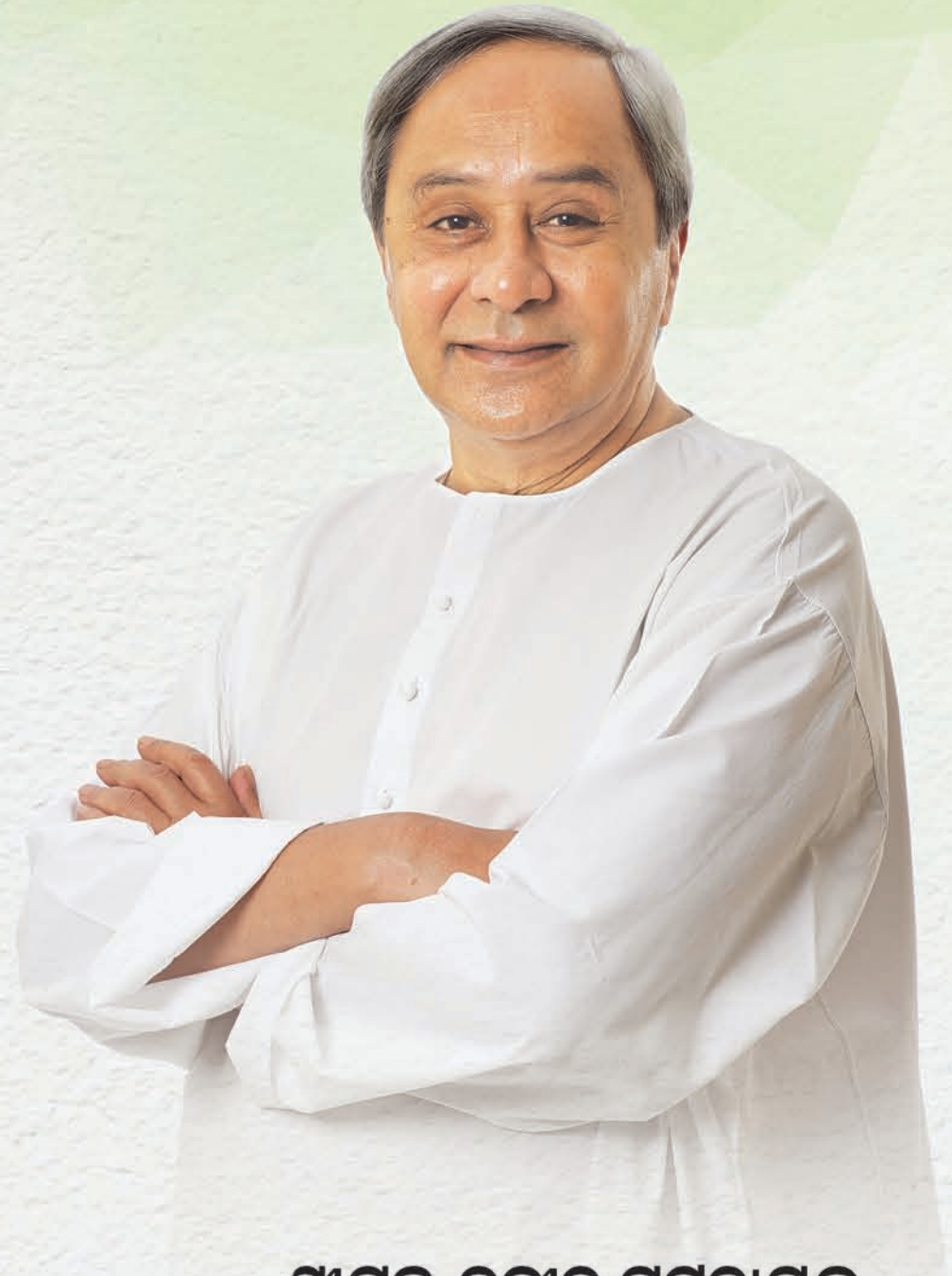
ଶ୍ରୀଯୁକ୍ତ ନବୀନ ପଟ୍ଟନାୟକ ମାନ୍ୟବର ମୁଖ୍ୟମନ୍ତ୍ରୀ