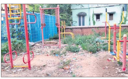
ଅଲୋଡ଼ା ହୋଇଥିବା ପୁକ୍କାକାଶ ଜିମ ସାମଗ୍ରୀ।

ବ୍ରହ୍ମପୁର ମହାନଗର ନିଗମ (ବିଲ୍‌ଏମ୍‌ସି) ପକ୍ଷରୁ ପୁଖ୍ୟାମଣ୍ଡା କର୍ମ ତତ୍ପର ଯୋଜନା (ପୁକ୍କା)ରେ ସହର ସୌନ୍ଦର୍ଯ୍ୟକରଣ ନେଇ ବିଭିନ୍ନ ପଦକ୍ଷେପ ନିଆଯାଇଛି। ପୁକ୍କା ଯୋଜନାରେ (ସ୍ୱୟଂ ସହାୟତା ଗୋଷ୍ଠୀ) ଏସ୍‌ଏଚ୍‌ସିକୁ ସାମିଲ କରାଯାଇ ଶିଳ୍ପ ଉଦ୍ୟାନ, ଚଳାପଥ, ମିନି ପାର୍କ, ପୁକ୍କାକାଶ ଜିମ, ଖେଳ ପଡ଼ିଆ ଓ ଜଳାଶୟ ଗୁଡ଼ିକର ଉନ୍ନୟନ କାର୍ଯ୍ୟ କରାଯାଇଛି।