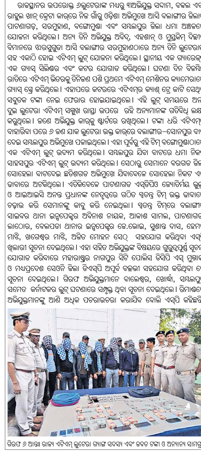
ଗିରଫ ୬ ଆକ୍ଷ ରାଜ୍ୟ ଏଟିଏମ୍ ଲୁଟ୍‌ଚୋରା ଗମ୍ଭୀର ସନ୍ଧ୍ୟା ଏବଂ ଜବତ ଟଙ୍କା ଓ ଅନ୍ୟାନ୍ୟ ସାମଗ୍ରୀ।

ଗିରଫ କରିଛି। ଏସ୍‌ପି ଖୁଲାରୀ କହିଛନ୍ତି ଯେ ଗତ ୧୬ତାରିଖ ବିକ୍ଷିତ ରାତିରେ ପାଟଣାଗଡ଼ ଥାନା ସରପୁହାଣ ଗାଁର ଏକ ଏଟିଏମ୍ ଲୁଟ୍ ହୋଇଥିଲା। ଏ ସଂକ୍ରାନ୍ତରେ ବିଏମ୍‌ଏସ୍ କମ୍ପାନୀର ଜଣେ କର୍ମଚାରୀ ପାଟଣାଗଡ଼ ଥାନାରେ ଅଭିଯୋଗ କରିଥିଲେ। ସେମାନେ ଅଭିଯୋଗ କରିଥିଲେ ଯେ, ୧୬ ତାରିଖ ସନ୍ଧ୍ୟା ପ୍ରାୟ ସାଢ଼େ ୫ଟାରେ ସରପୁହାଣ ଏଟିଏମ୍‌ରେ ଟାଙ୍କ କମ୍ପାନୀ ୬ ଲକ୍ଷ ୬୪ହଜାର ଟଙ୍କା ଭର୍ତ୍ତି କରିଥିଲା। ହେଲେ ଉକ୍ତ ଏଟିଏମ୍‌ରୁ ସେଇ ରାତିରେ ସବୁତକ ଟଙ୍କା ଲୁଟ୍ ହୋଇଯାଇଥିଲା। ଏବେଲେ ପାଟଣାଗଡ଼ ଥାନାରେ ଏକ ମାମଲା (୩୧୯/୨୩) ରୁଜୁ ହୋଇଥିଲା। ଉତ୍ତରାଞ୍ଚଳ ଆଇଲି ଏବଂ ବଳାଙ୍ଗୀର ଏସ୍‌ପି ଖୁଲାରୀଙ୍କ ପ୍ରତ୍ୟକ୍ଷ ତତ୍ତ୍ୱାବଧାନରେ ଏକ ସ୍ୱତନ୍ତ୍ର ଟିମ୍ ଗଠନ କରାଯାଇ ଲୁଟ୍ ଘଟଣାର ତଦନ୍ତ ନିର୍ଦ୍ଦେଶ ଦିଆଯାଇଥିଲା। ସିସି ଟିଭି ଫୁଟେଜ ଓ ବିଶେଷଜ୍ଞ ଖାନକୌଶଳ ଉପଯୋଗ କରି ପୋଲିସ୍ ଲୁଟ୍‌ଚୋରାକ ନିକଟରେ ପହଞ୍ଚିଥିଲା।