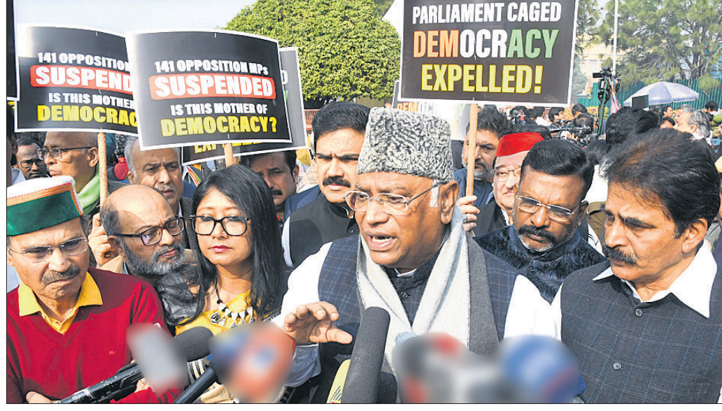
ପାର୍ଲିମେଣ୍ଟରୁ ଲଞ୍ଚିଆ ମେଣ୍ଟର ସଦସ୍ୟମାନଙ୍କୁ ନିଲମ୍ବନ ପ୍ରତିବାଦରେ ଗୁରୁବାର ବିରୋଧୀ ଶୋଭାଯାତ୍ରା ପରେ ଗଣମାଧ୍ୟମକୁ ସମ୍ବୋଧିତ କରୁଛନ୍ତି କଂଗ୍ରେସ ଅଧ୍ୟକ୍ଷ ମଲ୍ଲିକାର୍ଜୁନ ଖାଟ୍ଟି।

ଆକ୍ରମଣ କରିଛନ୍ତି। ଗଣତନ୍ତ୍ର ଏବଂ ନିର୍ବାଚନ କଳର ସ୍ୱୟଂକ୍ରିୟତା ଏବଂ ନିର୍ଦ୍ଧାରିତ ଉପରେ ବୁଲିଯିବାର ମହତ୍ତ୍ୱ ବିଆଯାଇଥିବା ସୂର୍ଯ୍ୟେଫାଲା କହିଥିଲେ। ଲୋକ ସଭାରେ ଆଲୋଚନାର ଉତ୍ତର ଦେଇ ଆଇନ ମନ୍ତ୍ରୀ ଅର୍ଜୁନରାମ ମେଘଠାଲ କହିଥିଲେ, ୧୯୯୧ ଅଧିନିୟମରେ ଶୀର୍ଷ ନିର୍ବାଚନ ଅଧିକାରୀମାନଙ୍କ ସେବା