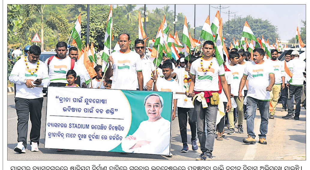
ଗାଳପୁର ବ୍ୟାସନଗରରେ ଷ୍ଟାଡ଼ିୟମ ନିର୍ମାଣ ଦାବିରେ ଗୁରୁବାର ଭୁବନେଶ୍ୱରରେ ପହଞ୍ଚିଥିବା ରାଲି ନବୀନ ନିବାସ ଅଭିଯୁକ୍ତ ଯାଉଛି।