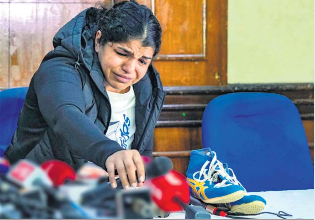
ଖବରଦାତା ସମ୍ମିଳନୀରେ ନିଜ ଅବସର ଘୋଷଣାବେଳେ ଭାବପ୍ରବଣ ମହିଳା କୁସ୍ତି ଯୋଦ୍ଧା ସାକ୍ଷୀ ମଲିକ।