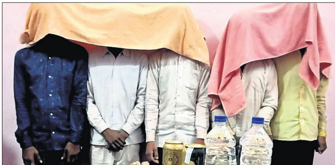
କରିଛି। ସେମାନେ ହେଲେ ମଧ୍ୟପ୍ରଦେଶ ଓ ଅନ୍ୟାନ୍ୟ ରାଜ୍ୟର ଅପରାଧୀ ସଂଘର, ଗୋବିନ୍ଦ ସଂଘର, ଯମୁନା ଯୋଦ୍ଧା, ୨ଟି ଲେଖାଏଁ ଲୁହା ଛତା ଓ

ଓଡ଼ିଶାରେ ଏବେ ଅନ୍ୟ ରାଜ୍ୟର ଅପରାଧୀ ଗ୍ୟାଙ୍ଗ୍ ସକ୍ରିୟ ରହିଛନ୍ତି। ଅପରାଧ ଘଟଣା ନିଜ ଅଞ୍ଚଳକୁ ଖସି ପଳାଇଛନ୍ତି। ମହେଶ୍ୱର ଥାନା ଅନ୍ତର୍ଗତ ହାତବାଇ ବସ୍ଟିର ରାଧାକୃଷ୍ଣ ମନ୍ଦିର ନିକଟ ପୁରୁଣା ଲତାଭାଟି ଅଞ୍ଚଳରେ ଥିବା ଏକ ନିର୍ବାସିତା ଘରରେ ସଶସ୍ତ୍ର ଡକାୟତି ଯୋଜନା କରୁଥିବାବେଳେ ପୋଲିସ୍ ତରଫରୁ ଏକ ଆଡ଼ରାଜ୍ୟ ଡକାୟତି ଗ୍ୟାଙ୍ଗର ୫ଜଣଙ୍କୁ ଗିରଫ