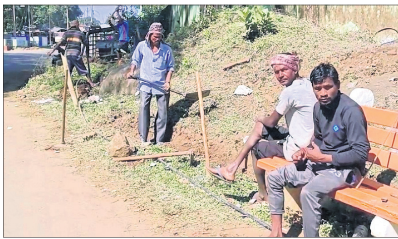
ପ୍ରକଳ୍ପକୁ ଭାଙ୍ଗି ଆରମ୍ଭ ହୋଇଥିବା ଡ୍ରେନ କାର୍ଯ୍ୟ।

କୋରାପୁଟ, ୨୬.୧୨ (ଅନିତା ବେହେରା) କୋରାପୁଟ ମୁନିସିପାଲିଟି ଦ୍ୱାରା ନିର୍ମାଣାଧୀନ ଜଳ ଅମଳ ପ୍ରକଳ୍ପ ଭାଙ୍ଗି ଡ୍ରେନ ନିର୍ମାଣ କରାଯାଇଛି। ଏହି କାର୍ଯ୍ୟ କିଏ କରୁଛି ସେନେଇ ସାଧାରଣରେ ପ୍ରଶ୍ନ ଉଠୁଛି। ଗତ ୨୦୨୧ କୋରାପୁଟ ଜିଲ୍ଲା ଭେଟେନାରି ଅଧିକାରୀଙ୍କ କାର୍ଯ୍ୟାଳୟ ପାରେରି ନିକଟରେ ମୁନିସିପାଲିଟି ଦ୍ୱାରା ଜଳ ଅମଳ ପ୍ରକଳ୍ପ ନିର୍ମାଣ କରାଯାଇଥିଲା। ଏଥିପାଇଁ ପୂଜ୍ୟ ଯୋଜନାରେ ୨୦୨୧ ଲକ୍ଷ ୯୬ ହଜାର ଟଙ୍କା ବ୍ୟୟ ହୋଇଥିଲା। ସେହି ଜଳ ଅମଳ ପ୍ରକଳ୍ପ ସ୍ଥାନରେ ଥିବା ସମସ୍ତ ସାମଗ୍ରୀ ବାହାର କରି ସେହି ସ୍ଥାନରେ ଏବେ ଡ୍ରେନ