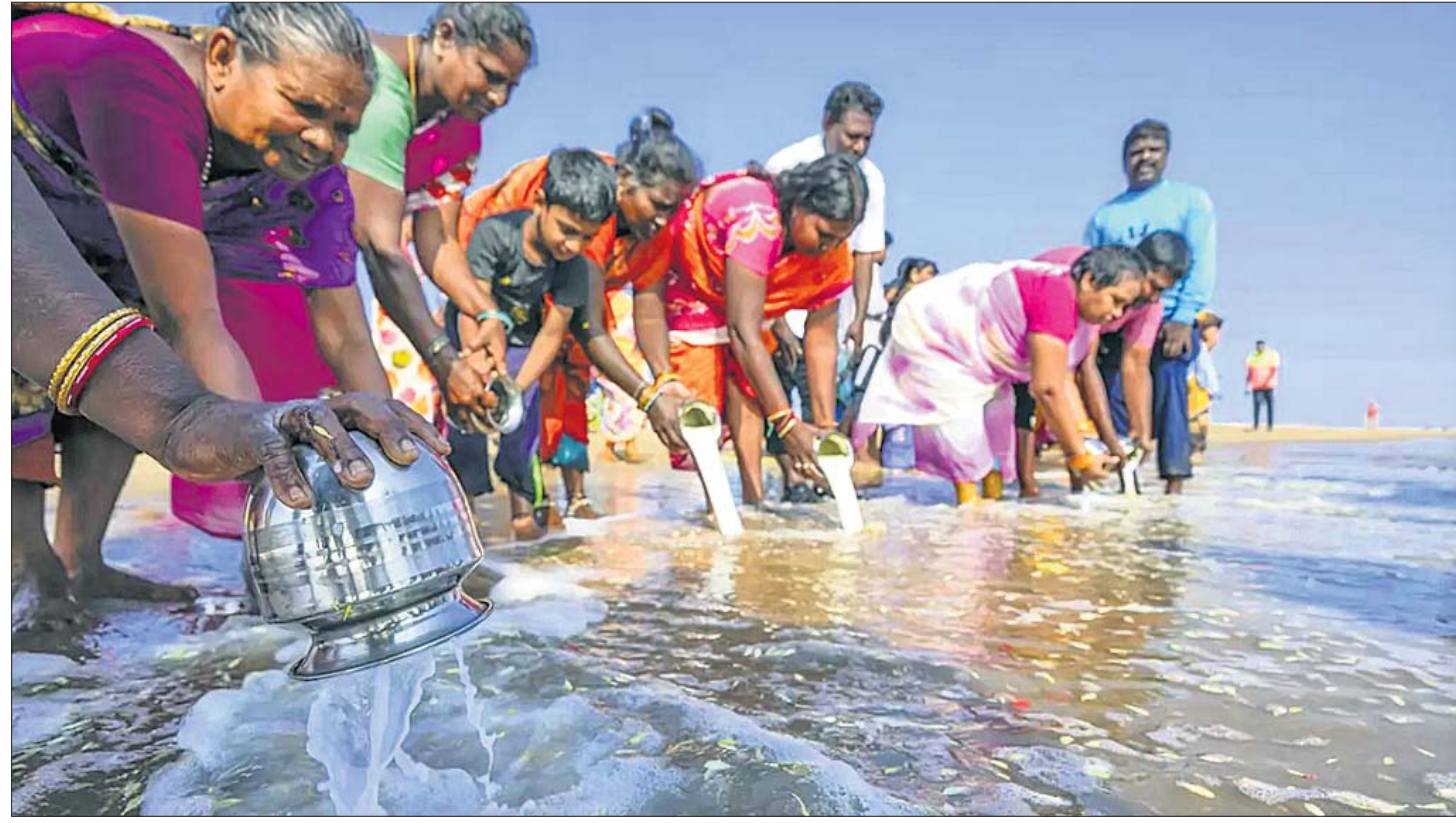
୨୦୦୪ ସୁନାମକୁ ୧୯ ବର୍ଷ: ମୃତକଙ୍କ ଉଦ୍ଦେଶ୍ୟରେ ମାୟାଜୀବୀ ପରିବାରର ମହିଳା ପୁରୁଷମାନେ ତେନାଲର ମାରିନା ବିଚ୍ଚରେ ମଙ୍ଗଳସାର ପୂଜାର୍ଚ୍ଚନା କରୁଛନ୍ତି।