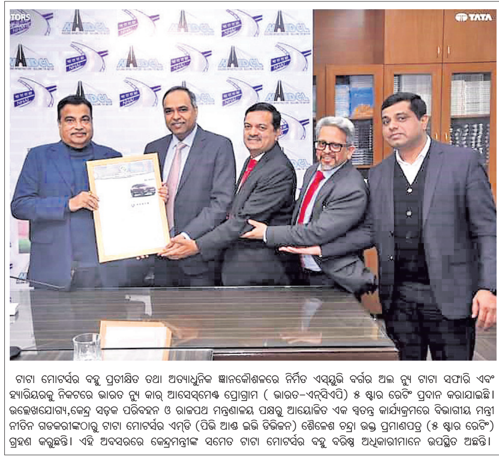
ଚାଚା ମୋଟରସ୍‌ର ବନ୍ଧୁ ପ୍ରତାପନିତ ଚିଟ୍‌ର ଆୟତ୍ତା ପ୍ରଦାନ କରାଯାଇଛି।

ଉଲ୍ଲେଖଯୋଗ୍ୟ, ବିଏସ୍‌ଇଏଲ୍ ଏଜିଏଲ୍ ୪.୩% ବୁକ୍ ପାଇ ୧,୫୯.୯୦ ଟଙ୍କାରେ ବନ୍ଦ ହୋଇଛି। ଏପରିକି କମ୍ପାନୀର ୧.୨ ବିଲିୟନ ଡଲାର ମୁଲ୍ୟର ବନ୍ଧ ପରିଚାଳନା ଆୟତ୍ତା ବର୍ଷ ଲୁଲ୍ୟରେ ୬.୩୧ କୋଟି ଡଲାର ପ୍ରଦାନ ଯୋଜନାକୁ ଅନୁମୋଦନ କରିଛି।