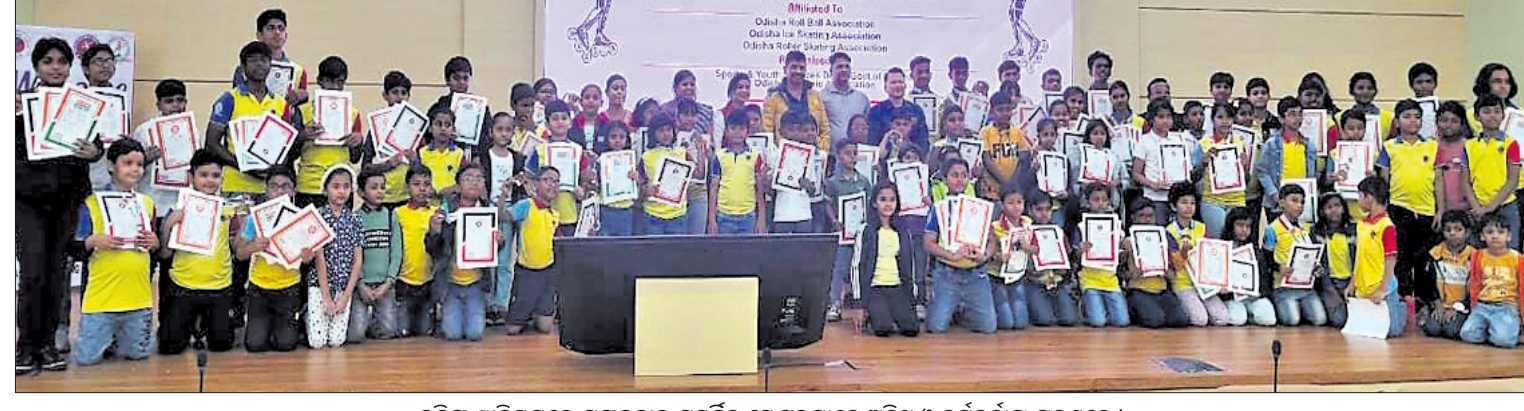
କଳିଙ୍ଗ ସ୍ମୃତିଧାନରେ ମଙ୍ଗଳବାର ସମ୍ପୂର୍ଣ୍ଣ ଭେଟରମାନେ ଅତିଥି ଓ କର୍ମଚାରୀଙ୍କୁ ଶୁଭେଚ୍ଛା ଦେଇଛନ୍ତି।

ସୋନମାଳୀ ପର୍ଯ୍ୟାୟ ପ୍ରତିଯୋଗିତା ୧୩-୧୯ ପର୍ଯ୍ୟନ୍ତ ରାଷ୍ଟ୍ରରେ ଖେଳାଯିବ। ଭାରତ ଗ୍ରୁପ୍ ବିରେ ସ୍ଥାନ ପାଇଥିବା ବେଳେ ମୁଖ୍ୟ କୋର୍ଟ କାନ୍ଦେକ ସୁପମାନ। ଏହି ମହିଳା ଦଳ ପ୍ରଥମ ଦିବସରେ ଖେଳାଯିବ। ଭାରତୀୟ ମହିଳା ହକି ଦଳ ବର୍ତ୍ତମାନ ପଞ୍ଚୋଦ୍ଧାୟ ଗୋଟିଏ ପାଇଁ ୩୪ ଜଣିଆ ମହିଳା ଦଳ ଗଠନ କରାଯାଇଛି। ଭାରତୀୟ ମହିଳା ଦଳ ପ୍ରଥମ ଦିବସରେ ଖେଳାଯିବ। ଭାରତୀୟ ମହିଳା ଦଳ ପ୍ରଥମ ଦିବସରେ ଖେଳାଯିବ।