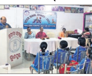
ଗୁଣପୁର, ୨୬.୧୨ (ପ୍ରବାପ କୁମାର ପାଢ଼ୀ)

ଓଡ଼ିଶା ରାଜ୍ୟ ଶିଶୁ ସୁରକ୍ଷା ସୋସାଇଟି ନିର୍ଦ୍ଦେଶକ୍ରମେ ରାୟଗଡ଼ା ଜିଲ୍ଲା ଗୁଣପୁର ସେବା ସମାଜର ଶିଶୁ ଯତ୍ନ ଅନୁଷ୍ଠାନରେ ମଙ୍ଗଳବାର ବୀର ବାଲି ଦିବସ ପାଳନ କରାଯାଇଛି।