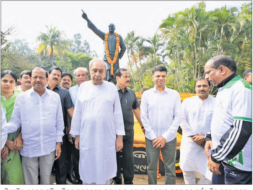
ବିଜେଡିର ୨୭ତମ ପ୍ରତିଷ୍ଠା ଦିବସ ଅବସରରେ ମଙ୍ଗଳବାର ମୁଖ୍ୟମନ୍ତ୍ରୀ ନବୀନ ପଟ୍ଟନାୟକ ସର୍ବତ୍ର ବିଜୁ ପଟ୍ଟନାୟକଙ୍କ ପ୍ରତିମୂର୍ତ୍ତିରେ ମାଲ୍ୟାର୍ପଣ କରିବାପରେ ଦଳୀୟ ନେତୃମଣ୍ଡଳୀକ ସହ ।

ବିଜେଡି ଆଗାମୀ ଦିନରେ ମଧ୍ୟ ଓଡ଼ିଶାର ବିକାଶ ଓ ଓଡ଼ିଶାବାସୀଙ୍କ ସେବାରେ ସମର୍ପିତ ହୋଇ ନିଷ୍ଠାପର ଭାବେ କାମ କରିବାବେଳେ ବିଜେଡି ମୁଖ୍ୟମନ୍ତ୍ରୀ କହିଛନ୍ତି ।