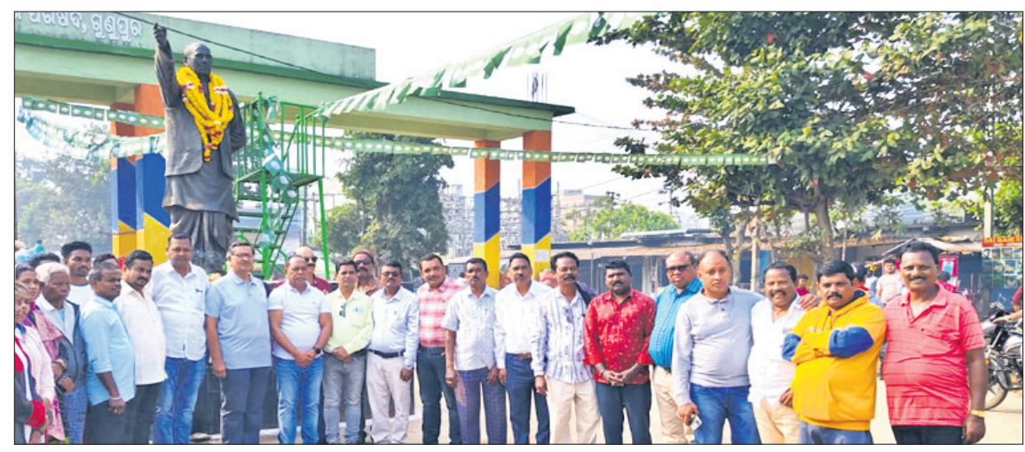
ଗୁଣପୁର ନୂତନ ବସ୍ତୁଖଣ୍ଡଠାରେ ପ୍ରବାପ ପୁରୁଷ ବିଜୁ ପଟ୍ଟନାୟକଙ୍କ ପ୍ରତିମୂର୍ତ୍ତିରେ ପୁଷ୍ପମାଳ୍ୟ ଅର୍ପଣ ଅବସରରେ ଉପସ୍ଥିତ ଦଳୀୟ ନେତା, କର୍ମୀ।

ରାୟଗଡ଼ା ଜିଲ୍ଲା ଗୁଣପୁରଠାରେ ମଙ୍ଗଳବାର ବିଜେଡି ପ୍ରତିଷ୍ଠା ଦିବସ ପାଳିତ ହୋଇଯାଇଛି। ଏହି ଅବସରରେ ଗୁଣପୁର ମହାବିଦ୍ୟାଳୟଠାରେ ପ୍ରବାପ ପୁରୁଷ ବିଜୁ ପଟ୍ଟନାୟକଙ୍କ ପ୍ରତିମୂର୍ତ୍ତିରେ ପୁଷ୍ପମାଳ୍ୟ ଅର୍ପଣ କରାଯାଇଥିଲା।