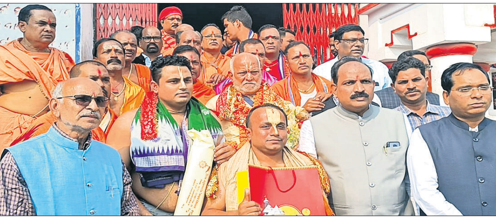
ସମଲେଶ୍ୱରୀ ମନ୍ଦିର ସେବାୟତଙ୍କୁ ନିମନ୍ତ୍ରଣ ଦିଆଯାଇଛି।