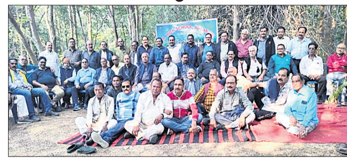
ବନ୍ଧୁନିକେତନ ଉପସ୍ଥିତ ପୃଥ୍ୱୀରାଜ ହାଇସ୍କୁଲ ୧୯୭୬ ମାଟ୍ରିକ୍ ବ୍ୟାଚ ପିଲାମାନେ।

ବଲାଙ୍ଗୀର, ୨୭.୧୨ (ବାରେନ୍ଦ୍ର କୁମାର ଝାଙ୍କର)