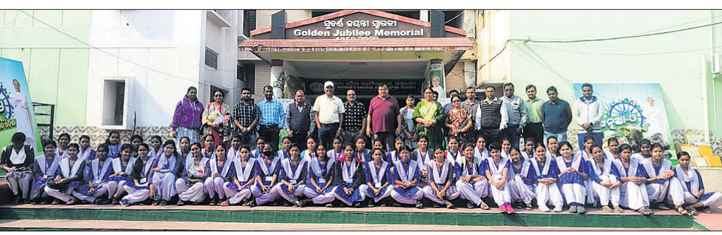
ସରକାରୀ ମହିଳା କଲେଜ ଛାତ୍ରୀଙ୍କ ଗହଣରେ ବିଧାୟକ।