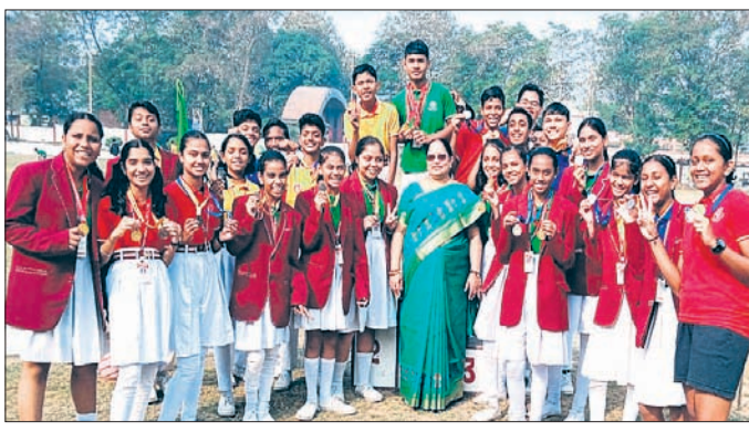
ଉତ୍ସବରେ ଛାତ୍ରଛାତ୍ରୀ ଓ ଶିକ୍ଷୟିତ୍ରୀ ବୃନ୍ଦ।

ଉତ୍ସବରେ ଲମ୍ବିଆଁ, ଉଚ୍ଚତାଆଁ, ଦୌଡ଼, ଶତପୁଟ୍ ଆଦି ପ୍ରତିଯୋଗିତା ଆୟୋଜିତ ହୋଇଥିଲା। ବିଦ୍ୟାଳୟର କ୍ରୀଡ଼ା ଶିଳ୍ପ ଅମିନ ମଲିକ, ରାଜଶ୍ରୀ ସାହାଣୀଙ୍କ ନେତୃତ୍ୱରେ ସମସ୍ତ ଶିଳ୍ପ ସହଯୋଗ କରିଥିଲେ। ଶିଳ୍ପକଳାଙ୍କ ମଧ୍ୟରେ ଦୌଡ଼ ଓ ଶିକ୍ଷୟିତ୍ରୀଙ୍କ ମଧ୍ୟରେ ମ୍ୟୁଜିକ୍ ଟେୟାର ପ୍ରତିଯୋଗିତା ଆଣା ପ୍ରକଟ କରିଥିଲେ। କ୍ରୀଡ଼ା