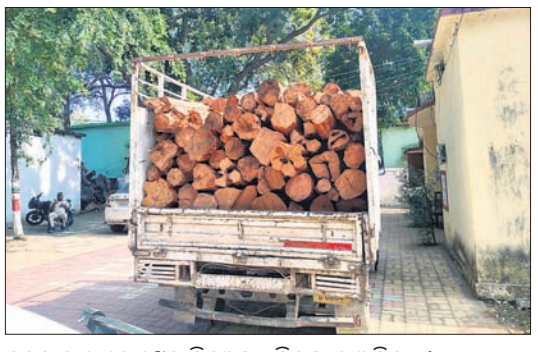
କବଚ କାଠ ବୋଝେଇ ପିକ୍‌ଅପ୍, ଗିରଫ ୨ ଅଭିଯୁକ୍ତ।