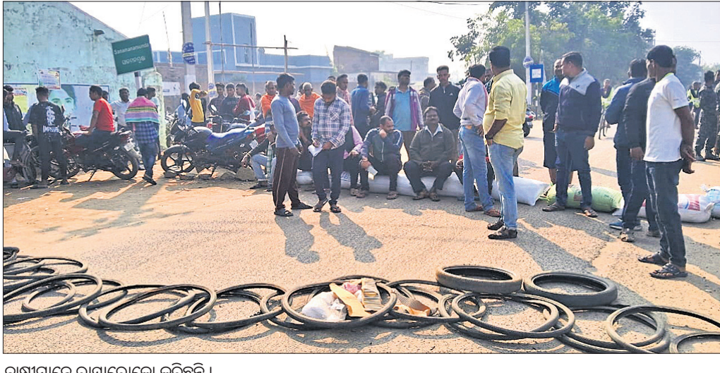
ଚାଷୀମାନେ ରାସ୍ତାରେକୋ କରିଛନ୍ତି।

କଣ୍ଠାମାଳ/ରାସ୍ତାପଡ଼ା, ୨୦୧୨