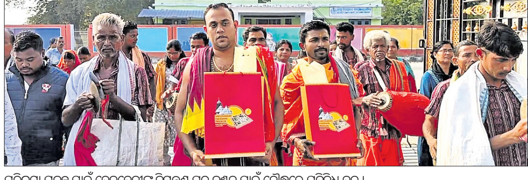
ପରିକ୍ରମା ପ୍ରକଳ୍ପ ପାଇଁ ଦେବଦେବୀଙ୍କୁ ନିମନ୍ତ୍ରଣ ପତ୍ର ବଣ୍ଟନ ପାଇଁ ବୌଦ୍ଧରେ ପ୍ରତିନିଧି ଦଳ।