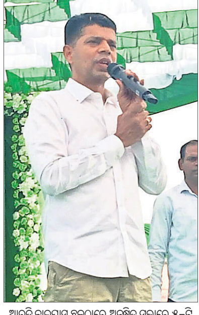
ଆରଡ଼ି ବାଲପାଠ ଛକଠାରେ ଅନୁଷ୍ଠିତ ସଭାରେ ୫-ଟି ଅଧକ୍ଷ କାର୍ଯ୍ୟକ୍ରମ ଉଦ୍‌ଘୋଷଣା ଦେଇଛନ୍ତି ।

ଭଦ୍ରକ/ଗାନ୍ଧାର୍ଜି/ଧାମନଗର, ୨୭।୧୨ (ସମାଚାର ରାଜତ/କିଶାନ ପାତ୍ର/ରେହମା ସାହିଆ) ୫-ଟି ଓ ନବୀନ ଓଡ଼ିଶା ଅଧକ୍ଷ କାର୍ଯ୍ୟକ୍ରମ ପାଇଁ ଆମ ଲୁଧବାର ଦିନିକିଆ ଗପ୍ତରେ ଆସି ଭଦ୍ରକ ନେହେରୁ ଷ୍ଟାଡ଼ିୟମ, ଅଭୁବିକା ଓ ଆରଡ଼ିରେ ୩ଟି ସଭାରେ ଯୋଗଦେଇ ଫେରିଛନ୍ତି । ଓଡ଼ିଶାର ଲୋକଙ୍କ ମୁହଁରେ ହସ ଫୁଟାଇବା ପାଇଁ ମୁଖ୍ୟମନ୍ତ୍ରୀ ସବୁବେଳେ ପ୍ରୟାସ କରି ରଖିଛନ୍ତି । ଓଡ଼ିଶାର ବିକାଶ ତ୍ୱଚତରେ ହେଉଥିବା ଦେଖି ବିରୋଧୀମାନେ ସହିପାରୁନାହାନ୍ତି ବୋଲି ଭଦ୍ରକ ନେହେରୁ ଷ୍ଟାଡ଼ିୟମରେ ଅନୁଷ୍ଠିତ ସାଧାରଣ ସଭାରେ ୫-ଟି ଅଧକ୍ଷ କହିଛନ୍ତି । ପୂର୍ବସ୍ତୁବା ସାହେ ୧୦ଟାରେ ହେଲକପୁର ଯୋଗେ ଆସି ପ୍ରଥମେ ଗାନ୍ଧାର୍ଜି ରୁକ୍ମର ଆରଡ଼ିରେ ପହଞ୍ଚି ବାବା ଆଖଣ୍ଡଳମଣିଙ୍କୁ ଦର୍ଶନ ସହ ପୂଜାର୍ଚ୍ଚନା କରିଥିଲେ । ପରେ ଆରଡ଼ି ବାଲପାଠ ଛକଠାରେ ଅନୁଷ୍ଠିତ ସଭାରେ ଯୋଗଦେଇ ଗାନ୍ଧାର୍ଜି ନିର୍ବାଚନମଣ୍ଡଳର ଆଖଣ୍ଡଳମଣି ମନ୍ଦିରର ୨ୟ ପର୍ଯ୍ୟାୟ ରୂପାନ୍ତରଣ ପାଇଁ ମୁଖ୍ୟମନ୍ତ୍ରୀ ୫୦କୋଟି ଟଙ୍କା ଅନୁମୋଦନ କରିଥିବା ସେ ଘୋଷଣା କରିଛନ୍ତି । ସେହିପରି ଗମନାଗମନ, ଜଳ ଯୋଗାଣ, ସ୍ୱାସ୍ଥ୍ୟ, ଶିକ୍ଷା, ଧାର୍ମିକ ଅନୁଷ୍ଠାନର ଉନ୍ନତୀକରଣ ଲାଗି ୫ ମାସରେ ୩୫୦ କୋଟି ଟଙ୍କା ମୁଖ୍ୟମନ୍ତ୍ରୀ ଅନୁମୋଦନ କରିଥିବା ସେ କହିଥିଲେ । ଏହାପରେ ୫-ଟି ଅଧକ୍ଷ ଧାମନଗର ରୁକ୍ମ ଅଭୁବିକାସ୍ଥିତ ଶହାଦ ଷ୍ଟାଡ଼ିୟମରେ ଅନୁଷ୍ଠିତ ସଭାରେ ଯୋଗ ଦେଇଥିଲେ । ଭଦ୍ରକ ମାଟି ବିଳାସନର ମାଟି, ସମସ୍ତଙ୍କୁ ପ୍ରେରଣା ଦେବା ମାଟି । ଆପଣମାନଙ୍କ ଭଲପାଇବା, ସ୍ନେହ ମୋତେ