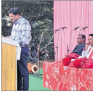
ବଲାଙ୍ଗୀର ମିଶନ ପରିସରରେ ଆୟୋଜିତ କାର୍ଯ୍ୟକ୍ରମରେ ମଞ୍ଚାସୀନ ଅତିଥି।