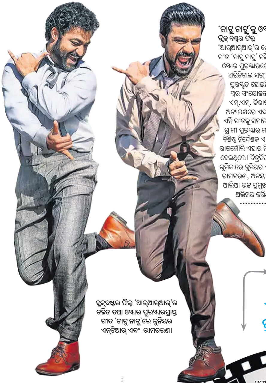
ରୁକ୍ମବତ୍ସର ଫିଲ୍ମ 'ଆରୁଆରୁଆରୁ'ର ଚଳିତ ତଥା ଓସ୍କାର ପୁରସ୍କାରପ୍ରାପ୍ତ ଗୀତ 'ନାଟୁ ନାଟୁ'ରେ କୁନିୟର ଅଭିନୟ କରିଥିଲେ ଏମ୍. ରାମଚରଣ।

'ନାଟୁ ନାଟୁ'କୁ ଓସ୍କାର ରୁକ୍ମବତ୍ସର ଫିଲ୍ମ 'ଆରୁଆରୁଆରୁ'ର ଗ୍ରୋଟାବୁଟ ଗୀତ 'ନାଟୁ ନାଟୁ' ଚଳିତ ବର୍ଷ ଓସ୍କାର ପୁରସ୍କାରରେ ବେଷ୍ଟ ଅଭିନୟ ପାଇଁ ବର୍ଷରେ ପୁରସ୍କୃତ ହୋଇଛି। ଏହାର ସ୍ୱର ସଂଯୋଜନା କରିଥିଲେ ଏମ୍.ଏମ୍. କରାଭାନି। ଅନ୍ୟପକ୍ଷରେ ଏବର୍ଷ ମଧ୍ୟ ଏହି ଗୀତକୁ ସମାନ ବର୍ଗରେ ଗ୍ରାମୀ ପୁରସ୍କାର ମଧ୍ୟ ମିଳିଛି। ବିଶିଷ୍ଟ ନିର୍ଦ୍ଦେଶକ ଏମ୍.ଏମ୍. ରାଜମୌଲି ଏହାର ନିର୍ଦ୍ଦେଶନା ଦେଇଥିଲେ। ଚିତ୍ରଟିର ମୁଖ୍ୟ ଭୂମିକାରେ କୁନିୟର ଏନ୍.ଟି.ଆର୍. ରାମଚରଣ, ଅଜୟ ଦେବଗନ, ଆଲିଆ ଭଟ୍ଟ ପ୍ରମୁଖ କଳାକାର ଅଭିନୟ କରିଥିଲେ।