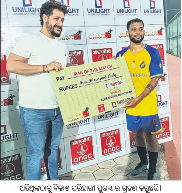
ଅତିଥିକଠାରୁ ବିକାଶ ପରିହାରି ପୁରସ୍କାର ଗ୍ରହଣ କରୁଛନ୍ତି।