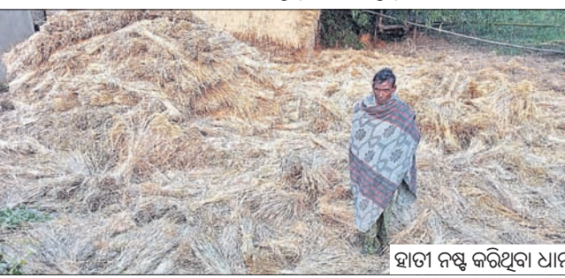
ହାତୀ ନଷ୍ଟ କରିଥିବା ଧାନ ।

ବାଲିଗୋଷ୍ଠି, ୨୭।୧୨ (ସଞ୍ଜୟ କୁମାର ଅଗ୍ରୱାଲ) ମୟୂରଭଞ୍ଜ ଜିଲ୍ଲା ବାଲିଗୋଷ୍ଠି ବ୍ଲକ୍ ଅଧୀନ ନାମ୍ତି ଗ୍ରାମ୍ୟ ଜଙ୍ଗଲରେ ଗତ ମାସକୁ ଉର୍ଦ୍ଧ୍ୱ ହେବ ୩୦ ହାତୀ ଆଞ୍ଚଳିକା ଜମାଭିତ୍ତି । ଏହି ହାତୀପଲ ପ୍ରତିଦିନ ସ୍ଥାନ ବୁଲୁଛି । ସ୍ଥାନୀୟ ଲୋକେ ଦନ୍ତା ଭୟରେ ରାତି ହେଲେ ଘରୁ ପଦାକୁ ବାହାରି ପାରୁନାହାନ୍ତି । କେତେବେଳେ ଜାଦିକା ଉତ୍ସୁକତା ଚ ପୁଣି କେବେ ବଳି ପଡ଼ୁଛି