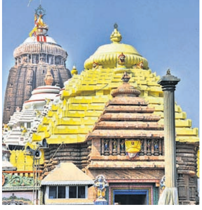
ଦୟାବାନନୀର ମନ୍ଦିର, ଯାଜପୁରର ବିରଜା ମନ୍ଦିର ଓ ବରାହ ମନ୍ଦିର, କଟକ ସାଲେପୁରର ରାମକୃଷ୍ଣପୁର ବାରୁସ୍ଥଳ, ଡେଙ୍କାନାଳର କମିଳାସ ଚନ୍ଦ୍ରଶେଖର ମନ୍ଦିର ଓ ବଳଦେବଜୀ ମନ୍ଦିର, କଳାହାଣ୍ଡିର ଭୂଷାଉଦୟିଆଶ୍ରମ ମନ୍ଦିର ଓ ଜଗନ୍ନାଥ ମନ୍ଦିର, ପାରଳାଖେମୁଣ୍ଡି ଜଗନ୍ନାଥ ମନ୍ଦିର, ଅସୁରଙ୍ଗ ମାଳବାର ବାରୁସ୍ଥଳ, ସାକ୍ଷୀଗୋପାଳସ୍ଥିତ ରାଜକୃଷ୍ଣପୁର ମନ୍ଦିର, ବାରିପଦା ଶ୍ରୀ ଶ୍ରୀ ହରି ବଳଦେବ ମନ୍ଦିରରେ

ଭୁବନେଶ୍ୱର, ୨୭।୧୨ (ଅନିଲ ଦାସ) ଶ୍ରୀମନ୍ଦିର ପରିକ୍ରମା ପ୍ରକଳ୍ପର ଲୋକାର୍ପଣ ଉତ୍ସବରେ ସାମିଲ ହେବା ପାଇଁ ବିଭିନ୍ନ ମନ୍ଦିରରେ ନିମନ୍ତ୍ରଣପତ୍ର ପହଞ୍ଚିଛି। ଏହି ବର୍ଷ ନିମନ୍ତ୍ରଣ ମଙ୍ଗଳବାରଠାରୁ ୩୦ଟି ଚିମ୍ବ ମଧ୍ୟମରେ ଆରମ୍ଭ ହୋଇଛି। ରାଜ୍ୟ ଭିତରେ ଓ ରାଜ୍ୟ ବାହାରେ ଥିବା ମନ୍ଦିରଗୁଡ଼ିକୁ ନିମନ୍ତ୍ରଣପତ୍ର ପ୍ରଦାନ କରାଯାଇଛି। ଭୁବନାର ବିଭିନ୍ନ ଦିଗରେ ଓଡ଼ିଶା ବାହାରେ କେତେକ ପଦ୍ମନାଭାସୀ ମନ୍ଦିର, ପୁସ୍ୟାଜର ସିଦ୍ଧିବିନାୟକ ମନ୍ଦିର, ଅହମ୍ମଦବାଦର ଜଗନ୍ନାଥ ମନ୍ଦିର, କାଳାଘାଟର କାଳୀ ମନ୍ଦିର ଓ ଖୁଦିରପୁର ଜଗନ୍ନାଥ ମନ୍ଦିର, ରାମେଶ୍ୱରୀ ଶ୍ରୀ ରାମନାଥସ୍ୱାମୀ ମନ୍ଦିର, ଚେନାଇର ଜଗନ୍ନାଥ ମନ୍ଦିର, ମହାଶୁଭରାମେଶ୍ୱରୀମନ୍ଦିର ଓ ଜଗନ୍ନାଥ ମନ୍ଦିର, ମଥୁରା କୃଷ୍ଣ ଜଗନ୍ନାଥ ସ୍ଥଳ, ତିରୁପତି ସଂସ୍କୃତ ବିଶ୍ୱବିଦ୍ୟାଳୟର ଶ୍ରୀଜଗନ୍ନାଥ ମନ୍ଦିର, ତିରୁମାଳା ତିରୁପତି, ମଧ୍ୟପ୍ରଦେଶର ଓଁକାରେଶ୍ୱର ଜ୍ୟୋତିର୍ଲିଙ୍ଗ, ବିଜୟପୁରର କନକବୁର୍ଗା ମନ୍ଦିର, ବୃନ୍ଦାବନର ବାଳେଶ୍ୱରୀ ମନ୍ଦିର ପୁଖ୍ୟମାନଙ୍କୁ ନିମନ୍ତ୍ରଣପତ୍ର ପ୍ରଦାନ କରାଯାଇଛି। ସେହିପରି ରାଜ୍ୟ ମଧ୍ୟରେ ପୁଲିକାଶୀର ଶ୍ରୀଜଗନ୍ନାଥ ମନ୍ଦିର,