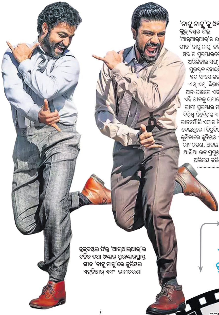
ରୁକ୍ମବତ୍ସର ଫିଲ୍ମ 'ଆରୁଆରୁଆରୁ'ର ଚଳିତ ତଥା ଓସାର ପୁରସ୍କାରପ୍ରାପ୍ତ ଗୀତ 'ନାଟୁ ନାଟୁ'ରେ କୁନିକା ଉପରେ ରାମଚରଣା

'ନାଟୁ ନାଟୁ'କୁ ଓସାର ରୁକ୍ମବତ୍ସର ଫିଲ୍ମ 'ଆରୁଆରୁଆରୁ'ର ଗ୍ରୋଟାବୃତ୍ତ ଗୀତ 'ନାଟୁ ନାଟୁ' ଚଳିତ ବର୍ଷ ଓସାର ପୁରସ୍କାରରେ ବେଷ୍ଟ ଅଭିନେତା ସଙ୍ଗ ବର୍ଷରେ ପୁରସ୍କୃତ ହୋଇଛି । ଏହାର ସ୍ୱର ସଂଯୋଜନା କରିଥିଲେ ଏମ୍.ଏମ୍. କରାଜାନି । ଅନ୍ୟପକ୍ଷରେ ଏବର୍ଷ ମଧ୍ୟ ଏହି ଗୀତକୁ ସମାନ ବର୍ଷରେ ଗ୍ରାମୀ ପୁରସ୍କାର ମଧ୍ୟ ମିଳିଛି । ବିଶିଷ୍ଟ ନିର୍ଦ୍ଦେଶକ ଏସ୍.ଏସ୍. ରାଜମୌଲି ଏହାର ନିର୍ଦ୍ଦେଶନା ଦେଇଥିଲେ । ଚିତ୍ରଟିର ମୁଖ୍ୟ ଭୂମିକାରେ କୁନିକା ଉପରେ ରାମଚରଣା, ଅଜୟ ଦେବଗନ, ଆଲିଆ ଭଟ୍ଟ ପ୍ରମୁଖ କଳାକାର ଅଭିନୟ କରିଥିଲେ ।