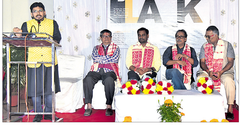
କାର୍ଯ୍ୟକ୍ରମରେ ମହାସାଥୀ ଅତିଥି।