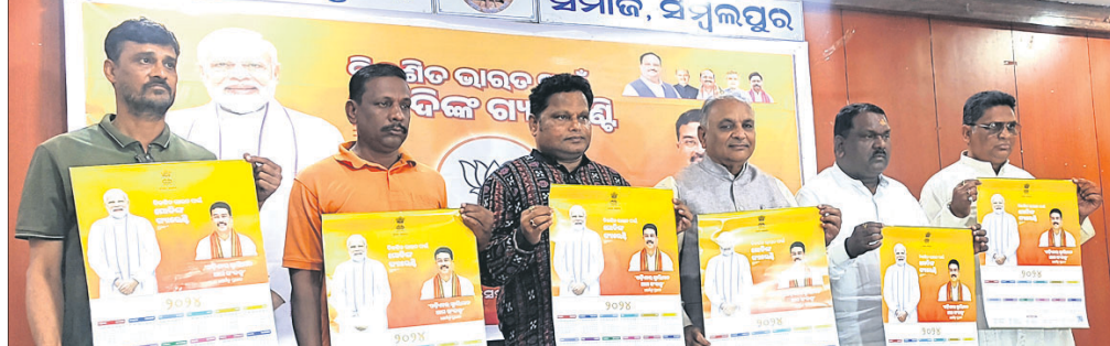
କାର୍ଯ୍ୟକ୍ରମରେ ସାମିଲ ଭାଜପା ନେତୃତ୍ୱ ।