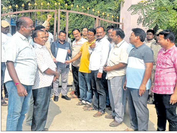
ବିଜେପୁର ତହସିଲଦାର ସ୍ମାରକପତ୍ର ଗ୍ରହଣ କରୁଛନ୍ତି।

ବରଗଡ଼ ଜିଲ୍ଲାର ପଦ୍ମପୁର ନୂତନ ଜିଲା ମାନ୍ୟତା ଦେବା ପାଇଁ ରାଜ୍ୟ ସରକାର ଯୋଜନା କରୁଥିବା ଜଣାପଡ଼ିଛି। ପଦ୍ମପୁର ଓ ବିଜେପୁର ନିର୍ବାଚନମଣ୍ଡଳକୁ ନେଇ ଏହି ନୂତନ ଜିଲା ଗଠନ ହେବ ବୋଲି ଚର୍ଚ୍ଚା ଚାଲିଛି। ତେବେ ନୂତନ ଜିଲା ଗଠନକୁ ସ୍ୱାଗତ କରାଯାଉଥିବାବେଳେ ବିଜେପୁର ରୁକ୍, ଏନ୍.ଏସି.ଏ.ଏ. ବରପାଲି ରୁକ୍, ଏନ୍.ଏସି.ଏ.ଏ. ପ୍ରସ୍ତାବିତ ପଦ୍ମପୁର ଜିଲ୍ଲାରେ ସାମିଲ ହେବେ ନାହିଁ ବୋଲି ଦାବି କରିଛନ୍ତି। ଏହି ଦାବି ନେଇ ରୁଧିରୀ ବିଜେପୁରରେ ସକାଳ ୬ଟାରୁ ସନ୍ଧ୍ୟା ୬ଟା ପର୍ଯ୍ୟନ୍ତ ୧୨ଘଣ୍ଟା ବନ୍ଦ ପାଳନ କରାଯାଇଛି। ବନ୍ଦକୁ ସ୍ୱତଃସ୍ଫୁର୍ତ୍ତ ସମର୍ଥନ ମିଳିଥିବା ଲକ୍ଷ୍ୟ କରାଯାଇଛି। ଅନ୍ୟପଟେ ଗୁରୁବାର ବରପାଲିରେ ଅନୁରୂପ ବନ୍ଦ ପାଳନ କରାଯିବ ବୋଲି ସୂଚନା ମିଳିଛି। ସକାଳ ୬ଟାରୁ ବିଜେପୁରର ସମସ୍ତ ସ୍କୋଲ, ବଜାର, ସରକାରୀ, ବେସରକାରୀ ଦସ୍ତୁର, ବ୍ୟାଙ୍କ, ସ୍କୁଲ, କଲେଜ ଆଦି ବନ୍ଦ ରହିଥିଲା। ଗାଡ଼ି ଚଳାଚଳ