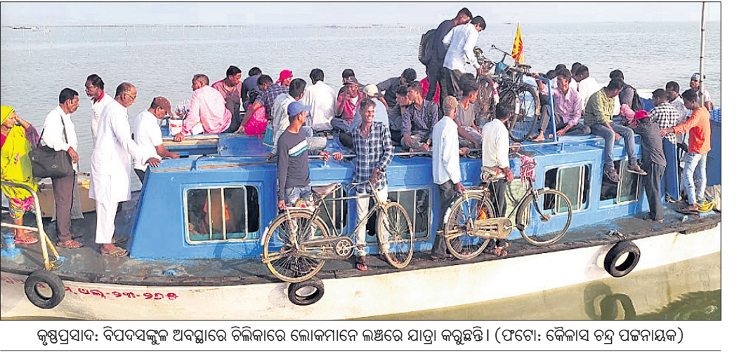
କୃଷ୍ଣପ୍ରସାଦ: ବିପଦସଙ୍କୁ ଅବସ୍ଥାରେ ତିଳିକାରେ ଲୋକମାନେ ଲଞ୍ଚରେ ଯାତ୍ରା କରୁଛନ୍ତି।