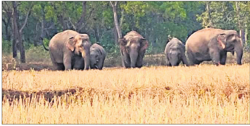
ଏକ ପାଟିଲା ଧାନ କ୍ଷେତରେ ହାତୀପଲ।