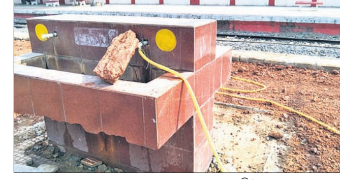
ବ୍ୟାପରେ ପଥର ଖଣ୍ଡ ରଖାଯାଇଛି।

ନିରାକାରପୁର, ୨୭.୧୨.୨୩ (ନାଥ ଚନ୍ଦ୍ର ପଟ୍ଟନାୟକ) ନିରାକାରପୁର ରେଳଷ୍ଟେଶନର ୨ ଓ ୩ ନମ୍ବର ପ୍ଲାଟଫର୍ମର ନବାବରଣ କାର୍ଯ୍ୟ କାରି ରହିଛି। ତେବେ ଏହି କାର୍ଯ୍ୟ ମଧ୍ୟ ଗତରେ ଚାଲିଥିବା ବେଳେ ଯାତ୍ରୀମାନେ ପିଲବା ପାଣି ପାଇଁ ହଇରାଣ ହେଉଛନ୍ତି। ଯାତ୍ରୀଙ୍କୁ ପାନୀୟଜଳ ଯୋଗାଇଦେବା ଲକ୍ଷ୍ୟରେ ରେଳବିଭାଗ ପକ୍ଷରୁ ୧୧ ନମ୍ବର ପ୍ଲାଟଫର୍ମରେ ଏକ ଆକ୍ୱାଟାର ବ୍ୟବସ୍ଥା କରାଯାଇଥିଲା। ଯାତ୍ରୀମାନେ ମଧ୍ୟ ଏହାର ଉପଯୋଗ କରିବା ସହ ପାଣି ପାଇଥିଲେ। ହେଲେ ରକ୍ଷଣାବେକ୍ଷଣ ଆଭାବରୁ ଏହା ତଳେପଡ଼ି ଭାଙ୍ଗିଯିବାରୁ ସମସ୍ତେ ହେବ ଅଟକହୋଇ ପଡ଼ିଛି। ଫଳରେ ଲୋକମାନେ ପିଲବା ପାଣି ଲାଗି ହଇରାଣ ହେଉଛନ୍ତି। ସେହିପରି