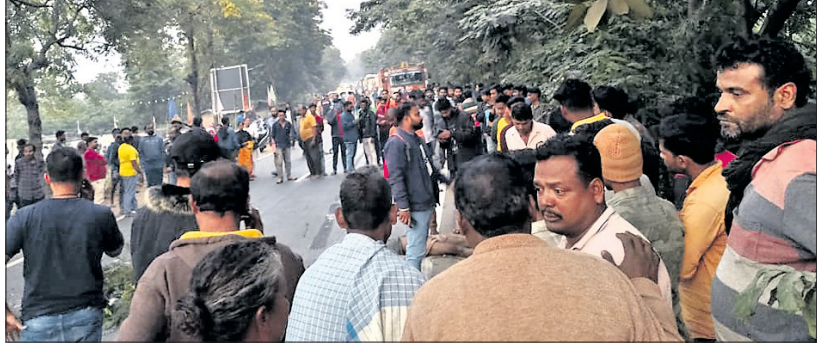
ଉତ୍ତରଜିନା ଲୋକେ ରାଜପଥ ଅବରୋଧ କରିଛନ୍ତି।

ଉତ୍ତରଜିନା, ରାସ୍ତାଘାଟକୋ, ରେଡ଼ାଖୋଲ, ୨୭.୧୨ (ଅକ୍ଷୟକାନ୍ତ ପୁରୋହିତ)