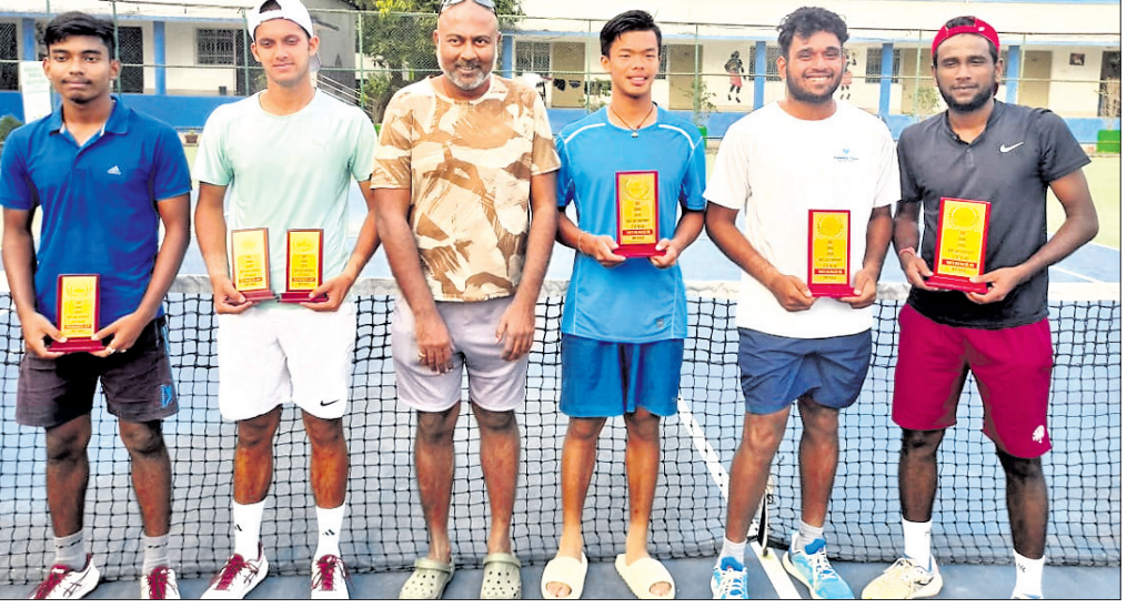
ପୁରସ୍କାର ସହ କୃତୀ ପ୍ରତିଯୋଗୀ। ଭୁବନେଶ୍ୱର, ୩୦.୧୨ (ସରୋଜ ଜେନା)

ବେଙ୍ଗାଲୁରୁ, ୩୦.୧୨ (ପି.ଟି.) ଭେଟେରାନ ଭାରତୀୟ ଗୋଲକିପର