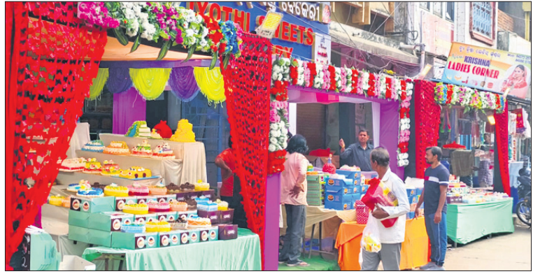
ଏକ କେନ୍ଦ୍ର ବୋକାନରେ ଲୋକଙ୍କ ଭିଡ଼।

ଗଜପତି ଜିଲ୍ଲା ପାରଳାଖେମୁଣ୍ଡି ସହରରେ ବିଦାୟା ବର୍ଷ ୨୦୨୩ ଓ ନବବର୍ଷ ୨୦୨୪କୁ ସ୍ୱାଗତ ପାଇଁ ସହରର ବିଭିନ୍ନ ସ୍ଥାନରେ ରଙ୍ଗାରଙ୍ଗ କାର୍ଯ୍ୟକ୍ରମ ଆୟୋଜନ କରାଯାଇଥିଲା। ୨୦୨୩ରେ ଯିଥିବା ବିଭିନ୍ନ କ୍ଷୁଦ୍ର ଯାକ୍ତିତ ରଖିବା ସହ ବର୍ଷ ୨୦୨୪କୁ ସ୍ୱାଗତ କରିବା ପାଇଁ ବିଭିନ୍ନ କାର୍ଯ୍ୟକ୍ରମ ସହ ଭୋଜିଭାତର ପ୍ରସ୍ତୁତି କରାଯାଇଛି। ଚଳିତ ବର୍ଷ ୨୦୨୩ର ଶେଷ ଦିନଟି ରବିବାର ହୋଇଥିବା ଯୋଗୁଁ ବିଭିନ୍ନ ପିକନିକ୍ ସ୍ଥଳରେ ବାହାରିବା ଆୟୋଜନ ହୋଇଥିଲା। ଫଳରେ ଆମିଷ ବଜାରରେ ଲୋକଙ୍କ ଭିଡ଼ ଦେଖିବାକୁ ମିଳିଥିଲା। ଅନ୍ୟପକ୍ଷରେ ଲୋକଙ୍କ ମନକୁ ହୁଆଇବା ସହ ବିଦାୟ ବର୍ଷକୁ ଭୁଲୁଣିବି କରିବା ପାଇଁ ବିଭିନ୍ନ କେନ୍ଦ୍ର ପୂଜା ଦୋକାନରେ ଭିଡ଼ ଜମିଥିଲା। ହୋଟେଲ