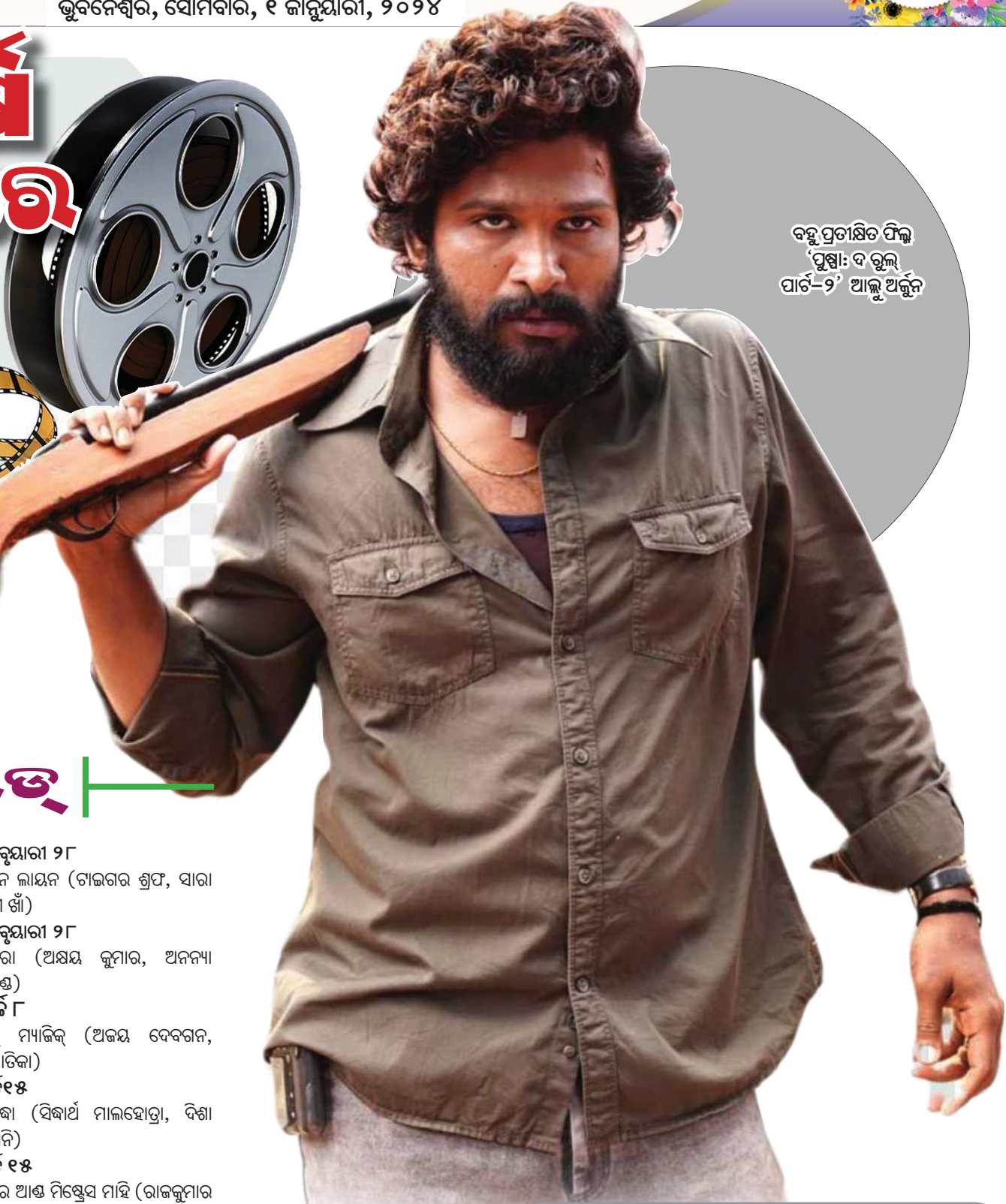
ବହୁ ପ୍ରତୀକ୍ଷିତ ଫିଲ୍ମ ‘ପୁଷ୍ପା: ଦ ବ୍ଲୁଜ୍ ପାର୍ଟ-୨’ ଆଲ୍ଟ ଅର୍ବୁନ୍