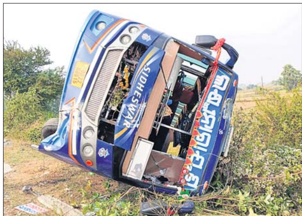
ପୁରୁଷୋତ୍ତମପୁରଠାରେ ଓଲଟି ପଡ଼ିଥିବା ବସ୍ ।

ନୂଆବର୍ଷ ପୂର୍ବରୁ ରବିବାର ପୂଜକ ସ୍ଥାନରେ ପିକନିକ୍ ବସ୍ ଓଲଟି ୪୦ରୁ ଊର୍ଦ୍ଧ୍ୱ ପର୍ଯ୍ୟନ୍ତ ଆହତ ହୋଇଛନ୍ତି । ଗଣାମ ଜିଲ୍ଲା ପୁରୁଷୋତ୍ତମପୁର ଓ ଦିଗପହଣ୍ଡି ନିକଟସ୍ଥ ତପ୍ତପାଣି ଘାଟି ଠାରେ ଏହି ଦୁର୍ଘଟଣା ଘଟିଛି । ତପ୍ତପାଣି ଘାଟିରେ ବସ୍ ଓଲଟି ୪୦ଜଣ ଆହତ ହୋଇଥିବା ବେଳେ ପୁରୁଷୋତ୍ତମପୁରଠାରେ ୧୦ଜଣ ଆହତ ହୋଇଛନ୍ତି । ଉଭୟ ଦୁର୍ଘଟଣାରେ ୧୫ଜଣଙ୍କ ଅବସ୍ଥା ଗୁରୁତର ରହିଛି । ସେମାନଙ୍କୁ ଜିଲ୍ଲା ମୁଖ୍ୟ ଚିକିତ୍ସାଳୟରେ ଭର୍ତ୍ତି କରାଯାଇଛି । ଗୁରୁତରଙ୍କ ମଧ୍ୟରେ ଅନେକ ମହିଳା ଓ ଶିଶୁ ଅଛନ୍ତି ।