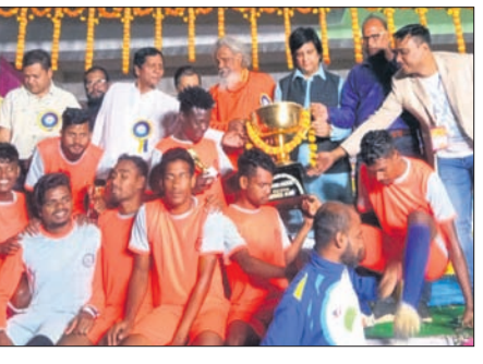
ଅତିଥିକୌରୁ ଟ୍ରଫି ଗ୍ରହଣ କରୁଛନ୍ତି ଚାମ୍ପିୟନ ଦଳ।