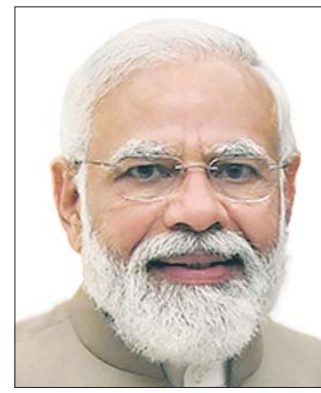
ହ୍ୟାଟ୍ରିକ୍ ଆଶାରେ ମୋଦି

ବିରୋଧୀଙ୍କ ସବୁ କୌଶଳ ଲାଗିଥିଲେ ବି ଅଯୋଧ୍ୟା ରାମମନ୍ଦିରରେ ରାମଲୀଳାଙ୍କ ପ୍ରାଣ ପ୍ରତିଷ୍ଠା ଉତ୍ସବ ଜାନ୍ତୁଥିବା ୨୨ରେ ହେବାକୁ ଯାଉଛି । ଏହି ମହୋତ୍ସବ ୨୦୨୪ ନିର୍ବାଚନରେ ଭାଜପା ପାଇଁ ଅନୁକୂଳ ଭଳି କାମ କରିବ । ଏଥିରୁ ସଂଖ୍ୟାଗରିଷ୍ଠ ହିନ୍ଦୁ ଭୋଟ ମିଳିପାରେ । ଦେଶର ୧୭% ଦଳିତମାନଙ୍କ ସମର୍ଥନ ହାସଲ ପାଇଁ ମୋଦି ସରକାର ଅଯୋଧ୍ୟାରେ ନବନିର୍ମିତ ଶ୍ରୀରାମ ଲକ୍ଷ୍ମଣନାମାଳା ସ୍ତମ୍ଭରାମଚଣ୍ଡୀ ନାମ ବଦଳାଇ ମହର୍ଷି ବାଲ୍ମୀକି ଅଟଳିତାୟ ବିନାମବନ୍ଦର ରୂପେ ସହାର ନୂଆ ନାମକରଣ କଲେ ଉଦ୍‌ଘାଟନ ଅବସରରେ ପୂର୍ବରୁ । ବାକି ରହିଲା ୧୪% ପୁସଲିମ୍ ଭୋଟ କଥା । ସଂଖ୍ୟାଳଘୁ ମହିଳା ଭୋଟରଙ୍କୁ ନିଜ ଆଡ଼କୁ ଆକର୍ଷିତ କରିବା ପାଇଁ ଭାଜପା ଜାନ୍ତୁଥିବାରୁ ନୂଆ ଅଭିଯାନ ଆରମ୍ଭ କରିବାକୁ ଯାଉଛି, 'ଶୁକ୍ରିୟା ମୋଦି ଭାଇଜାନ୍' । ଅନ୍ୟପକ୍ଷେ କଂଗ୍ରେସ ସାତରୁ ରାଜସ୍ଥାନ ଓ ଛତିଶଗଡ଼ ଖସିଯାଇଥିଲେ ଦୁଇ ଦେଲଜାମାନରେ ଦଳର ବିଜୟ ନେତା ଏବଂ କର୍ମୀଙ୍କୁ ସାନ୍ତନା ଦେଇଛି । ଅସୁବିଧା ଲୋକ ସଭା ନିର୍ବାଚନ କଂଗ୍ରେସ ପାଇଁ ମେକ୍-ଅର୍-ବ୍ରେକ୍ ସ୍ଥିତିରେ ଛିଡ଼ା କରାଯାଇଛି । ମୋଦି ପୂର୍ବତନ ପ୍ରଧାନମନ୍ତ୍ରୀ ଜବାହରଲାଲ ନେହେରୁଙ୍କ ସ୍ଥାନ ଛଡ଼ାଇନେବାକୁ ଅଧିକାରିଆବେଳେ ତାଙ୍କ ବଂଶୀକ ରାହୁଲ ଗାନ୍ଧୀ ନିଜ ଜୀବନର ସବୁକୁ ବଡ଼ ଅଗ୍ନିପରୀକ୍ଷାର ସମ୍ମୁଖୀନ ହେବାକୁ ଯାଉଛନ୍ତି ।