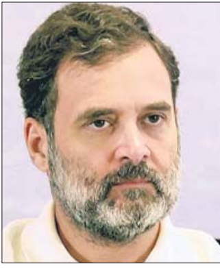
ନ୍ୟାୟ ଯାତ୍ରାରେ ରାହୁଲ

ଅନ୍ୟପକ୍ଷେ କଂଗ୍ରେସ ହାତରୁ ରାଜସ୍ଥାନ ଓ ଛତିଶଗଡ଼ ଖସିଯାଇଥିଲେ ଦୁଇ ଦେଲଜାମାରେ ଦଳର ବିଜୟ ନେତା ଏବଂ କର୍ମୀଙ୍କୁ ସ୍ୱାଗତା ଦେଇଛି। ଅସ୍ୱାଦଶ ଲୋକ ସଭା ନିର୍ବାଚନ କଂଗ୍ରେସ ପାଇଁ ମେକ୍-ଅର୍-ବ୍ରେକ୍ ଛ୍ରିତିରେ ଛିଡ଼ା କରାଇଛି। ମୋଦି ପୂର୍ବତନ ପ୍ରଧାନମନ୍ତ୍ରୀ ଜବାହରଲାଲ ନେହେରୁଙ୍କ ସ୍ଥାନ ଛଡ଼ାଇନେବାକୁ ଅର୍ଥା ଛିଡ଼ିଥିବାବେଳେ ତାଙ୍କ ବଂଶୀକ ରାହୁଲ ଗାନ୍ଧୀ ନିଜ ଜୀବନର ସବୁରୁ ବଡ଼ ଅଗ୍ନିପରୀକ୍ଷାର ସମ୍ମୁଖୀନ ହେବାକୁ ଯାଉଛନ୍ତି।