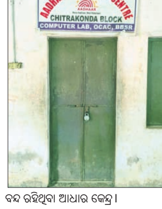
ବନ୍ଦ ରହିଥିବା ଆଧାର କେନ୍ଦ୍ର।

ମାଲକାନଗିରି ଜିଲ୍ଲା ଚିତ୍ରକୋଣ୍ଡା ଆଧାର କେନ୍ଦ୍ର ୨ ମାସ ହେଲା ଖୋଲାଯାଇ ନ ଥିବା ଅଭିଯୋଗ ହୋଇଛି। ୧୮ ପଞ୍ଚାୟତ ଲୋକେ ଦୁଆ ଆଧାର କାର୍ଡ, ନାମ, ଜନ୍ମ ତାରିଖ ଓ ମୋବାଇଲ ନମ୍ବର ସଂଯୋଗ ଇତ୍ୟାଦି ସଂଗୃହଣ ପାଇଁ ଆସୁଛନ୍ତି, କିନ୍ତୁ କେନ୍ଦ୍ର ବନ୍ଦ ରହିଥିବା ଅଭିଯୋଗ କରିଛନ୍ତି। ଯେତେବେଳେ ବି ଆଧାର କେନ୍ଦ୍ରକୁ ସଂଗୃହଣ ପାଇଁ ଆସିଲେ ତାହା ତାଲା ବନ୍ଦ ରହିଛି। ଦୂରଦୂରାନ୍ତରୁ ସଂଗୃହଣ ପାଇଁ