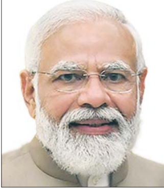
ହ୍ୟାଟ୍ରିକ୍ ଆଶାରେ ମୋଦି

ବିରୋଧୀଙ୍କ ସବୁ କୌଶଳ ଛତିମଧ୍ୟରେ ଅଯୋଧ୍ୟା ରାମମନ୍ଦିରରେ ରାମଲୀଳାଙ୍କ ପ୍ରାଣ ପ୍ରତିଷ୍ଠା ଉତ୍ସବ ଜାନ୍ତୁଯାଉ ୨୨ରେ ହେବାକୁ ଯାଉଛି। ଏହି ମହୋତ୍ସବ ୨୦୨୪ ନିର୍ବାଚନରେ ଭାଜପା ପାଇଁ ଅନୁକୂଳ ଭଳି କାମ କରିବ। ଏଥିରୁ ସଂଖ୍ୟାଗରିଷ୍ଠ ହିନ୍ଦୁ ଭୋଟ ମିଳିପାରେ। ଦେଶର ୧୭% ଦଳିତମାନଙ୍କ ସମର୍ଥନ ହାସଲ ପାଇଁ ମୋଦି ସରକାର ଅଯୋଧ୍ୟାରେ ନବନିର୍ମିତ ଶ୍ରୀରାମ ଭଞ୍ଜରାମଶାଳା ଯୋଗଦେଇ ନାମ ବଦଳାଇ ମହର୍ଷି ବାଲ୍ମୀକି ଅଟଳିତାୟ ବିନାବଦର ରୂପେ ଏହାର ନୂଆ ନାମକରଣ କଲେ ଉଦ୍‌ଘାଟନ ଅବ୍ୟବହିତ ପୂର୍ବରୁ। ବାକି ରହିଲା ୧୪% ପୁସଲିମ୍ ଭୋଟ କଥା। ସଂଖ୍ୟାଲଘୁ ମହିଳା ଭୋଟରଙ୍କୁ ନିଜ ଆଡ଼କୁ ଆକର୍ଷିତ କରିବା ପାଇଁ ଭାଜପା ଜାନ୍ତୁଯାଉ ନୂଆ ଅଭିଯାନ ଆରମ୍ଭ କରିବାକୁ ଯାଉଛି, 'ଶୁକ୍ତିୟା ମୋଦି ଭାଜପା'। ଅନ୍ୟପକ୍ଷେ କଂଗ୍ରେସ ହାତରୁ ରାଜସ୍ଥାନ ଓ ଛତିଶଗଡ଼ ଖସିଯାଇଥିଲେ ଦୁଇ ଦେଲଜାମାରେ ଦଳର ବିଜୟ ନେତା ଏବଂ କର୍ମୀଙ୍କୁ ସ୍ୱାଗତା ଦେଇଛି। ଅସ୍ୱାଦଶ ଲୋକ ସଭା ନିର୍ବାଚନ କଂଗ୍ରେସ ପାଇଁ ମେକ୍-ଅର୍-ବ୍ରେକ୍ ଛ୍ରିତିରେ ଛିଡ଼ା କରାଇଛି। ମୋଦି ପୂର୍ବତନ ପ୍ରଧାନମନ୍ତ୍ରୀ ଜବାହରଲାଲ ନେହେରୁଙ୍କ ସ୍ଥାନ ଛଡ଼ାଇନେବାକୁ ଅର୍ଥା ଛିଡ଼ିଥିବାବେଳେ ତାଙ୍କ ବଂଶୀକ ରାହୁଲ ଗାନ୍ଧୀ ନିଜ ଜୀବନର ସବୁରୁ ବଡ଼ ଅଗ୍ନିପରୀକ୍ଷାର ସମ୍ମୁଖୀନ ହେବାକୁ ଯାଉଛନ୍ତି।