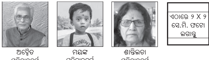
ଅବୈତ୍ ପରିବାରବର୍ଗ, ମୟଙ୍କ ପରିବାରବର୍ଗ, ଶାନ୍ତିଲତା ପରିବାରବର୍ଗ

ସଭାବକା: ଏହି କୁପନ ବ୍ୟବହାର କରି ସମ୍ପୂର୍ଣ୍ଣ ମାତ୍ରାରେ ଜନ୍ମଦିନ ଶୁଭେଚ୍ଛା ଜଣାନ୍ତୁ ।