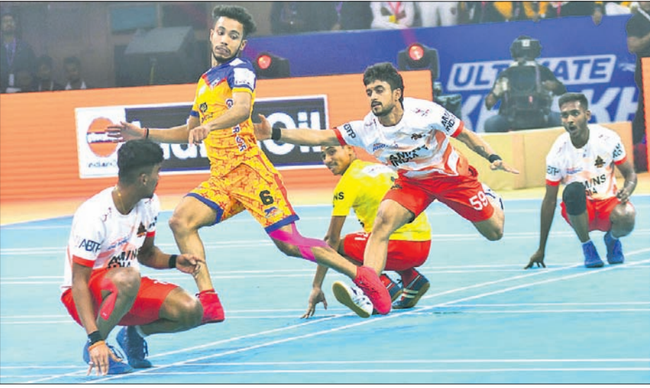
ଚେଲ୍ସି ଯୋଦ୍ଧା ଓ ଓଡ଼ିଶା ଜଗରନସ୍ତ୍ର ମଧ୍ୟରେ ଅନୁଷ୍ଠିତ ମ୍ୟାଚର ଏକ ସଂଘର୍ଷପୂର୍ଣ୍ଣ ମୁହୂର୍ତ୍ତ।

ଭୁବନେଶ୍ୱର, ୩୧୧୨ (ସରୋଜ କେନା) କଟକର ଜବାହରଲାଲ ନେହେରୁ ଷ୍ଟାଡ଼ିୟମରେ ଅନୁଷ୍ଠିତ ଅଲଟିମେଟ୍ ଖେଳା ଲିଗରେ କ୍ରମାଗତ ଦ୍ୱିତୀୟ ପରାଜୟ ବରଣ କରି ଡିଫେଣ୍ଡିଂ ଚାମ୍ପିୟନ ଓଡ଼ିଶା ଜଗରନସ୍ତ୍ର ରବିବାର ଅଲଟିମେଟ୍ ଖେଳା ଖେଳା ଅନୁଷ୍ଠିତ ମ୍ୟାଚରେ ଦଳ ଚେଲ୍ସି ଯୋଦ୍ଧା ନିକଟରୁ ୨୯-୨୮ରେ ପରାଜିତ ହୋଇଛି। କୁଲରାଟ କାଏଶ୍ ନିକଟରୁ ଶନିବାର ପରାଜିତ ହୋଇଥିବା ବେଳେ ରବିବାର ସଂଘର୍ଷ କରିଥିଲେ ମଧ୍ୟ ପରାଜିତ ହୋଇଛି। ଓଡ଼ିଶା ଆରମ୍ଭରୁ ପଛୁଆ ରହିଥିଲେ ମଧ୍ୟ ଦଳ ଚମତ୍କାର ପ୍ରତ୍ୟାବର୍ତ୍ତନ କରିଥିଲା।