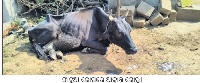
ଫାଟୁଆ ରୋଗରେ ଆକ୍ରାନ୍ତ ଗୋରୁ।

କୋରାପୁଟ ଜିଲ୍ଲା ନନ୍ଦପୁର ଓ ଲମତାପୁଟ ବ୍ଲକ୍ରେ ଫାଟୁଆ ରୋଗ ବ୍ୟାପିବାରେ ଲାଗିଛି। ସୁଇ ବୁକ୍ ଅଞ୍ଚଳରେ ଶତାଧିକ ସଂଖ୍ୟାରେ ଗୋରୁ, ମଇଁଷି ଆଦି ଫାଟୁଆ, ବୁଝି ଓ ଖୁରା ଘା ରୋଗରେ ପୀଡ଼ିତ ହେଉଥିବା ଦେଖିବାକୁ ମିଳିଛି। ଏହି ରୋଗର ନିରାକରଣ ପାଇଁ ବର୍ଷକୁ ବୁଝିଆ ବର୍ଷଦିନ ଓ ଶୀତଦିନ ପୂର୍ବରୁ ଗୋରୁକୁ ଚିକାକରଣ କରାଯିବା ବ୍ୟବସ୍ଥା ଥିଲେ ମଧ୍ୟ ଚଳିତ ବର୍ଷ ଶୀତଦିନ ପୂର୍ବରୁ ଚିକାକରଣ କରାଯାଇ ନ ଥିବାରୁ ରୋଗ ବ୍ୟାପୁଥିବା ପ୍ରାଣୀପାଳକ କହିଛନ୍ତି। ନନ୍ଦପୁର ବ୍ଲକ୍ରେ ଭଣ୍ଡାରିସାହି,