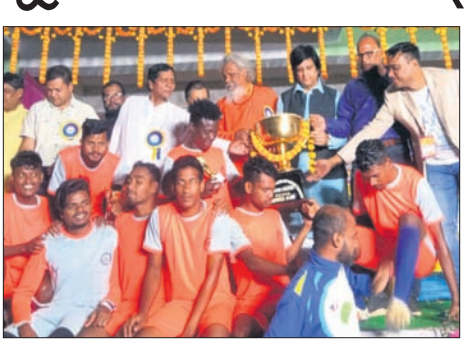
ଅତିଥିକଠାରୁ ଟ୍ରଫି ଗ୍ରହଣ କରୁଛନ୍ତି ଚାମ୍ପିୟନ ଦଳ।