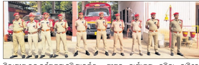
ବିଭାଗୀୟ ଉଚ୍ଚ କର୍ତ୍ତୃପକ୍ଷଙ୍କୁ ଦୃଷ୍ଟି ଆକର୍ଷଣ କରାଯାଇଥିଲେ ମଧ୍ୟ କୌଣସି ସୁସ୍ଥ ଅଗ୍ନିଶମ କର୍ମଚାରୀଙ୍କୁ ଦୃଷ୍ଟି ଆକର୍ଷଣ କରାଯାଇନଥିଲା।

ପୁରୀରୁ ଆସିଥିବା ୨୧ ଦିନ ହେଲା କଳାବ୍ୟାଜ ପିକି କାର୍ଯ୍ୟ କରୁଛନ୍ତି ଓଡ଼ିଶା ଅଗ୍ନିଶମ ସେବା କର୍ମଚାରୀ। ସେମାନଙ୍କ ଦାବି ପ୍ରତି ସରକାର ଅଣଦେଖା କରୁଥିବା ସେମାନେ ଅଭିଯୋଗ କରିଛନ୍ତି। ପୋଲିସ ବିଭାଗର ହାତୀକାଦୀ, କନଷ୍ଟେବଲଙ୍କ ପରି ସମାନ ପରାମ୍ପରା ଦେଇ ଆଗ୍ନିକ ଭାବେ ନିଯୁକ୍ତି ପାଇଥିଲେ ମଧ୍ୟ ଭେଦାନୁକୂଳ ଦରମାରେ ଚାରତମ୍ୟ ରହିଛି। ୨୦୧୦ରୁ ଓଡ଼ିଶା ପୋଲିସ କନଷ୍ଟେବଲ ଓ ହାତୀକାଦୀର ପାଉଥିବା ଦରମା ସହ ମୁଖ୍ୟ ଆଗ୍ନିକ, ଆଗ୍ନିକଙ୍କ ବେତନ ସମାନ ଥିଲା। ମାତ୍ର ଏହା ପରଠାରୁ ଦରମାରେ ଅସଙ୍ଗତ ଦେଖାଦେଇଛି। ଏ ନେଇ ବାରମ୍ବାର