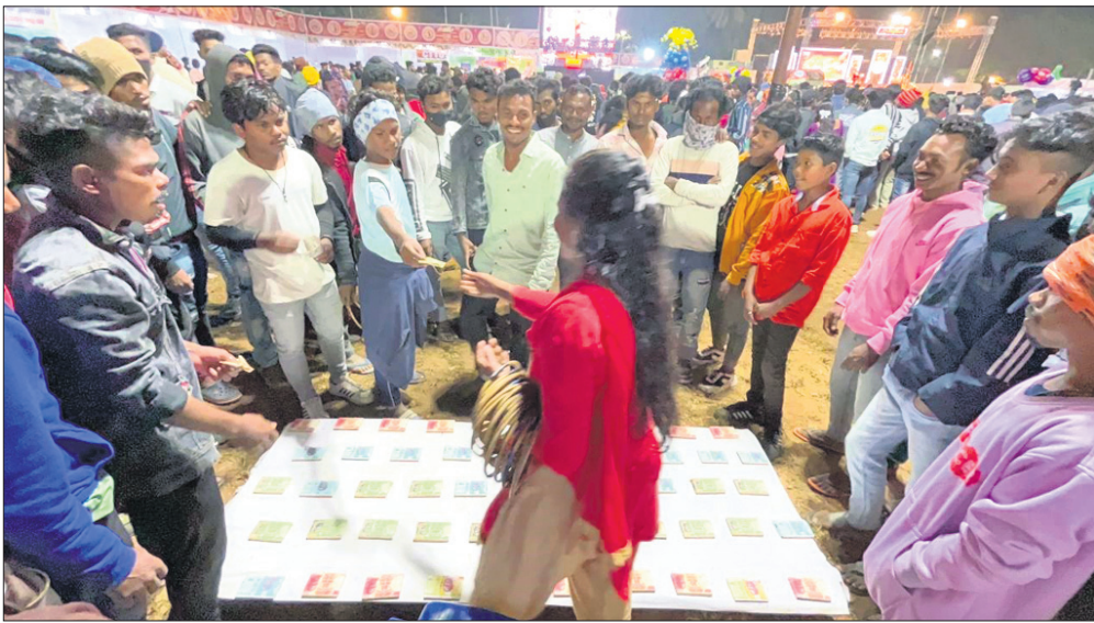
ଚଳିତ ମେଳାରେ ଚାଲିଥିବା ଗୁଡ଼ୁଗୁଡ଼ି ଖେଳ ।

ରାୟଗଡ଼ା ଲୋକ ମହୋତ୍ସବ ଚଳିତ ଓ ପଲ୍ଲିଶ୍ରୀ ମେଳା ଗତ ୪ ଦିନ ଧରି ମହାସମାରୋହରେ ପାଳିତ ହୋଇଛି ।