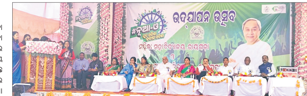
କାର୍ଯ୍ୟକ୍ରମରେ ମହାସାଥୀ ଅତିଥିମାନେ ।

ରାୟଗଡ଼ାସ୍ଥିତ ମହିଳା ଉଚ୍ଚ ମାଧ୍ୟମିକ ବିଦ୍ୟାଳୟ ଏବଂ ମହିଳା ମହାବିଦ୍ୟାଳୟରେ ଦୀର୍ଘ ୧ ମାସ ଧରି ଅନୁଷ୍ଠିତ ହେଉଥିବା ତୁଆ - ଓ ଯୁବ ଓଡ଼ିଶା ନବୀନ ଓଡ଼ିଶା କାର୍ଯ୍ୟକ୍ରମର ଉଦ୍‌ଘାଟିତ ହୋଇଛି ।