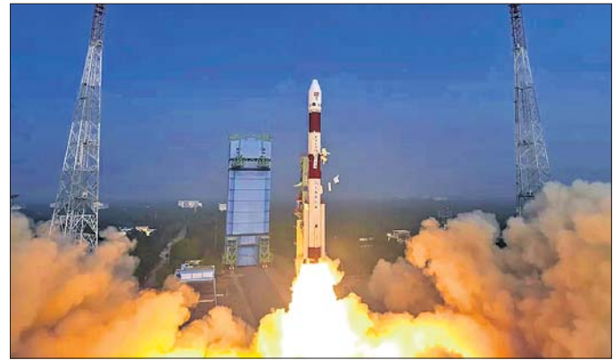
ଶ୍ରୀହରିକୋଟା, ୧୧ (ପି.ଟି.)

ରାଜ୍ୟର ବିକାଶର ପର୍ବ ଆପଣାମାନଙ୍କ ସହଯୋଗରେ ଆହୁରି ଆଗକୁ ବଢ଼ିବ।