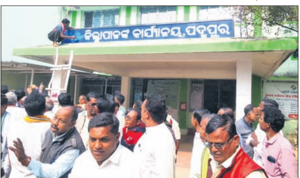
ଉପଜିଲ୍ଲାପାଳଙ୍କ ଅଧିକାରୀଙ୍କୁ ଲେଖିଲେ

ପଦ୍ମପୁର, ୧୧ (ପ୍ରବାସି ବାଣୀ) ବରଗଡ଼ ଜିଲ୍ଲା ପଦ୍ମପୁର ଉପନିର୍ବାଚନ ସମୟରେ ପ୍ରଚାର ପାଇଁ ଆସିଥିବାବେଳେ ୨୦୨୩ ଡିସେମ୍ବର ଶେଷଭାଗ ପଦ୍ମପୁରକୁ ନୂତନ ଜିଲ୍ଲା ମାନ୍ୟତା ପ୍ରଦାନ ନେଇ ମୁଖ୍ୟମନ୍ତ୍ରୀ ସରକାରଙ୍କ ଦେଇଥିଲେ। ଫଳରେ ଗତବର୍ଷ ଶେଷଭାଗ ପଦ୍ମପୁର ଜିଲ୍ଲା ମାନ୍ୟତା ପାଇବ ବୋଲି ଅନୁମୋଦିତ ହୋଇଥିଲା। ଏହାପରେ ଏକ ଶୋଭାଯାତ୍ରାରେ ସେମାନେ ସ୍ଥାନୀୟ ଉପଜିଲ୍ଲାପାଳଙ୍କୁ ଅଧିକାରୀଙ୍କୁ ଲେଖିଲେ।