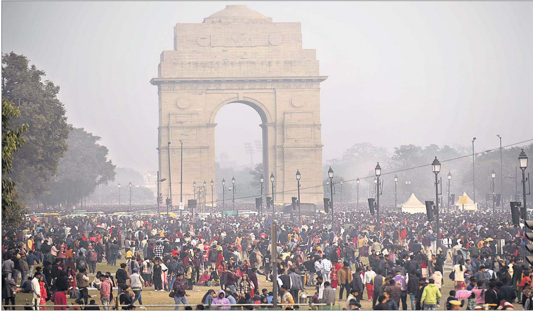
ନୂଆଦିଲ୍ଲୀର ପ୍ରଧାନ ଦିନରେ ବହୁ ସଂଖ୍ୟକ ଲୋକ ନୂଆଦିଲ୍ଲୀରେ ଉପସ୍ଥିତ ହୋଇ ପୂର୍ଣ୍ଣାଙ୍ଗ ପ୍ରଦର୍ଶନ କଲେ।