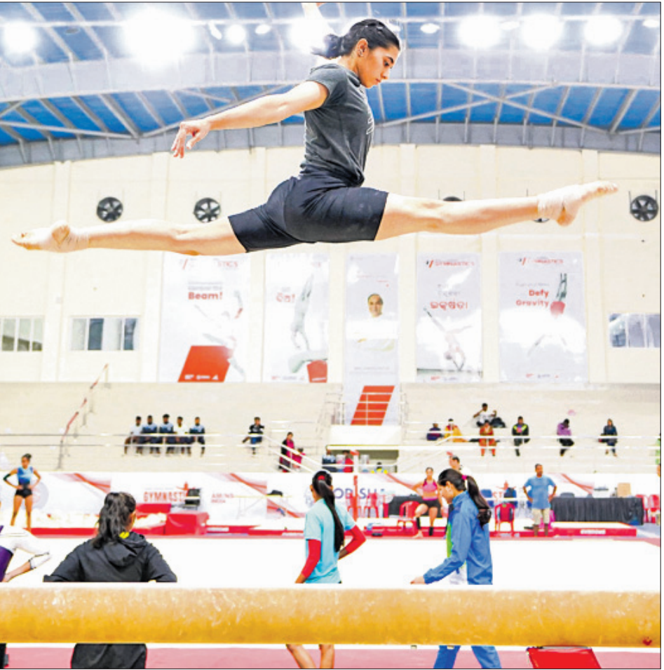
ଜାତୀୟ ସିନିୟର ଆର୍ଟିଷ୍ଟିକ୍ ଜିମ୍ନାଷ୍ଟିକ୍ ଆରମ୍ଭ ପୂର୍ବରୁ କଳିଙ୍ଗ ଷ୍ଟାଡ଼ିୟମର ଜିମ୍ନାଷ୍ଟିକ୍ ସେଣ୍ଟରରେ ସୋନବାର ବୁଲ ପ୍ରତିଯୋଗୀ ଅଭ୍ୟାସ କରୁଛନ୍ତି।