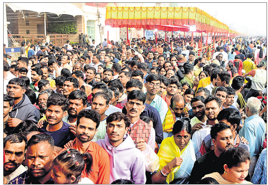
ନୂଆବର୍ଷ ପ୍ରଥମ ଦିନରେ ଶ୍ରୀମନ୍ଦିରରେ ଶ୍ରୀଜୀଉଙ୍କୁ ଦର୍ଶନ କରିବା ଲାଗି ଶ୍ରଦ୍ଧାଳୁଙ୍କ ଭିଡ଼।