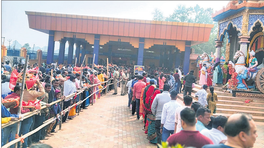
ଦର୍ଶନ ପାଇଁ ଧାଡ଼ିରେ ଛିଡ଼ା ହୋଇଥିବା ଶ୍ରଦ୍ଧାଳୁ

ଘଟଗାଁ, ୧୧ (ରାଜେନ୍ଦ୍ର କୁମାର ପଟ୍ଟନାୟକ) କେନ୍ଦୁଝର ଜିଲ୍ଲା ଘଟଗାଁବାସିନୀ ମା' ତାରିଣୀ ପୀଠ ସୋମବାର ଇଂରାଜୀ ନବବର୍ଷର ୧ମ ଦିନରେ ଭକ୍ତମୟ ହୋଇଯାଇଥିଲା। ସକାଳ ୫ଟାରୁ ଦର୍ଶନ ଆରମ୍ଭ ହୋଇଥିବା ବେଳେ ଲକ୍ଷାଧିକ ଶ୍ରଦ୍ଧାଳୁ ମା'ଙ୍କ ସୁନାବେଶ ଦର୍ଶନ କରିଥିଲେ। ରାତି ୮ଟା ପର୍ଯ୍ୟନ୍ତ ଦର୍ଶନ ପାଇଁ ଲକ୍ଷାଧିକ ଲାଗି ରହିଥିଲା। ନବବର୍ଷ ଅବସରରେ ମନ୍ଦିର ପ୍ରଣାସନ ପକ୍ଷରୁ ମା'ଙ୍କର ପ୍ରିୟ ଭୋଗ ନଡ଼ିଆ ଲତ୍ତ ଭକ୍ତଙ୍କୁ ବନ୍ଧା ଯାଇଥିଲା। ସକାଳେ ମା'ଙ୍କ ସୁନାବେଶ ଦର୍ଶନ ପାଇଁ ଭକ୍ତଙ୍କ ମଧ୍ୟରେ ପ୍ରବଳ