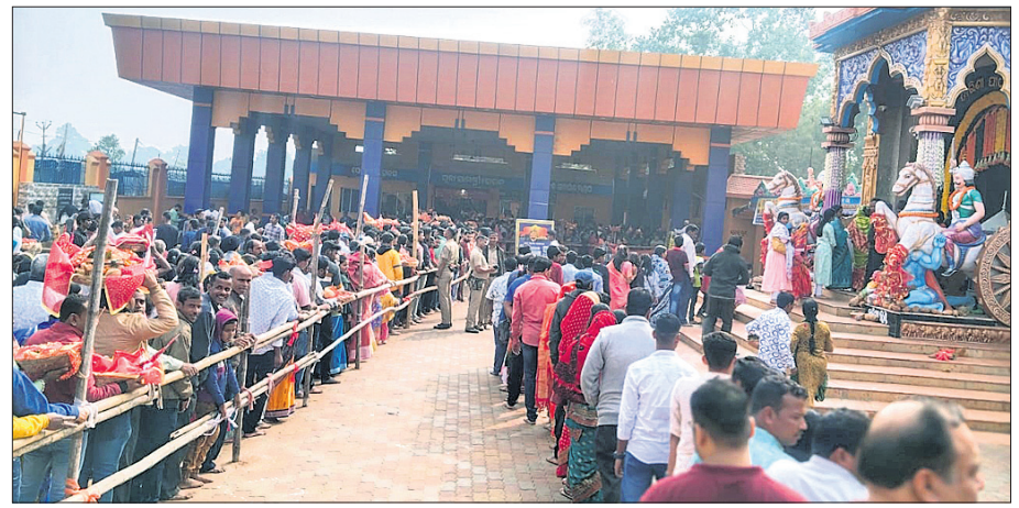
ଦର୍ଶନ ପାଇଁ ଧାଡ଼ିରେ ଛିଡ଼ା ହୋଇଥିବା ଶ୍ରଦ୍ଧାଳୁ।