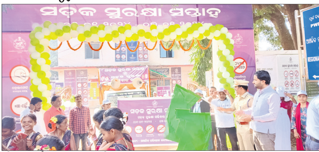
ଅତିଥିମାନେ କାର୍ଯ୍ୟକ୍ରମକୁ ଉଦଘାଟନା କରୁଛନ୍ତି ।