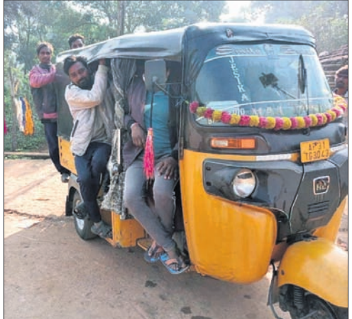
ଅଗୋରେ ବିପଦସଙ୍କୁଳ ଅବସ୍ଥାରେ ଯାତ୍ରୀ ପରିବହନ କରାଯାଇଛି