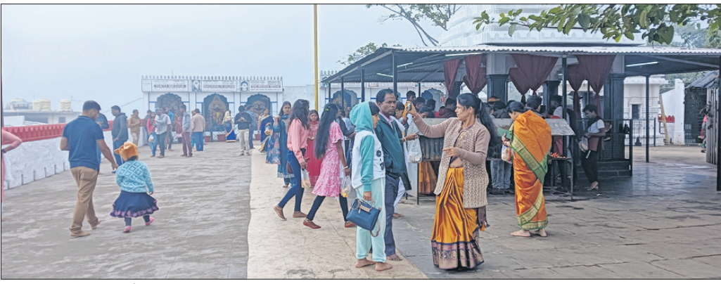
ମନ୍ଦିରରେ ପୂଜାର୍ଚ୍ଚନା ପାଇଁ ଲୋକଙ୍କ ଭିଡ ।

ପୂଜାର୍ଚ୍ଚନା ଓ ଭୋଜିଭାତରେ କୋରାପୁଟରେ ନୂଆବର୍ଷ-୨୦୨୪ର ପ୍ରଥମ ଦିନ କଟିଛି । ଲୋକେ ପ୍ରବଳ ଶୀତ ସତ୍ତ୍ୱେ ବଡ଼ି ଭୋରକୁ ସହରର ଶାନ୍ତ ଶ୍ରୀକ୍ଷେତ୍ର ସମେତ ଗ୍ରାମଦେବୀ ପୁରୁଷଲୁଣା ମନ୍ଦିର, ବାଟେନାମା ମନ୍ଦିର ସମେତ ବିଭିନ୍ନ ମନ୍ଦିରରେ ପୂଜାର୍ଚ୍ଚନା କରି ନିଜ ପରିବାରର ଶୁଭ ମନାସିଲ୍ଲତି ସେହିପରି ଛୁମୁରିପୁଟ ରାମମନ୍ଦିରରେ ବହୁ ଶ୍ରଦ୍ଧାଳୁଙ୍କ ସମାଗମ ହୋଇଥିଲା । ନବବର୍ଷ ନିଜ ପରିବାର ତଥା ସମସ୍ତଙ୍କ ପାଇଁ ଖୁସି ଆଣିବେଳ ବୋଲି ସମସ୍ତେ କାମନା କରିଥିଲେ । ରବିବାର ବିକଳପିତ ଭାତିରେ ଜିରୋ ନାଉଟ ପର୍ଯ୍ୟନ୍ତ ସହରର ବିଭିନ୍ନ କୁବ ଓ ବିଭିନ୍ନ ଅନୁଷ୍ଠାନ ବାଣୀ ଫୁଟାଇ ନବବର୍ଷକୁ ସ୍ୱାଗତ କରିଥିଲେ । ସୋମବାର ନବବର୍ଷ ଅବସରରେ କୋରାପୁଟଠାରେ ୧୫ କି.ମି. ଦୂର ଡେଲେଜିଭ ଜଳଭଣ୍ଡାରରେ ଲୋକଙ୍କ ଭିଡ ଜମିଥିଲା । ଲୋକମାନେ ନିଜ ପରିବାର ଓ ସାଙ୍ଗସାଥୀଙ୍କ ସହ ଜଳଭଣ୍ଡାର ପାର୍ଶ୍ୱରେ ଭୋଜି କରି ଖୁସି ମନାଉଥିବା ଦେଖିବାକୁ ମିଳିଥିଲା । ସେହିପରି କୋରାପୁଟ ଜିଲାର ଦେଓମାଳି, ପତ୍ତି, ରାଣାଡୁଡୁମା, ତେଲୋଜିଭ ଜଳ ଭଣ୍ଡାର, କେରେଲା, କୋଲାବ ଚ୍ୟାମ୍, ଗୁପ୍ତେଶ୍ୱର, ଛୁଡୁମା, ଗୁଲୁମି ଆଦି ସ୍ଥାନରେ ବହୁ ପର୍ଯ୍ୟଟକ ପ୍ରାକୃତିକ ପରିବେଶରେ ନୂଆବର୍ଷ-୨୦୨୪କୁ ସ୍ୱାଗତ କରି ପାଳନ କରିଥିଲେ ।