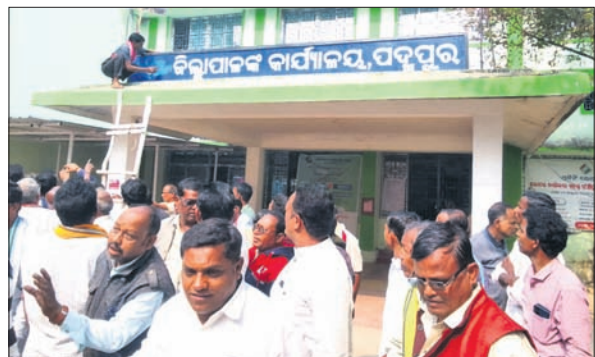
ଉପଜିଲ୍ଲାପାଳଙ୍କ ଅଧିକାର ସମ୍ପର୍କରେ ପଦ୍ମପୁରରୁ 'ଉପ' ଶବ୍ଦକୁ ଲିଭାଯାଇଛି।

ବରଗଡ଼ ଜିଲ୍ଲା ପଦ୍ମପୁର ଉପନିର୍ବାଚନ ସମୟରେ ପ୍ରଚାର ପାଇଁ ଆସିଥିବାବେଳେ ୨୦୨୩ ଡିସେମ୍ବର ଶେଷଭାଗ ପଦ୍ମପୁରକୁ ନୂତନ ଜିଲ୍ଲା ମାନ୍ୟତା ପ୍ରଦାନ ନେଇ ମୁଖ୍ୟମନ୍ତ୍ରୀ ସରକାରଙ୍କ ଦେଇଥିଲେ। ଫଳରେ ଗତବର୍ଷ ଶେଷଭାଗ ପଦ୍ମପୁର ଜିଲ୍ଲା ମାନ୍ୟତା ପାଇବ ବୋଲି ଅନୁମାନ କରାଯାଉଥିଲା। ସେହିପରି ଜିଲ୍ଲାପାଳଙ୍କ ଅଧିକାର ନିର୍ବାଣ ନେଇ ରାଜ୍ୟର ଉପକ୍ରମ ରାଜ୍ୟ ଆନ୍ଧ୍ର (ଆରଡିସି)ଙ୍କ ବାରା ଛାଡ଼ା ଦିବସ, ପଦ୍ମପୁରରେ ପ୍ରଥମଥର ପାଇଁ ଅଭିନବ ପ୍ରତିବାଦ ଆଦାନ ହୋଇଥିଲା। କିନ୍ତୁ ରବିବାର ୨୦୨୩ ବିବାହ ନେଇ ଗଠନ ପଛ ପଦ୍ମପୁରକୁ ନୂତନ ଜିଲ୍ଲା ମାନ୍ୟତା ମିଳିଲା। ଫଳରେ ପଦ୍ମପୁର ଅଞ୍ଚଳର ଉପକ୍ରମ ନିରାଶ ହେବାକୁ ପଡ଼ିଛି ଏବଂ ଏହାକୁ ନେଇ ପୁଣି ଅସନ୍ତୋଷ କୁହୁଛି। ଏହି କ୍ରମରେ ସୋମବାର