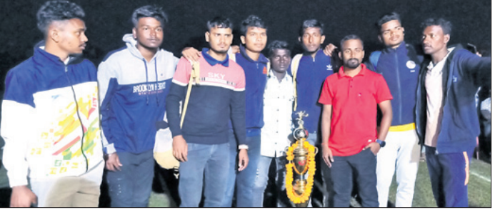
ଚାମ୍ପିୟନ ଯୁବାଇଚେତ୍ କୁବ ଦଳର ଖେଳାଳିମାନେ ଟ୍ରଫି ସହ

ଗୋପାଳୀ ଆଧୁନିକ ଆସୋସିଏଟସ୍ ବରାହୀପୁର ପକ୍ଷରୁ ଗୁମାସ୍ତା-ବରାହୀପୁର ଖେଳ ପଡ଼ିଆରେ ସୋମବାର ଆୟୋଜିତ ଦିନିକିଆ ବରାହୀପୁର କପ୍ ପୁଅବଲ ଟୁର୍ନାମେଣ୍ଟର ପାଇନାଲ ମ୍ୟାଚରେ