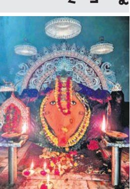
ରୌପ୍ୟ ଅଳଙ୍କାର ଆଭୂଷଣରେ ମା' ସମଲେଶ୍ୱରୀ