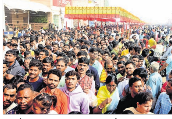
ନୂଆବର୍ଷ ପ୍ରଥମ ଦିନରେ ଶ୍ରୀମନ୍ଦିରରେ ଶ୍ରୀକ୍ଷେତ୍ର ଦର୍ଶନ କରିବା ଲାଗି ଶ୍ରଦ୍ଧାଳୁଙ୍କ ଭିଡ଼