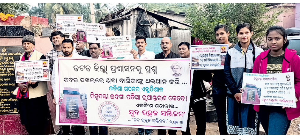
କଟକ ଇନ୍ଦ୍ରା ପତିଆ ରୂପାନ୍ତରଣ ଦାବିରେ ଇନ୍ଦ୍ରା ପତିଆସ୍ଥିତ ଉତ୍କଳ ସମିଳନୀ ଶତବାସିନୀ ସ୍ମୃତିସ୍ତମ୍ଭ ନିକଟରେ ନବ ଉତ୍କଳ ସମିଳନୀ ଯୁବଶାଖା ପକ୍ଷରୁ ବିରୋଧ ପ୍ରଦର୍ଶନ।