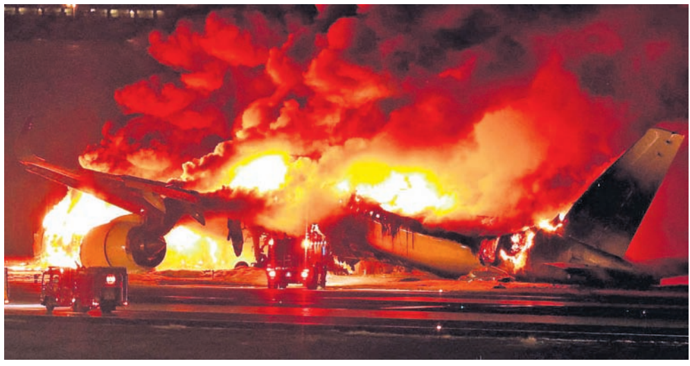
ଗୋକିଓର ହାନେତା ଏୟାରପୋର୍ଟରେ ତଟସୁରକ୍ଷା ବାହିନୀ ବିମାନକୁ ଧକ୍କାଦେବା ପରେ ଜାପାନ ଏୟାରଲାଇନ୍ସର ବିମାନ ଜଳିଯାଇଛି।

ଦେଇଥିଲା। ତଟସୁରକ୍ଷା ବାହିନୀ ଘଟଣାର ସବିଶେଷ ତଦନ୍ତ ଚଳାଇଛି। ଏୟାରବସ୍ ବିମାନଟି ଜଳୁଥିବାବେଳେ ଏହାର କ୍ୟାବିନ୍ ଧୂଆଁରେ ଭରି ହୋଇଥିବାର ଫଟୋ ଜଣେ ଯାତ୍ରୀ ସୋସିଆଲ ମିଡ଼ିଆରେ ଛାଡ଼ିଛନ୍ତି। ବିମାନ ଜଳୁଥିବା ଦୃଶ୍ୟ ଟେଲିଭିଜନରେ ମଧ୍ୟ ଦେଖିବାକୁ ମିଳିଛି। ରତ୍ନଝେର ମଧ୍ୟ ବିମାନର ଜଳନ୍ତା ଅଂଶ ପଡ଼ିରହିଛି। ନିଆଁଲିଭା କାର୍ଯ୍ୟରେ ୭୦ଟି ଦମକକକୁ ନିୟୋଜିତ କରାଯାଇଛି। ଘଟଣାର ତଦନ୍ତ କରାଯାଉଥିବା ଭିଜିଭିନି, ପରିବହନ ଓ ପର୍ଯ୍ୟଟନ ମନ୍ତ୍ରାଳୟ କହିଛି। ସୂଚନାଯୋଗ୍ୟ, ୧୯୮୫ରେ ଜାପାନରେ ବିଶ୍ୱର ସବୁଠୁ ମର୍ତ୍ତ୍ୟ ବିମାନ ଦୁର୍ଘଟଣା ଘଟିଥିଲା। ଗୋକିଓରୁ ଓସାକା ଯାଉଥିବା ଏକ ଜୁମ୍ପ୍ ବିମାନ କେନ୍ଦ୍ରୀୟ ଗୁରୁତ୍ୱା ଅଞ୍ଚଳରେ ଦୁର୍ଘଟଣାଗ୍ରସ୍ତ ହେବାକୁ ୫୨୦ ଯାତ୍ରୀ ଓ ବିମାନ କର୍ମଚାରୀଙ୍କ ମୃତ୍ୟୁ ଘଟିଥିଲା।