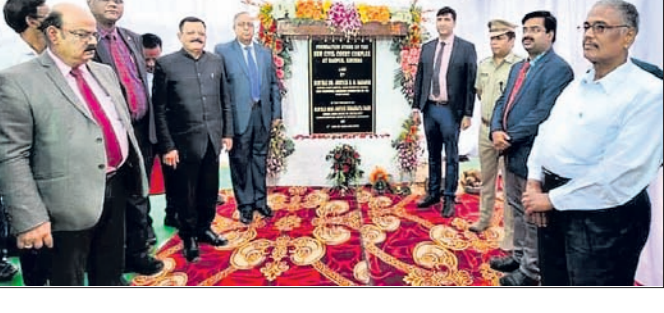
ଗୟାରାମୁଣ୍ଡା, ୨୧