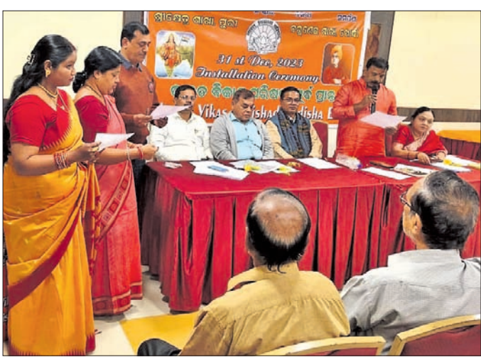
କାର୍ଯ୍ୟକ୍ରମରେ ଉପସ୍ଥିତ ଅତିଥି ଏବଂ ଅନ୍ୟମାନେ।