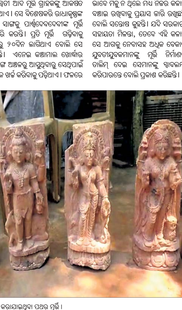
ଅଧିକ ମୂଲ୍ୟ ଦେଇ ପଥର ଓ ମେଶିନ କିଣିବାକୁ ସେ ବାଧ୍ୟ ହେଉଛନ୍ତି। ତେବେ ହାତତିଆରି ନାରାୟଣ, ଲକ୍ଷ୍ମୀ, ହନୁମାନ, ସରସ୍ୱତୀ ଆଦି ମୂର୍ତ୍ତି ଗ୍ରାହକଙ୍କୁ ଆକର୍ଷିତ କରିଥାଏ। ସେ ବିଶେଷକରି ରାଧାକୃଷ୍ଣଚ ମୂର୍ତ୍ତି ସାଙ୍ଗକୁ ପାର୍ଶ୍ୱଦେବଦେବୀଙ୍କ ମୂର୍ତ୍ତି ତିଆରି କରନ୍ତି। ପ୍ରତି ମୂର୍ତ୍ତି ରଚିବାକୁ ୧୫ରୁ ୨୦ଦିନ ଲାଗିଥାଏ ବୋଲି ସେ କୁହନ୍ତି। ଏନେଇ କଞ୍ଚାମାଲ ଖୋର୍ଦ୍ଧାର ରାଜ୍ୟରେ ମଧ୍ୟ ରହିଛି। ପଥରକୁ ନିଜ ହାତରେ ନିହାଣ ଓ

ଲୁହା ମୁଗୁର ସାହାଯ୍ୟରେ ବାଡ଼େଇ ସୁନ୍ଦର କାରୁକାର୍ଯ୍ୟ କରୁଛନ୍ତି। ତାଙ୍କ ହାତତିଆରି ନାରାୟଣ, ଲକ୍ଷ୍ମୀ, ହନୁମାନ, ସରସ୍ୱତୀ ଆଦି ମୂର୍ତ୍ତି ଗ୍ରାହକଙ୍କୁ ଆକର୍ଷିତ କରିଥାଏ। ସେ ବିଶେଷକରି ରାଧାକୃଷ୍ଣଚ ମୂର୍ତ୍ତି ସାଙ୍ଗକୁ ପାର୍ଶ୍ୱଦେବଦେବୀଙ୍କ ମୂର୍ତ୍ତି ତିଆରି କରନ୍ତି। ପ୍ରତି ମୂର୍ତ୍ତି ରଚିବାକୁ ୧୫ରୁ ୨୦ଦିନ ଲାଗିଥାଏ ବୋଲି ସେ କୁହନ୍ତି। ଏନେଇ କଞ୍ଚାମାଲ ଖୋର୍ଦ୍ଧାର ରାଜ୍ୟରେ ମଧ୍ୟ ରହିଛି। ପଥରକୁ ନିଜ ହାତରେ ନିହାଣ ଓ