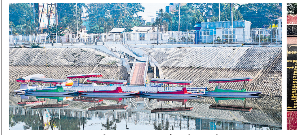
କଟକ ଯୋଡ଼ାସ୍ଥିତ ଚାଳବନ୍ଧା କେନାଲରେ ପର୍ଯ୍ୟାପ୍ତ ପରିମାଣର ପାଣି ନ ଥିବାରୁ ବୋର୍ଡ଼ ଚାଳକ ସାମୟିକ ଭାବେ ବନ୍ଦ ରହିଛି।