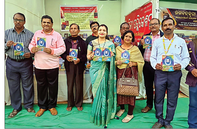
ଶ୍ରୀକ୍ଷେତ୍ର ପୁସ୍ତକ ମେଳାରେ କାର୍ଯ୍ୟକ୍ରମ ଉଦ୍ଘୋଷଣା କରାଯାଇଛି ।