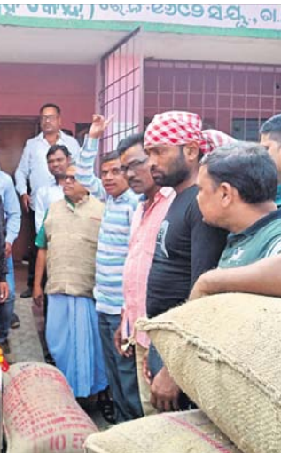
ତିରିଆରେ ଧାନ ମଣିର ଶୁଭାରମ୍ଭ କରାଯାଇଛି।