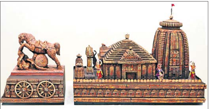
କେନ୍ଦ୍ର ସରକାର ଦ୍ୱାରା ବାଦ୍ ପଡ଼ିଥିବା ୨୦୨୩ ମସିହାର ପ୍ରସ୍ତାବିତ ଓଡ଼ିଶା ପ୍ରଜ୍ଞାପନ ମେଡ଼ ନମୁନା।

ପ୍ରତ୍ୟେକ ବର୍ଷ ଜାନୁଆରୀ ୨୬ ତାରିଖ ସାଧାରଣତନ୍ତ୍ର ଦିବସରେ ଦୁଆଦିଲ୍ଲିହ୍ତିତ ରାଜ୍ୟପତ୍ତରେ ହେଉଥିବା ପରେଭେରେ ବିଭିନ୍ନ ରାଜ୍ୟର ପ୍ରଜ୍ଞାପନ ମେଡ଼(ଡାକ୍ତରୀ) ପ୍ରଦର୍ଶିତ ହୋଇଥାଏ। ପ୍ରତିବର୍ଷ କେନ୍ଦ୍ରରୁ ରାଜ୍ୟର ପ୍ରଜ୍ଞାପନ ମେଡ଼ ପ୍ରଦର୍ଶନ କରାଯିବ ସେନେଇ ପ୍ରତିରକ୍ଷା ଏବଂ ସଂସ୍କୃତି ମନ୍ତ୍ରାଳୟ ପକ୍ଷରୁ ଚୟନ କରିଥାଆନ୍ତି। ହେଲେ ଗତ ୩ବର୍ଷ ଅର୍ଥାତ୍ ୨୦୨୧, ୨୦୨୨ ଏବଂ ୨୦୨୩ ସାଧାରଣତନ୍ତ୍ର ଦିବସରେ ଓଡ଼ିଶା ଚୟନ ତାଲିକାରୁ ବାଦ୍ ପଡ଼ିଆସୁଛି। ଶେଷଥର ଲାଗି ୨୦୨୦ ଜାନୁଆରୀ ୨୬ରେ ଓଡ଼ିଶା ପ୍ରଜ୍ଞାପନ ମେଡ଼କୁ ପ୍ରଦର୍ଶନ କରିବାର ସୁଯୋଗ ମିଳିଥିଲା। ଚଳିତ ବର୍ଷ ଓଡ଼ିଶାର ପ୍ରଜ୍ଞାପନ ମେଡ଼କୁ ସୁଯୋଗ ମିଳିବ ନା ନାହିଁ ସେନେଇ ଏ ପର୍ଯ୍ୟନ୍ତ ବିଧିବଦ୍ଧ ଭାବେ କୌଣସି ପୂର୍ତ୍ତା ଆସିନାହିଁ। କେବଳ ଯାହା ମୌଖିକ ଭାବେ ଏଥର ଓଡ଼ିଶାକୁ ସୁଯୋଗ ମିଳିବ ବୋଲି କେନ୍ଦ୍ରର ଯେଉଁ କମିଟି ଚୟନ କରୁଥିଲେ ସେମାନେ କହିଛନ୍ତି। ଜାନୁଆରୀ ୨ ତାରିଖ ସୁଦ୍ଧା କେନ୍ଦ୍ର ସରକାରଙ୍କ ପକ୍ଷରୁ ଚିଠି ଆସିବ ବୋଲି ରାଜ୍ୟ ସରକାରଙ୍କୁ ଜୁହାଯାଇଥିଲା। ୩ତାରିଖ ଅର୍ଥାତ୍ ବୁଧବାର ରାଜ୍ୟ ସରକାରଙ୍କ ଅଧିକାରୀମାନେ ନୂଆଦିଲ୍ଲୀ ଗସ୍ତ କରିବେ ଏବଂ ଗୁରୁବାର ସେମାନଙ୍କୁ ମେଡ଼ ପ୍ରସ୍ତୁତି ଲାଗି ଆବଶ୍ୟକ ଗ୍ରାହ୍ୟ ଏବଂ ଟ୍ରାକ୍‌ର ଯୋଗାଇ ଦିଆଯିବ ବୋଲି କେନ୍ଦ୍ର କହିଥିଲେ ମଧ୍ୟ ମାଜଲିସରେ