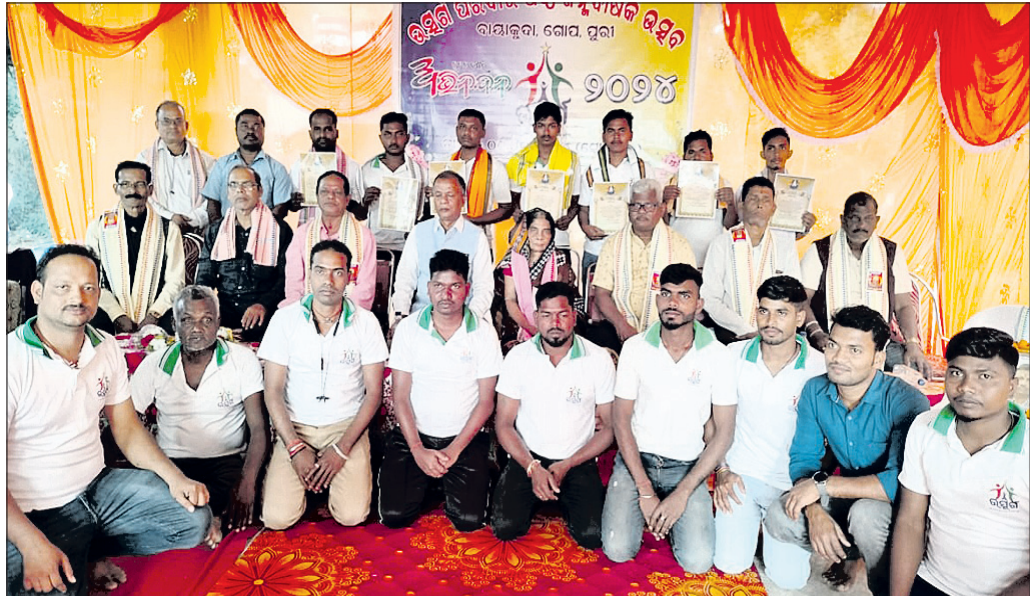
ଉତ୍ସର୍ଗ ପରିବାରର ୬ଷ୍ଠତମ ବାର୍ଷିକ ଉତ୍ସବ ପାଳନ ।