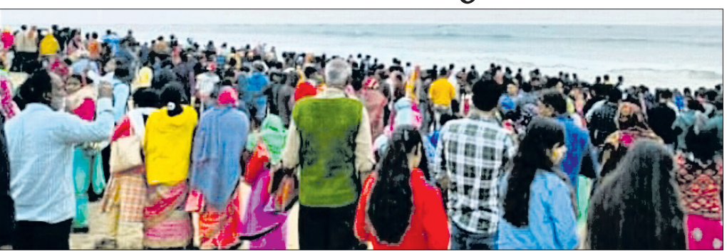
ଅସ୍ତରଙ୍ଗ, ୨୧ (ମମତା ଜେନା)

ପର୍ଯ୍ୟଟନ କ୍ଷେତ୍ରରେ ସ୍ୱତନ୍ତ୍ର ସ୍ଥାନ ଅଧିକାର କରିଥିବା ଅସ୍ତରଙ୍ଗ ବ୍ଲକର ପୀର ଜାହାନିଆଁ ବେଳାଭୂମି ନବବର୍ଷ ଉପଲକ୍ଷେ ଚଳଚଞ୍ଚଳ ଭେଟିପଡ଼ିଛି। ହଜାର ହଜାର ପର୍ଯ୍ୟଟକ ପୁରୁଣା ବର୍ଷକୁ ବିଦାୟ ଦେଇ ନୂତନ ବର୍ଷକୁ ଅଭିନନ୍ଦନ ଜଣାଇ ବିସ୍ମାସ୍ତ୍ର ଝାଉଁ ଜଙ୍ଗଲରେ ବଣଭୋଜି କରିବା ସହ ନାଚ ଗୀତରେ ମସରୁଲ ହେଉଥିବା ଦେଖିବାକୁ