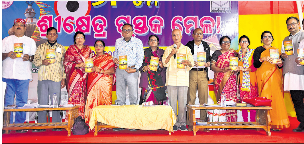
କାର୍ଯ୍ୟକ୍ରମରେ ମଞ୍ଚାସୀନ ଅତିଥି ।