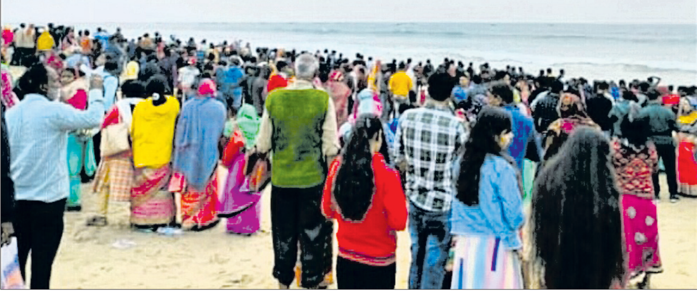
ନୂଆବର୍ଷ ଅବସରରେ ପୀର ଜାହାନିଆଁ ବେଳାଭୂମିରେ ଲୋକଙ୍କ ଭିଡ଼ ।