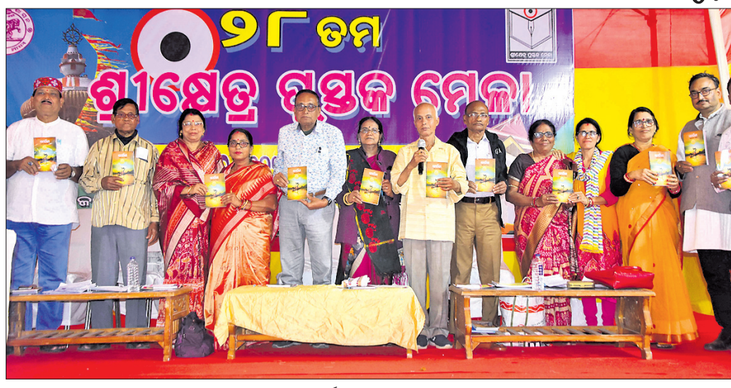
ସୁସ୍ୱକ୍ଷେପକାରୀ ଅତିଥିମାନେ କବିତା ସଂକଳନ ସୁସ୍ୱକ୍ଷେପ ‘ସମର୍ପିତା’ ଉନ୍ମୋଚନ କରୁଛନ୍ତି।