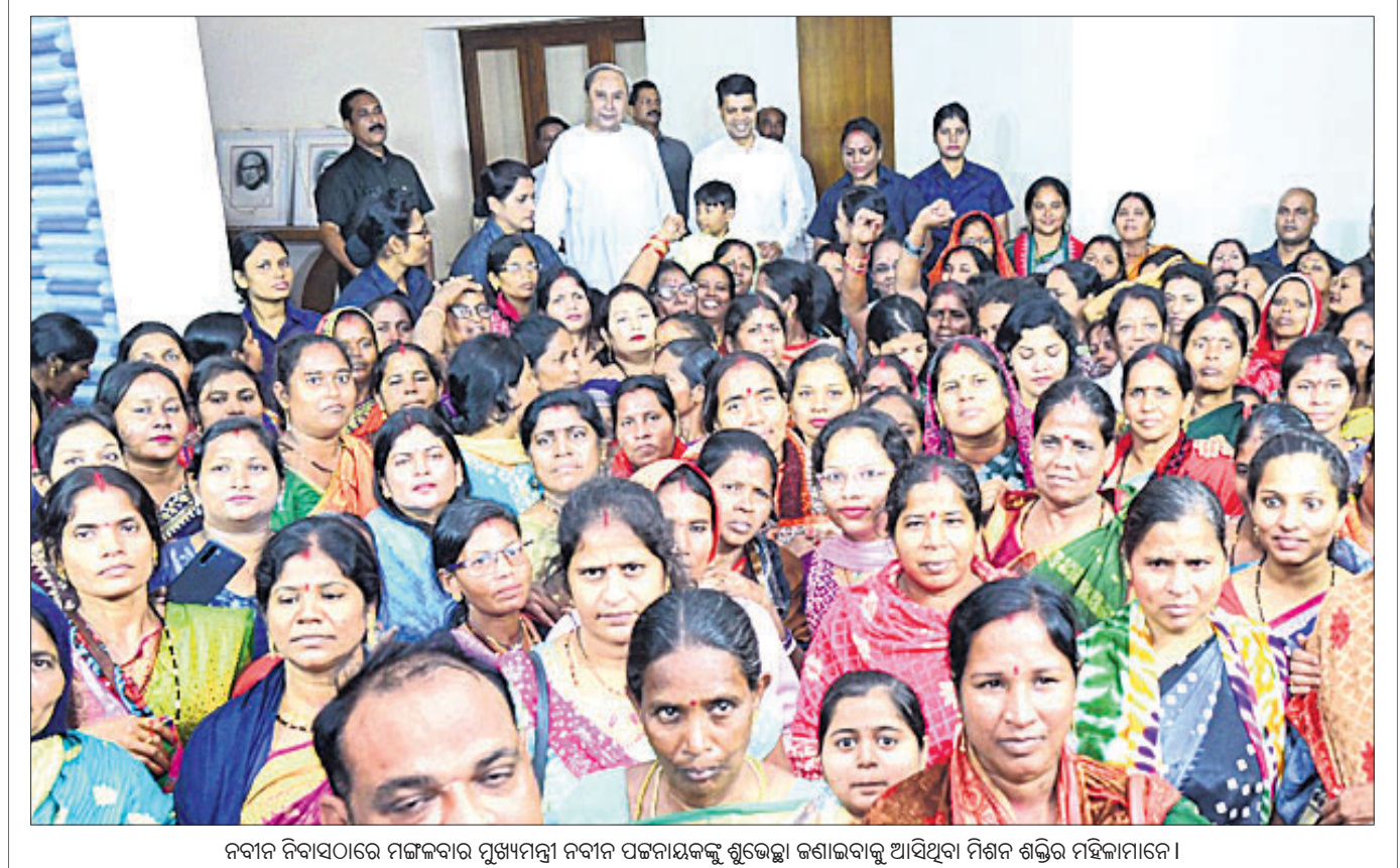
ନବୀନ ନିବାସଠାରେ ମଙ୍ଗଳବାର ମୁଖ୍ୟମନ୍ତ୍ରୀ ନବୀନ ପଟ୍ଟନାୟକଙ୍କୁ ଶୁଭେଚ୍ଛା ଜଣାଇବାକୁ ଆସିଥିବା ମିଶନ ଶକ୍ତିର ମହିଳାମାନେ।