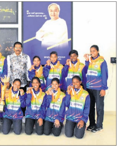
ଖୋ ଖୋ ମହିଳା ଦଳର ରୌପ୍ୟ ପଦକ ବିଜୟୀ ଖୋଖିଳିମାନ ।