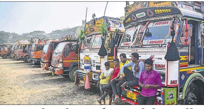
ମହାରାଷ୍ଟ୍ରର ନଳି ମୁଖାଇ ନିକଟସ୍ଥ ଏକ ଚର୍ମିନାଲରେ ଟ୍ରକ୍‌ଗୁଡ଼ିକ ଛିଡ଼ା ହୋଇ ରହିଛି।

ଦେଶରେଦରଦାମ୍‌ବୁଦ୍ଧିପାଉଛି। ଏଭଳିସ୍ଥିତିରେକୃଷକଆନ୍ଦୋଳନଭଳିପ୍ରକୃତ୍ୱଭରଣକ୍‌ଆନ୍ଦୋଳନବିରାଟରୂପେନେଇଛି। ଇଣ୍ଡିଆନ ପେନାଲ କୋଡ୍ (ଆଇପିସି) ବଦଳରେ କେନ୍ଦ୍ର ସରକାର ଗତ୩ବର୍ଷରେ ଆଣିଥିବା ନୂଆ ଆଇନ ଭାରତୀୟ ନ୍ୟାୟ ସଂହିତାରେ 'ହିଟ୍ ଆଣ୍ଡ ରନ୍' ଅପରାଧ ପାଇଁ କରାଯାଇଥିବା କଠୋର ଦଣ୍ଡବିଧାନ ପ୍ରତିବାଦରେ ମୁଣ୍ଡଟେକିଛି ଏହି ଆନ୍ଦୋଳନ। ଏଥିଯୋଗୁଁ ଯାନବାହନଚଳାଚଳ ବନ୍ଦହୋଇ ଯୋଗାଣ ଶୃଙ୍ଖଳ ବାଧାପ୍ରାପ୍ତହୋଇଛି। ୧୦ରୁଅଧିକ ରାଜ୍ୟରେ ଅତିଆବଶ୍ୟକ ସାମଗ୍ରୀଗୁଡ଼ିକର ଅଭାବ ଅନୁଭୂତ ହେଲାଣି। ଏହାର ପ୍ରଭାବରେ ସାମଗ୍ରୀ କିଣିବା ପାଇଁ ପ୍ରତିଯୋଗିତା ବହୁଥିବାରୁ ଲୋକେ ମୂଲ୍ୟବୃଦ୍ଧିର ଶିକାର ହେଉଛନ୍ତି। ତେବେ ସ୍ଥିତିର ଗମ୍ଭୀରତାକୁ ଦୃଷ୍ଟିରେ ରଖି ସରକାର ନୂଆ ଆଇନରେ ପରିବର୍ତ୍ତନ ଆଣିପାରନ୍ତି ବୋଲି ଜୁହାଯାଇଛି।