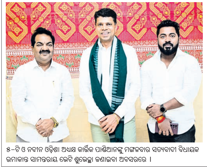
୫-ଟି ନବୀନ ଓଡ଼ିଶା ଅଧ୍ୟକ୍ଷ କାର୍ଯ୍ୟକ୍ରମ ପାଞ୍ଚିଆନଙ୍କୁ ମଙ୍ଗଳବାର ସତ୍ୟବାଦୀ ବିଧାନ ସଭା ସାମାଜିକ କର୍ମୀଙ୍କୁ ଭେଟି ଶୁଭେଚ୍ଛା ଜଣାଇବା ଅବସରରେ ।