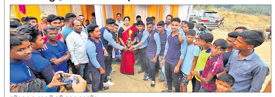
ଅତିଥିଙ୍କଠାରୁ ଖେଳାଳି ଟ୍ରଫି ଗ୍ରହଣ କରୁଛନ୍ତି ।