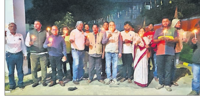
କଳା କଂଗ୍ରେସ କମିଟି ପକ୍ଷରୁ କ୍ୟାଣ୍ଡେଲ ଶୋଭାଯାତ୍ରା ।