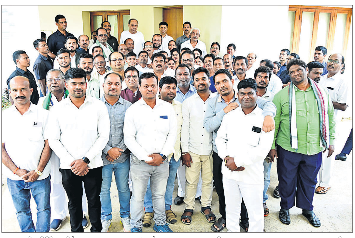
ଗଞ୍ଜାମ ଜିଲ୍ଲା ହିସ୍ତାଳିକାରୁ ନିର୍ବାଚନମଣ୍ଡଳର ଦକ୍ଷୀଣ ଚଳା ଓ କର୍ମାଗାମୀ ମଙ୍ଗଳାକାର ନବୀନ ନିବାସୀଙ୍କୁ ମୁଖ୍ୟମନ୍ତ୍ରୀ ନବୀନ ପଟ୍ଟନାୟକଙ୍କୁ ଭେଟୁଛନ୍ତି ।