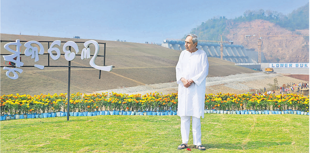
ଲୋୟର ସୁକ୍ତେଲ ପ୍ରକଳ୍ପ ଉଦ୍ଘାଟନା ଅବସରରେ ମୁଖ୍ୟମନ୍ତ୍ରୀ ନବୀନ ପଟ୍ଟନାୟକ ।