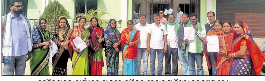
ତହସିଲଦାରଙ୍କ କାର୍ଯ୍ୟାଳୟ ଆଗରେ ଦାବିପତ୍ର ଦେବାକୁ ଆସିଥିବା ସରପଞ୍ଚମାନେ।

ଧାମନଗର, ୪୧୧ (ସଞ୍ଜେଖ କୁମାର ମହାପାତ୍ର) ଉତ୍ତର ଜିଲ୍ଲା ଧାମନଗର ବ୍ଲକ୍ ଅଧୀନ ସରକାରୀ ପୁରୀକୁଟି ପଞ୍ଚାୟତର ମେଳଣ ପଡ଼ିଆରେ ବିଧାୟକ କେନ୍ଦ୍ର ସରକାରଙ୍କ ବିଜ୍ଞାନ ଯୋଜନା ସମ୍ପର୍କରେ ଆଲୋଚନା କରିବା ପରେ ଏକ ଏଲଜିପି ମାଧ୍ୟମରେ ପ୍ରବର୍ତ୍ତନ ସମୟରେ ବିଧାୟକଙ୍କ ଉପସ୍ଥିତିରେ ରଥ ଗାଡ଼ିର କାଟ ଭାଙ୍ଗିବା ସହ ଲାଗିଥିବା ବ୍ୟାନରକୁ ମଧ୍ୟ ଦୁର୍ଲ୍ଲଭମାନେ ଚିରି ଦେଇଥିଲେ।