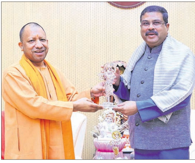
ଏହାଦ୍ୱାରା ସମଗ୍ର ଦେଶର ଆତ୍ମବିଶ୍ୱାସ ବୃଦ୍ଧି କରୁଛି । ପ୍ରଗତି ଆଜି ଉତ୍ତରପ୍ରଦେଶର ଚରିତ୍ର ହୋଇଛି । ସୁପିର ଛାତ୍ରାଛାତ୍ରୀ ଏବଂ ମୁକ୍ତ, ମୁକ୍ତକମଳା ବିଶ୍ୱମାନର ଶିକ୍ଷା ଉପଲବ୍ଧ କରାଯିବ ପ୍ରଧାନମନ୍ତ୍ରୀ ଓ ବିଶ୍ୱମାନର ଶିକ୍ଷା ଉତ୍ତର ପ୍ରଦେଶର ପ୍ରମୁଖ ଏଜେଣ୍ଡା ।

ବିଦ୍ୟାଳୟ ଶିକ୍ଷାରେ ନୂଆ କ୍ରାନ୍ତି ଆଣିବା ଦିଗରେ ପିଏମ୍ ଶ୍ରୀ ସ୍କୁଲ ଗୁରୁତ୍ୱପୂର୍ଣ୍ଣ ଭୂମିକା ଗ୍ରହଣ କରିବ ବୋଲି କେନ୍ଦ୍ରମନ୍ତ୍ରୀ ଧର୍ମେନ୍ଦ୍ର ପ୍ରଧାନ କହିଛନ୍ତି । ଗୁରୁବାର ଉତ୍ତର ପ୍ରଦେଶରେ ପିଏମ୍ ଶ୍ରୀ ସ୍କୁଲର ଶୁଭାରମ୍ଭ କରିବା ଅବସରରେ ଧର୍ମେନ୍ଦ୍ର କହିଛନ୍ତି, ଉତ୍ତର ପ୍ରଦେଶ ସରକାରଙ୍କ ଦ୍ୱାରା ଚୟନ ହୋଇଥିବା ୯୨୮ ବିଦ୍ୟାଳୟ ଏବଂ ୮୧ କେନ୍ଦ୍ରୀୟ ବିଦ୍ୟାଳୟ ଓ କବାହର ନବୋଦୟ ବିଦ୍ୟାଳୟକୁ ପିଏମ୍ ଶ୍ରୀ ସ୍କୁଲରେ ବିକଶିତ କରାଯାଇଛି । ବିଦ୍ୟାଳୟରେ ଉତ୍ତର ଓ ଅତ୍ୟାଧୁନିକ ଭିତ୍ତିଭୂମି ଏବଂ ବିଶ୍ୱମାନର ଶିକ୍ଷା ପ୍ରଦାନ କରିବା କେନ୍ଦ୍ର ସରକାରଙ୍କ ପ୍ରମୁଖ ଏଜେଣ୍ଡା । ଏହି ମର୍ମରେ ଉତ୍ତରପ୍ରଦେଶରେ ପିଏମ୍ ଶ୍ରୀ ଅନ୍ତର୍ଗତ ୧୦୦୦ରୁ ଅଧିକ ବିଦ୍ୟାଳୟର ଉନ୍ନତି ଏବଂ ଆଧୁନିକୀକରଣ କରାଯାଇଛି । ପିଏମ୍ ଶ୍ରୀ ସ୍କୁଲ କ୍ରିୟାନ୍ୱୟନ କରିବାରେ ସୁପିର ଅଗ୍ରଣୀ ଭୂମିକା ପ୍ରଶଂସନୀୟ । ନୂଆ ରାଷ୍ଟ୍ରୀୟ ଡାକ୍ତରଖାନାରେ ଭର୍ତ୍ତି କରିଥିଲେ । ସେଠାରୁ ୫ ଜଣ ଗୁରୁତରକୁ ମଣ୍ଡାପାଳ ଡାକ୍ତରଖାନା ପଠାଯାଇଥିଲା ।