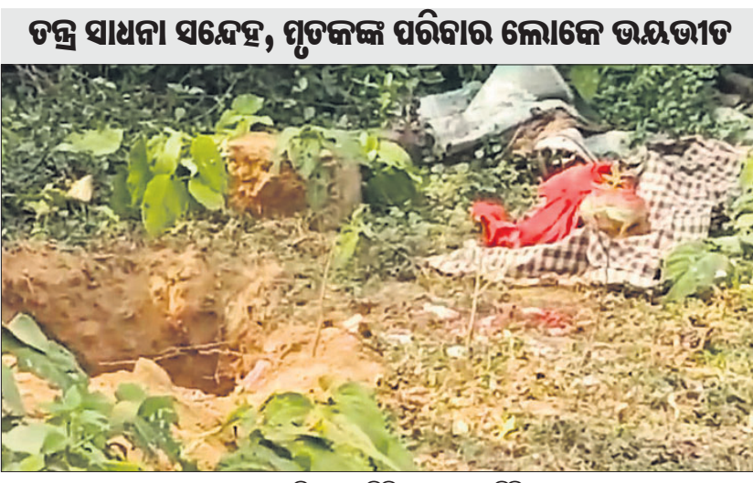
ତନ୍ତ୍ର ସାଧନା ସମୟେ, ମୃତକଙ୍କ ପରିବାର ଲୋକେ ଭୟଭୀତ ହୋଇଥିବା ବେଳେ ଖପୁରି କାଢ଼ି ପୂଜାର୍ଚ୍ଚନା କରାଯାଇଛି।

କାମାକ୍ଷାନଗର, ୪୧୧ (ପୁରୀ ଜିଲ୍ଲା) ୬ ମାସ ତଳେ ପୋଡ଼ା ଯାଇଥିବା କଣେ ବୃକ୍ଷାଳ ମୃତଦେହକୁ ଖପୁରି କାଢ଼ି ପୂଜାର୍ଚ୍ଚନା କରାଯାଇଛି।