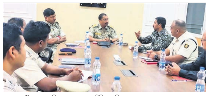
ସମାକ୍ଷା ବୈଠକରେ ଛତିଶଗଡ଼, ମାଲକାନଗିରି ପୋଲିସ ଅଧିକାରୀମାନେ ।

ମାଲକାନଗିରି, ୪୧ (ବୁଧବିଧି ପାଠ) କିଛିଦିନ ପୂର୍ବେ ଛତିଶଗଡ଼ରେ ନିର୍ବାଚନ ଭଙ୍ଗ କରିବା ପାଇଁ ମାଓବାଦୀମାନେ ବହୁ ହିଂସାକାଣ୍ଡ