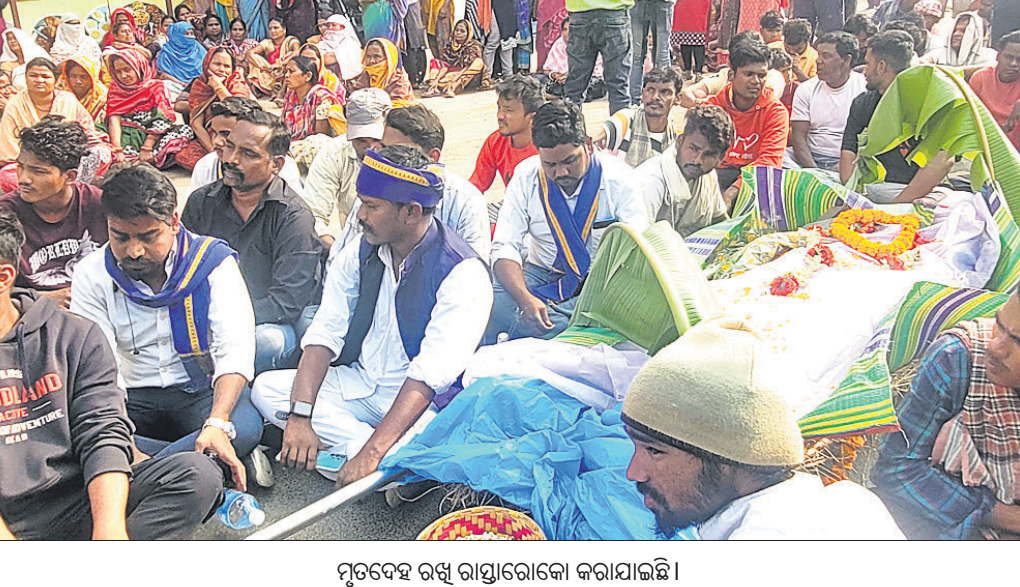
ମୃତବେହ ରଖି ରାସ୍ତାରୋକୋ କରାଯାଇଛି ।