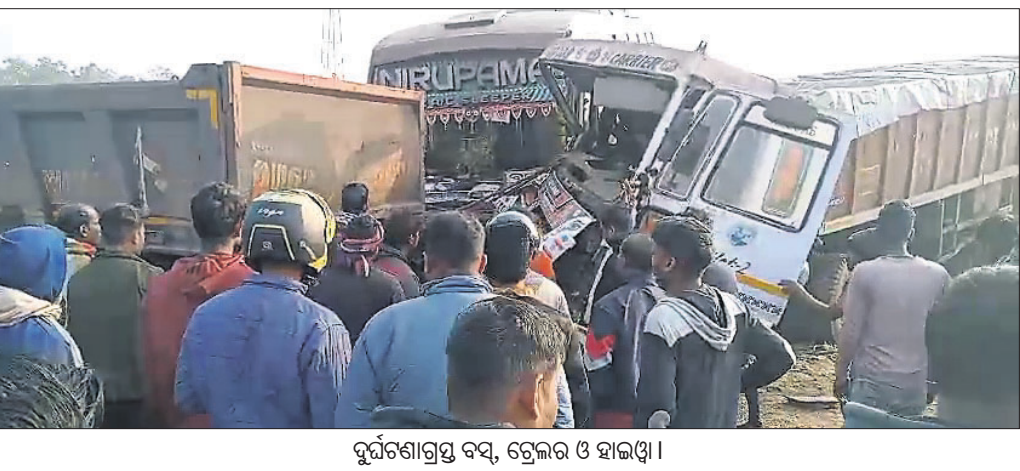
ଦୁର୍ଘଟଣାଗ୍ରସ୍ତ ବସ୍, ଟ୍ରେଲର ଓ ହାଇଡ୍ରା ।

କାମାକ୍ଷାନଗର, ୪।୧ (ଅମଳାଦେବୀ) ୧୪୯ ନଂ. ଜାତୀୟ ରାଜପଥର ଡେକାନାଲ ଜିଲ୍ଲା ମହାବିରୋଡ଼ ଥାନା ଭେଜିଆ ଛକ ନିକଟରେ ଗୁରୁବାର ସକାଳେ ଘଟିଛି ସିଡିଏମ୍ ଦୁର୍ଘଟଣା । ଯାକପୁର ଜିଲ୍ଲା ବଡ଼ଚଣା ଅଞ୍ଚଳରୁ ଲୋକଙ୍କୁ ନେଇ ପିକ୍‌ନିକ୍‌ରେ ସମ୍ମାନ ପୁର ଯାଇଥିବା ଏକ ବସ୍ ସେଠାରୁ ବଡ଼ଚଣା ଫେରୁଥିବା ବେଳେ ପ୍ରଥମ ଏକ ଟ୍ରେଲର ଓ ପରେ ହାଇଡ୍ରାକୁ ଧକ୍କା ଦେଇଥିଲା । ଫଳରେ ୩୫ ଜଣ ଆହତ ହୋଇଥିବା ସମ୍ଭବତଃ ସେମାନଙ୍କ ମଧ୍ୟରୁ ୪ ଜଣଙ୍କ ସହ ନାମିତ କରି ତାଙ୍କୁ ରାଜ୍ୟ ଯୋଜନା ବୋର୍ଡର ସଦସ୍ୟ କରିଥିଲେ ।