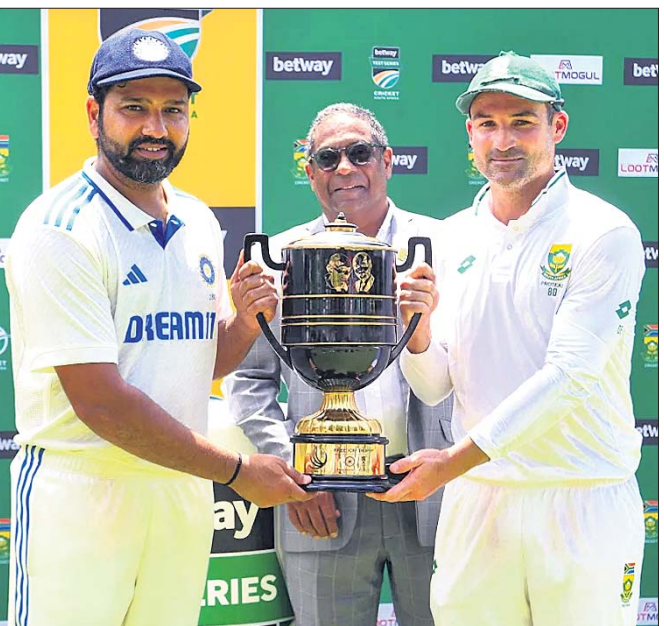
ଚୁଫି ସହ ଉଭୟ ଦଳର ଅଧିନାୟକ।

କେପୁଟାଉର, ୪।୧ (ପି.ଟି) ଦକ୍ଷିଣ ଆଫ୍ରିକା ବିପକ୍ଷ ଦ୍ୱିତୀୟ ଚେଷ୍ଟିକୁ ୭ ଉଇକେଟରେ ଜିତିବା ସହିତ ଭାରତ ଦୁଇ ମ୍ୟାଚ ବିଶିଷ୍ଟ ସିରିଜକୁ ୧-୧ରେ ଡ୍ର ରଖିଛି। ବଲ୍ ବ୍ୟବଧାନରେ ଏହା ଚେଷ୍ଟି କ୍ରିକେଟର ସବୁଠୁ ଛୋଟ ମ୍ୟାଚ୍। ଏହା ମାତ୍ର ସାତେ ୪ ସେସନରେ ଶେଷ ହୋଇଛି। ୧୯୩୨ରେ ଅଷ୍ଟ୍ରେଲିଆ-ଦକ୍ଷିଣ ଆଫ୍ରିକା ମ୍ୟାଚ୍ରେ ୧୦୯.୨ ଓଭର (୬୫୬ ବଲ୍) ବୋଲି ହୋଇଥିବା ବେଳେ ଏହି ମ୍ୟାଚ୍ରେ ୧୦୭ ଓଭର (୬୪୨ ବଲ୍) ବୋଲି ସମ୍ପର୍କ ହୋଇଛି। ଏହା ସହିତ ପ୍ରଥମ ଏସୀୟ ରାଷ୍ଟ୍ର ଭାବେ ଭାରତ କେପୁଟାଉରରେ ସିଡିଆସିକ ବିକ୍ରୟ ହାସଲ କରିଛି। ରେକର୍ଡ଼ ଦୃଷ୍ଟିରୁ ଚେଷ୍ଟି କ୍ରିକେଟରେ ୨୫ ଥର ୨ ଦିନରୁ କମ୍ ସମୟ ମଧ୍ୟରେ ଚେଷ୍ଟି ମ୍ୟାଚ୍ ଶେଷ ହୋଇଛି। ଭାରତର ଏହା ତୃତୀୟ ମ୍ୟାଚ୍, ଯାହା ୨ ଦିନ ମଧ୍ୟରେ ଶେଷ ହୋଇଛି। ପୂର୍ବରୁ ୨୦୧୮ରେ