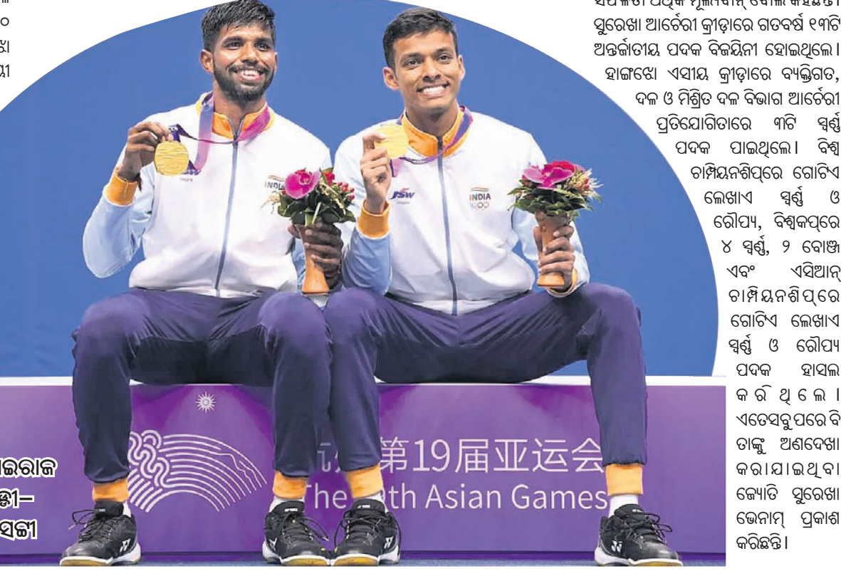
ସାହିତ୍ୟସାଲରାଜ୍ ରାଜିରେଣୀ-ଚିରାଗ ସେନା