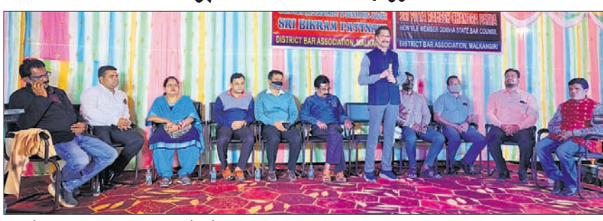
ସମ୍ବର୍ଦ୍ଧନା ସଭାରେ ଓକିଲ ସଂଘ କର୍ମକର୍ମୀ ଓ ଅନ୍ୟମାନେ ।