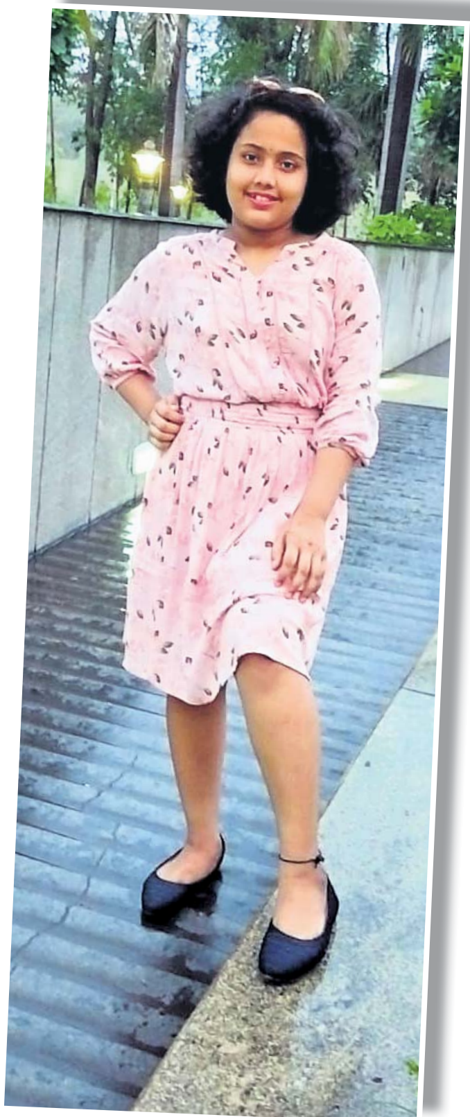
ବୈଷ୍ଣବୀ ପାତ୍ର ୧୨ ବର୍ଷ / ଭୁବନେଶ୍ୱର