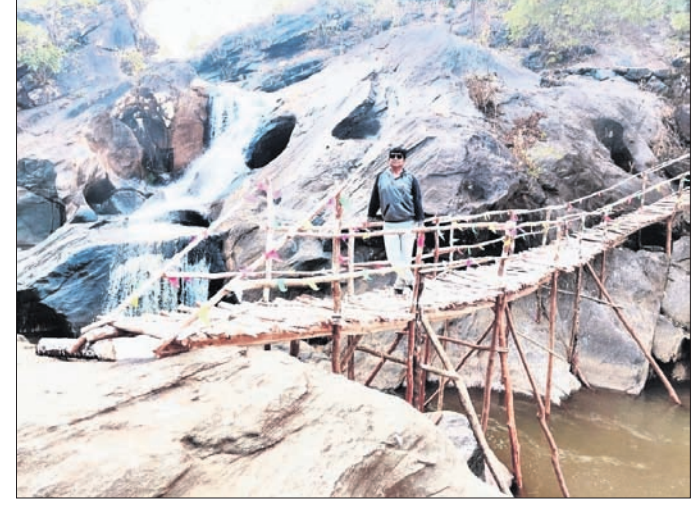
ଗାରିଆ ଭୁଢୁମା ଜଳପ୍ରପାତ।