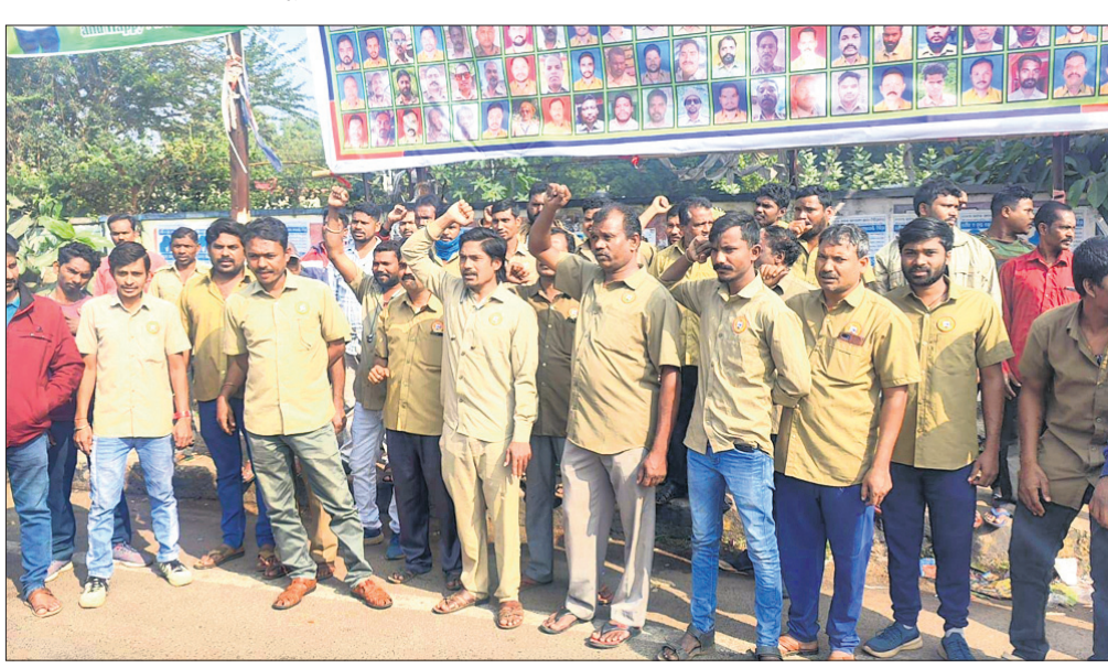
ରାଜଗଡ଼ାରେ ଆନ୍ଦୋଳନରେ ସାମିଲ ହୋଇଥିବା ଡ୍ରାଇଭରମାନେ।