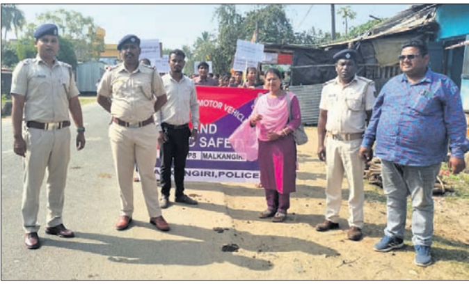
କୋରୁକୋଣ୍ଡାରେ ବାହାରିଥିବା ସଚେତନତା ଶୋଭାଯାତ୍ରା।

ମାଲକାନଗିରି ଜିଲ୍ଲା କୋରୁକୋଣ୍ଡା ଅଞ୍ଚଳରେ ପୋଲିସ୍ ପକ୍ଷରୁ ସଡ଼କ ସୁରକ୍ଷା ସଚେତନତା ଶୋଭାଯାତ୍ରା ଶୁକ୍ରବାର ଅନୁଷ୍ଠିତ ହୋଇଯାଇଛି। ଏନେଇ ପରିବହନ ବିଭାଗ ଓ ପୋଲିସ୍ ପ୍ରଶାସନ ସଡ଼କ ସୁରକ୍ଷା ଆଇନକୁ କଡ଼ାକଡ଼ି ଭାବେ ପାଳନ କରିବା ସହ ଅଞ୍ଚଳରେ ଶୋଭାଯାତ୍ରା କରି ଜନସାଧାରଣଙ୍କୁ ସଚେତନ କରିଛି। ଏହି ଅବସରରେ ଗାଡ଼ି ମୋଟର ଯାଞ୍ଚ, ଆଇନ ଉଲ୍ଲଙ୍ଘନକାରୀଙ୍କ ବିରୋଧରେ କାର୍ଯ୍ୟାନୁଷ୍ଠାନ ଗ୍ରହଣ କରାଯାଇଛି। ତେବେ ସଡ଼କ ସୁରକ୍ଷା ଆଇନକୁ ଅମାନ୍ୟକରି କେତେଜଣ ଗାଡ଼ିଚାଳକ ଗାଡ଼ିମୋଟର ଚଳାଉଥିବାରୁ ଉକ୍ତ ଅଞ୍ଚଳରେ ଦିନକୁ ଦିନ ହୁଏତ ଯାତ୍ରା ପାଇବା ବଦଳରେ ବୁଦ୍ଧି ପାଇବାରେ