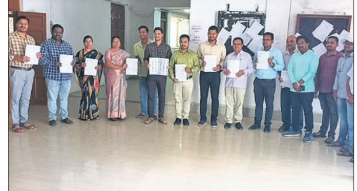
ବିଷମକଟକ ବିଧାନସଭା ନିର୍ବାଚନମଣ୍ଡଳର ତୃତୀୟ ଭୋଟର ତାଲିକା ପ୍ରକାଶ କରାଯାଇଛି ।