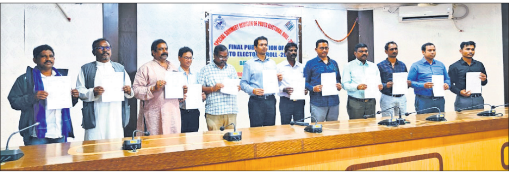
ଅଧିକାରୀମାନେ ଭୋଟର ତାଲିକା ଉନ୍ମୋଚନ କରୁଛନ୍ତି ।