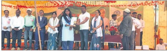
ଅତିଥି ଜଣେ କୃତା ପ୍ରତିଯୋଗୀଙ୍କୁ ପୁରସ୍କୃତ କରୁଛନ୍ତି।

କାର୍ଯ୍ୟକ୍ରମ ଆଦି କରାଯାଇଥିଲା । ଏଥିରେ ମହିଳା ଓ ପୁରୁଷ ବର୍ଗର ଭଲିବଲ, ପୁଟବଲ, କବାଡି, ବ୍ୟାଡମିଣ୍ଟନ, ବୈଡି ପ୍ରତିଯୋଗିତା ହୋଇଥିଲା । ଏହି କାର୍ଯ୍ୟକ୍ରମକୁ ରାଇଘର ଯଦିନ ଧରି ଚାଲିଥିବା ଯୁବ ଓଡ଼ିଶା ନବୀନ ଓଡ଼ିଶା କାର୍ଯ୍ୟକ୍ରମ ଉଦ୍ଘାଟିତ ହୋଇଯାଇଛି । ଯଦିନ ବ୍ୟାପି କଲେଜ ଛାତ୍ରଛାତ୍ରୀଙ୍କ ମଧ୍ୟରେ ଖେଳକୁସଳ, ସାଂସ୍କୃତିକ ଓ ସାମାଜିକ