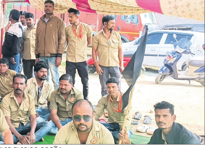
ଉପରକୋଟରେ ଡ୍ରାଇଭର ମହାସଂଘ ସଦସ୍ୟମାନେ ଆନ୍ଦୋଳନ କରୁଛନ୍ତି।

କେହି ଡ୍ରାଇଭର ବେପରୁଆ ଗାଡ଼ି ଚଳାଇ ଚାହାନ୍ତି ତେବେ ଏବଂ ଚାହାନ୍ତି ପରେ ପୋଲିସ୍ କିମ୍ବା ଅନ୍ୟ କାହାରିକୁ ସୂଚନା ନ ଦେଇ ଆହତକୁ ଚାହାନ୍ତି ଗୁଳିରେ ଛାଡ଼ି ପଳାଇଲେ ସମସ୍ତ ଡ୍ରାଇଭରଙ୍କୁ ୧୦ ବର୍ଷ ଜେଲ ସହ ସାତ ଲକ୍ଷ ଟଙ୍କା ଜମାଦାନ କାରାଦଣ୍ଡ ଦିଆଯାଇପାରେ । ଓଡ଼ିଶା ଡ୍ରାଇଭର ମହାସଂଘ ନବରଙ୍ଗପୁର ଜିଲ୍ଲା ଉପରକୋଟ ଶାଖା ସଦସ୍ୟମାନେ ଏହା ବିରୋଧରେ ଅନିର୍ଦ୍ଧିଷ୍ଟ କାଳ ଷ୍ଟିୟରିଂ ଛାଡ଼ି କରି ଆନ୍ଦୋଳନରେ ବସିଛନ୍ତି । ରାଜ୍ୟ