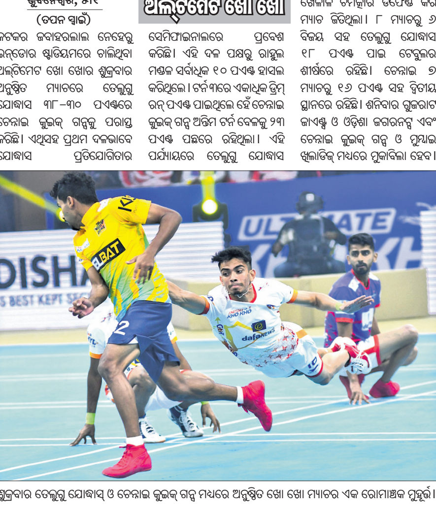
ଶୁକ୍ରବାର ଚେଲ୍ସି ଯୋଦ୍ଧା ଓ ଚେଲ୍ସି କୁଲ୍‌କ୍ ଗର୍ଭୁ ମଧ୍ୟରେ ଅନୁଷ୍ଠିତ ଖୋ ଖୋ ମ୍ୟାଚର ଏକ ରୋମାଞ୍ଚକ ମୁହୂର୍ତ୍ତ।

ଖେଳାଳି ଚମତ୍କାର ତିପେକ୍ଷ କରି ମ୍ୟାଚ ଜିତିଥିଲା। ୮ ମ୍ୟାଚକୁ ୬ ବିଜୟ ସହ ଚେଲ୍ସି ଯୋଦ୍ଧା ୧୮ ପଏଣ୍ଟ୍ ପାଇ ଚେଲ୍ସି ଶୀର୍ଷରେ ରହିଛି। ଚେଲ୍ସି ୬ ମ୍ୟାଚକୁ ୧୬ ପଏଣ୍ଟ୍ ସହ ବିଜୟ ଗ୍ଲାନରେ ରହିଛି। ଶନିବାର ଗୁଜରାଟ୍ ଜାଏଣ୍ଟ୍ ଓ ଓଡ଼ିଶା ଜଗରନସ୍ ଏବଂ ଚେଲ୍ସି କୁଲ୍‌କ୍ ଗର୍ଭୁ ଓ ମୁସ୍ତା ଖୁଲ୍‌କ୍ ମଧ୍ୟରେ ମୁକାବିଲା ହେବ।