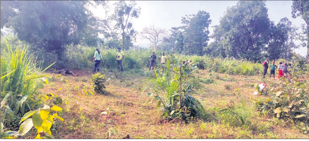
ପୋଲିସ୍ ତଦନ୍ତ କାରି ରହିଛି।

ଅଦିବାସୀ ପରମ୍ପରାରେ ଏବେ ମଧ୍ୟ ରହିଛି ଅନ୍ଧବିଶ୍ୱାସ। ବିଜ୍ଞାନଯୁଗରେ ମଧ୍ୟ ସେମାନଙ୍କ ଗୁଣିଆ ଉପରେ ରହିଛି ବିଶ୍ୱାସ। ରୋଗ ହେଲେ ସେମାନେ ଡାକ୍ତରଖାନା ନ ଯାଇ ଗୁଣିଗାରେଡ଼ିକୁ ପସନ୍ଦ କରୁଛନ୍ତି। ଯଦିଓ ଗୁଣିଆ ରୋଗୀର ଚିକିତ୍ସା କରୁନାହାନ୍ତି ତେଣୁ ରୋଗୀର ମୃତ୍ୟୁ ହେଲେ ସେ ନିଜ ଦୋଷ ଲୁଚାଇ ଚପୁରତାର ସହ ଖସିଯାଏ। ଏପରି ଦେଖିବାକୁ ମିଳେ ମାଲକାନଗିରି ଜିଲ୍ଲା କାଲିମେଳା ବ୍ଲକ ମୋରୁ ଥାନା ଅନ୍ତର୍ଗତ ନାମ୍ୟବକୋଣ୍ଡା ପଞ୍ଚାୟତ ଚାନ୍ଦିକୋଣ୍ଡା ଗ୍ରାମରେ । ଏମିତି-୧୨୬ ଜଙ୍ଗଲରେ ଗତ ନୂଆବର୍ଷ ଦିନ ଏକ ହତ୍ୟାକାଣ୍ଡ ଘଟିଛି। ଘଟଣାର ତିନିଦିନ ପରେ ଗୁରୁବାର ଏକ ମୃତଦେହ ଉଦ୍ଧାର ହୋଇଛି। ମୃତଦେହ ଜବତ ହୋଇଛି। ନୂଆବର୍ଷ ଦିନ ବଣଭୋଜି କରିବାକୁ ଜଙ୍ଗଲକୁ ଯାଇ ଯାଉଥିବା ବେଳେ ନାବାଳକଙ୍କ ମୃତଦେହ ମୃତଦେହ