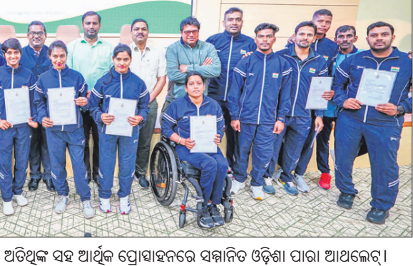
କ୍ରୀଡ଼ାମନ୍ତ୍ରାଳୟ କ୍ରୀଡ଼ାମନ୍ତ୍ରାଳୟରେ ଓ ଅନ୍ୟ ଅତିଥିକ ସହ ଆର୍ଥିକ ପ୍ରୋସ୍ତାହନରେ ସମ୍ମାନିତ ଓଡ଼ିଶା ପାରା ଆଥଲେଟ୍।

କିର୍ ମହିଳା ଭଲିବଲ୍ ଦଳକୁ ସର୍ବଭାରତୀୟ ଯୋଗ୍ୟତା ଭୁବନେଶ୍ୱର, ୫୧ (ତପନ ସାହୁ): କିର୍ ବିଶ୍ୱବିଦ୍ୟାଳୟ ଆନୁକୂଲ୍ୟରେ ଏଠାରେ ଚାଲିଥିବା ପୂର୍ବାଞ୍ଚଳ ଆକ୍ସ ବିଶ୍ୱବିଦ୍ୟାଳୟ ମହିଳା ଭଲିବଲ୍ ଚାମ୍ପିୟନଶିପ୍ରେ ପ୍ରଭାବା ପ୍ରଦର୍ଶନ କରି କିର୍ ବିଶ୍ୱବିଦ୍ୟାଳୟ ଦଳ ସର୍ବଭାରତୀୟ ଯୋଗ୍ୟତା ହାସଲ କରିଛି। କିର୍ ସମେତ ଆତାମାସ ବିଶ୍ୱବିଦ୍ୟାଳୟ, ବର୍ଦ୍ଧମାନ ବିଶ୍ୱବିଦ୍ୟାଳୟ ଓ ପଣ୍ଡିତ ରବି ଶଙ୍କର ଶୁକ୍ଳା ବିଶ୍ୱବିଦ୍ୟାଳୟ ନିଜ ନିଜର କ୍ୱାର୍ଟର ଫାଇନାଲ ମ୍ୟାଚରେ ବିଜୟ ହାସଲ କରିଛନ୍ତି। ଚପ୍-୪ ଦଳଭାବେ ଏଗୁଡ଼ିକ ସର୍ବଭାରତୀୟ ଆକ୍ସ ବିଶ୍ୱବିଦ୍ୟାଳୟ ଆକ୍ସ କୋର୍ସ ମହିଳା ଭଲିବଲ୍ ଚାମ୍ପିୟନଶିପ୍ ପାଇଁ ଯୋଗ୍ୟତା ଅର୍ଜନ କରିଛନ୍ତି। ଏହି ପ୍ରତିଯୋଗିତା କିର୍ ଆନୁକୂଲ୍ୟରେ ଚଳିତ ମାସ ୧୬ ଓ ୧୭ ମାର୍ଚ୍ଚ ଅନୁଷ୍ଠିତ ହେବ।