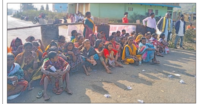
ଚିକିତ୍ସା କ୍ଷେତ୍ରରେ ଆଦିବାସୀ ମହିଳାମାନେ ରାସ୍ତା ଅବରୋଧ କରିଛନ୍ତି।

ଚିକିତ୍ସା/ଚନ୍ଦ୍ରପୁର,(ପ୍ରଫୁଲ୍ଲ କୁମାର ବେହେରା/ ବିଜୟ ପ୍ରସାଦ ଉଲ୍ଲାକା)