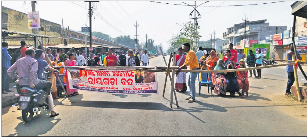
ରାଜଗଡ଼ା ଏସ୍ପିଆଇ ଛକ ନିକଟରେ ବାଉଁଶ ବାଣି ରାସ୍ତା ବନ୍ଦ କରାଯାଇଛି।