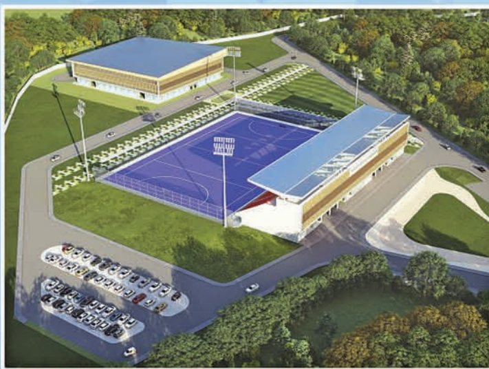
ସ୍ପୋର୍ଟ୍ସ କମ୍ପ୍ଲେକ୍ସ ସମ୍ବଲପୁର ୟୁନିଭରସିଟି