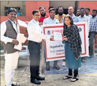
ଅଲ୍ଲୀ ରକ୍ତ ସଂଗ୍ରହ କରିଥିଲେ । ସମସ୍ତ ରକ୍ତଦାନୀଙ୍କୁ ମାନପତ୍ର ଦିଆଯାଇଛି ।