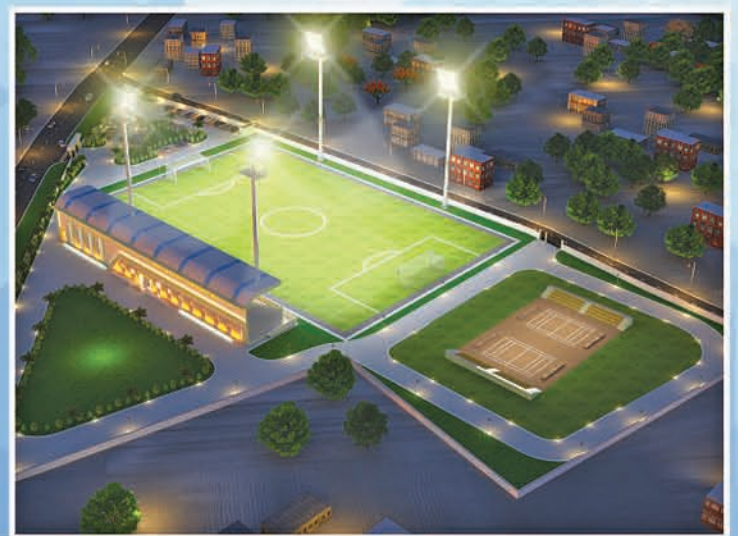
ଫୁଟବଲ ଡାଲିମ କେନ୍ଦ୍ର ସମ୍ବଲପୁର

“କ୍ରୀଡ଼ା ଦୃଶ୍ୟପଙ୍କର ରୂପାନ୍ତରଣ, କ୍ରୀଡ଼ାଚିତଙ୍କ ସଶକ୍ତିକରଣ”