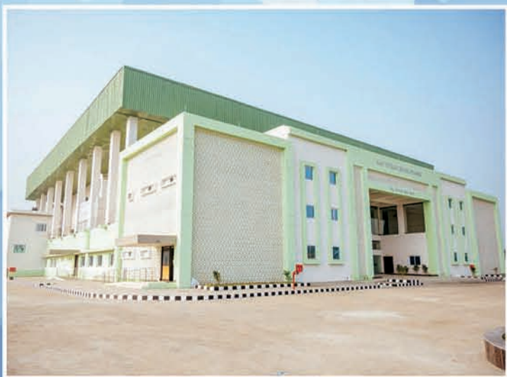
ବୁର୍ଲା ଇନଡୋର ଷ୍ଟାଡ଼ିୟମ

“ କ୍ରୀଡ଼ା ପାଇଁ ଯୁବଗୋଷ୍ଠୀ ଭବିଷ୍ୟତ ପାଇଁ ବଡ଼ ଶକ୍ତି ”