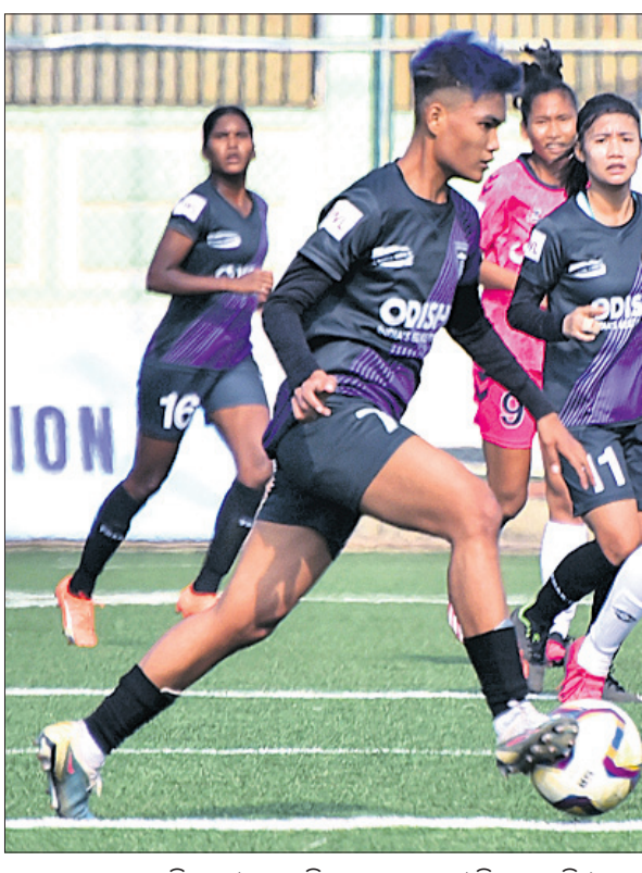
ଇଣ୍ଡିଆନ ଓମେନ୍ସ ଲିଗ୍ରେ ଶୁକ୍ରବାର ଓଡ଼ିଶା ଏସ୍‌ସି ଓ ସେଥି ଏସ୍‌ସି ମଧ୍ୟରେ ଅନୁଷ୍ଠିତ ମ୍ୟାଚ।

୧ରେ ୟୁଏସ୍ଏ-କାନାଡା ମ୍ୟାଚ ସହ ଟୁର୍ନାମେଣ୍ଟ ଆରମ୍ଭ ହେବ। ସେମିଫାଇନାଲ ଟୁର୍ ୨୬ରେ ଗୁୟାମା ଓ ଜୁନ୍ ୨୭ରେ ଟ୍ରିନିଦାଦଠାରେ ଖେଳାଯିବାକୁ ଥିବା ବେଳେ ବାର୍ବାଡୋସରେ ଜୁନ୍ ୨୯ରେ ଫାଇନାଲ ମ୍ୟାଚ ଖେଳାଯିବାର କାର୍ଯ୍ୟକ୍ରମ ରହିଛି। ଇଂଲଣ୍ଡ ହେଉଛି ଟୁର୍ନାମେଣ୍ଟର ଗତଥର ବିଜେତା। ୨୦୨୨ ନଭେମ୍ବରରେ ମେଲବୋର୍ନଠାରେ ପାକିସ୍ତାନକୁ ପରାସ୍ତ କରି ଦଳ ଗାଳଚଳ ବିଜୟୀ ହୋଇଥିଲା। ଗୁପ୍ ପର୍ଯ୍ୟାୟ ମ୍ୟାଚଗୁଡ଼ିକ ଜୁନ୍ ୧୬ ଓ ୧୮ ପର୍ଯ୍ୟନ୍ତ ଖେଳାଯିବାକୁଥିବା ବେଳେ ସୁପର-୮ ଗେମ୍ ଗୁଡ଼ିକ ଜୁନ୍ ୧୯ରୁ ୨୪ ପର୍ଯ୍ୟନ୍ତ ଖେଳାଯିବ। ପ୍ରତି ଗ୍ରୁପ୍ରେ ଶ୍ରେଷ୍ଠ ଦୁଇ ଦଳ ସୁପର-୮ରେ ପ୍ରବେଶ କରିବେ।