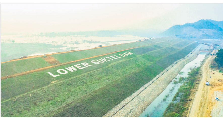
ବଲାଙ୍ଗୀର ଜିଲ୍ଲା ମାଗୁରବେତାସ୍ଥିତ ଲୋୟର ସୁକ୍ତେଲ୍ କୁହନ୍ କଳସେଚନ ପ୍ରକଳ୍ପ।

ପ୍ରାୟ ୨୩ ବର୍ଷ ପୂର୍ବରୁ ଶିଳାନ୍ୟାସ ହୋଇଥିବା ବଲାଙ୍ଗୀର ଜିଲ୍ଲାର ବହୁପ୍ରତୀକ୍ଷିତ ଲୋୟର ସୁକ୍ତେଲ୍ କୁହନ୍ କଳସେଚନ ପ୍ରକଳ୍ପ ଛୁପିବାର ଉଦ୍ଦ୍ୟୋଗିତ ହୋଇଯାଇଛି। ଦୀର୍ଘବର୍ଷ ଭିତରେ ପ୍ରାୟତଃ ସବୁଦିନେ ସରକାରୀ ପ୍ରଭୁ କୁହାଯାଉଥିଲା ଯେ, ଲୋୟର ସୁକ୍ତେଲ୍ ତ୍ୟାମ୍ଭର ଉଚ୍ଚତା ୩୦ ମିଟର ହେବ। ମାତ୍ର ଛୁପିବାର ପ୍ରକଳ୍ପ ଉଦ୍ଦ୍ୟୋଗିତ ବେଳେ କୁହାଯାଇଛି ଯେ, ତ୍ୟାମ୍ଭ ଉଚ୍ଚତା ୩୧ ମିଟର। ୩୦ ମିଟର ତ୍ୟାମ୍ଭ ଉଚ୍ଚତାରେ ଜିଲ୍ଲାର ପ୍ରଭାବିତ ୨୯ଟି ଗାଁରୁ ୧୫ଟି ସମ୍ପୂର୍ଣ୍ଣ, ୧୪ଟି ଆଂଶିକ ଭାବେ ବୁଡ଼ିବ ଏବଂ ଏଥିଯୋଗୁ ୫୮୩ ହେକ୍ଟର ଜଙ୍ଗଲ ଜମି, ୩୯୩୭.୮ ହେକ୍ଟର ଭୟତି ଏବଂ ୭୮୬ ଏକର ସରକାରୀ ଜମି ପ୍ରଭାବିତ ହେବ ବୋଲି କୁହାଯାଉଥିଲା। ଏବେ ତ୍ୟାମ୍ଭ ଉଚ୍ଚତା ୩୧ ମିଟର କୁହାଯାଉଥିବାରୁ ଏହାର ପ୍ରଭାବ କ'ଣ ରହିବ।