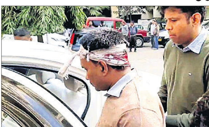
ଆହତ ଇଡି ଅଫିସରଙ୍କୁ ହସ୍ତିତାଳ ନିଆଯାଇଛି।

ରାଶନ ବଣ୍ଟନ ଦୁର୍ଗତିର ତଦନ୍ତ କରିବାକୁ ପଶ୍ଚିମବଙ୍ଗର ଉତ୍ତର ୨୪ ପ୍ରଗଣା ଜିଲ୍ଲାକୁ ଯାଇଥିବା ପ୍ରବର୍ତ୍ତନ ନିର୍ଦ୍ଦେଶାଳୟ (ଇଡି)ର ଅଫିସରଙ୍କ ଉପରେ ଆକ୍ରମଣ ହୋଇଛି। ଏହାକୁ ନେଇ ରାଜନୈତିକ କାବୁଅଫିଜା ଆରମ୍ଭ ହୋଇଯାଇଛି। ପଶ୍ଚିମବଙ୍ଗରେ ରାଷ୍ଟ୍ରପତି ଶାସନ ଲାଗୁ କରିବା ପାଇଁ ଭାଜପା ଏବଂ କଂଗ୍ରେସ ଦାବି କରିଥିବାବେଳେ କେନ୍ଦ୍ରୀୟ ଏକ୍ସିକ୍ୟୁଟିଭ ଅଧିକାରୀମାନେ ସ୍ଥାନୀୟ ଲୋକଙ୍କୁ ଉତ୍ସାହପୂର୍ଣ୍ଣ ଶାସକ ଟିଏମସି କହିଛନ୍ତି।