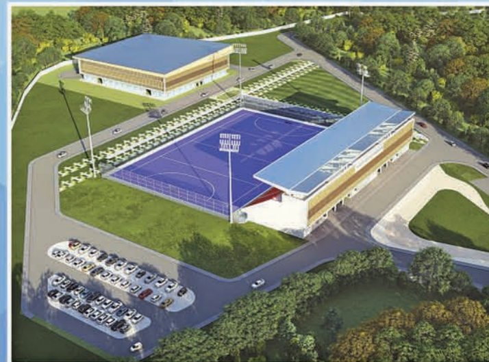
ସ୍ପୋର୍ଟ୍ସ କମ୍ପ୍ଲେକ୍ସ ସମ୍ବଲପୁର ୟୁନିଭରସିଟି