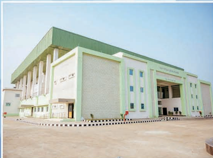
ବୁର୍ଲା ଇନଡୋର୍ ଷ୍ଟାଡ଼ିୟମ

“ କ୍ରୀଡ଼ା ପାଇଁ ଯୁବଗୋଷ୍ଠୀ ଭବିଷ୍ୟତ ପାଇଁ ବଡ଼ ଶକ୍ତି ”