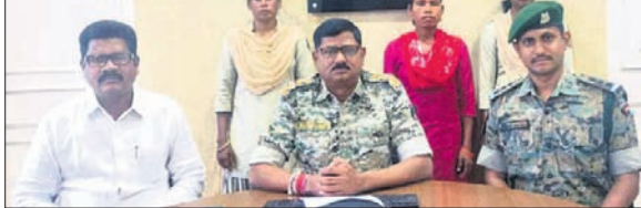
ଆକ୍ରମଣ କରିଥିବା ପାରୋକ୍ଷ

ମାଲକାନଗିରି ଜିଲ୍ଲା ସୀମାନ୍ତ ଜିଲ୍ଲାରେ ହାତକୋର ମାଓବାଦୀ ପାରୋକ୍ଷ ଆକ୍ରମଣ ଘଟଣା ଘଟିଥିଲା। ଗୋଟିଏ ଯବାନ ଆହତ ହୋଇଥିବା ଜଣାପଡ଼ିଛି।