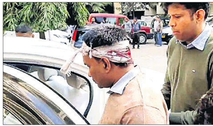
ଆହତ ଇଡି ଅଫିସରଙ୍କୁ ହସ୍ପିଟାଲ ନିଆଯାଇଛି।