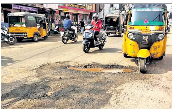
ପାଣି ପାଇପ ଫାଟି ରାସ୍ତା ମଝିରେ ବୁଣ୍ଡି ହୋଇଥିବା ଖାଲ।

ବାଲପାସ ରାସ୍ତା ମଧ୍ୟଭାଗରେ। ଦୀର୍ଘଦିନ ହେବ ପାଣି ପାଇପ ଫାଟି ରାସ୍ତାରେ ପିଇବା ପାଣି ଭାସିବା ସହ ଉଚ୍ଚ ଗ୍ଲାନରେ ଏକ ବଡ଼ ଖାଲ ବୁଣ୍ଡି ହୋଇଛି।