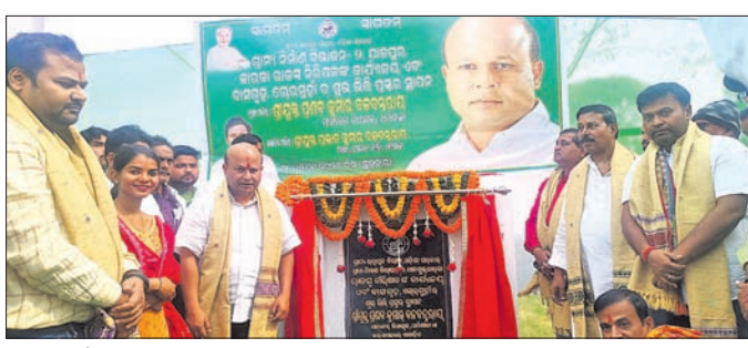
ଗୋରୁହାଁ ରାଜ୍ୟ ନିରାକ୍ଷରକ କାର୍ଯ୍ୟକ୍ରମର ଶିଳାନ୍ୟାସ କରାଯାଇଛି।

ଧର୍ମଶାଳା ନିର୍ବାଚନମଣ୍ଡଳରେ ଶୁକ୍ରବାର ୬ ପ୍ରକଳ୍ପର ଶିଳାନ୍ୟାସ କରାଯାଇଛି। ଏଥିରେ ୬ ରାସ୍ତା ଓ ଗୋଟିଏ ରାଜ୍ୟ ନିରାକ୍ଷର କାର୍ଯ୍ୟକ୍ରମ ରହିଛି।