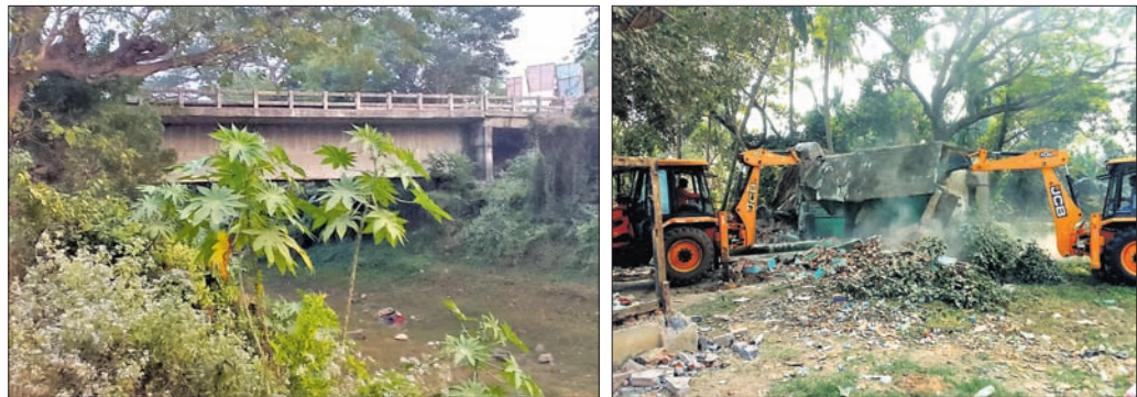
ଦାନପୁର ସେତୁର ସଂଯୋଗୀକରଣ ରାସ୍ତା ହୋଇନାହିଁ।

ସେତୁ ସହ ନିର୍ମିତ ହୋଇଥିଲା। ହେଲେ କେନାଲ ସେତୁକୁ ସଂଯୋଗୀକରଣ ରାସ୍ତା ଉପସ୍ଥଳରେ ଏହି ଅବରୋଧ ହଟାଯାଇଛି।