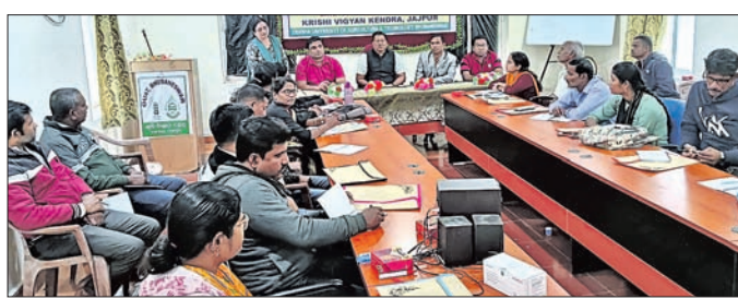
ଚାଳିମ ଶିବିରରେ ଯୋଗଦେଇଥିବା ଅଧିକାରୀ ଏବଂ ଅନ୍ୟମାନେ।

ଚଞ୍ଚିଖୋଲ/ରଘୁପୁର, ୫୧୧ (ପ୍ରଦୀପ କୁମାର ପୃଷ୍ଟି/ରଞ୍ଜିତ ରାଉତ)