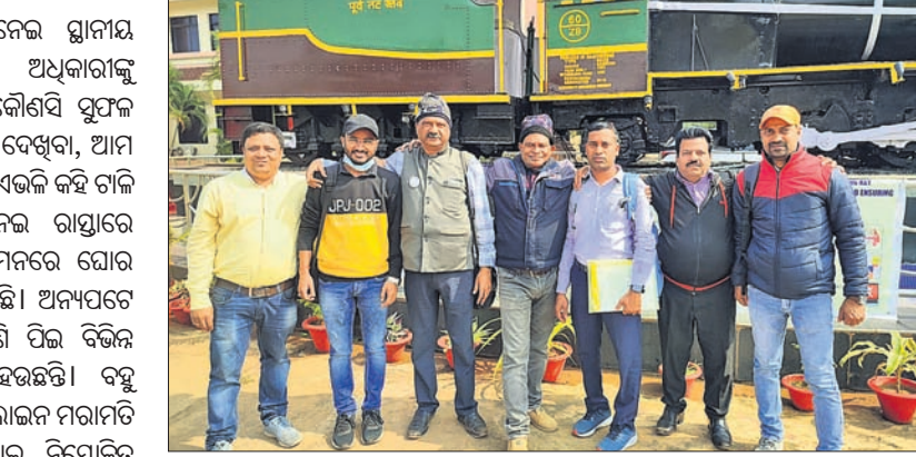
ଦାବିପତ୍ର ଦେବାକୁ ଆସିଥିବା ରେଳଯାତ୍ରୀ ସଂଘର ସଦସ୍ୟମାନେ।

ଦେଖିବାକୁ ମିଳୁଛି। ଏନେଇ ଗ୍ଲାନୀୟ ବ୍ୟବସାୟୀ ବିଭାଗର ଅଧିକାରୀଙ୍କୁ ଅବଗତ କଲେ ସୁଦ୍ଧା କୌଣସି ସୁଫଳ ମିଳୁନାହିଁ। ବାବୁ ଜଣକ ହେଉଥିବା, ଆମ ପାଖରେ ଲୋକ ନାହାନ୍ତି ଏଭଳି କହି ଚାଲି ଦେଉଛନ୍ତି, ଯାହାକୁ ନେଇ ରାସ୍ତାରେ ଯାଉଥିବା ଲକ୍ଷମାନଙ୍କ ମନରେ ଘୋର ଅସନ୍ତୋଷ ପ୍ରକାଶ ପାଉଛି।