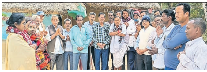
ବୈଠକରେ ଉପସ୍ଥିତ କଳାକାର ଓ ଅନ୍ୟମାନେ।

ରାଜନଗର ରୁକ୍ମିଣୀ ସଂସ୍କୃତି ସଂଘର ଏକ ଗୁରୁତ୍ୱପୂର୍ଣ୍ଣ ପ୍ରସ୍ତୁତି ବୈଠକ ଉପସ୍ଥିତ ଅରକ୍ଷିତ ଦାସ ମଠ ପ୍ରାଙ୍ଗଣରେ ଅନୁଷ୍ଠିତ ହୋଇଯାଇଛି।