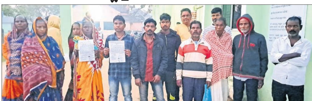
ଥାନାରେ ଏତଲା ଦେବାକୁ ଆସିଥିବା ନବେନ୍ଦ୍ରପୁର ଗ୍ରାମବାସୀ।

ଆଜି, ୫୧୧ (ବନମାଳୀ ସେନାପତି) ଆଜି ଥାନା ଅଞ୍ଚଳରେ ଚୋରାମଦ ବ୍ୟବସାୟ ଦିନକୁଦିନ ବୃଦ୍ଧି ପାଇଥିବା ବେଳେ ଗାଁ ଗହଳରେ ଛତୁ ଚାଲି ଏହି ବ୍ୟବସାୟ ବୃଦ୍ଧି ପାଇଛି।