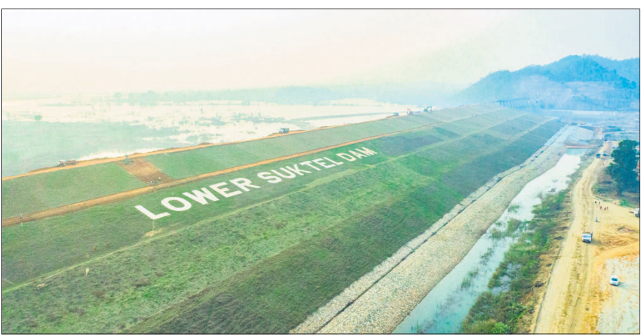
ବଲାଙ୍ଗୀର ଜିଲ୍ଲା ମାଗୁରବେତାସ୍ଥିତ ଲୋୟର ସୁକ୍ତେଲ୍ ବୃହତ୍ କଳସେଚନ ପ୍ରକଳ୍ପ।

ପ୍ରାୟ ୨୩ ବର୍ଷ ପୂର୍ବରୁ ଶିଳାନ୍ୟାସ ହୋଇଥିବା ବଲାଙ୍ଗୀର ଜିଲ୍ଲାର ବହୁପ୍ରତୀକ୍ଷିତ ଲୋୟର ସୁକ୍ତେଲ୍ କଳସେଚନ ପ୍ରକଳ୍ପ ଛୁପିବାର ଉଦ୍ଦ୍ୟୋଗିତ ହୋଇଯାଇଛି। ଦୀର୍ଘବର୍ଷ ଭିତରେ ପ୍ରାୟତଃ ସବୁଦିନେ ସରକାରୀ ପ୍ରକଳ୍ପ କୁହାଯାଉଥିଲା ଯେ, ଲୋୟର ସୁକ୍ତେଲ୍ ତ୍ୟାମ୍ବର ଉତ୍ପାଦନା ୩୦ ନିଟର ହେବ। ମାତ୍ର ଛୁପିବାର ପ୍ରକଳ୍ପ ଉଦ୍ଦ୍ୟୋଗିତ ବେଳେ କୁହାଯାଇଛି ଯେ, ତ୍ୟାମ୍ବ ଉତ୍ପାଦନା ୩୧ ନିଟର। ୩୦ ନିଟର ତ୍ୟାମ୍ବ ଉତ୍ପାଦନେ ଜିଲ୍ଲାର ପ୍ରଭାବିତ ୨୯ଟି ଗାଁରୁ ୧୫ଟି ସମ୍ପୂର୍ଣ୍ଣ, ୧୪ଟି ଆଂଶିକ ଭାବେ ବୁଝିବ ଏବଂ ଏଥିଯୋଗୁ ୫୮୩ ହେକ୍ଟର ଜଙ୍ଗଲ ଜମି, ୩୯୩୭.୮ ହେକ୍ଟର ଭିତ୍ତି ଏବଂ ୭୮୬ ଏକର ସରକାରୀ ଜମି ପ୍ରଭାବିତ ହେବ ବୋଲି କୁହାଯାଉଥିଲା। ଏବେ ତ୍ୟାମ୍ବ ଉତ୍ପାଦନା ୩୧ ନିଟର କୁହାଯାଉଥିବାରୁ ଏହାର ପ୍ରଭାବ କ'ଣ ରହିବ।