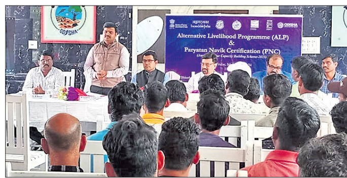
ପ୍ରଶିକ୍ଷଣ ଶିବିରରେ ପକ୍ଷୀ ଗଣନାକାରୀଙ୍କୁ ପ୍ରଶିକ୍ଷଣ ଦିଆଯାଇଛି।

ରାଜନଗର ଅନ୍ୟତମ ପକ୍ଷୀବିହାର ରୂପେ ପରିଚିତ ଭିତରକନିକା ଜାତୀୟ ଉଦ୍ୟାନ ଏବଂ ଏଥିରେ ଥିବା ଆର୍ଦ୍ରଭୂମିରେ ଏବେ ବିଦେଶାଗତ ପକ୍ଷୀଙ୍କ ସମାଗମ ହୋଇଛି।