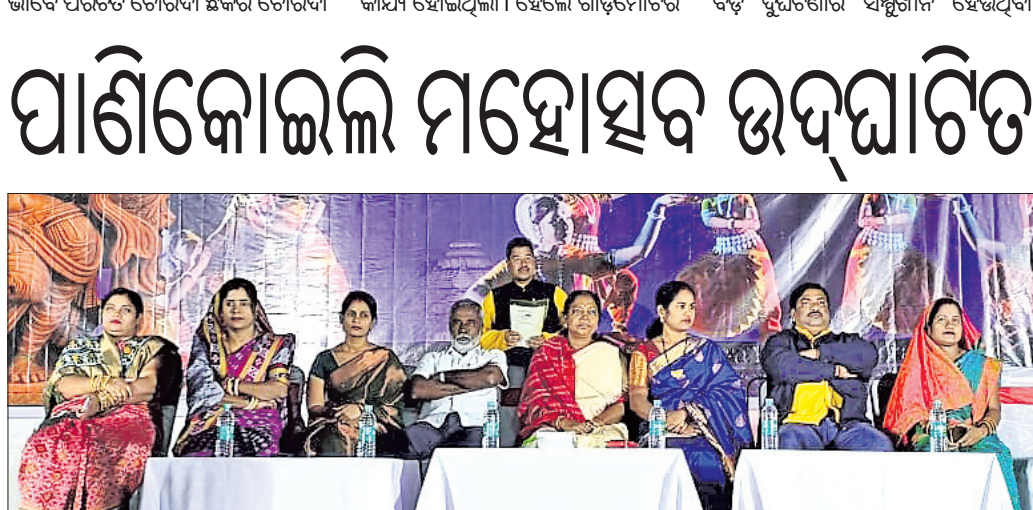
ମହୋତ୍ସବ ଉଦ୍‌ଘାଟନା ଉତ୍ସବରେ ମହାଧିକାରୀ ଅତିଥି।