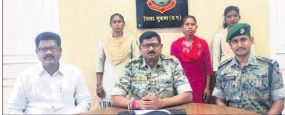
ଆତ୍ମସମର୍ପଣ କରିଥିବା ପାରୋକ୍ଷ