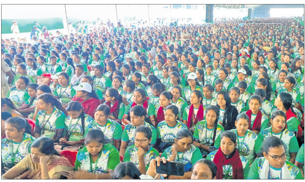
କଟକ ବାଲିଯାତ୍ରା ତଳପଡ଼ିଆରେ ଅନୁଷ୍ଠିତ ଜିଲାପ୍ରସାରୀ ନୂଆ-୩ କାର୍ଯ୍ୟକ୍ରମରେ ୫-ଟି ତଥା ନବୀନ ଓଡ଼ିଶା ଅଧ୍ୟକ୍ଷ କାର୍ତ୍ତିକ ପାଣିଆନ ଛାତ୍ରୀଛାତ୍ରୀଙ୍କ ସହ ଭାବବିନିମୟ କରୁଛନ୍ତି। କାର୍ଯ୍ୟକ୍ରମରେ ଉପସ୍ଥିତ ଛାତ୍ରୀଛାତ୍ରୀ।