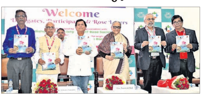
ଅତିଥିମାନେ 'ରୋସ୍ ସୋଭେନ୍ୟୁ'ରୁ ଭୁବନେଶ୍ୱରକୁ କରୁଛନ୍ତି।

ସର୍ବଭାରତୀୟ ଗୋଲାପ ପ୍ରଦର୍ଶନୀ, ସମ୍ମିଳନୀ ଉଦ୍‌ଘାଟିତ ୪ ନୂଆ ପ୍ରଜାତି ଜଗନ୍ନାଥ, ଲିଙ୍ଗରାଜ, ଶେଫାଳୀ ଓ ରାଧା ଗୋଲାପ ଲୋକାର୍ପିତ