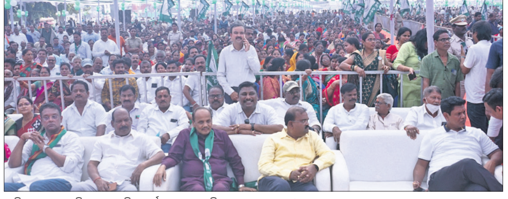
ବାଲିଯାତ୍ରା ଉପରପଡ଼ିଆରେ ଅନୁଷ୍ଠିତ କାର୍ଯ୍ୟକ୍ରମରେ ଉପସ୍ଥିତ ଦଳାୟ ନେତୃବୃନ୍ଦ ଓ ଅନ୍ୟମାନେ।