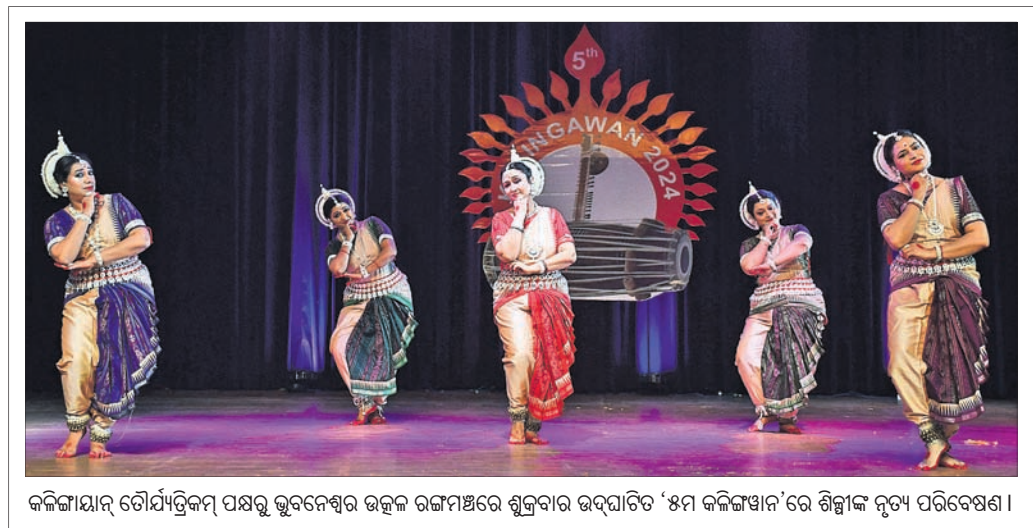
କଳିଙ୍ଗାୟାତ୍ର ଚୌର୍ଯ୍ୟତ୍ରିକମ୍ ପକ୍ଷରୁ ଭୁବନେଶ୍ୱର ଉତ୍କଳ ରଙ୍ଗମଞ୍ଚରେ ଶୁକ୍ରବାର ଉଦ୍‌ଘାଟିତ '୫ମ କଳିଙ୍ଗାଧାନ'ରେ ଶିଳ୍ପୀଙ୍କ ନୃତ୍ୟ ପରିବେଷଣ।