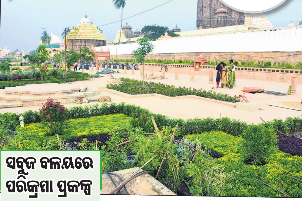
ସବୁଜ ବଳୟରେ ପରିକ୍ରମା ପ୍ରକଳ୍ପ