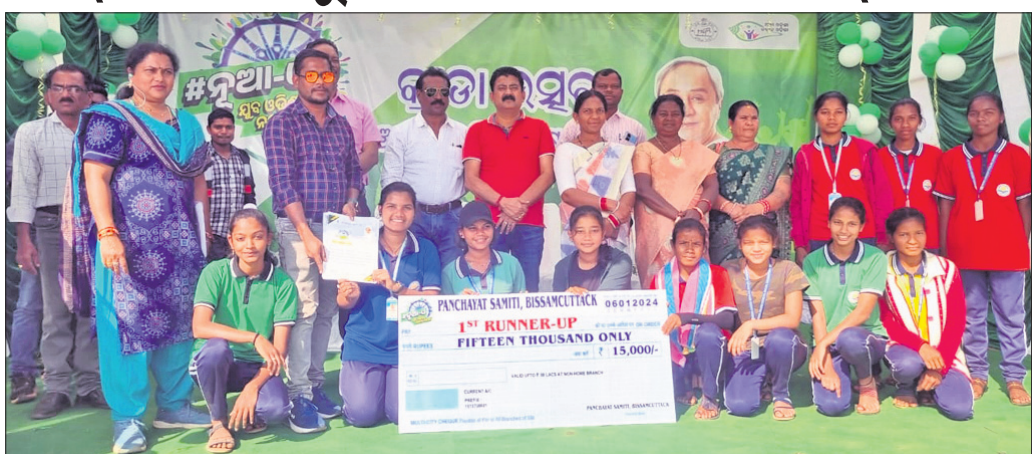
ଅତିଥିଙ୍କ ଗହଣରେ ବିଜୟା ଦଳର ଖେଳାଳିମାନେ ।

ରାୟଗଡ଼ା ଜିଲ୍ଲା ବିଷମକଳକ ମା' ମାଳିନୀ ମହାବିଦ୍ୟାଳୟ ପରିସରରେ ଶନି ଧରି ଚାଳିଥିବା ନୂଆ-ଓ କ୍ରୀଡ଼ା କାର୍ଯ୍ୟକ୍ରମ ଉଦ୍‌ଯାପିତ ହୋଇଯାଇଛି ।