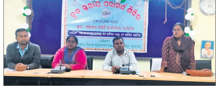
ଶିବିରରେ ମହାଧ୍ୟାୟ ଅତିଥିମାନେ ।