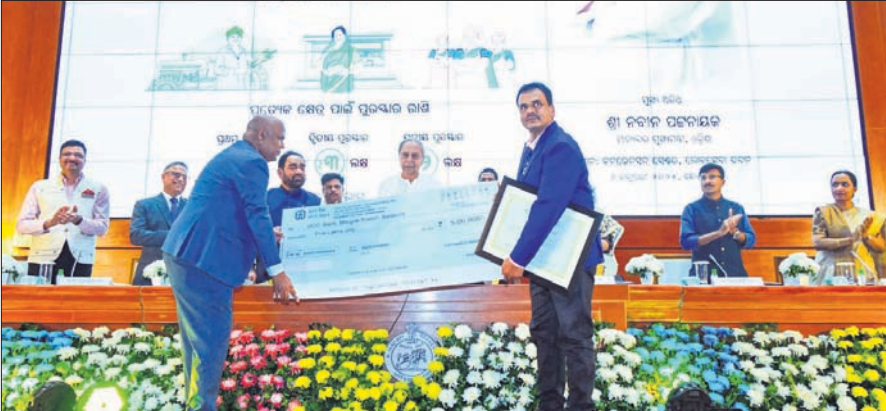
ଭୁବନେଶ୍ୱର, ୬।୧ (ଅନିଲ ଦାସ) ଦୃଢ଼ ଅର୍ଥନୀତି ପାଇଁ କୃଷି, ଅଣୁ, ସ୍ୱଚ୍ଛ ଓ ମଧ୍ୟ ଉଦ୍ୟୋଗ (ଏମ୍‌ଏସ୍‌ଏମ୍) ଏବଂ ମିଶନ ଶକ୍ତି ଗୋଷ୍ଠୀକୁ ରଣ ପ୍ରଦାନ କରିବା ଆବଶ୍ୟକ। ଏହି ଚିନ୍ତାଧାରା ଅତ୍ୟନ୍ତ ଗୁରୁତ୍ୱପୂର୍ଣ୍ଣ କ୍ଷେତ୍ରକୁ ରାଜ୍ୟ ସରକାର ସର୍ବୋଚ୍ଚ ପ୍ରାଥମିକତା ଦେଇ ଆସିଛନ୍ତି। ଏଥିପାଇଁ ପ୍ରତ୍ୟେକ ବର୍ଷ ବଜେଟ୍‌ରୁ ମଧ୍ୟ ବୃଦ୍ଧି କରାଯାଇଛି।

ଭୁବନେଶ୍ୱର, ୬।୧ (ଅସମାପିତା ସାହୁ) ସର୍ବସାଧାରଣ ନିମନ୍ତେ ରବିବାରଠାରେ ଲୋକସେବା ଭବନ ଉଦ୍ୟାନ ଖୋଲାହେବ। ଜାତୀୟ ନାୟକ ପ୍ରତି ରବିବାର ଓ କୁଚ୍ଚି ଦିବସରେ ଏହା ଖୋଲା ରହିବ। ଜନସାଧାରଣ ଏହି ଦିନକୁ ଉପଯୋଗୀ କରିବା ପାଇଁ ଲୋକସେବା ଭବନରେ ଉଦ୍ୟାନ ଖୋଲାହେବ। ଜାତୀୟ ନାୟକ ପ୍ରତି ରବିବାର ଓ କୁଚ୍ଚି ଦିବସରେ ଏହା ଖୋଲା ରହିବ। ଜନସାଧାରଣ ଏହି ଦିନକୁ ଉପଯୋଗୀ କରିବା ପାଇଁ ଲୋକସେବା ଭବନରେ ଉଦ୍ୟାନ ଖୋଲାହେବ।