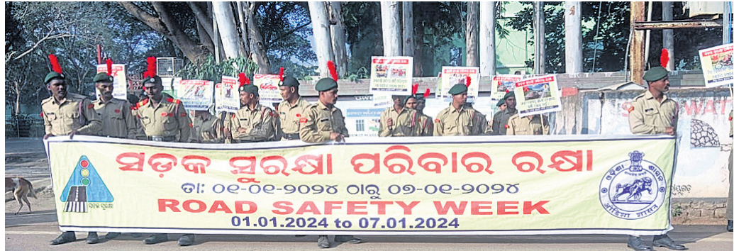
ବାହାରିଥିବା ସଚେତନା ଅଭିଯାନ ।

ଏକ ତଥ୍ୟ ଅନୁସନ୍ଧାନକାର କାରୀ କମିଟି ଯାଇଥିଲା । ଏହି କମିଟି ଚନ୍ଦ୍ରପୁର ଗ୍ରାମପଞ୍ଚାୟତ ସରକାରୀ ଅଧିକାରୀ ଓ ବେସରକାରୀ ସଂଗଠନ ସହିତ ଏ ସମ୍ପର୍କରେ ଆଲୋଚନା କରି ପ୍ରକୃତ ଦୋଷୀକୁ ଚଢ଼ି ପରିସର ଭୁଲ୍ କରିବା ପାଇଁ ସଂଗଠନ ପକ୍ଷରୁ ଦାବି କରାଯାଇଥିଲା ।