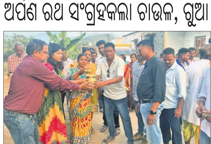
ବିତି ଗୁଆ ଓ ଗାଉଳ ସଂଗ୍ରହ କଳ୍ପ ସଧି ଧରିଛନ୍ତି ।

ପହଞ୍ଚି ସତ୍ୟାଜିତ ଗିରଫ କରିବା ସହ ଚାଙ୍ଗିଆକୁ ଜବତ କରିଛନ୍ତି ।