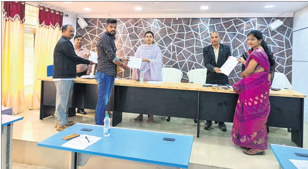
ବିଜେଡି, ଭାଜପା ଓ କଂଗ୍ରେସ ପ୍ରତିନିଧାନମାନେ ଭୋଟର ତାଲିକା ଗ୍ରହଣ କରୁଛନ୍ତି ।

ଭୋଟର ତାଲିକା ସଂଶୋଧନ ଏବଂ ନୂତନ ପଞ୍ଚାୟତଗଣ ପରେ ଶୁକ୍ରବାର ଭୋଟର ତାଲିକା ପ୍ରକାଶ ପାଇଛି ।