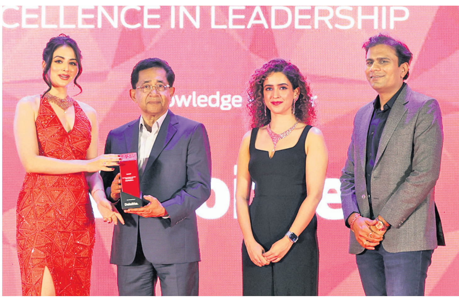
କନ୍ୟାଶ୍ରମକୁ ବିଦ୍ୟାଳୟ ନିକଟରେ 'ବର୍ଷର ଶ୍ରେଷ୍ଠ ବିଜ୍ଞାନ-ସାହିତ୍ୟାଳ ନିର୍ଦ୍ଦେଶ' ପାଇଁ ଏମ୍.ସି. ଆଣ୍ଡ ପୁରସ୍କାର-୨୦୨୪ ଏବଂ ନ୍ୟାଶନାଲ ଡିଜିଟାଲ ଟେକ୍ ଅଫ ଦି ଇନ୍ଦର ପୁରସ୍କାର ପ୍ରଦାନ କରାଯାଇଛି ।