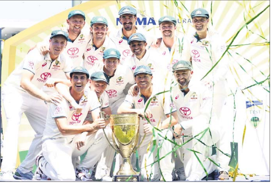
ଚୁପ୍ ସହ ଅଷ୍ଟ୍ରେଲିଆ ଦଳ।