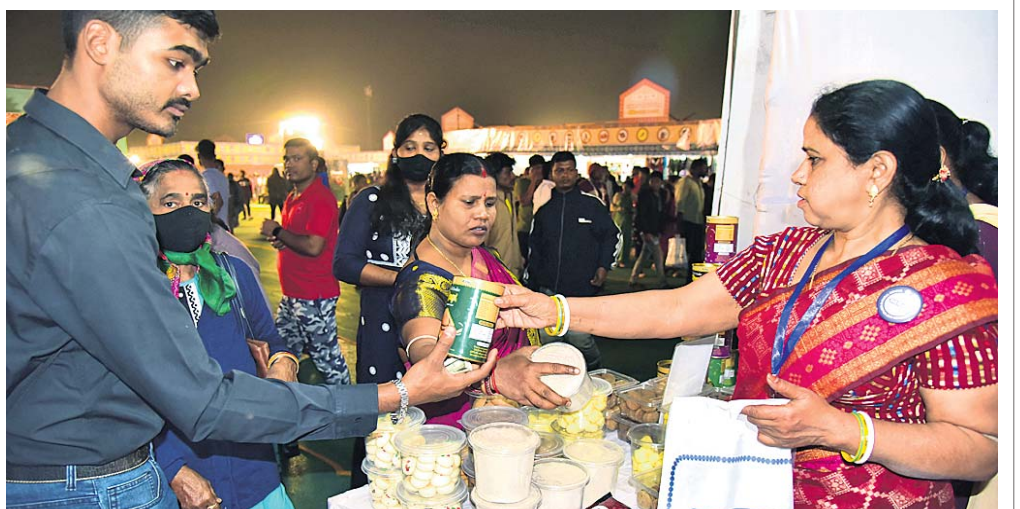
ଭୁବନେଶ୍ୱର ବରମୁଖା ଖେଳ ପଡିଆରେ ଚାଲିଥିବା ଶିଶିର ସରସ ମେଳାର ଏକ ସ୍ଥଳରେ ସୁନ୍ଦରଗଡ଼ ଜିଲ୍ଲା ବିଜ୍ଞା ବୁକ୍ ଅଭିଭାବକ ଓଡିଶାପାଠକ ବିଦ୍ୟାଳୟର ସମ୍ପର୍କରେ ପକ୍ଷରୁ ମିଳିତ ଖାଦ୍ୟ ସାମଗ୍ରୀ ବିକ୍ର କରାଯାଇଛି ।