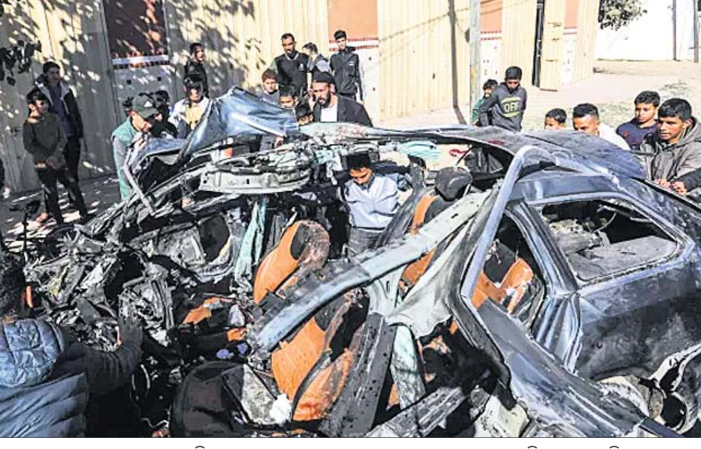
ରାଫାହ ସହରରେ ରବିବାର ଏକ କାର୍ ଉପରେ ଏୟାରସ୍ତ୍ରୋତ୍ତରରେ ୨ ଖବରଦାତା ନିହତ ହୋଇଛନ୍ତି।

ଗାଜାସ୍ଥିତ ହମାସ୍ ଆତଙ୍କବାଦୀଙ୍କ ବିରୋଧରେ ଇସ୍ରାଏଲ୍ ଆକ୍ରମଣ ରବିବାର ଚତୁର୍ଥ ମାସରେ ପ୍ରବେଶ କରିଛି। ଗତ ୩ ମାସର ଆକ୍ରମଣରେ ଗାଜାର ପାଖାପାଖି ୨୩ ହଜାର ଲୋକଙ୍କ ମୃତ୍ୟୁ ଘଟିଥିବାବେଳେ ୫୮ ହଜାର ଆହତ ହୋଇଛନ୍ତି। ବ୍ୟାପକ ଅଞ୍ଚଳ ଧ୍ୱଂସପୂର୍ଣ୍ଣ ପରିଣତ ହୋଇଛି। ୮୫ ପ୍ରତିଶତରୁ ଊର୍ଦ୍ଧ୍ୱ ଲୋକ ଘରବାର ଛାଡ଼ି ପଳାଇଗଲେଣି। ଇତିମଧ୍ୟରେ ହମାସ୍ ସାମରିକ ଭିତ୍ତିକୁ ନିର୍ମୂଳ୍ୟ ଧ୍ୱଂସ ହୋଇଯାଇଥିବାବେଳେ ଉତ୍ତର ଗାଜାରେ ବହୁ ଆକ୍ରମଣ ବନ୍ଦ କରିବାକୁ ଇସ୍ରାଏଲ୍ ସେନା ସଙ୍କେତ ଦେଇଛି। ତେବେ ସେଠାରେ ମୁତୟନ ଥିବା ସୈନ୍ୟଙ୍କୁ ହ୍ରାସ କରାଯାଇ ନାହିଁ। ଇସ୍ରାଏଲ୍ ସୈନ୍ୟ ସଫଳତା ହାସଲ କରି ରଖିବେ। ଇସ୍ରାଏଲ୍-ଗାଜା ସୀମାରେ ପ୍ରତିରକ୍ଷା ବ୍ୟବସ୍ଥାକୁ ଅଧିକ ଦୃଢ଼ କରିବା ସହ କେନ୍ଦ୍ରୀୟ ଓ ଦକ୍ଷିଣ ଭାଗ ଉପରେ ଅଧିକ ଫୋକସ୍ କରାଯିବ ବୋଲି ଇସ୍ରାଏଲ୍ ସେନା ସଫଳତା ହାସଲ କରି ରଖିବେ।