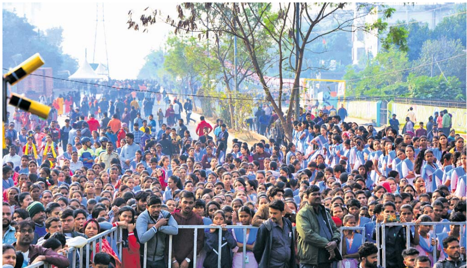
ଇନ୍‌ଫୋସିଭ୍ ଛକରୁ ଶିଖରଚଣ୍ଡୀ ପାହାଡ଼ ପର୍ଯ୍ୟନ୍ତ ରାସ୍ତାରେ ରବିବାର ଆୟୋଜିତ ଦ୍ୱିତୀୟ ପଥ ଉତ୍ସବରେ ବିଭିନ୍ନ ବେଶରେ ସଚେତନ କରୁଥିବା ଛାତ୍ରାଛାତ୍ରୀ ଓ ଅନ୍ୟମାନଙ୍କ ସହ ଅତିଥି ଏବଂ ଉପସ୍ଥିତ ସହରବାସୀ ।