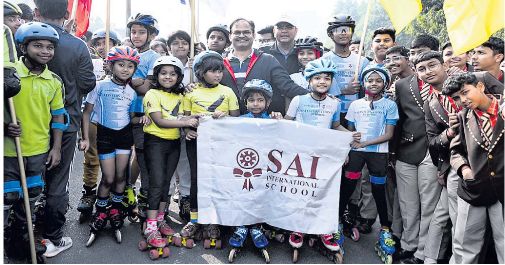
ସାଇ ଇଣ୍ଟରନ୍ୟାଶନାଲ ସ୍କୁଲର ଛାତ୍ରାଛାତ୍ରୀ ଓ ଷ୍ଟେଟ୍ ଟିମ୍ ।