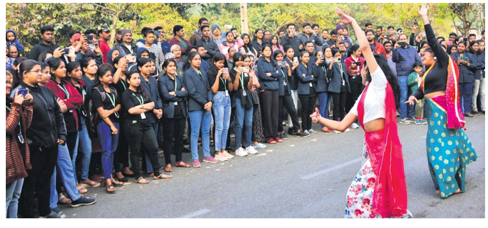
ପଥ ଉତ୍ସବରେ ବୁଲ ଯୁବତୀ ନୃତ୍ୟ ପରିବେଷଣ କରୁଛନ୍ତି ।