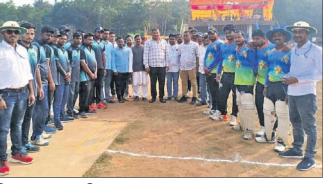
ଅତିଥିକ ଗହଣରେ ଖେଳାଳିମାନେ ।