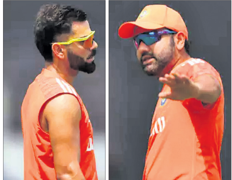
ବିରାଟ କୋହଲି ଓ ରୋହିତ ଶର୍ମା।