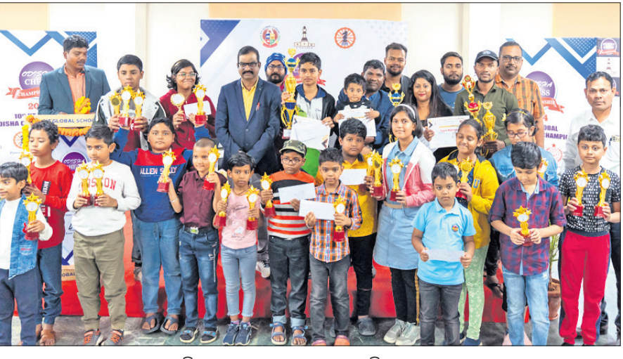
କୃତୀ ପ୍ରତିଯୋଗୀମାନେ ପୁରସ୍କାର ସହ ଅତିଥିଙ୍କ ଗହଣରେ।