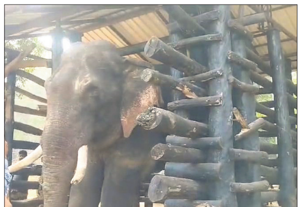
ପ୍ରାଣ ହରାଇବା ପୂର୍ବରୁ କପିଳାସ ହାତୀ ଉଦ୍ୟାନ କେନ୍ଦ୍ର କ୍ରମ୍ଭ ଭିତରେ ଥିବା ବୌଦ୍ଧ ଦରାହାତୀ ।

ଡେଙ୍ଗାନାଳ, ୨୧ (ରଚନା ନାୟକ) ■ ଅତ୍ୟଧିକ ନିଶ୍ଚେତକ ଦିଆଯାଇଥିବା ସନ୍ଦେହ ■ ହୃଦ୍‌ଘାତରେ ମୃତ୍ୟୁ ହୋଇଥିବା କହୁଛି ବନ ବିଭାଗ ଦିଆଯାଇ ଏକ ହାଇକ୍ସା ଯୋଗେ କପିଳାସ ଅଭିଯୁକ୍ତ ଅଣାଯାଇଥିଲା । ବାଟରେ ହାତୀଟି ଗାଡ଼ିରୁ ଗୋଡ଼ କାଢ଼ି ଦେଇଥିବାରୁ ବନ କର୍ମଚାରୀମାନଙ୍କୁ ନାକେଦମ ହେବାକୁ ପଡ଼ିଥିଲା । ଶନିବାର ସକାଳେ କପିଳାସରେ ପହଞ୍ଚିଥିବା ଏହି ୪୦ ବର୍ଷୀୟ ହାତୀ ୨୪ ଘଣ୍ଟା ନ ପୁରୁଣୁ ରବିବାର ଭୋର ୪ଟାରେ ଆଖୁ ବୁଜିଦେବା ବନ୍ୟପ୍ରାଣୀପ୍ରୋମାକୁ ଆଖିମୁଁ କରିଛି । ହୃଦ୍‌ଘାତରେ ହାତୀଟି ମୃତ୍ୟୁ ହୋଇଥିବା ବନ ବିଭାଗ ପକ୍ଷରୁ ପ୍ରାଥମିକ ଭାବେ କୁହାଯାଇଥିଲେ ହେଁ ଅତ୍ୟଧିକ ନିଶ୍ଚେତକ ଦିଆଯିବା ମୃତ୍ୟୁର କାରଣ ବୋଲି ବନ୍ୟପ୍ରାଣୀ ପ୍ରୋମାମାନେ ସନ୍ଦେହ ବ୍ୟକ୍ତ କରିଛନ୍ତି । ପ୍ରକାଶ ଯେ, ବୌଦ୍ଧ ଜିଲାର ବିଜିଲ ଅଞ୍ଚଳରେ ଦୀର୍ଘଦିନ ହେଲା ଏକ ଦରାହାତୀ ଆତଙ୍କ ସୃଷ୍ଟି କରିଥିଲା । ତେଣୁ ରାଜ୍ୟ ବନ ବିଭାଗ ଉଚ୍ଚ କର୍ତ୍ତୃପକ୍ଷଙ୍କ ନିଷ୍ପତ୍ତିକ୍ରମେ ଉକ୍ତ ହାତୀକୁ ଡେଙ୍ଗାନାଳ ଜିଲାର କପିଳାସସ୍ଥିତ ପ୍ରାଣୀ ଉଦ୍ୟାନ ପରିସରରେ ଥିବା ହାତୀ ଉଦ୍ୟାନ କେନ୍ଦ୍ରକୁ ଅଣାଯାଇଥିଲା । ଏଠାରେ ହାତୀଟିର ବ୍ୟବହାରରେ ପରିବର୍ତ୍ତନ କରାଯିବା ଦିଗରେ ଉଦ୍ୟମ କରାଯାଇଥାନ୍ତା । ଶୁକ୍ରବାର ସନ୍ଧ୍ୟା ୬ଟାରେ ଉକ୍ତ ହାତୀକୁ ନିଶ୍ଚେତକ