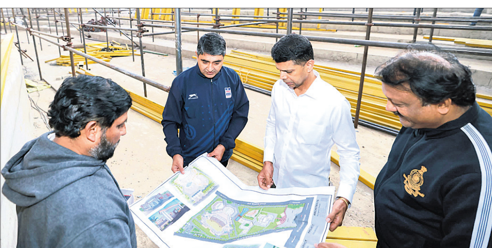
ଭୁବନେଶ୍ୱର, ୭୧ (ସୁନିତ ମିଶ୍ର)