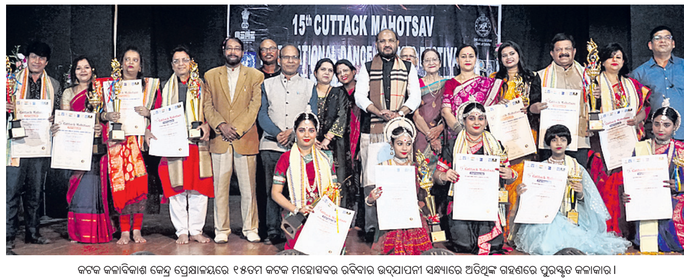
କଟକ କଳାବିକାଶ କେନ୍ଦ୍ର ପ୍ରୋକ୍ସାକ୍ଷରେ ୧୫ତମ କଟକ ମହୋତ୍ସବର ରବିବାର ଉଦ୍‌ଯାପନା ସନ୍ଧ୍ୟାରେ ଅତିଥିକ ଗହଣରେ ପୁରସ୍କୃତ କଳାକାର ।