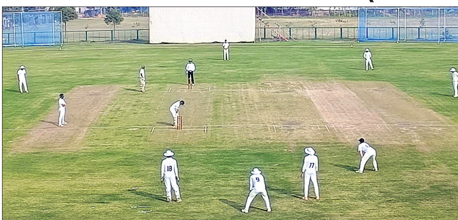
ଓଡ଼ିଶା ଏବଂ ସୌରାଷ୍ଟ୍ର ମଧ୍ୟରେ ଅନୁଷ୍ଠିତ ମ୍ୟାଚ୍।

ଓଡ଼ିଶା ରାଜ୍ୟ ଟେମ୍ ଟ୍ରେଜି-୧ ଶୀର୍ଷରେ ଅଲ୍‌ଆଉଟ୍ ହୋଇଛି, ୭।୧ (ପି.ଟି.): ଆଜକିନିକ ମୋଟର ସ୍କୋର୍ସ ଇଭେଣ୍ଟ ଓଡ଼ିଶା ରାଜ୍ୟ ଟେମ୍ ଟ୍ରେଜି-୧ ଶୀର୍ଷରେ ଅଲ୍‌ଆଉଟ୍ ହୋଇଛି। ୧୯୩୬ରୁ ଟିମ୍‌ର ଆରମ୍ଭ ଉପାହାସନ କରିଛି। ଏହାର ରାଜ୍ୟର ରମ୍ ଟ୍ରେଜି ପ୍ରଥମ ଘାତ ଅଧିକାର କରିଛନ୍ତି। ୩୩୩୩ ହିରୋ ରାଜ୍ୟର ଫିନିଶ୍ ଲାଇନ୍ ଅତିକ୍ରମ କରିବାରେ ସଫଳ ହୋଇଛନ୍ତି। ବାଲ୍‌ କାଟେଗୋରୀରେ ଭାର ନେଇଥିବା ୧୩୬୩୩ ପ୍ରତିଯୋଗୀଙ୍କ ମଧ୍ୟରେ ଟ୍ରେଜି ପ୍ରଥମ ଘାତ ଅଧିକାର କରିଛନ୍ତି। ଟ୍ରେଜି-୧ରେ ଟ୍ରେଜି ୧୨ ମିନିଟ୍ ଫାଇନା ମିଳିଛି। ହିରୋ ଦଳର କୋହିନ ରୋହିତୁଏକ ଦୁର୍ଗତଗାର ସମ୍ମୁଖୀନ ହୋଇ ଚେତାଶୁନ୍ୟ ହୋଇ ତଳେ ପଡିଯାଇଥିଲେ। ରାଜ୍ୟ ଟ୍ରେଜି କ୍ଲବ୍ ପ୍ରତିଯୋଗିତାରେ ଭାର ନେଇଥିବା କୋହଲି ବାରେଡା ଓ ସେବାସ୍ଥିଆନ ଦୁହଇର ଶୀଘ୍ର ଦୁର୍ଗତଗା ସ୍ଥଳରେ ପହଞ୍ଚି ସେମାନଙ୍କ ଟିମ୍‌ମେମ୍ବର ଯତ୍ ନେଇଥିଲେ। ରୋହିତୁଏକ ହେଲିକପ୍‌ଟର ଯୋଗେ ହସ୍ତିତାଳ ନିଆଯିବା ପର୍ଯ୍ୟନ୍ତ ସେମାନେ ଅଧିକ ରହିଥିଲେ। ଟ୍ରେଜିକ୍ ସାଥୀ ପ୍ରତିଯୋଗୀ ତୋଷ୍ଟା ଷ୍ଟାରିନା ମଧ୍ୟ ଦୁର୍ଗତଗାର ସମ୍ମୁଖୀନ ହୋଇଥିଲେ।