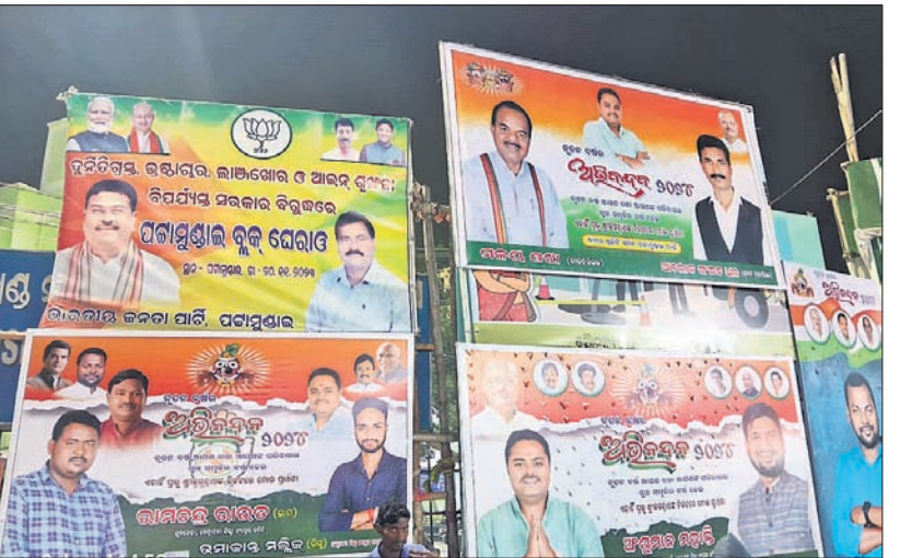
ପଟ୍ଟାମୁଣ୍ଡାଲ ଡାକବଜାର ଛକରେ କଂଗ୍ରେସ, ଭାଜପାର ଲାଗିଥିବା ପୋଷ୍ଟର ।