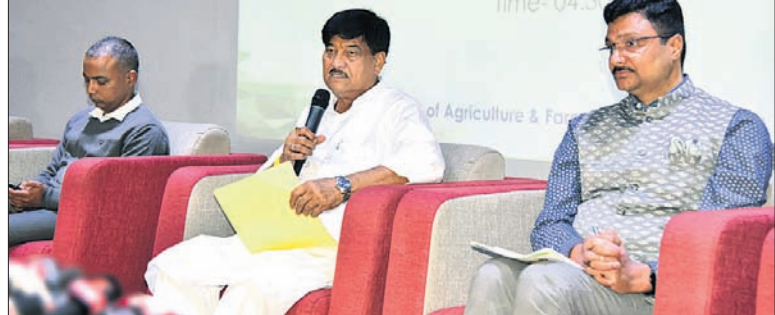
କୃଷି ଭବନଠାରେ ଆୟୋଜିତ ଖବରଦାତା ସମ୍ମିଳନୀରେ ମନ୍ତ୍ରୀ ରଣେନ୍ଦ୍ର ପ୍ରତାପ ସାହୁ ଓ ଅନ୍ୟ ଅଧିକାରୀ।