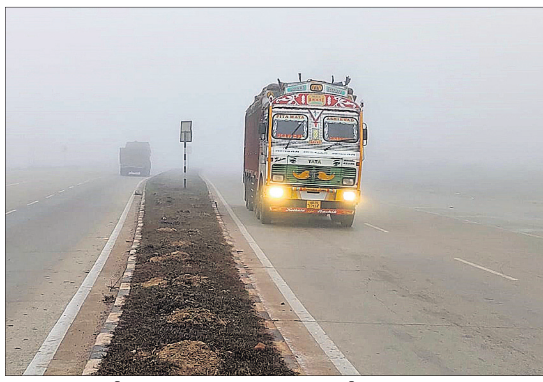
କେନ୍ଦୁଝର ଜିଲ୍ଲା ବେଲ ଯାଇଥିବା ୪୯ ନମ୍ବର ଜାତୀୟ ରାଜପଥ ରୁକୁମ୍ଭା ନିକଟରେ ସକାଳ ୮ଟା ସମୟରେ ଘନ କୁହୁଡ଼ି ଆହୁରିତ ହୋଇ ରହିଛି।