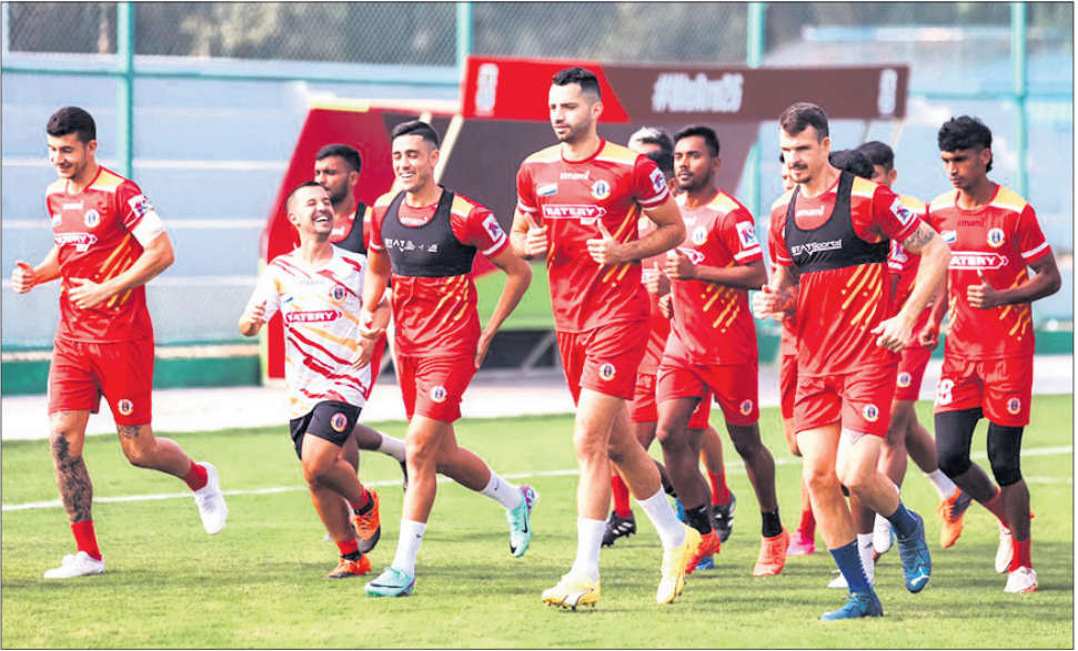
କଳିଙ୍ଗ ଷ୍ଟାଡ଼ିୟମରେ ଯୋମବାର ଇଷ୍ଟ ବେଙ୍ଗାଲ ଦଳର ଅଭିଯାସ।

ଭୁବନେଶ୍ୱର, ୮।୧ (ତପନ ସାହି) କଳିଙ୍ଗ ଷ୍ଟାଡ଼ିୟମରେ ମଙ୍ଗଳବାରଠାରୁ ଆରମ୍ଭ ହେବ ଆଉ ଏକ ମେଗା ପୁଟବଲ ପ୍ରତିଯୋଗିତା କଳିଙ୍ଗ ସୁପର କପ୍। ସୁପର କପ୍ ଏହା ୪ର୍ଥ ସଂସ୍କରଣ। ଏଥର ଓଡ଼ିଶାରେ ପ୍ରତିଯୋଗିତା ହେଉଥିବାରୁ ପ୍ରାୟୋକ୍ତ ଦୃଷ୍ଟିରୁ ଏହାର ନାମ କଳିଙ୍ଗ ସୁପର କପ୍ ରଖା ଯାଇଛି। ଓଡ଼ିଶା ଏପ୍ରିଲ ହେଉଛି ଡିଫେଣ୍ଡିଂ ଚାମ୍ପିୟନ। ଗତବର୍ଷ କୋଓକୋରରେ ଅନୁଷ୍ଠିତ ପ୍ରତିଯୋଗିତାର ଫାଇନାଲରେ ଓଡ଼ିଶା ଏପ୍ରିଲ ପ୍ରତିପକ୍ଷ ବେଙ୍ଗାଲୁରୁ ଏପ୍ରିଲ ପରାସ୍ତ କରିଥିଲା। ପ୍ରତିଯୋଗିତାରେ ମୋଟ ୧୨ଟି ଦଳ ଅଂଶଗ୍ରହଣ କରିବେ। ଏମାନଙ୍କ ମଧ୍ୟରୁ ଇଣ୍ଡିଆନ ସୁପର ଲିଗର ୧୨ ଦଳ ଏବଂ ଆଇ-ଲିଗର ଶ୍ରେଷ୍ଠ ୪ ଦଳ ସାମିଲ। ଆଇ-ଲିଗରୁ ଗୋକୁଳମ୍ କେରଳ ଏପ୍ରିଲ,