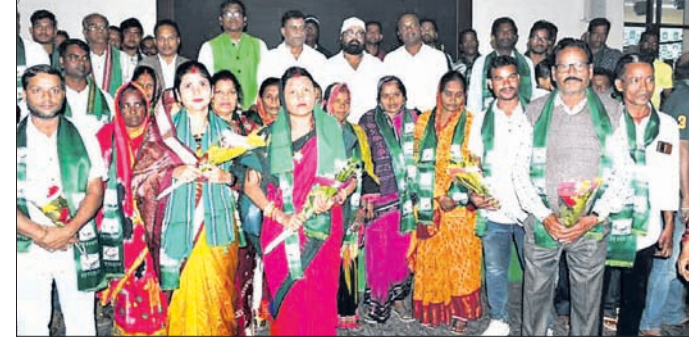
ଶକ୍ତିଭବନଠାରେ ବିଜେଡିରେ ସାମଲ ହେଉଛନ୍ତି ଭାଜପା ନେତା ଓ କର୍ମୀମାନେ ।