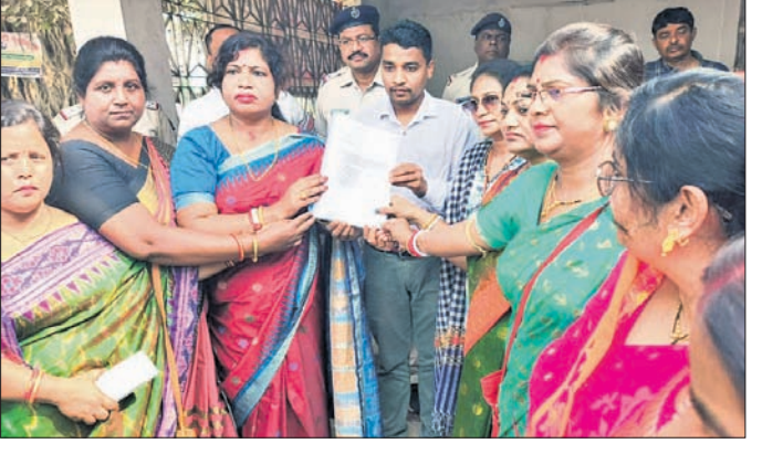
ଅତିରିକ୍ତ ଜିଲାପାଳଙ୍କୁ ଦାବିପତ୍ର ପ୍ରଦାନ କରୁଛନ୍ତି ମହିଳା ପ୍ରତିନିଧି ଦଳ ।