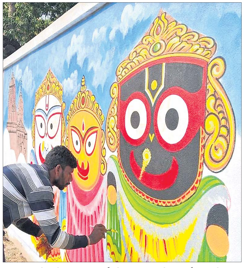
ପୁରୀ ଶ୍ରୀମନ୍ଦିର ପରିକ୍ରମା ପ୍ରକଳ୍ପ ଲୋକାର୍ପଣ ନିମନ୍ତେ ତେଜନାଳ କିଲାରେ ଅର୍ପଣ ରଥ ପରିକ୍ରମା କରୁଥିବା ବେଳେ ସଦର ବୁକ ପାଟେରିରେ ଜଣେ ଚିତ୍ରକର ମହାପ୍ରଭୁ ଶ୍ରୀଜଗନ୍ନାଥ, ଦେବୀ ସୁଭଦ୍ରା ଓ ଶ୍ରୀବଳଭଦ୍ରଙ୍କ ଚିତ୍ର ଆଙ୍କିବାରେ ବ୍ୟସ୍ତ।