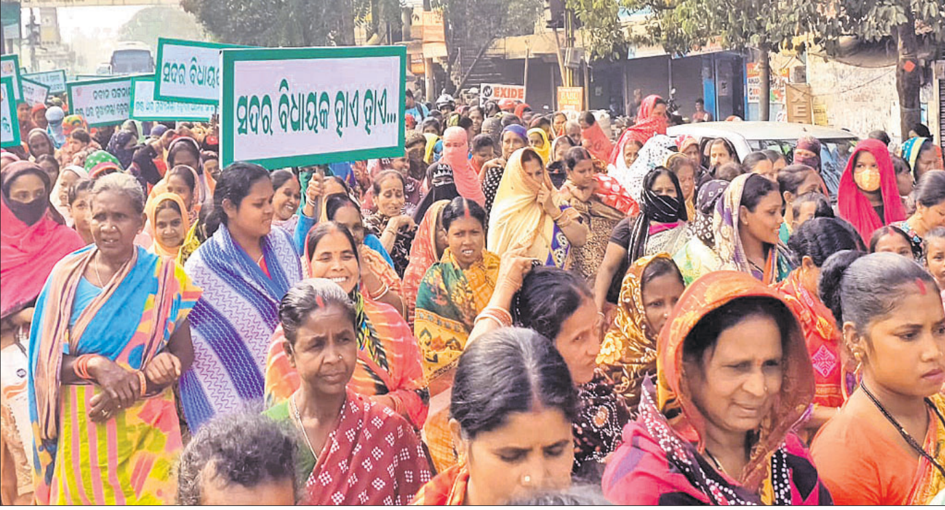
ବିଧାୟକ ଓ ତାଙ୍କ ସମର୍ଥକଙ୍କ ବିରୋଧରେ ମହିଳାମାନେ ମଙ୍ଗଳବାର ଏକ ଶୋଭାଯାତ୍ରାରେ ଜିଲାପାଳଙ୍କ ଅଫିସ୍ ଆଡ଼କୁ ଯାଉଛନ୍ତି।